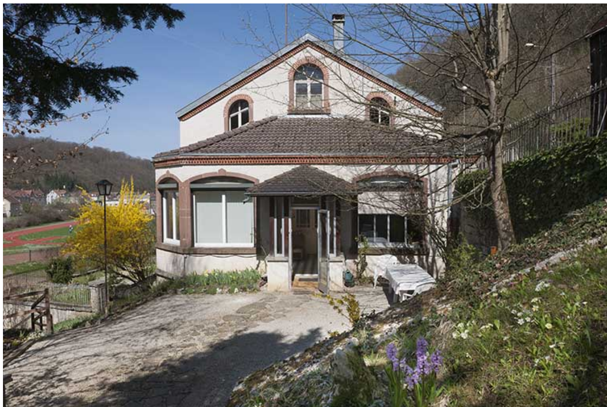
Pignon sud. Entrée.