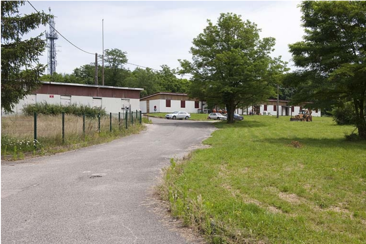
Logements N et L vus depuis l'ouest.

25, Sochaux, lieudit : le fort de la Chaux