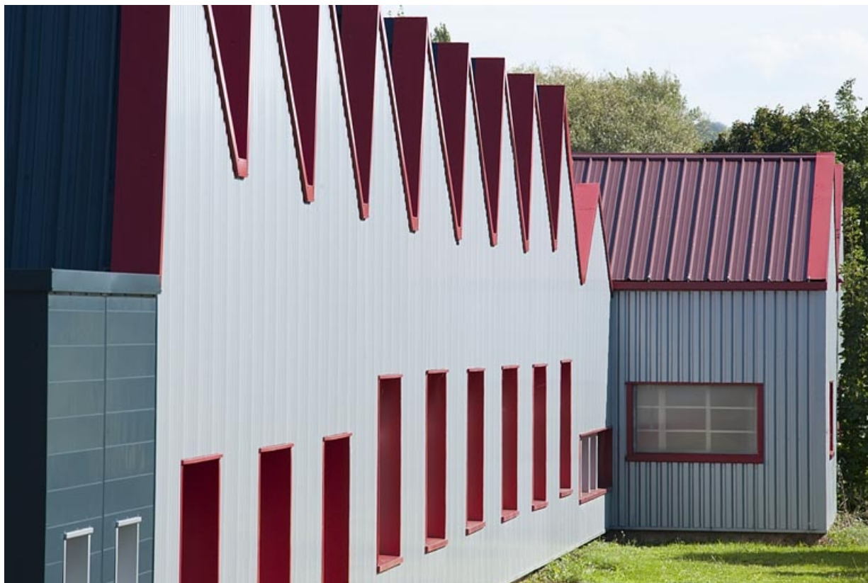
Détail du bardage de la façade sud.