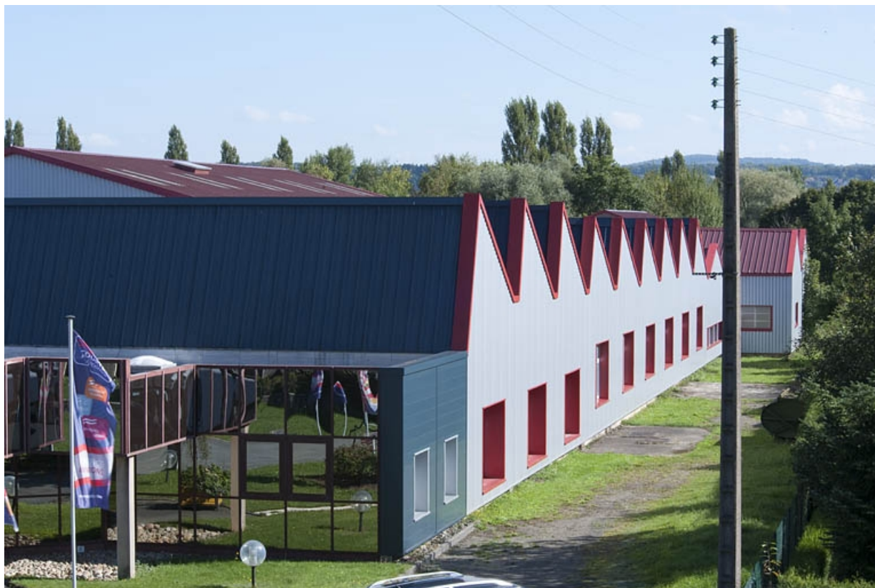
Vue plongeante depuis l'ouest.