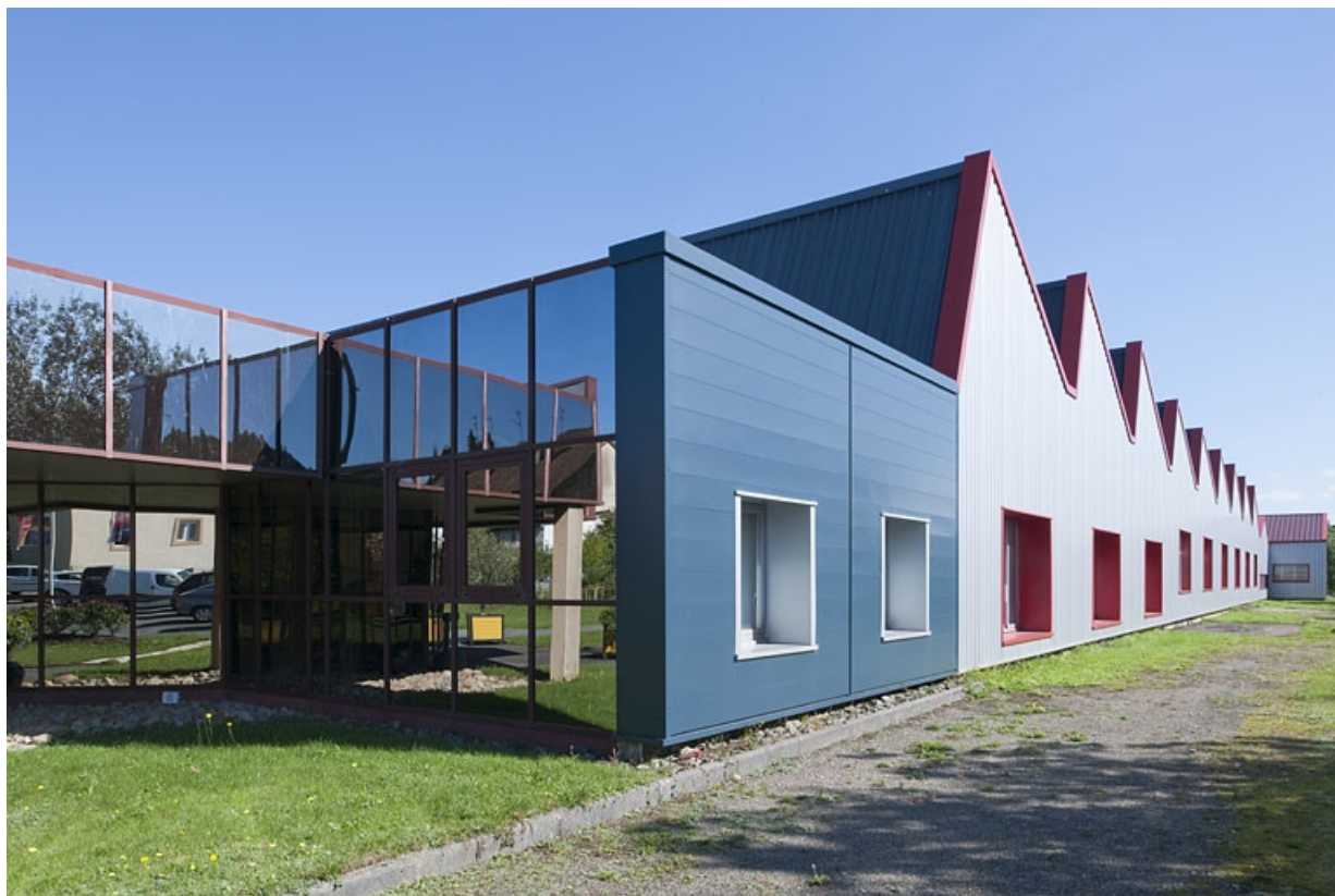
Façade sud de l'atelier de fabrication.