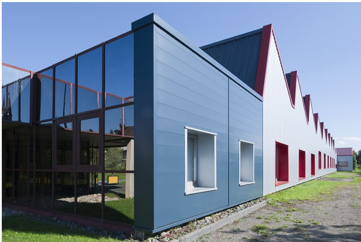
Détail de la façade sud de l'atelier de fabrication.