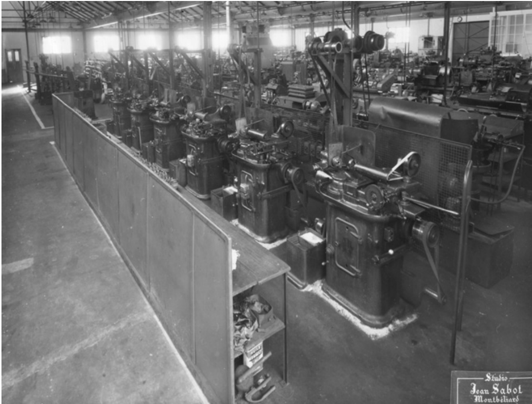
Vue intérieure de l'atelier. Batterie de machines (à décolleter ?).