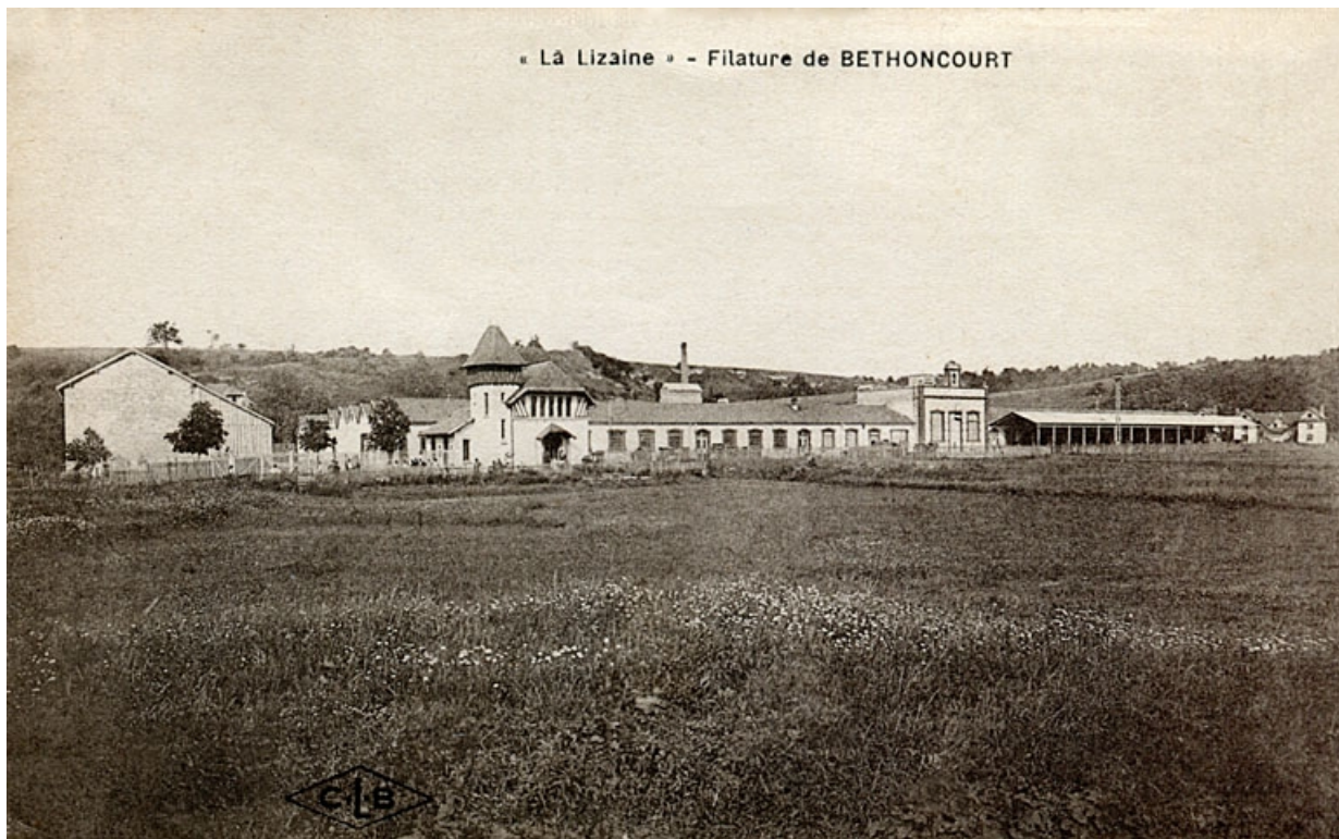
La Lizaine, filature de Bethoncourt.