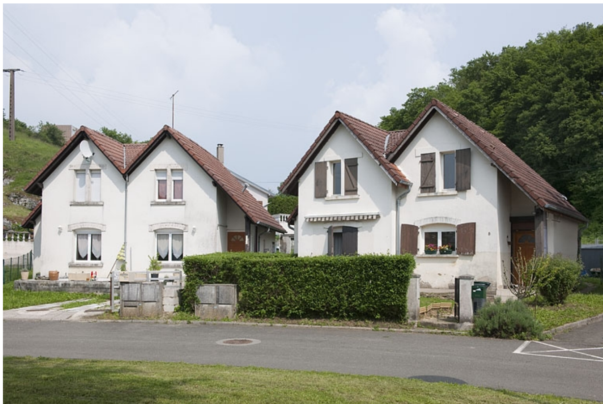
Cité du parc : ensemble de 2 maisons individuelles.