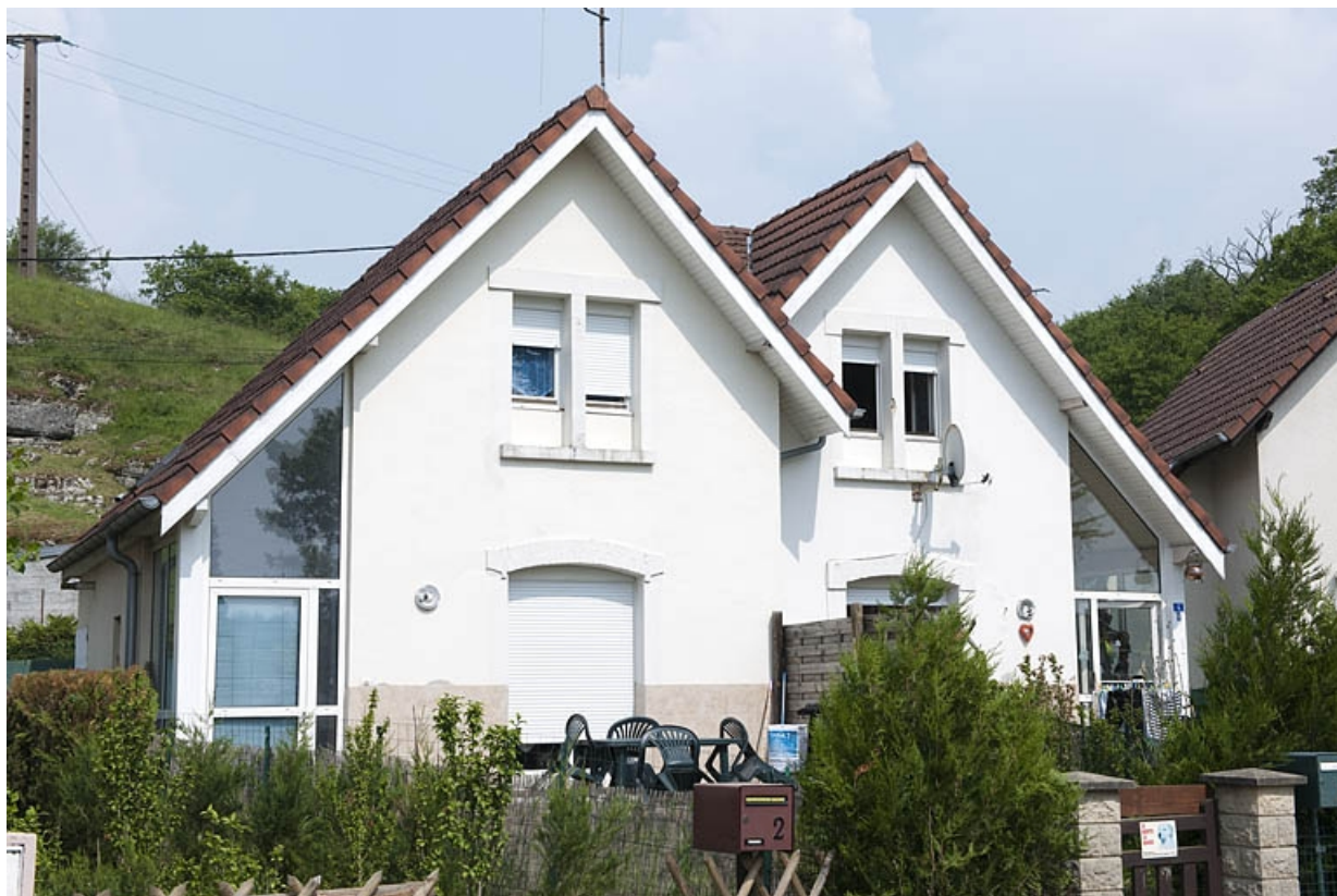
Cité du parc : façade antérieure d'une maison individuelle.