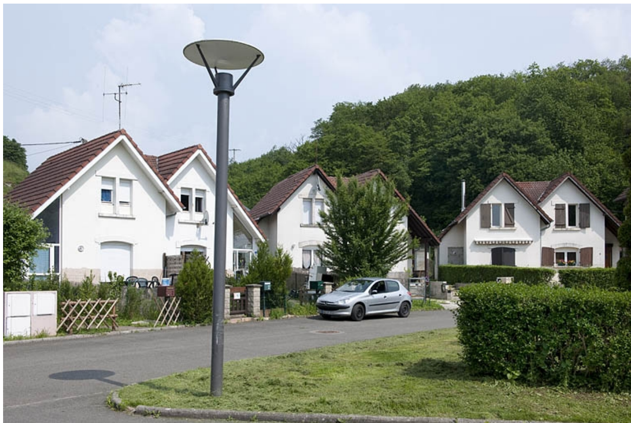
Cité du parc : maisons individuelles depuis l'ouest.