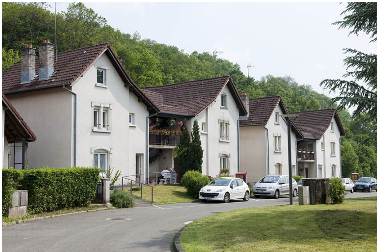
Cité du parc. Habitations de 4 logements.