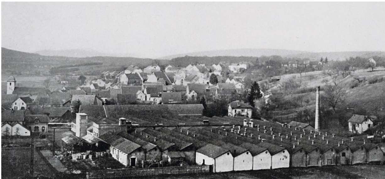
Filature de la Lizaine depuis le sud, fotogr., s.d. [1949]. Cf. doc. 01 25, Bethoncourt impasse de la Lizaine

Photographie , s.n., s.d. [1949]. Dans : " L'Opinion économique et financière ", 1949, n°2, p. 74.