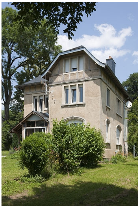
Logement patronal. Vue de trois quarts droite.