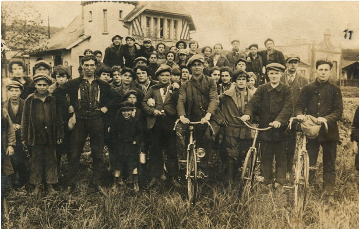
[Groupe d'ouvriers devant la conciergerie de l'usine].