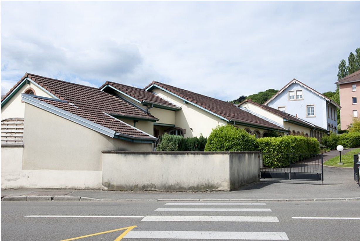
Vue d'ensemble depuis la rue.

25, Montbéliard, 13 avenue du maréchal Foch