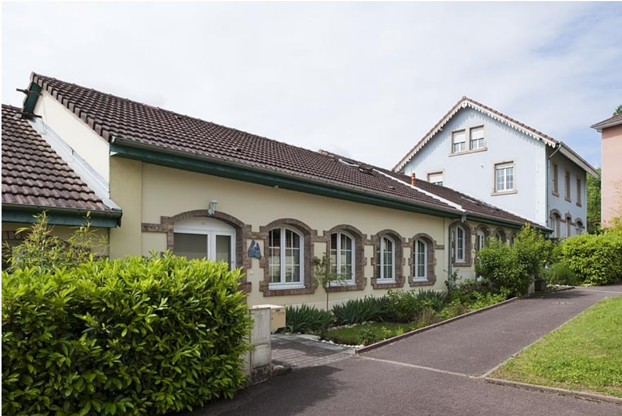
Atelier de fabrication, et bâtiment abritant le bureau et le logement.

25, Montbéliard, 13 avenue du maréchal Foch