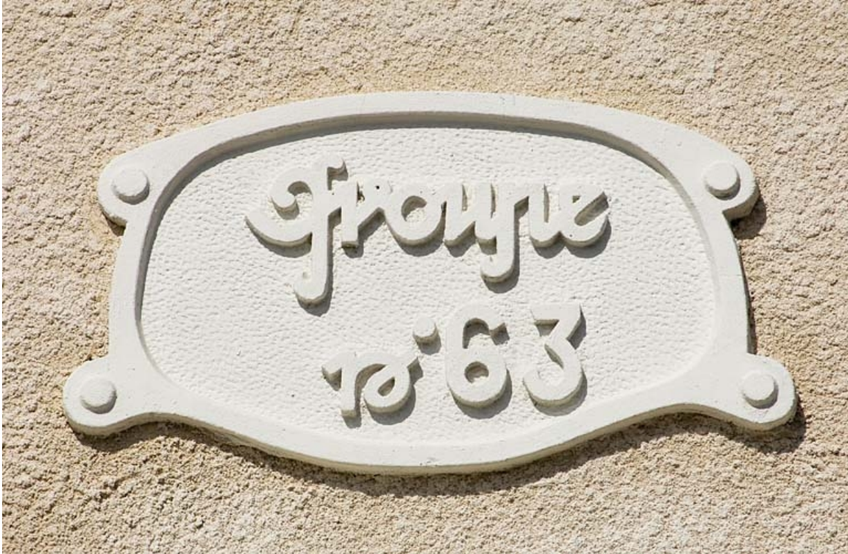
Habitation à 4 logements. Cartouche sur la façade antérieure.