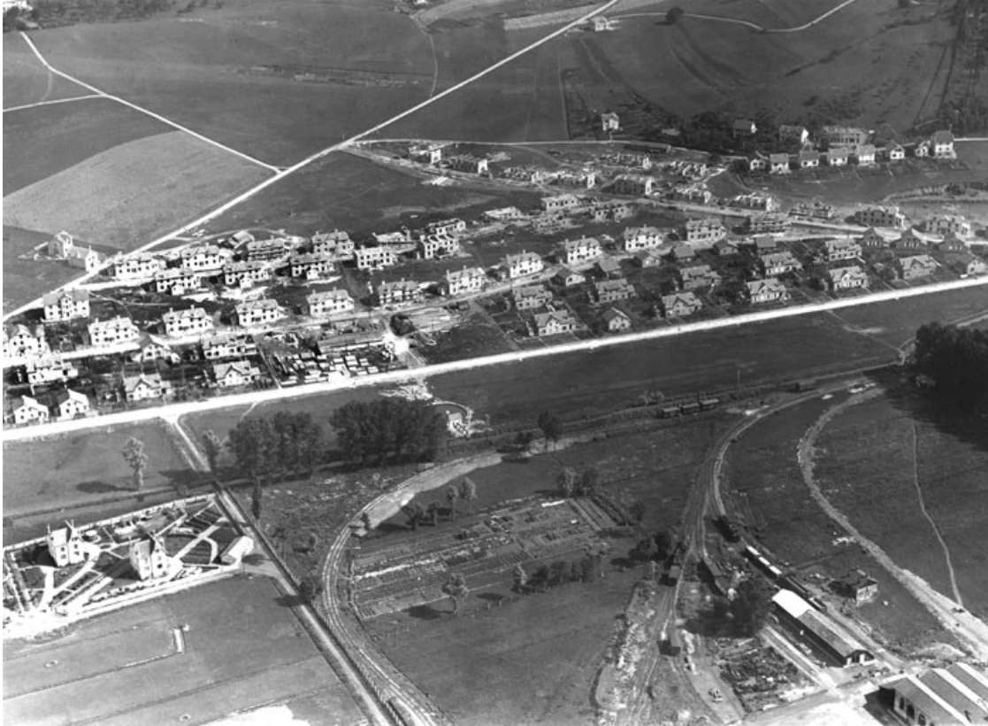
Vue aérienne depuis le sud-ouest.