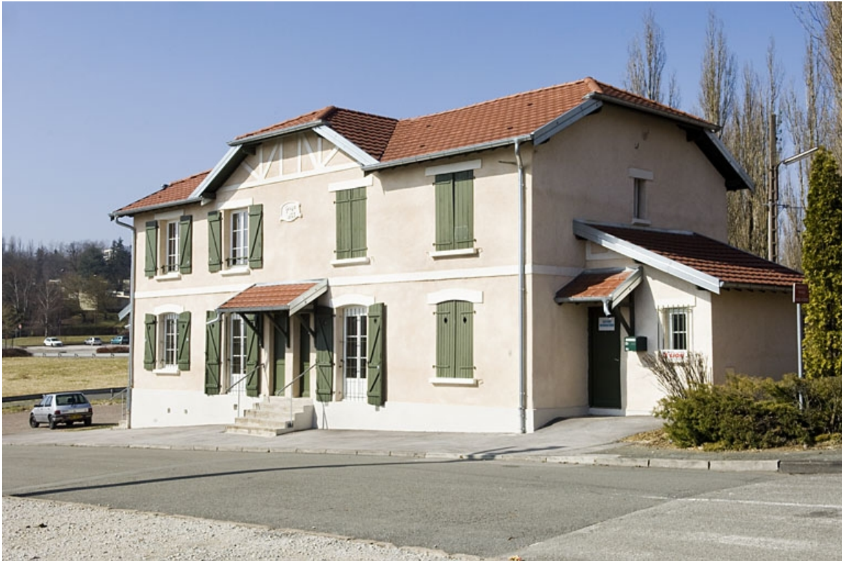
Habitation vue de trois quarts droite. 25, Montbéliard, lieudit : sous le Parc