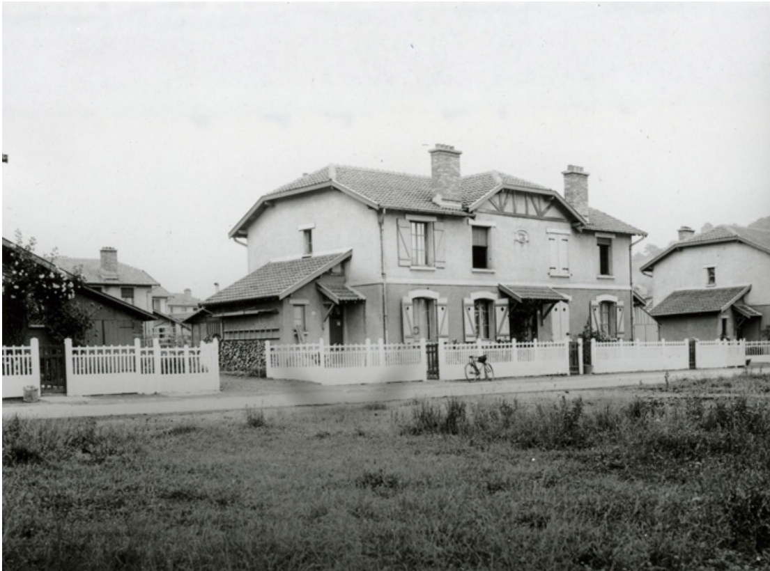
Maison vue de trois quarts.