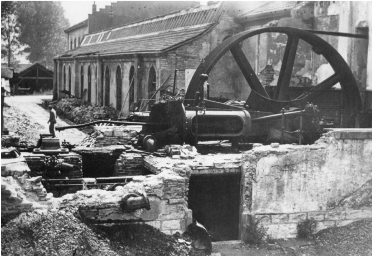
Machine à vapeur.

25, Montbéliard, 97, 99 faubourg de Besançon