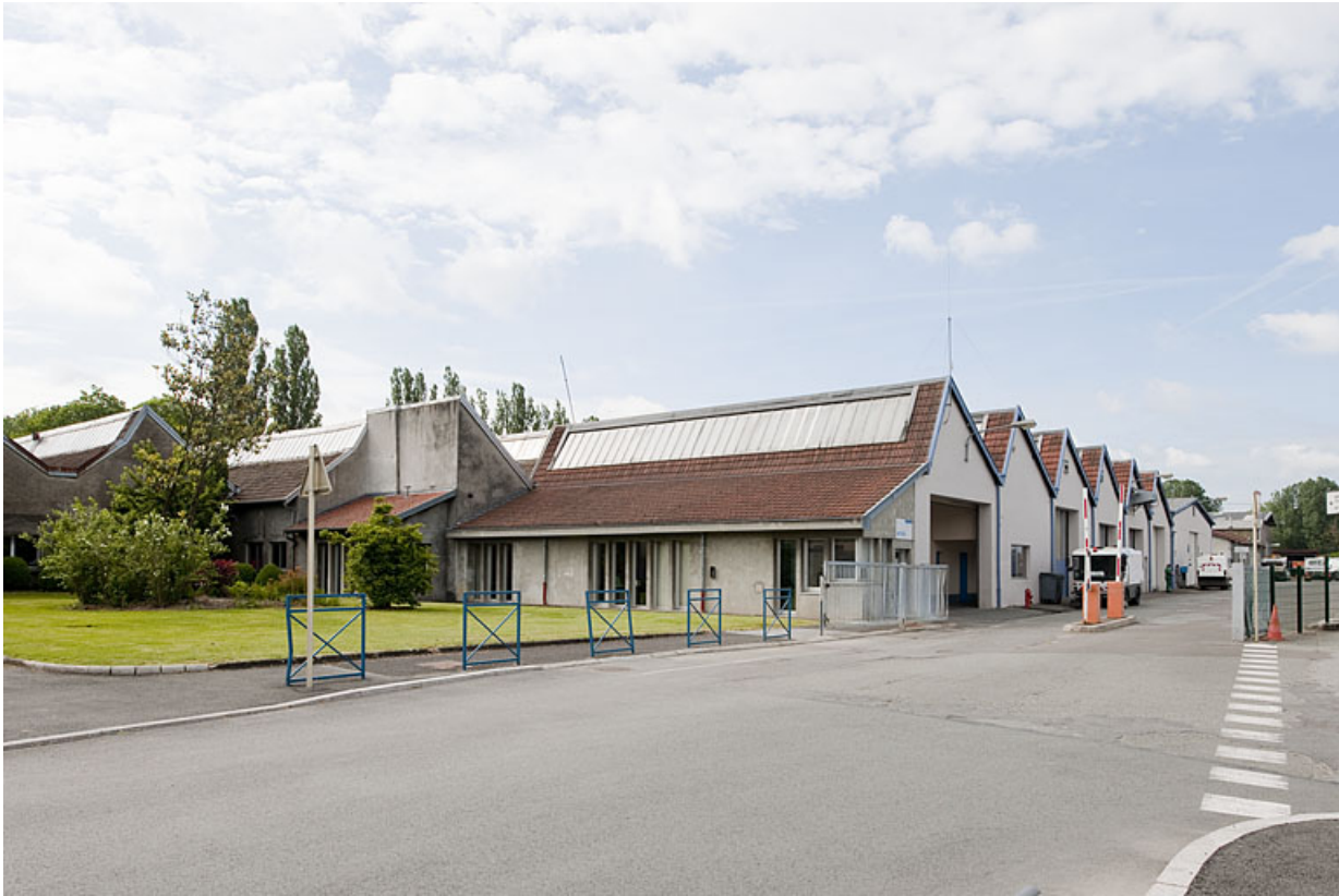
Entrée du site depuis la route.

25, Montbéliard, 97, 99 faubourg de Besançon