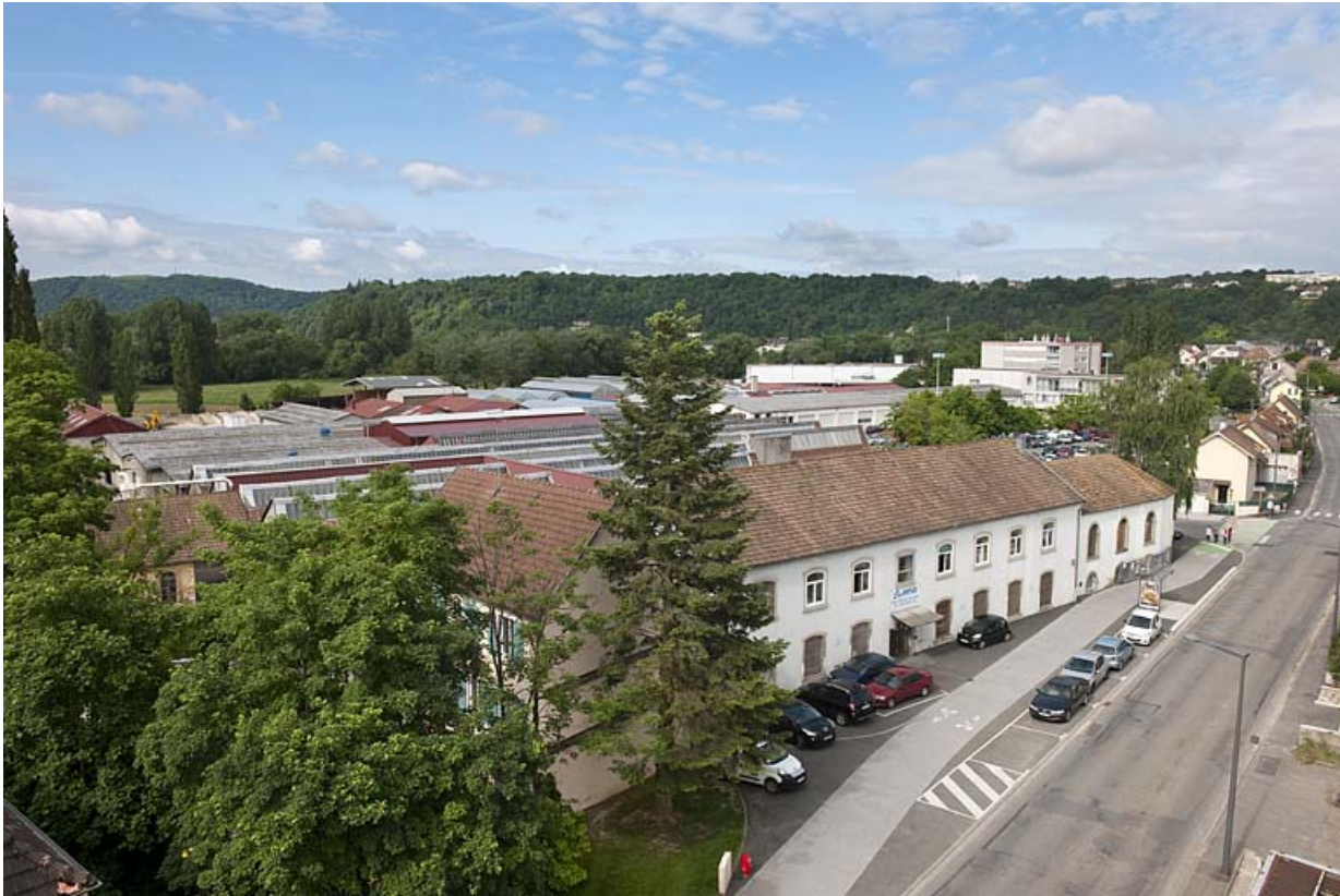
Vue plongeante depuis le nord-est.

25, Montbéliard, 97, 99 faubourg de Besançon