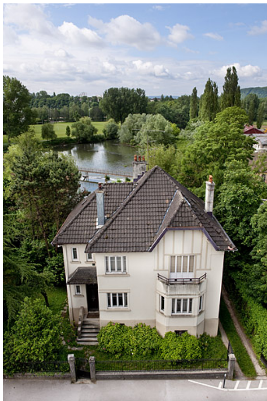
Vue plongeante sur le logement patronal.

25, Montbéliard, 97, 99 faubourg de Besançon