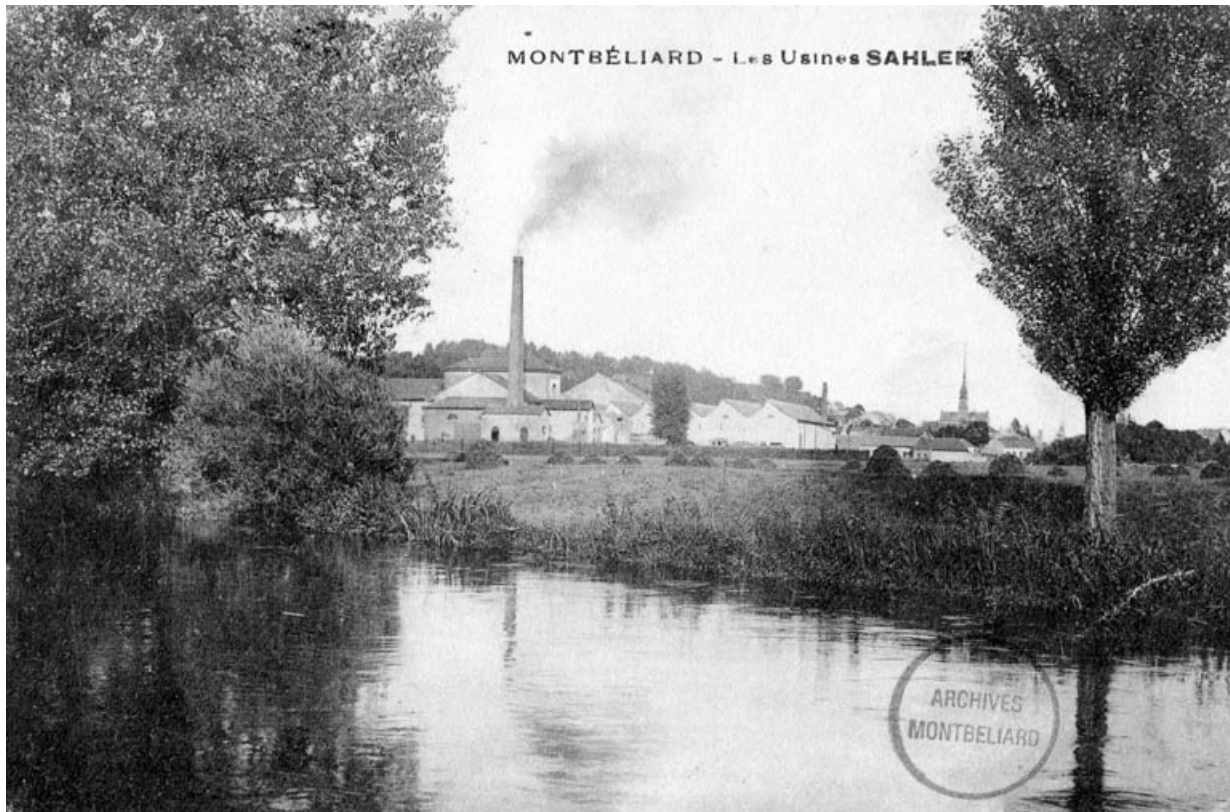
Montbéliard - Les usines Sahler.

25, Montbéliard, 97, 99 faubourg de Besançon