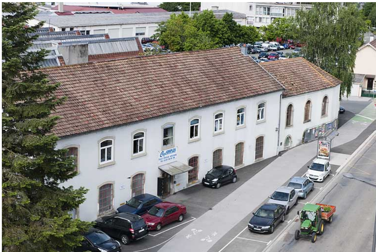
Vue plongeante sur le bâtiment administratif (?).

25, Montbéliard, 97, 99 faubourg de Besançon