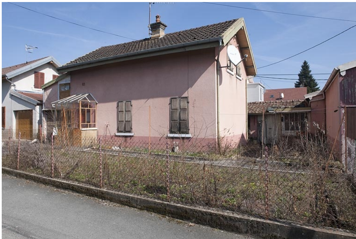
Maison individuelle rue des Lilas.