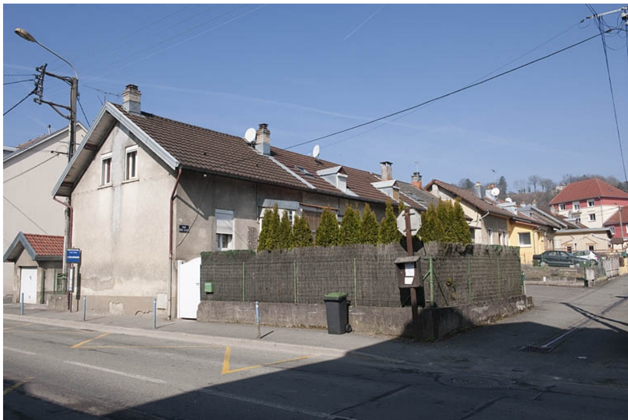
Habitations à 4 logements rue des Lilas.