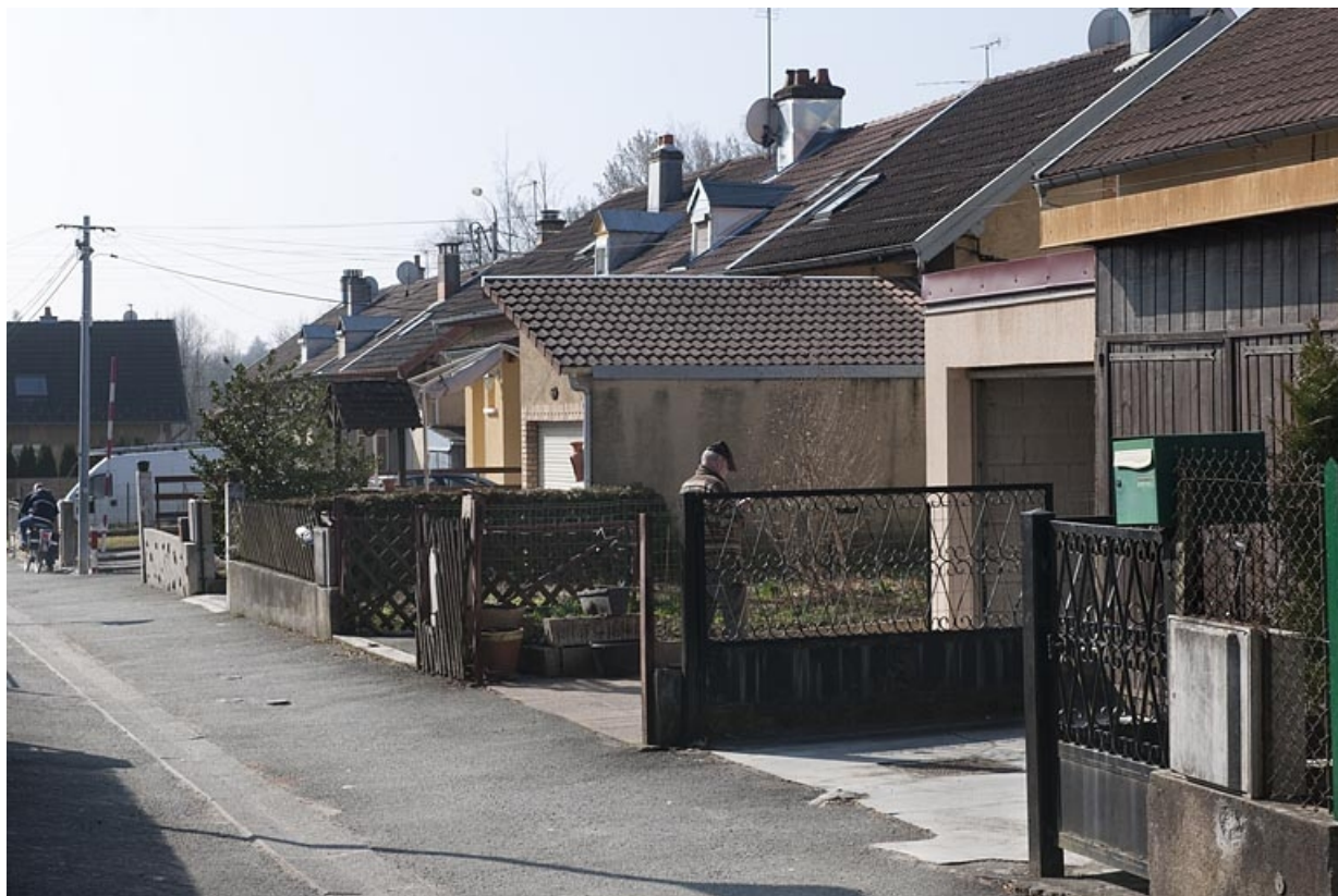
Rue des Lilas depuis le nord-est.