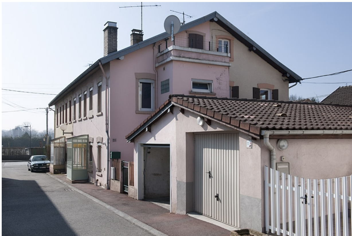
Habitation à 8 logements vue de trois quarts.