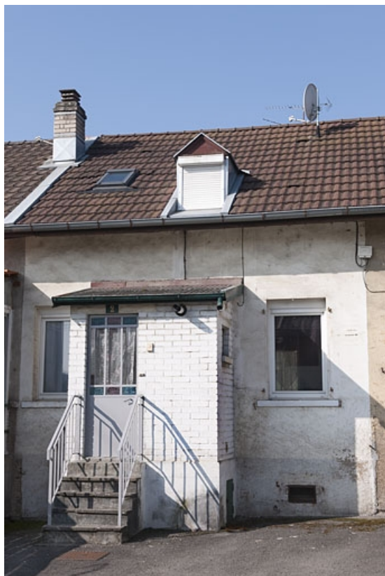
Détail d'une travée d'une habitation à 4 logements. 25, Sainte-Suzanne rue des Lilas