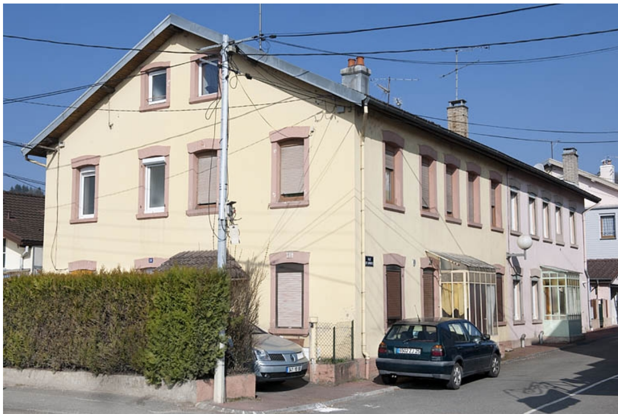
Habitation à 8 logements depuis la rue de Besançon.