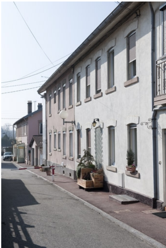
Rue des Campenottes. Habitations à 8 logements.