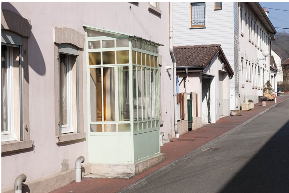
Façade sur rue d'une habitation à 8 logements.