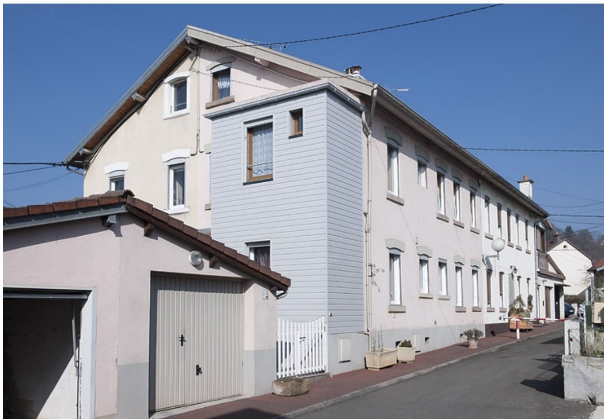
Habitation à 8 logements. Façade sur la rue des Campenottes.