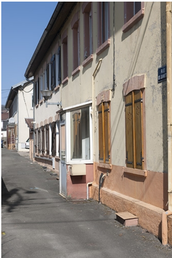
Détail d'une façade d'une habitations à 8 logements. 25, Sainte-Suzanne rue des Lilas