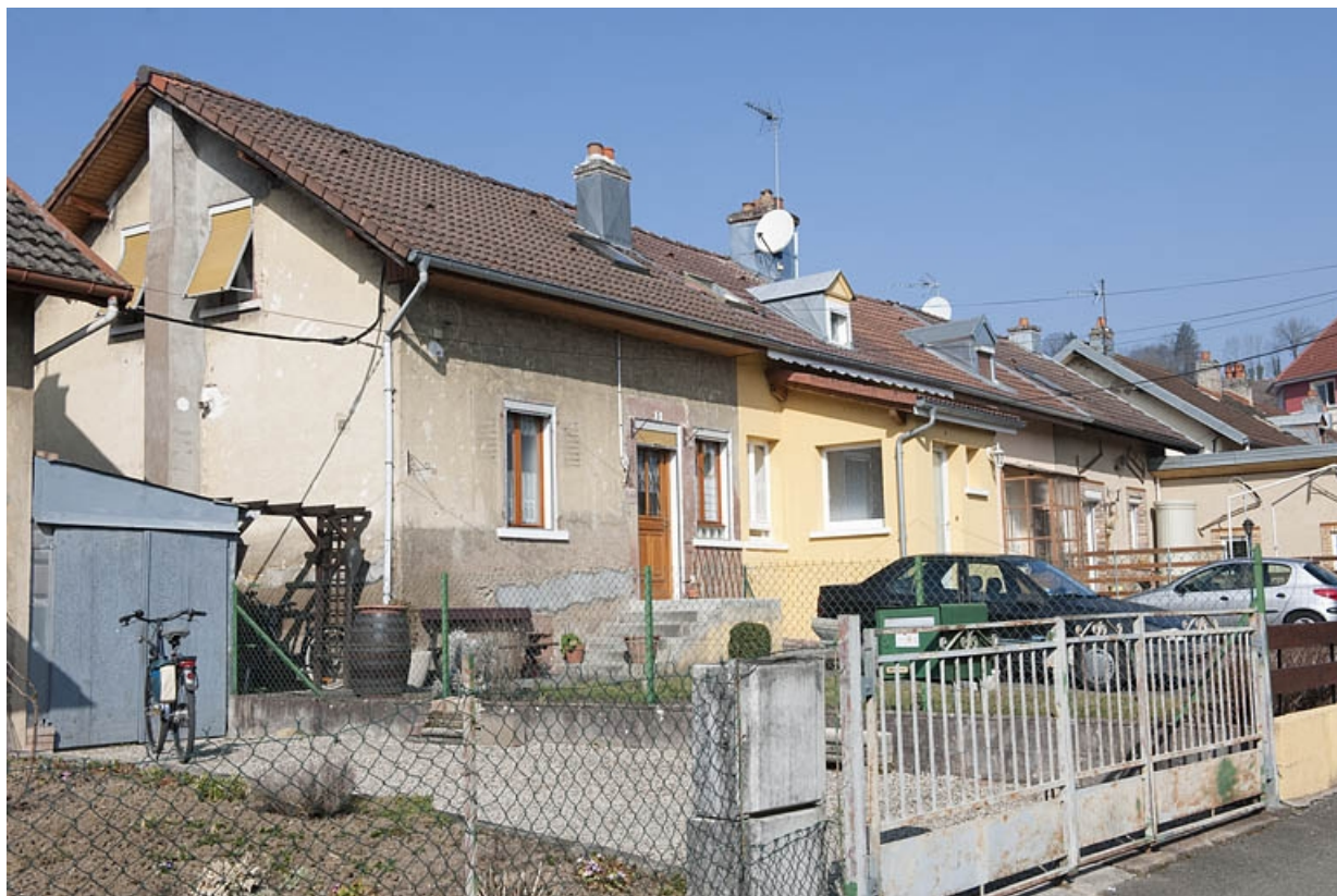
Habitation à 4 logements vue de trois quarts.