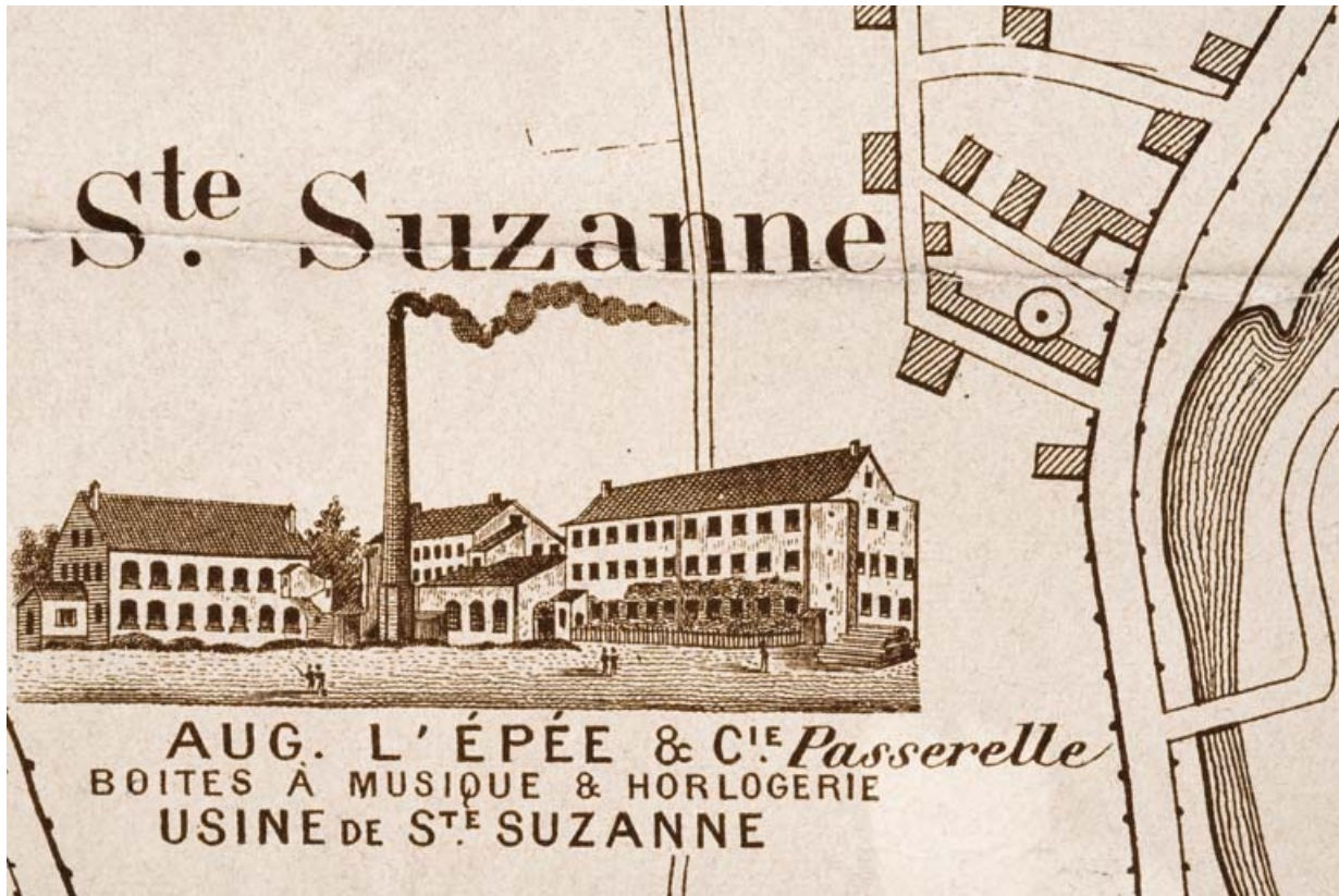
Plan monumental des grandes usines [...]. Fonderie, laminage, tréfilerie, pointerie [détail]. 25, Sainte-Suzanne, 61 rue de Besançon