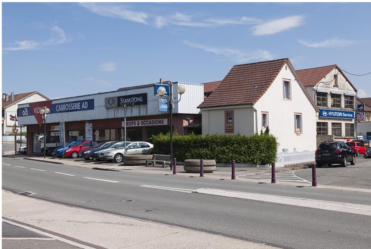
Vue d'ensemble depuis la route.