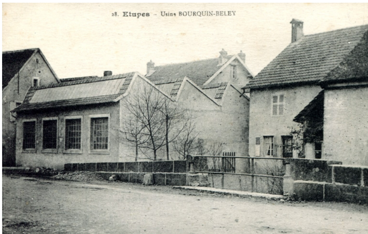
Etupes - Usine Bourquin-Beley.