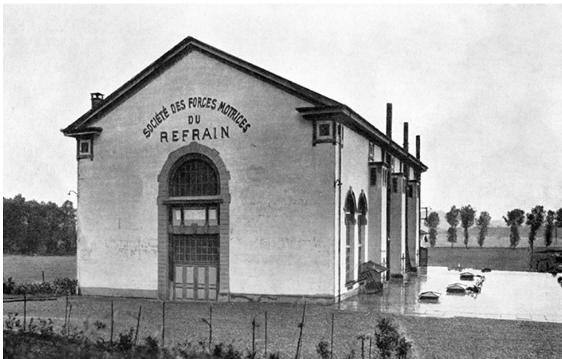
STATION DE SECOURS D'ÉTUPES : Vue générale.

Station d'Étupes. Vue générale. Photograph., s.n., s.d. [vers 1935] 25, Étupes avenue du général de Gaulle