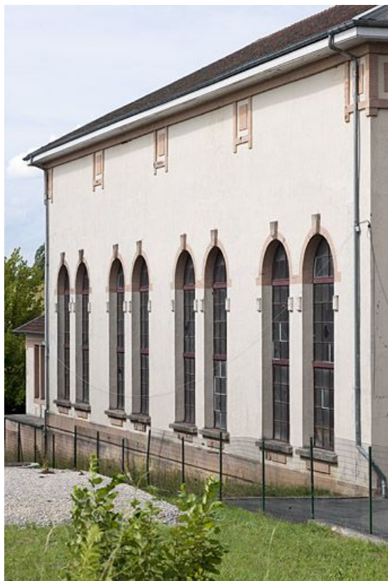
Façade ouest de la salle des machines. 25, Étupes avenue du général de Gaulle