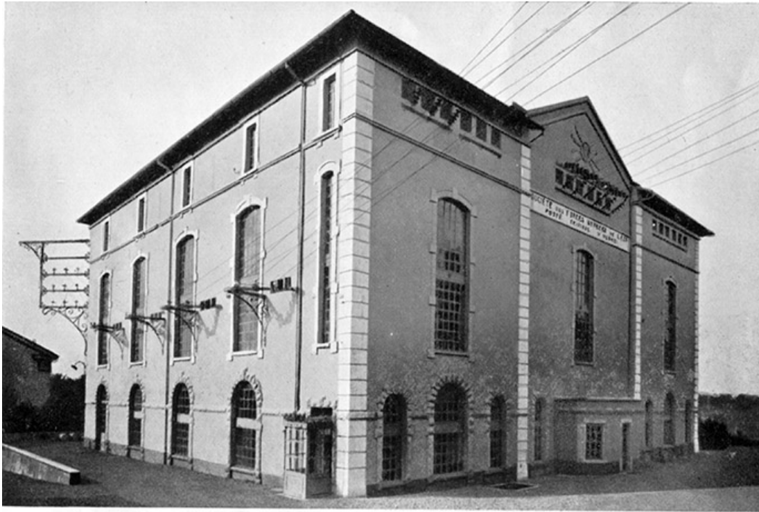
SOUS-STATION PRINCIPALE D'ÉTUPES : Vue générale.

Station d'Etupes. Vue d'ensemble. Photogr., s.n., s.d. [vers 1935] 25, Étupes avenue du général de Gaulle