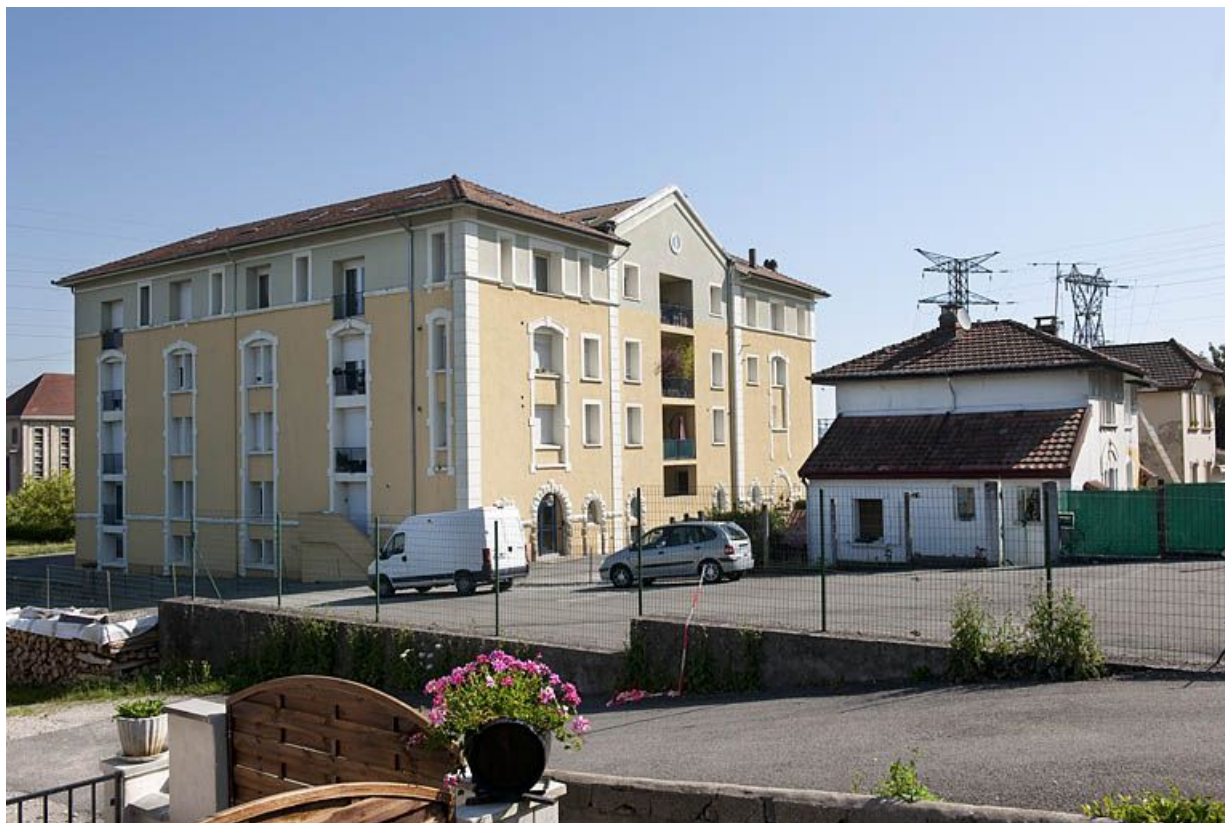
Vue d'ensemble depuis le sud-ouest. 25, Étupes avenue du général de Gaulle