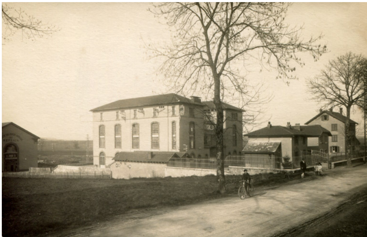
Sous-station électrique du Refrain. Photogr., s.n., s.d. [début du 20e siècle]. 25, Étupes avenue du général de Gaulle