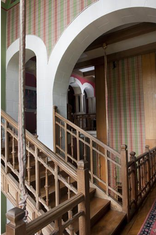
Entresol. Accès au premier étage.