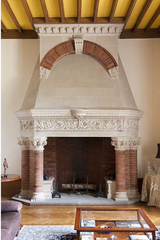
Cheminée du salon.