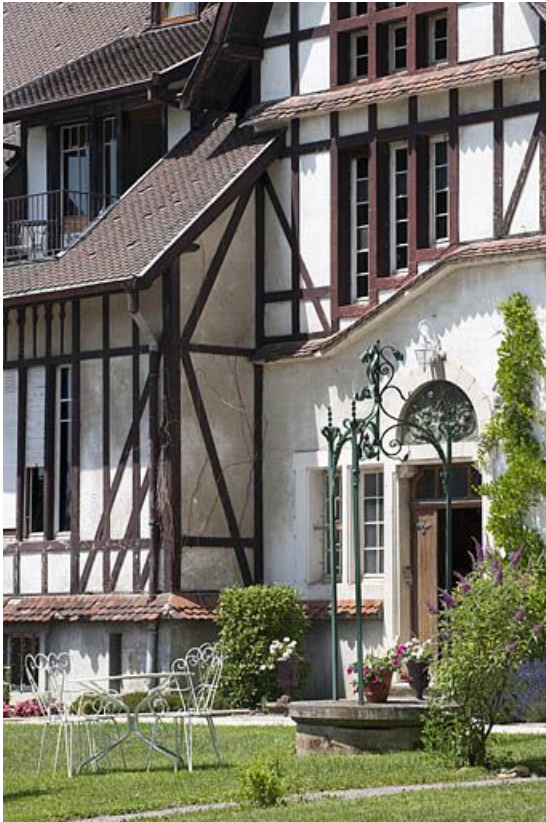
Façade sud vue de trois quarts.