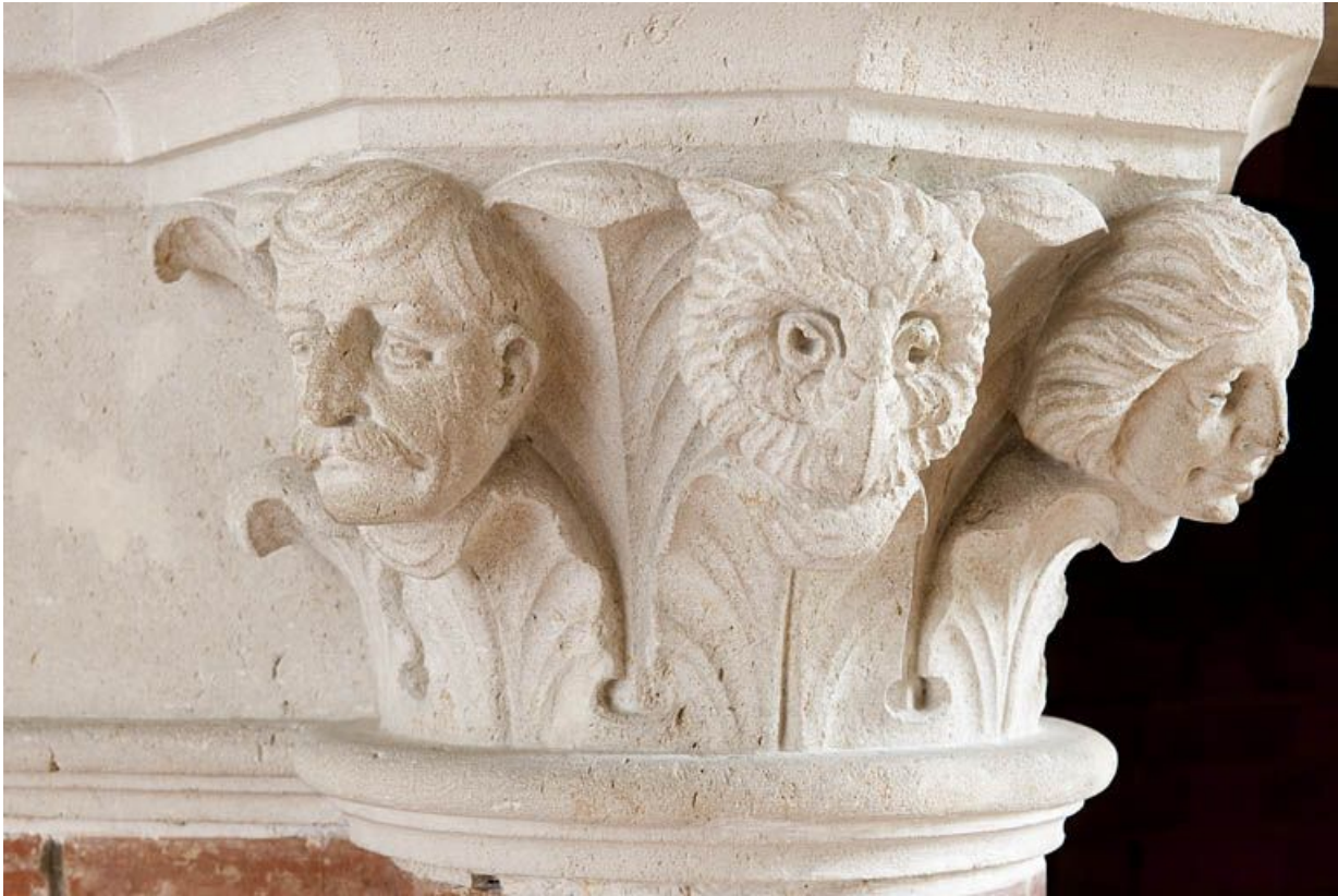
Cheminée du salon. Chapiteau sculpté.