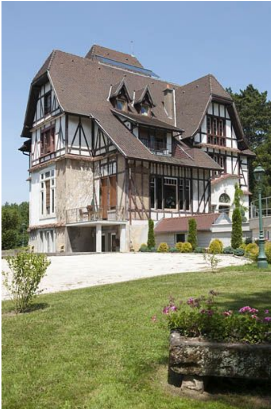
Façades ouest et sud.