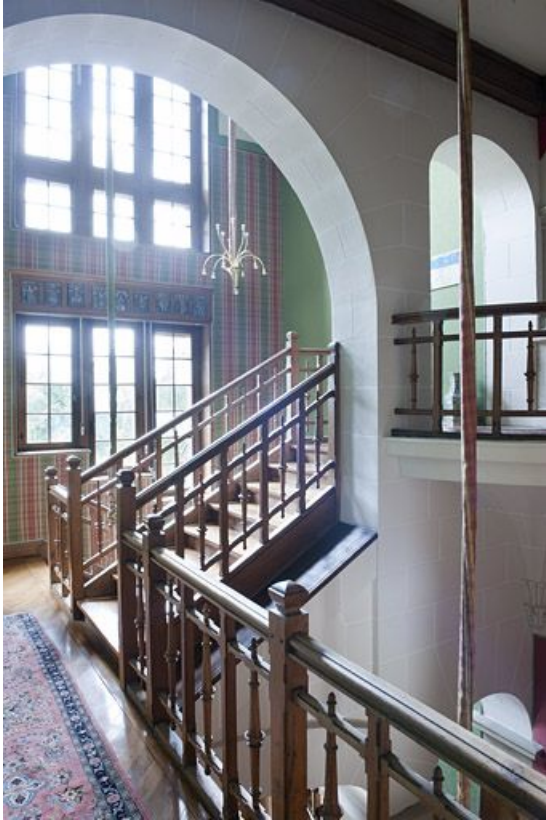
Cage d'escalier ajouré depuis l'entresol.