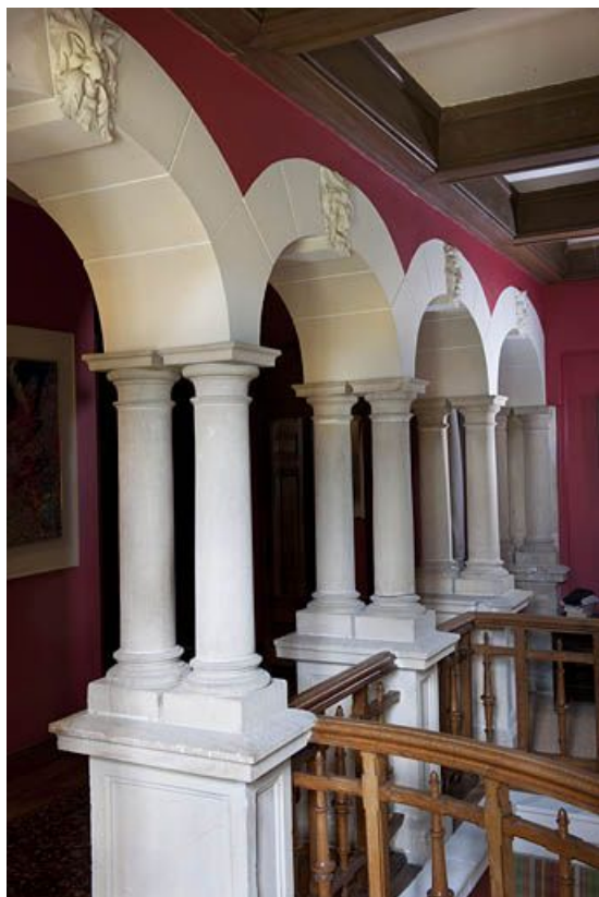
Colonnnettes jumelées au premier étage. 25, Exincourt rue sur le Mont