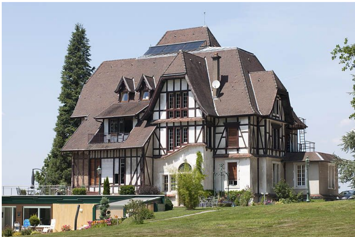
Vue d'ensemble depuis le parc.