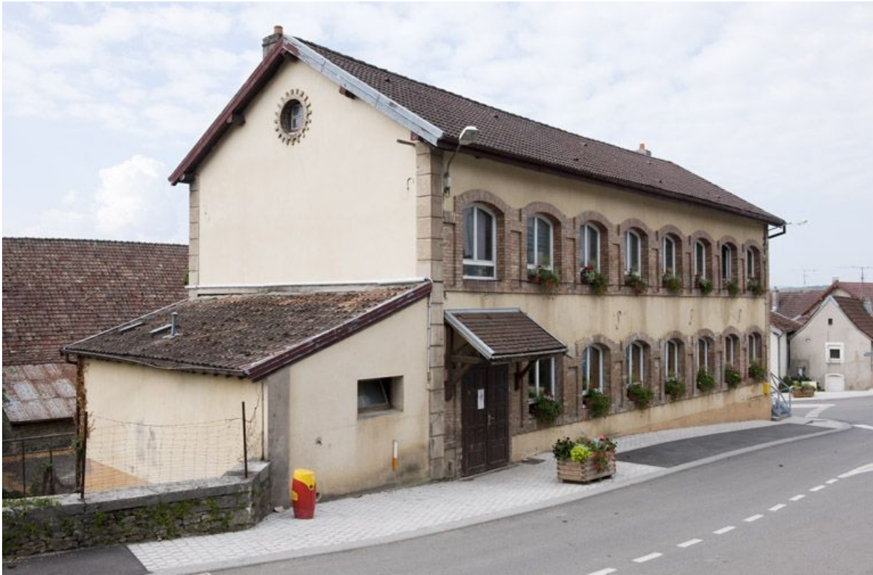
Vue rapprochée depuis le nord-est.