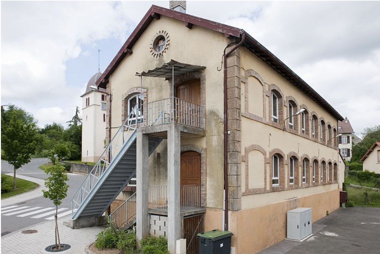
Vue de trois quarts arrière.