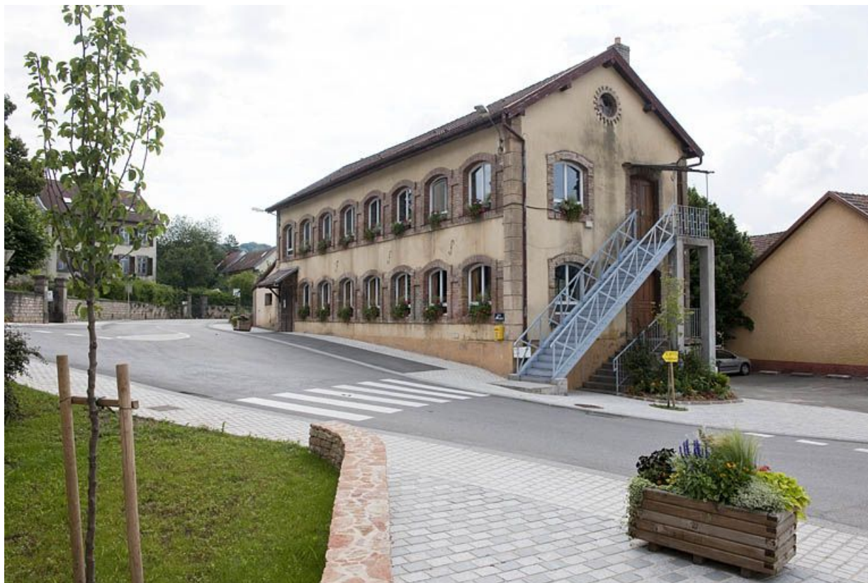
Vue rapprochée depuis l'ouest.