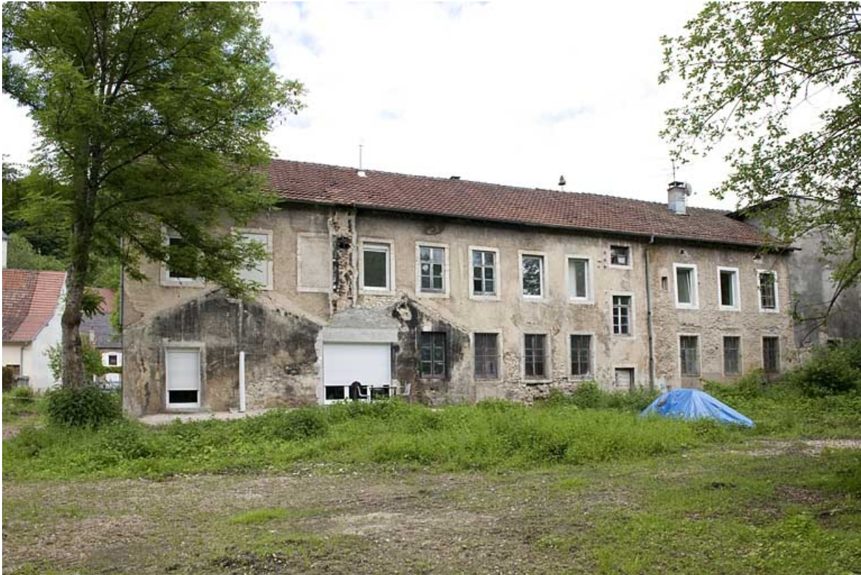
Façade postérieure des logements et bureaux.

25, Glay, 8 rue des Automobiles JeanPerrin