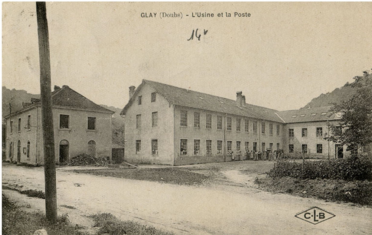
Glay (Doubs) - L'usine et la poste, 1er quart 20e siècle. 25, Glay, 8 rue des Automobiles JeanPerrin