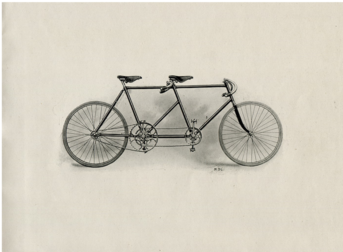
[Tandem], [décennies 1890-1900]. Document extrait d'un catalogue de production : Automobiles, motocyclettes, vélocipèdes Jeanperrin Frères [...]

25, Glay, 8 rue des Automobiles JeanPerrin