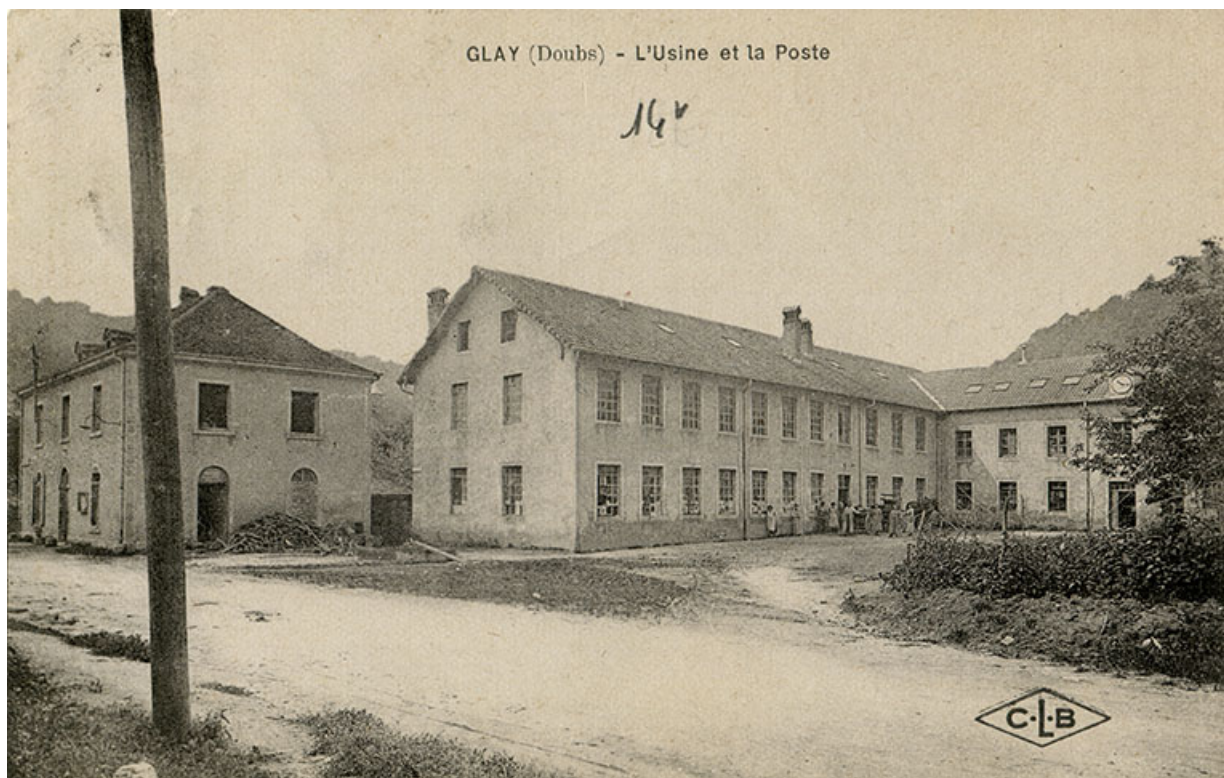
Glay (Doubs) - L'usine et la poste, 1er quart 20e siècle. 25, Glay, 8 rue des Automobiles JeanPerrin