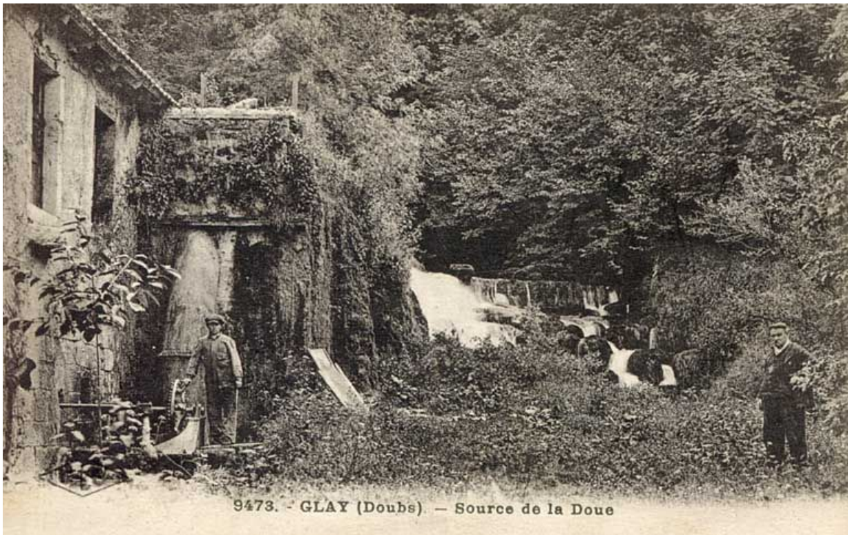
Glays (Doubs) - Source de la Doue : carte postale conservée au Musée du Château de Montbéliard, CLB éd., s.n., s.d. [fin 19e ou début 20e siècle].