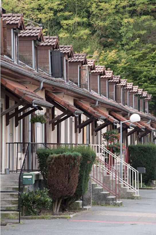
Caserne G. Vue rapprochée depuis l'est. 25, Hérimoncourt rue Adèle Prud'hon