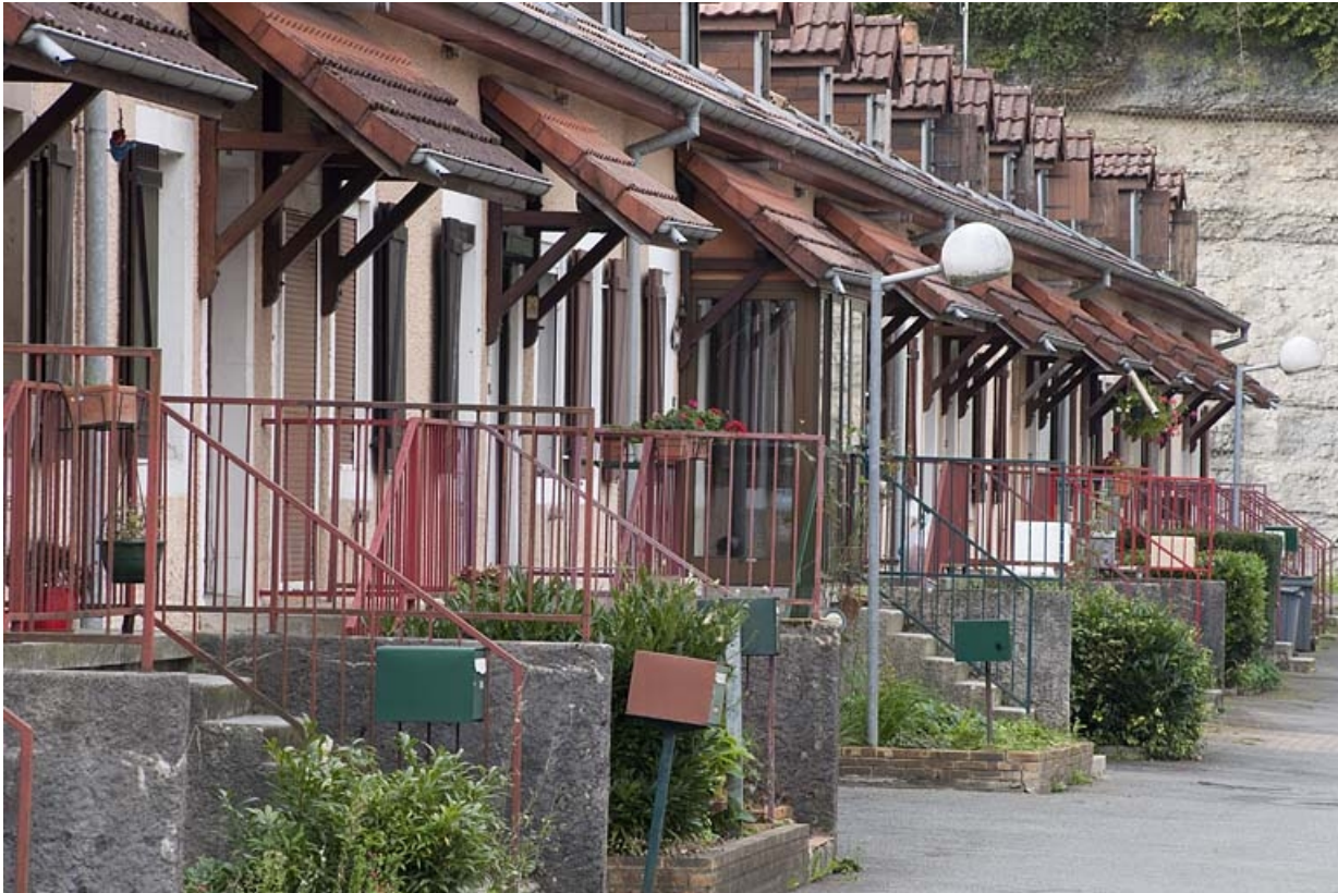
Caserne F. Vue rapprochée de la façade antérieure depuis le nord-est. 25, Hérimoncourt rue Adèle Prud'hon