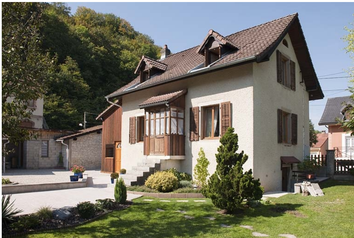
Maison individuelle rue du Cercle. Vue de trois quarts arrière.