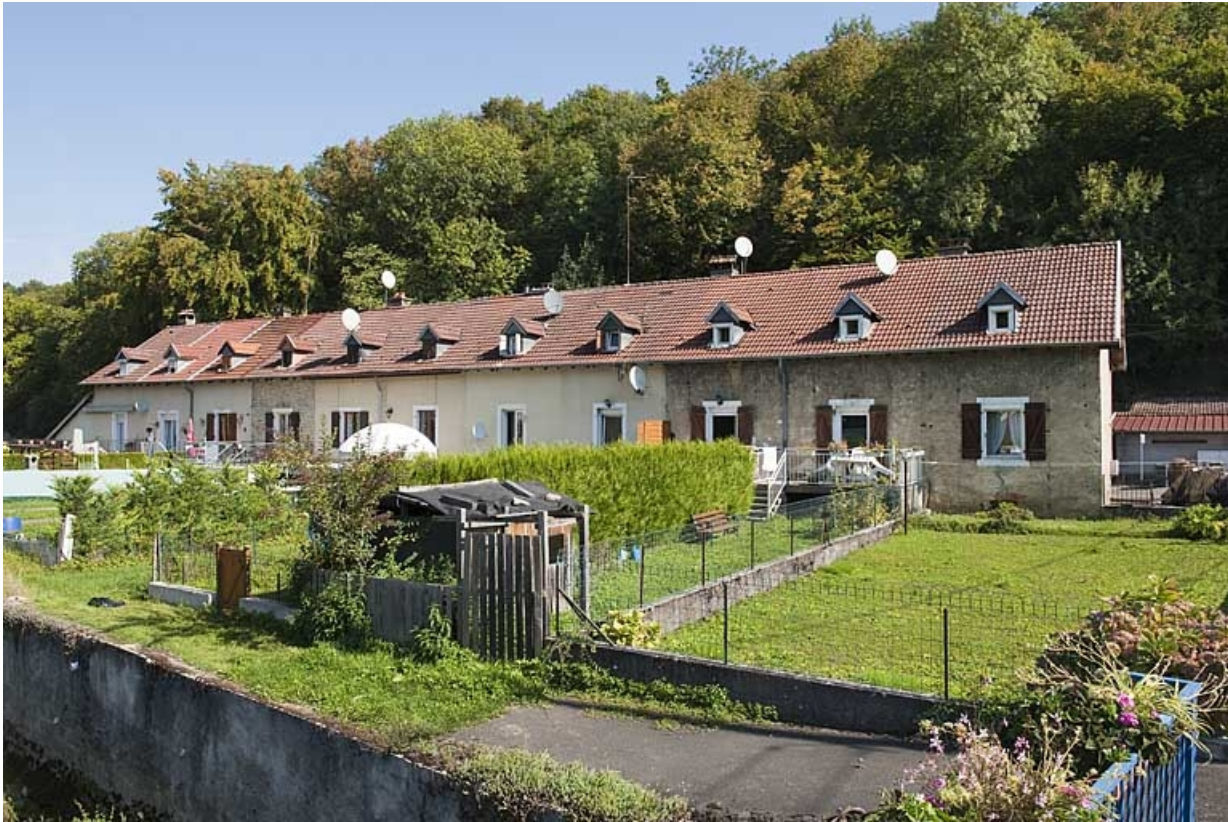
Logement nord (caserne A) depuis l'ouest.

25, Hérimoncourt, 4 à 25 chemin de Berne