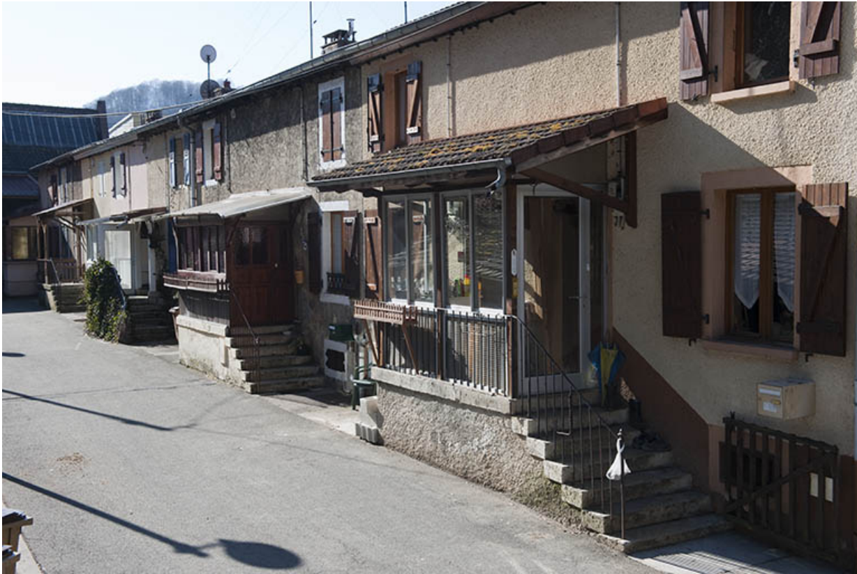
Logement sud (caserne B) vu de trois quarts.

25, Hérimoncourt, 4 à 25 chemin de Berne