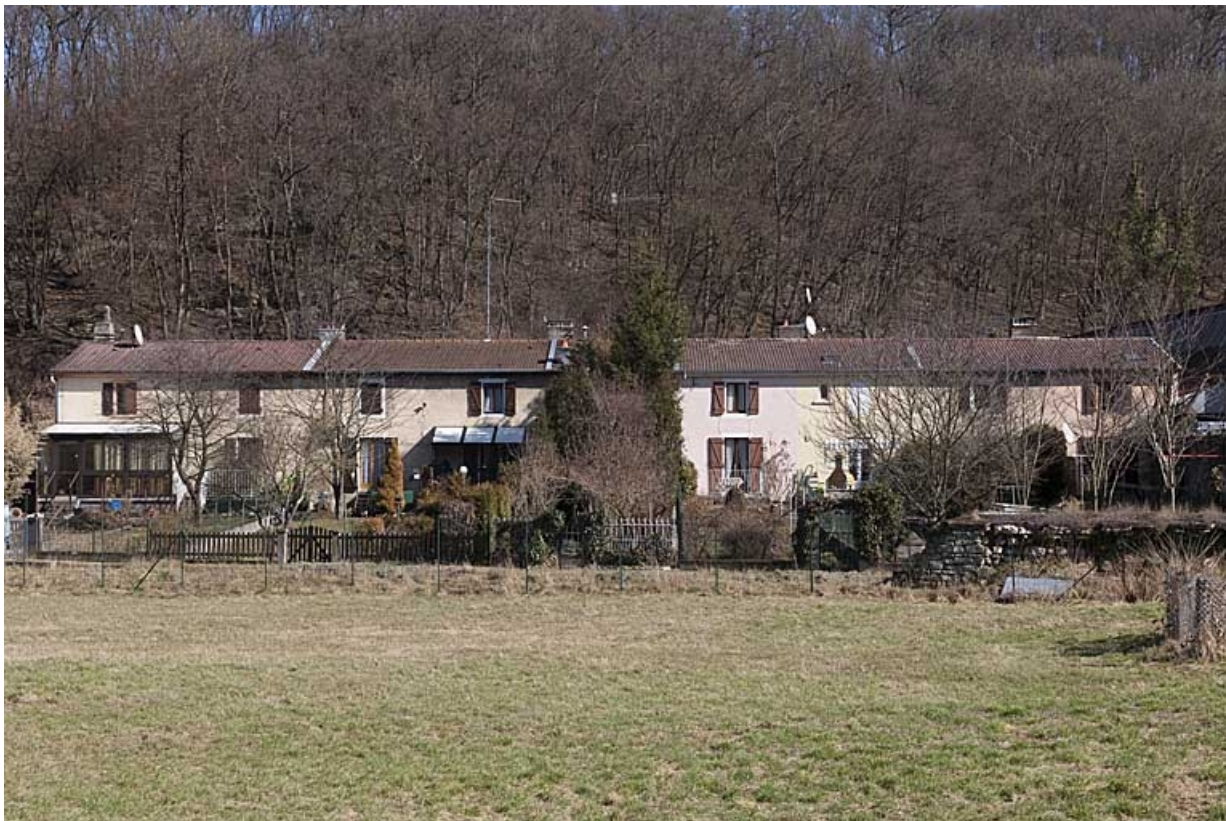
Logement sud (caserne B) depuis l'ouest.

25, Morteau, 2 rue du Docteur Léon Sauze