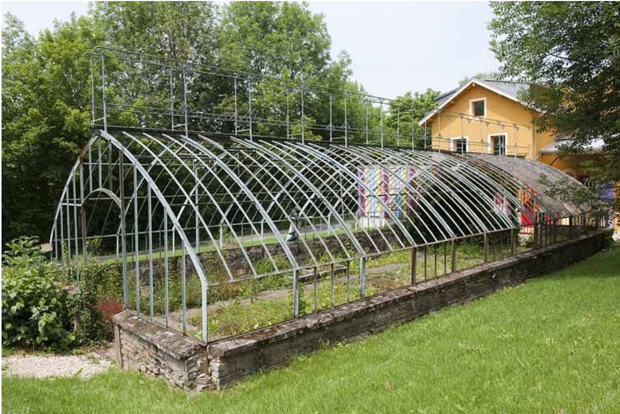
Serre et communs depuis le sud-est.