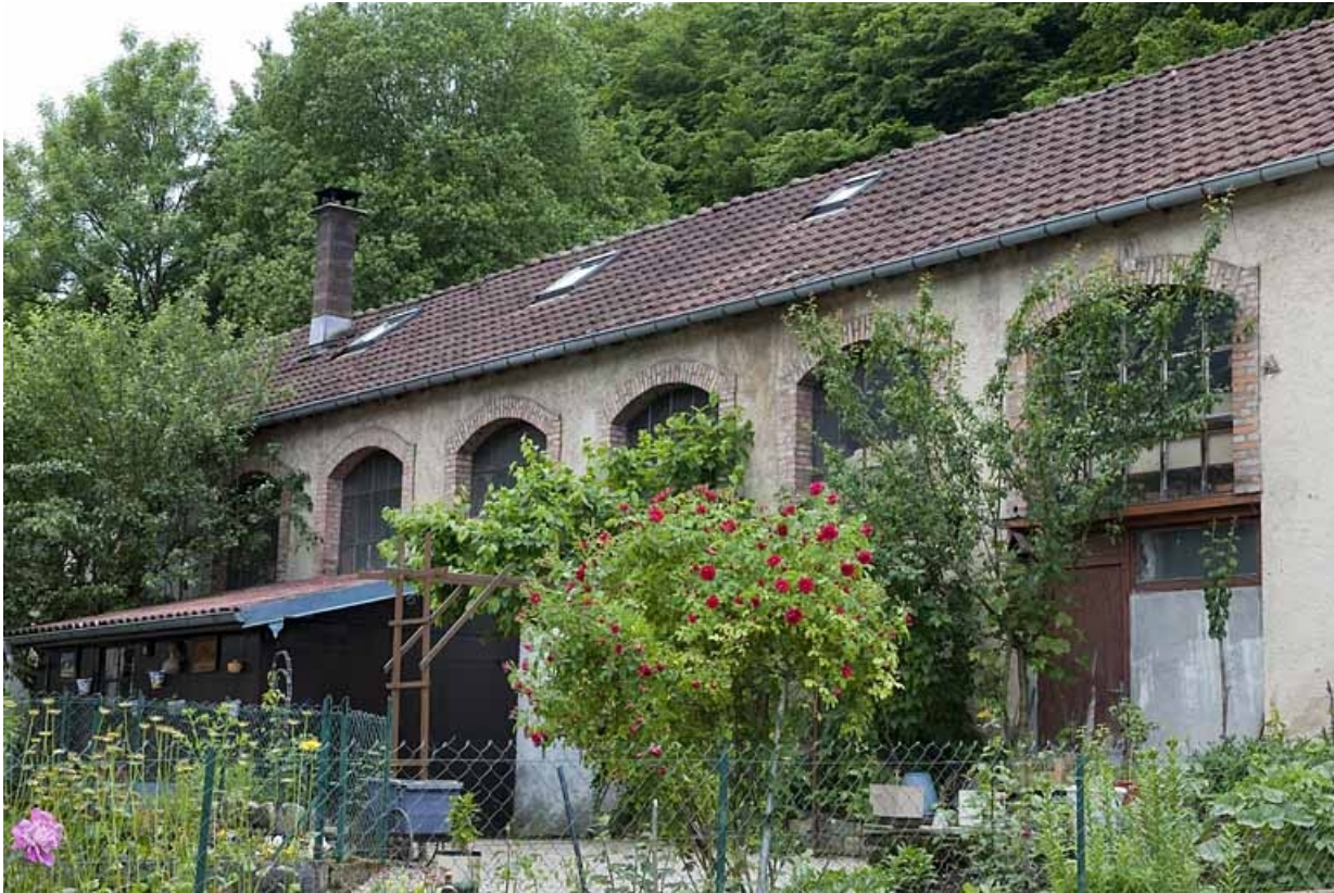
Façade est de l'atelier.