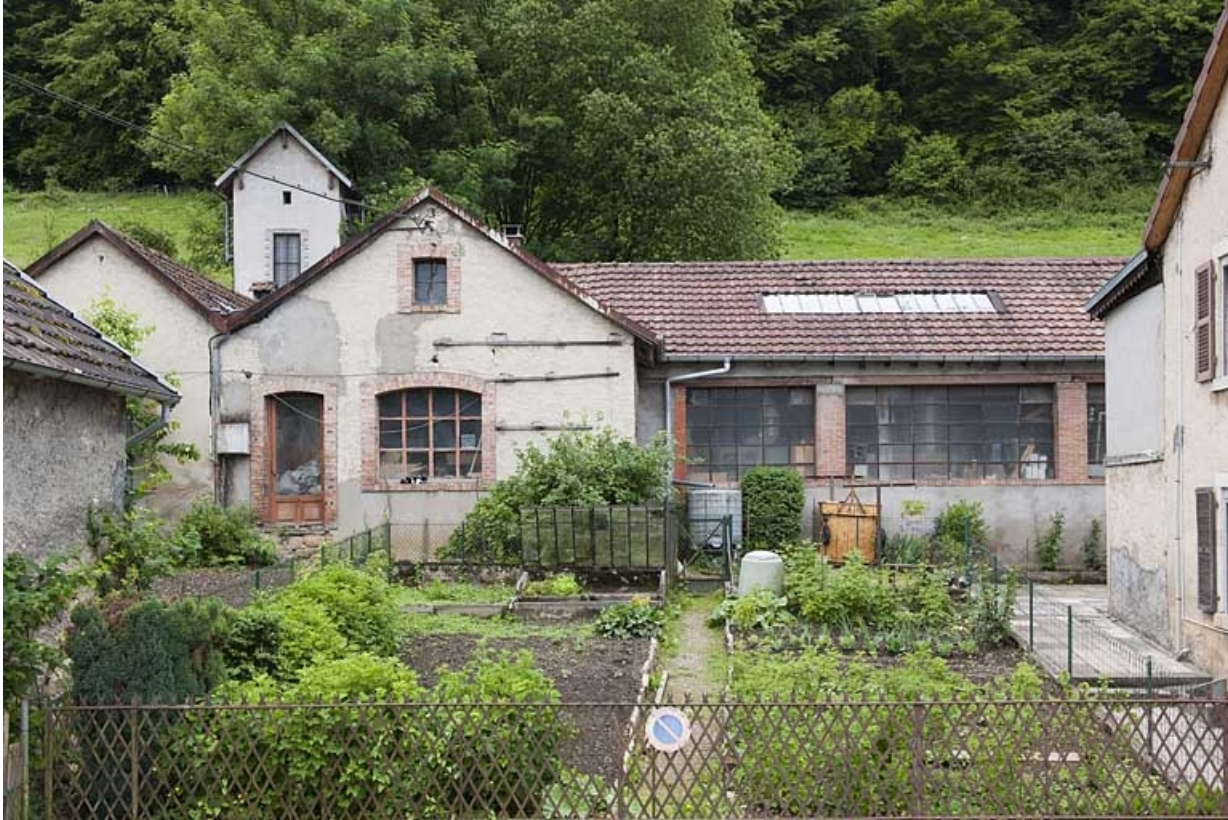
Extrémité sud de l'atelier.