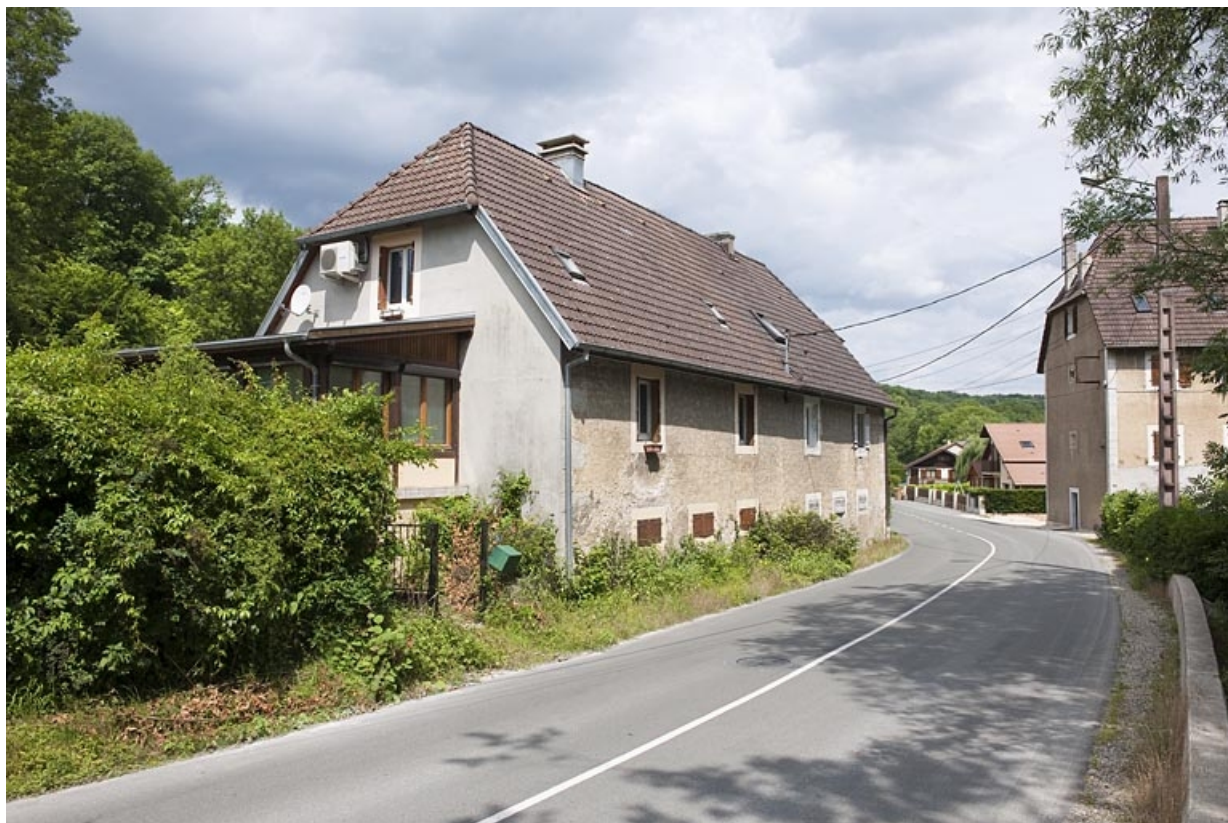
Logement d'ouvriers depuis le sud.