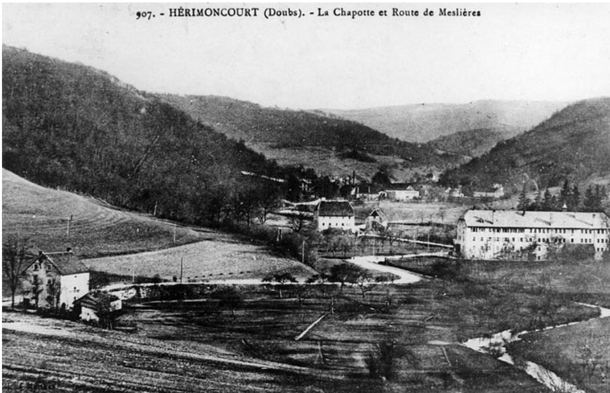
Hérimoncourt (Doubs). - La Chapotte et route de Meslières.