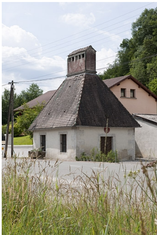
Séchoir vu de trois quarts.