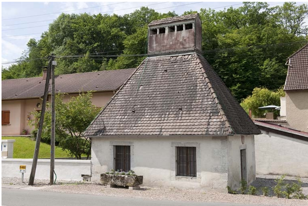
Séchoir vu depuis la route.