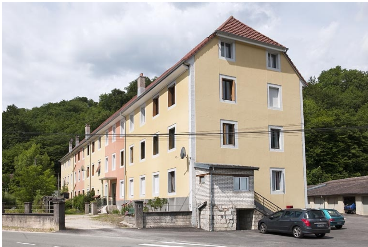
Façade sud vue de trois quarts.