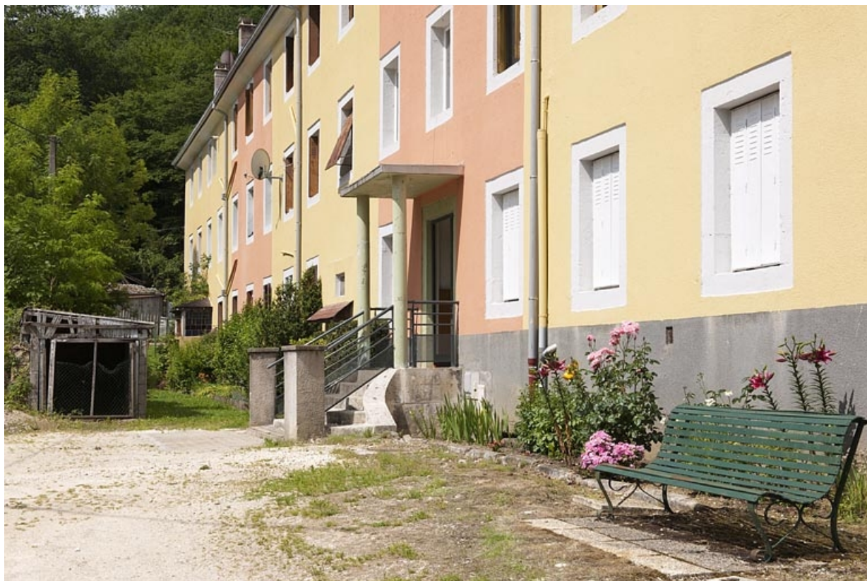
Détail de la façade sud.