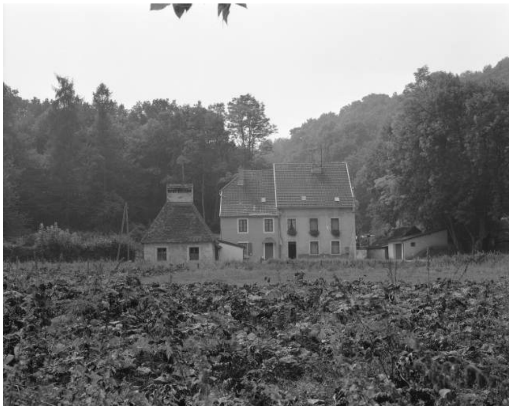
Séchoir-buanderie, logement et bureau en 1981.