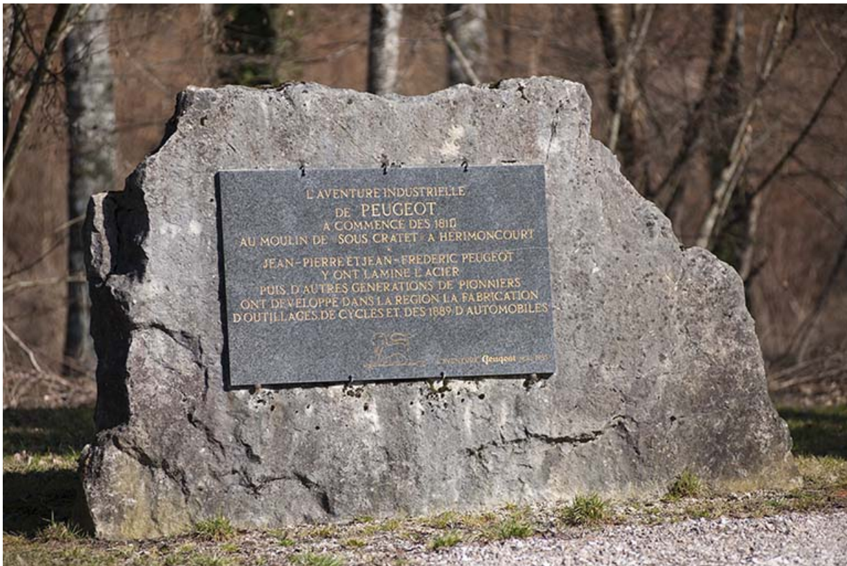
Etang de la Chapotte. Plaque commémorative Peugeot.