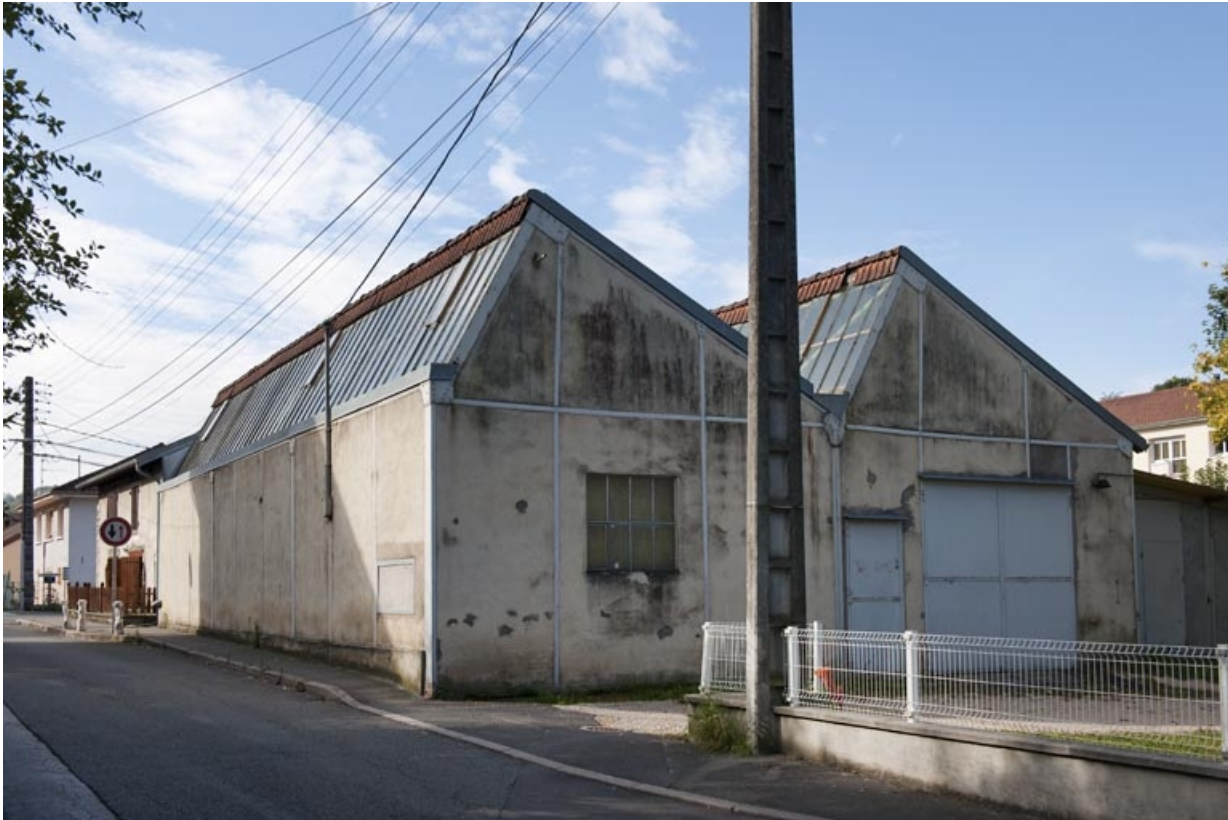
Atelier vu de trois quarts.