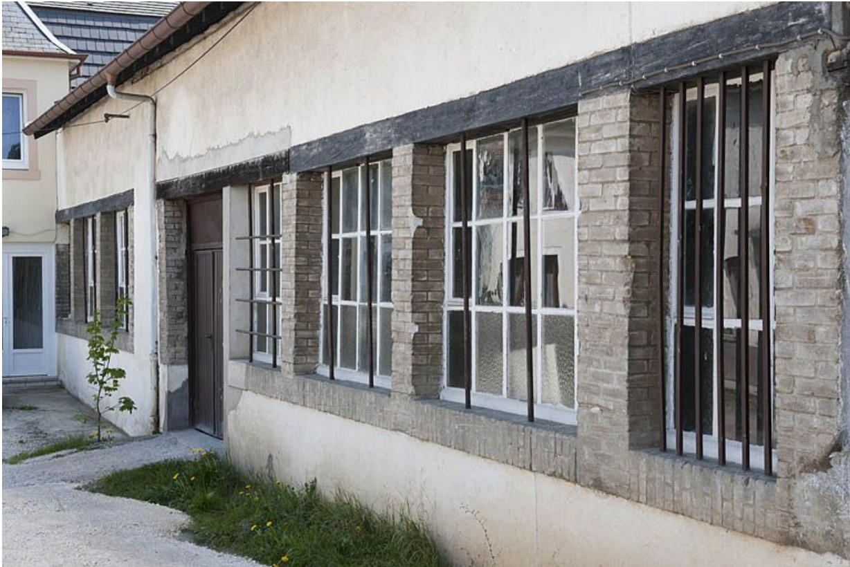
Mur nord de l'atelier de fabrication.