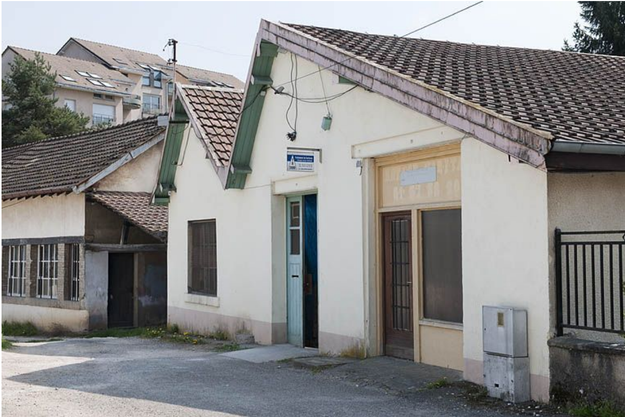
Ateliers de fabrication depuis l'ouest.