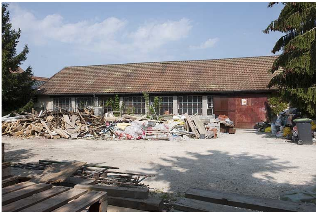
Façade sud de l'atelier de fabrication.