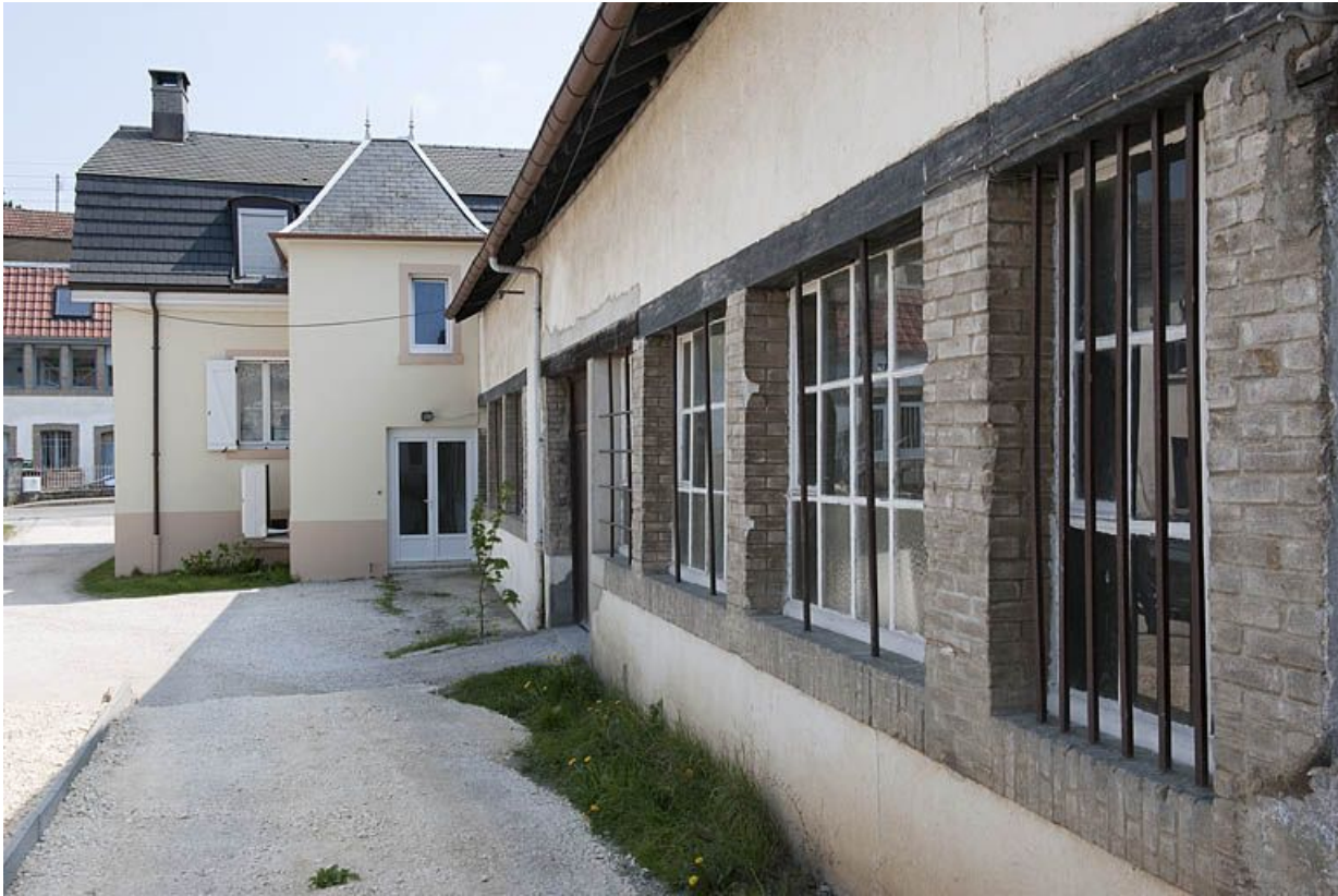
Logement et atelier de fabrication depuis l'ouest.