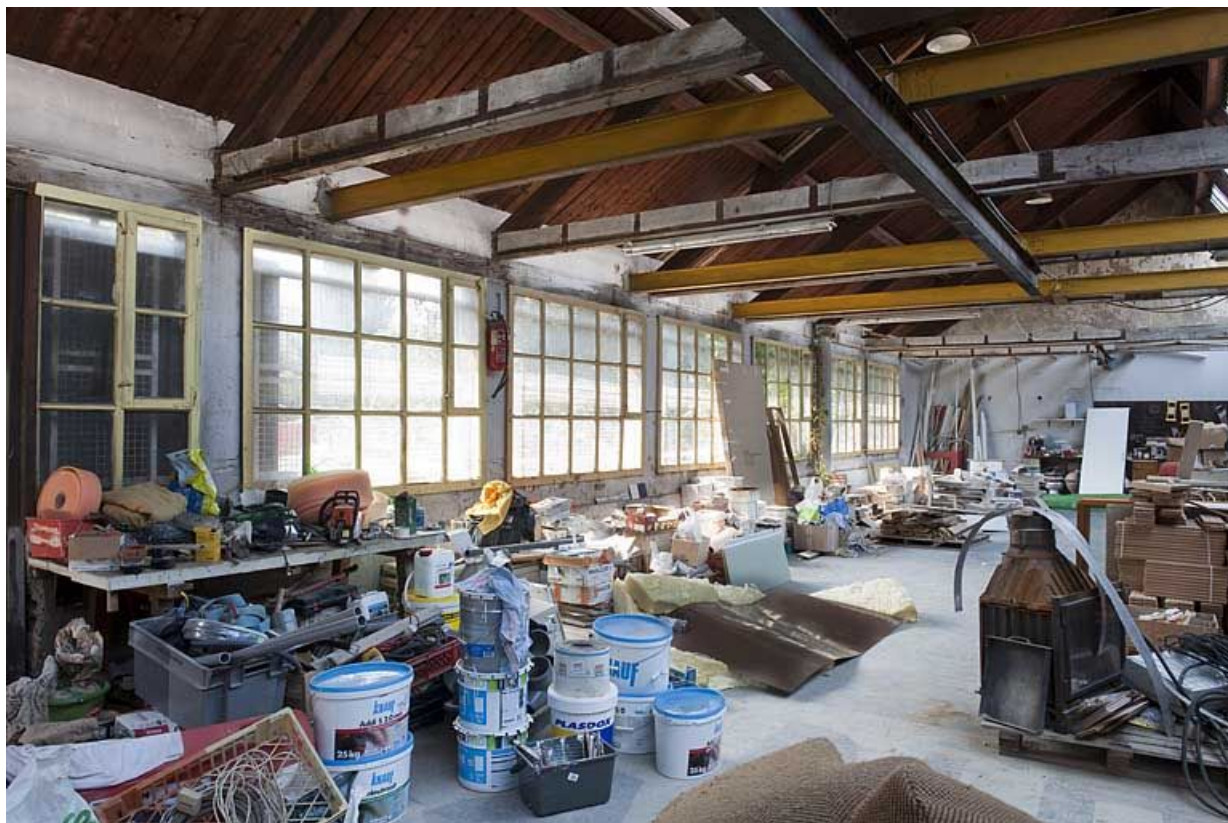
Vue intérieure de l'atelier de fabrication.