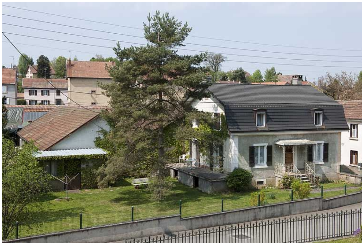
Vue d'ensemble depuis la rue des Combes.