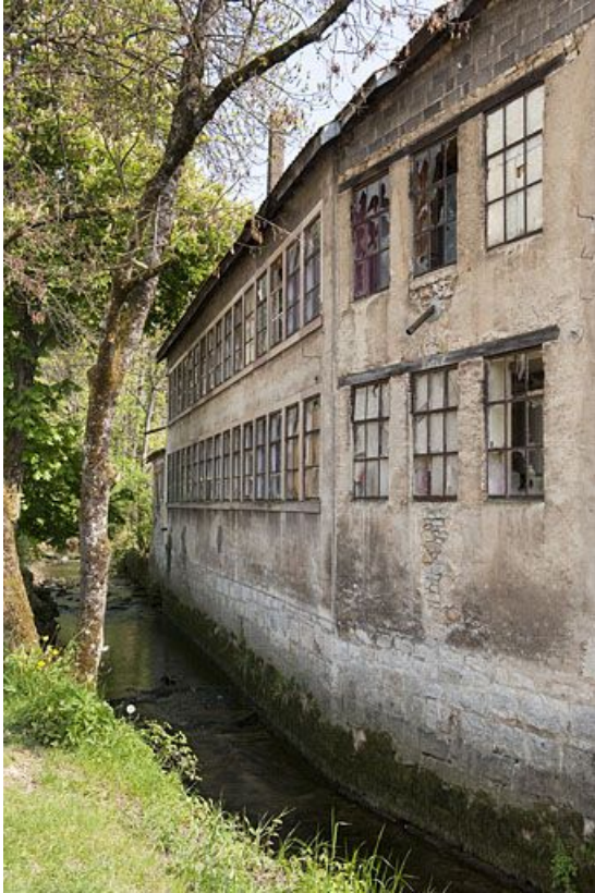
Façade postérieure vue de trois quarts.

25, Seloncourt, 60 et 64 rue du Général Leclerc