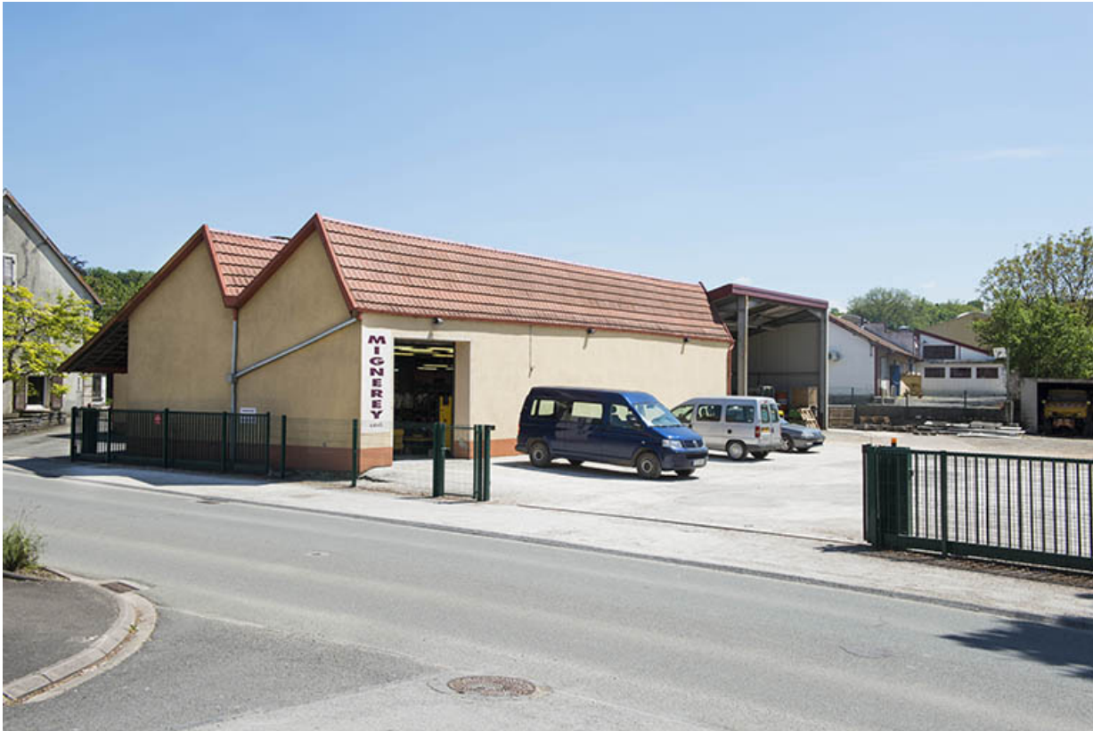
Atelier de fabrication vu de trois quarts.