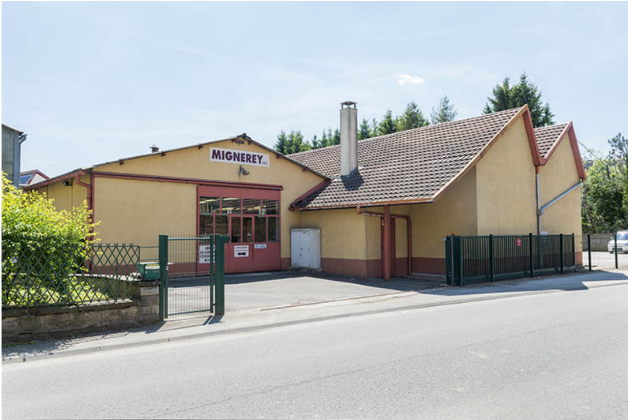
Atelier de fabrication depuis la rue.