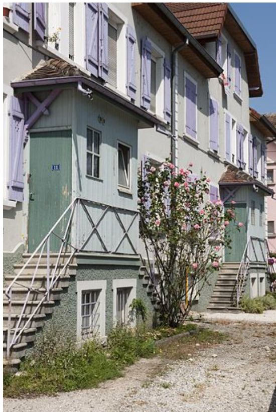
Détail de la façade antérieure de l'immeuble sud.

25, Audincourt, 3 à 41 avenue de la Gare