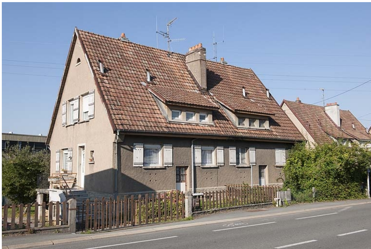
Vue de trois quarts gauche d'une maison jumelée.

25, Audincourt, 94 à 110 rue de Seloncourt