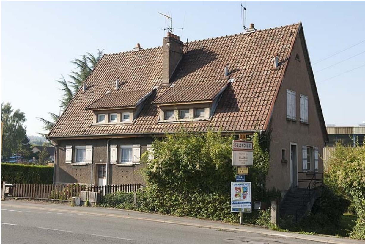
Vue de trois quarts droite d'une maison jumelée.

25, Audincourt, 94 à 110 rue de Seloncourt