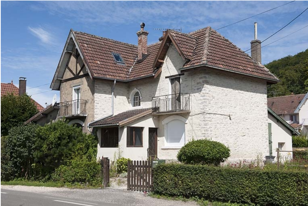
Maison de contremaîtres vue de trois quarts.