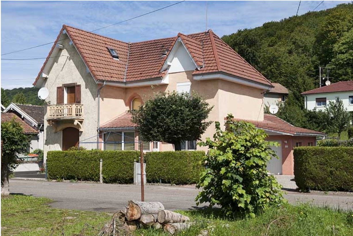
Maison de contremaîtres (n°12-14).