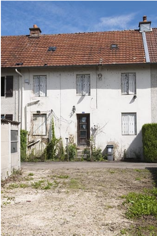
Habitation de 10 logements. Détail d'une travée.