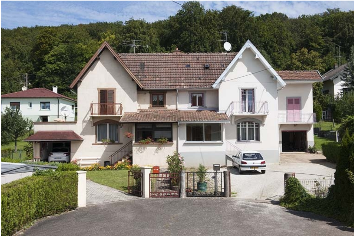
Maison de contremaîtres (n°8-10).