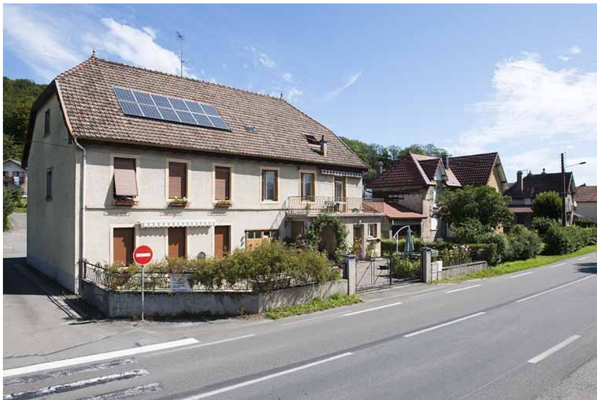
Vue d'ensemble depuis la route.