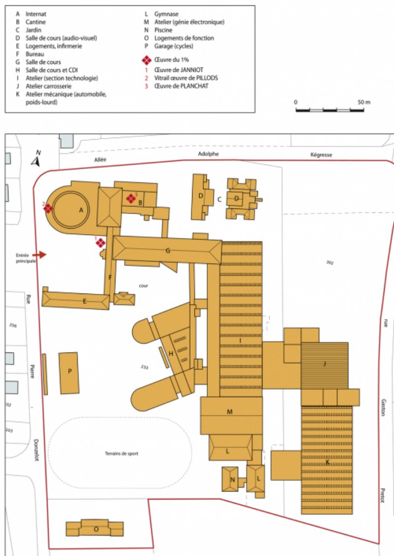
Plan-masse et de situation. Extrait du plan cadastral numérisé, sections BH et BL, échelle 1:1000. 25, Montbéliard, 1 B rue Pierre Donzelot