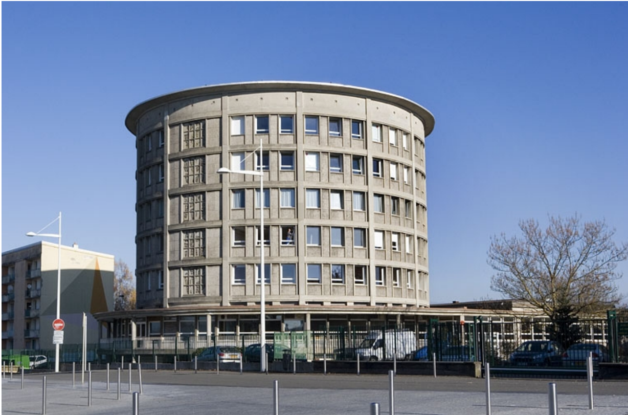
Bâtiment D. Tour internat.

25, Montbéliard, 1 B rue Pierre Donzelot