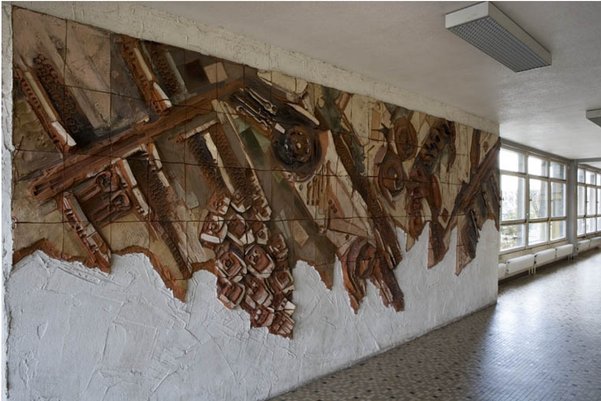
Bâtiment D. Salle de restauration. Haut-relief de Martine Planchat. 25, Montbéliard, 1 B rue Pierre Donzelot