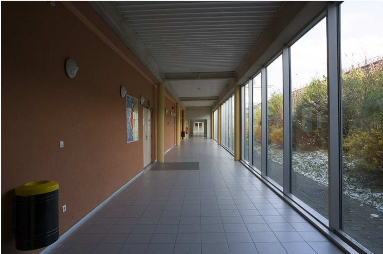
Bâtiment B. Vue couloir.

25, Montbéliard, 1 B rue Pierre Donzelot