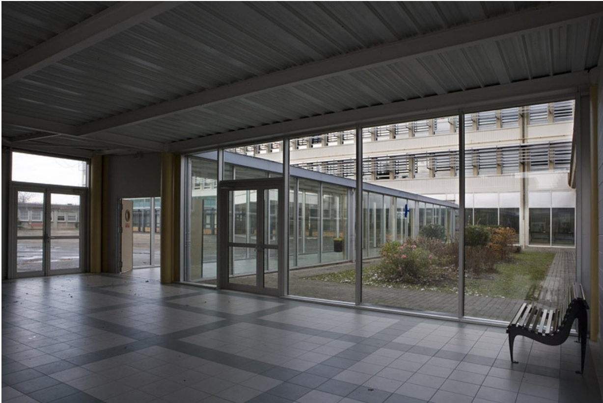
Couloir entre bâtiment A et B.

25, Montbéliard, 1 B rue Pierre Donzelot