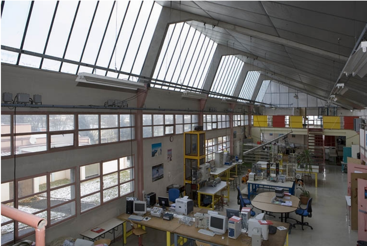
Bâtiment B. Atelier génie électronique.

25, Montbéliard, 1 B rue Pierre Donzelot