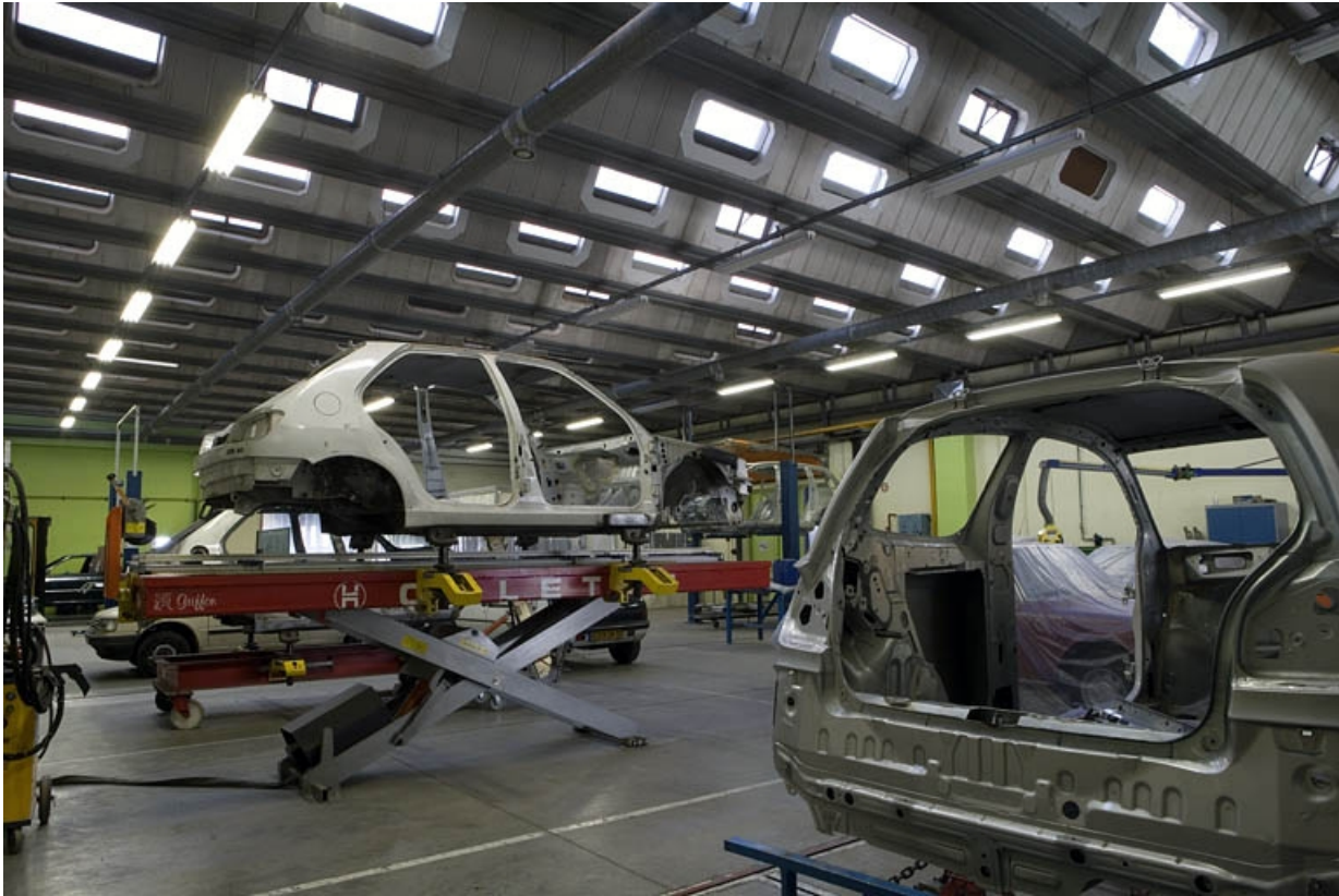
Bâtiment F. Atelier automobile. Peinture en carrosserie.

25, Montbéliard, 1 B rue Pierre Donzelot