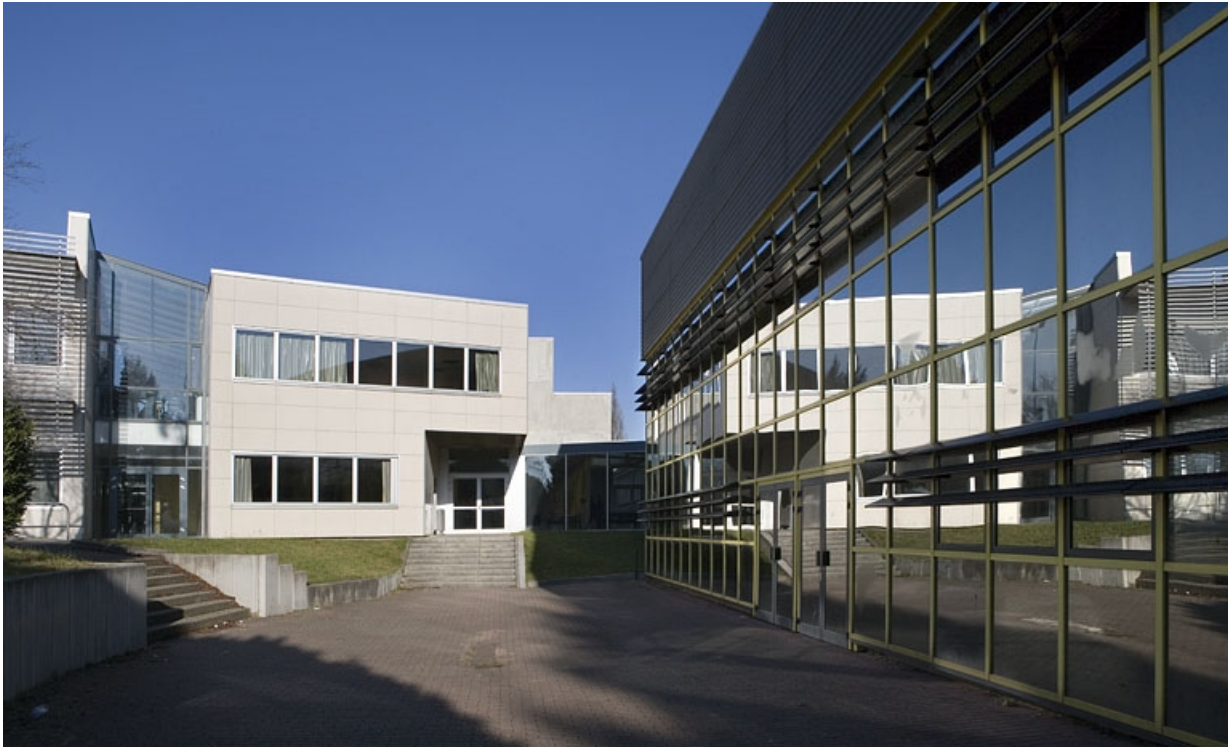
Vue de la façade antérieure bâtiment B.

25, Montbéliard, 1 B rue Pierre Donzelot