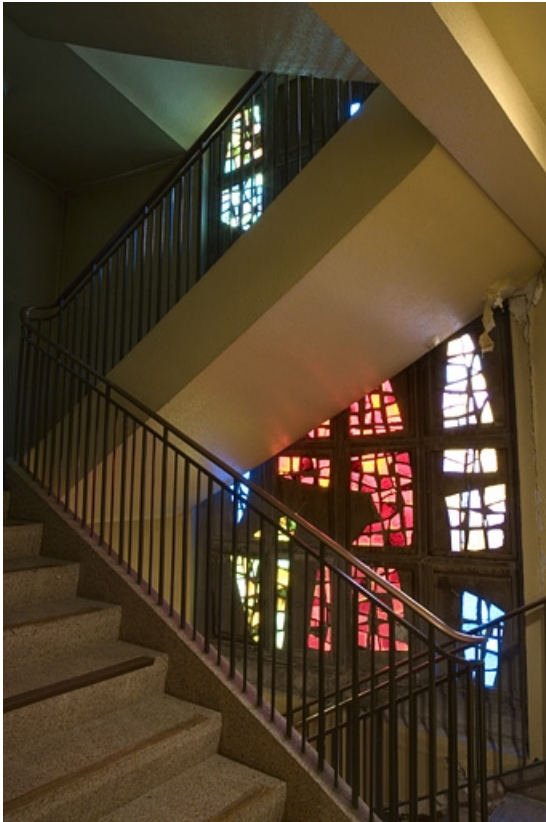
Bâtiment D : internat. Vue vitrail de Robert Pillods dans escalier de secours. 25, Montbéliard, 1 B rue Pierre Donzelot