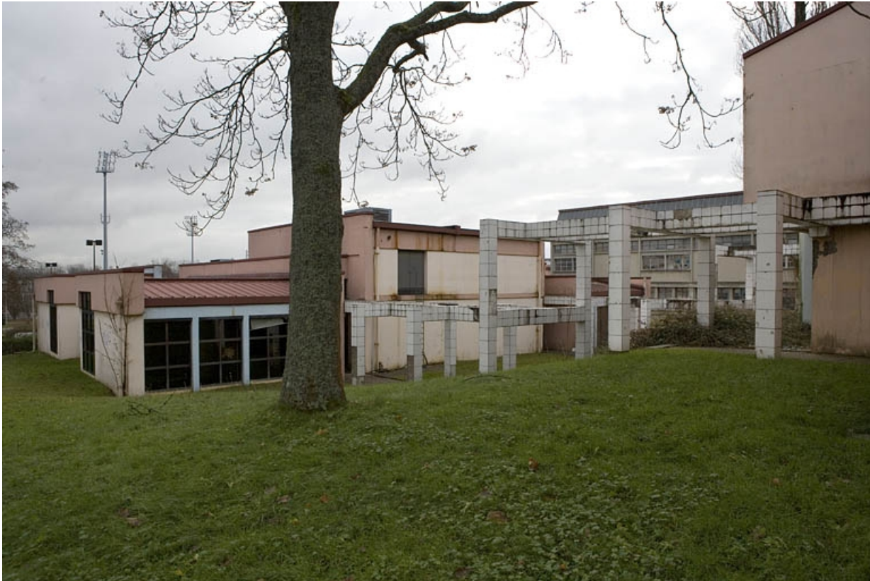
Vue de trois quarts gauche bâtiment J.

25, Montbéliard, 1 B rue Pierre Donzelot