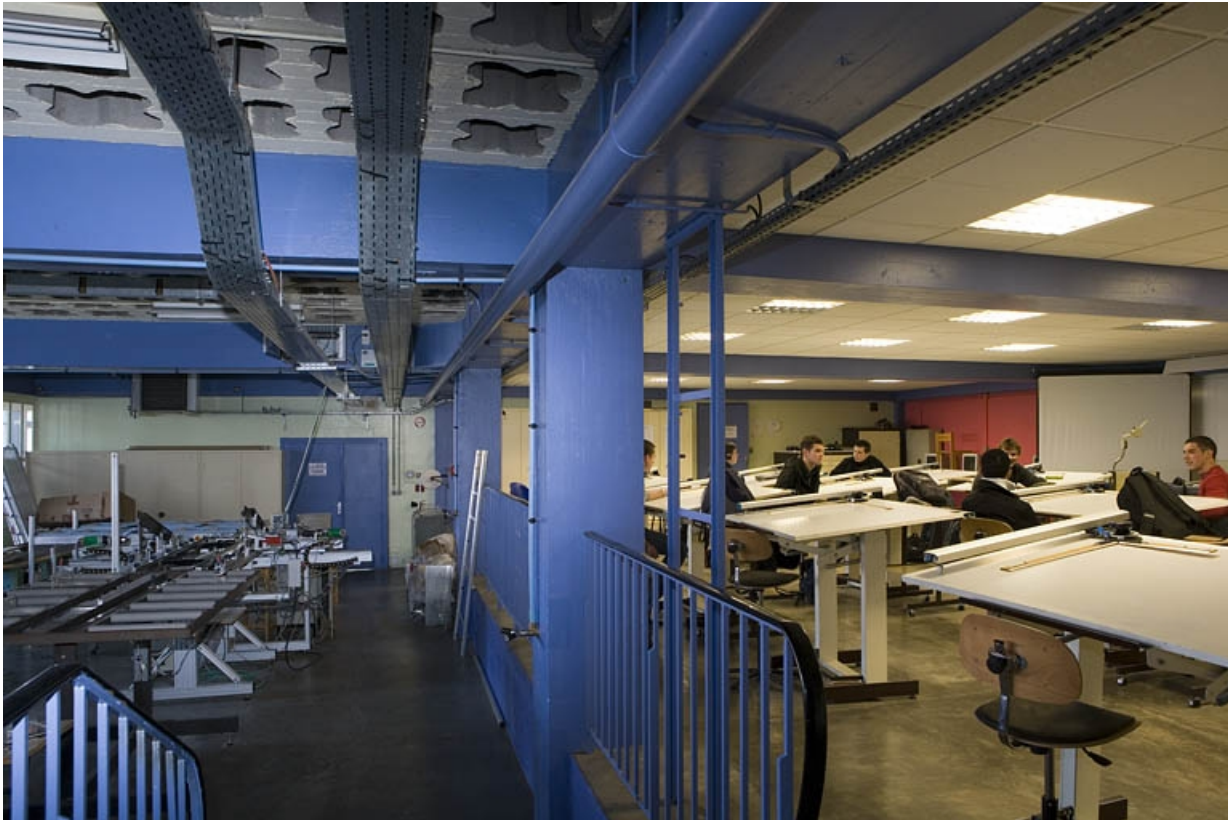
Bâtiment B. Sous-sol. Atelier mécanique et automatisme industriel.

25, Montbéliard, 1 B rue Pierre Donzelot