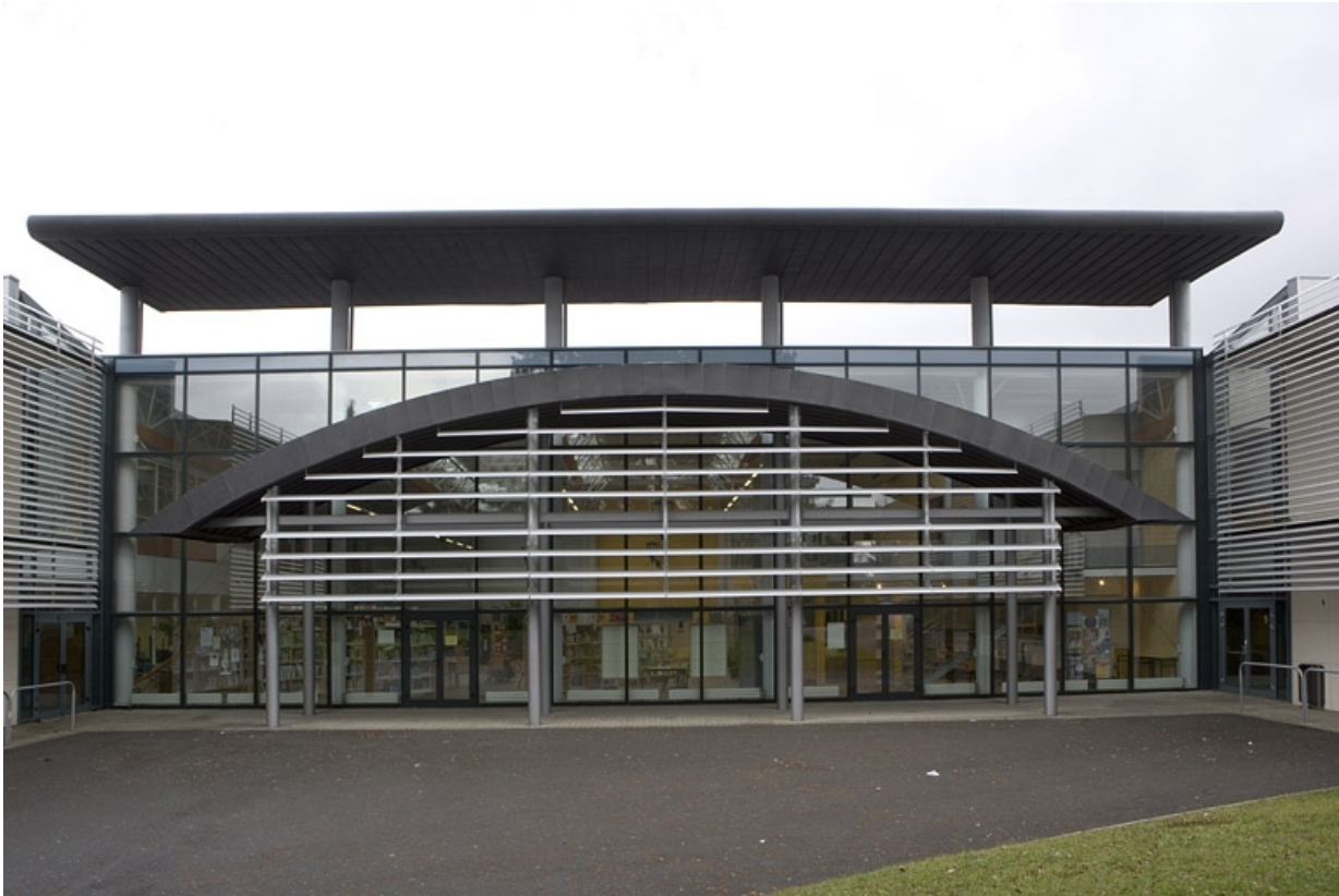
Vue façade antérieure bâtiment L.

25, Montbéliard, 1 B rue Pierre Donzelot