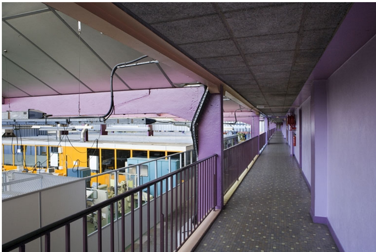
Bâtiment B. Atelier section technologique. Vue passerelle.

25, Montbéliard, 1 B rue Pierre Donzelot