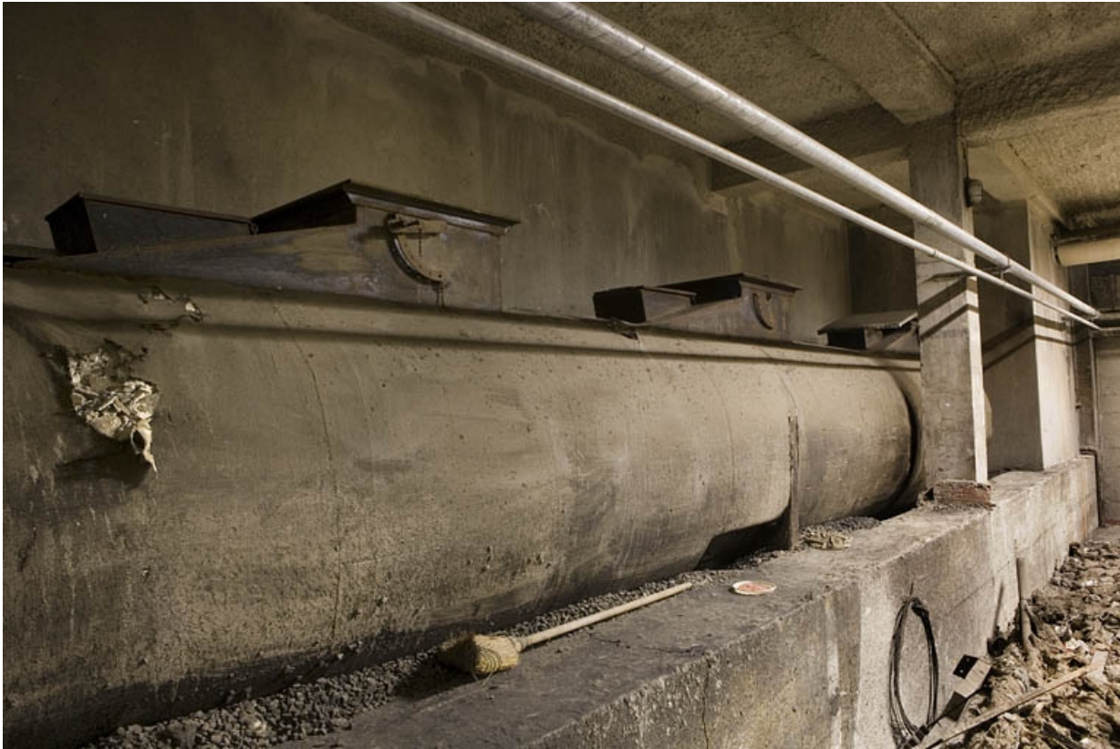
Bâtiment D. Sous-sol. Vue de l'ancienne chaudière à charbon.

25, Montbéliard, 1 B rue Pierre Donzelot