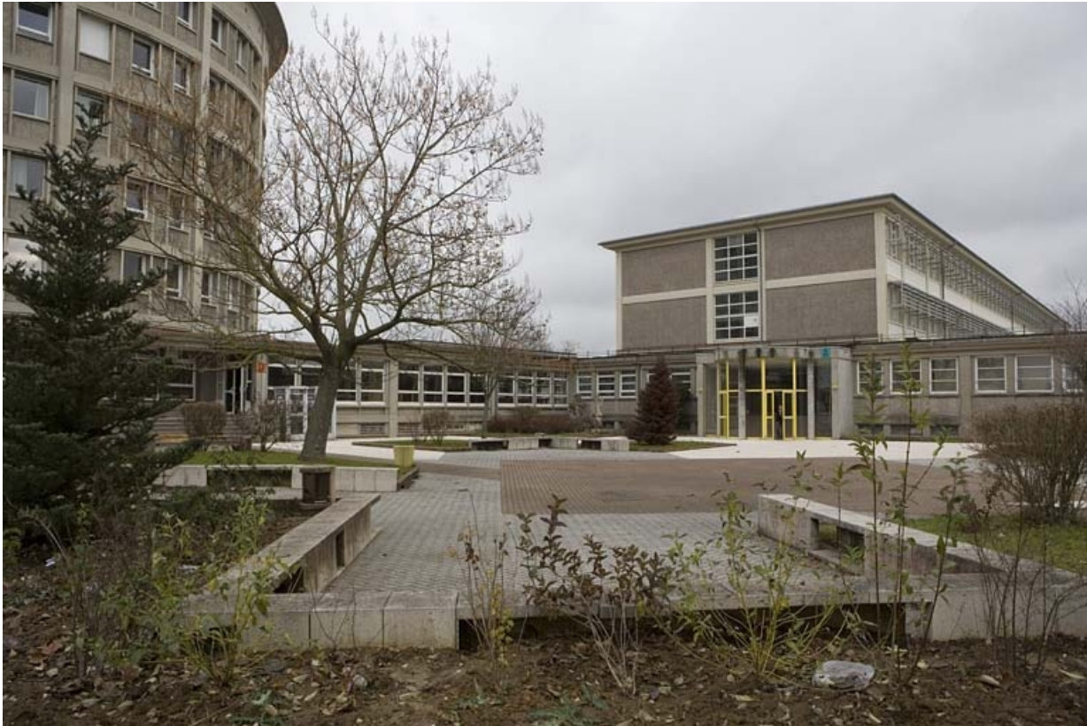
Vue entrée visiteurs.

25, Montbéliard, 1 B rue Pierre Donzelot