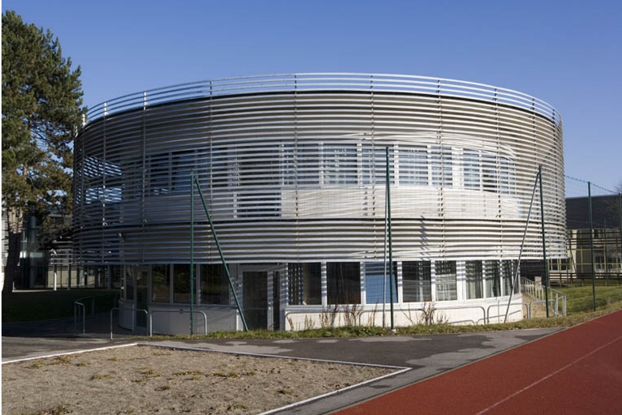
Vue de l'aile droite bâtiment L. Détail.

25, Montbéliard, 1 B rue Pierre Donzelot