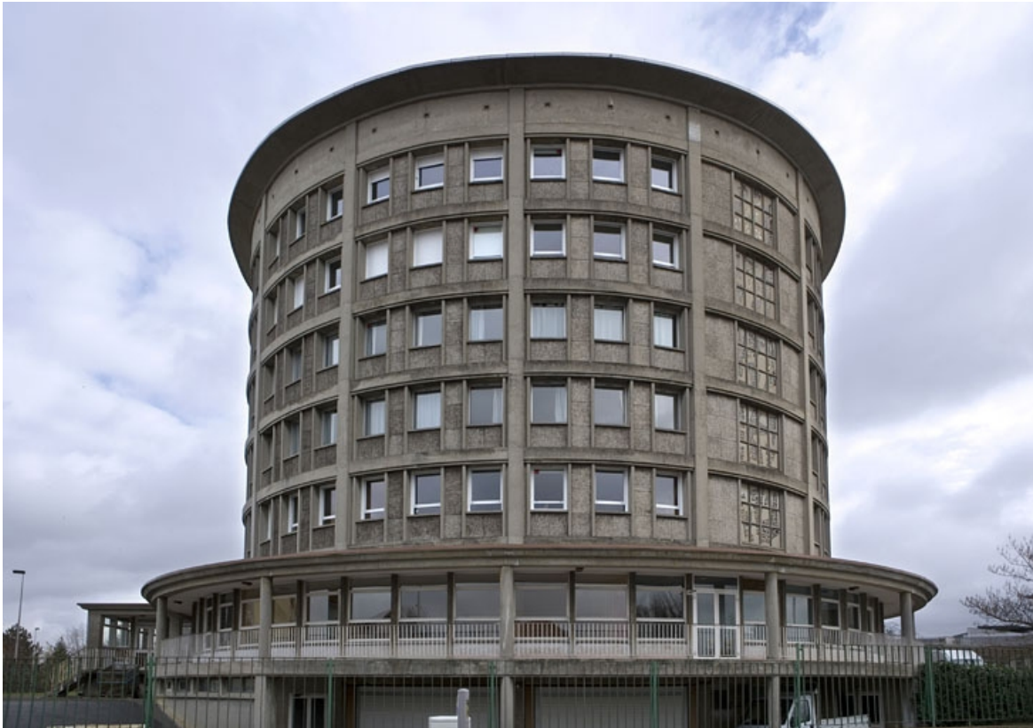
Bâtiment D. Vue de la tour d'internat.

25, Montbéliard, 1 B rue Pierre Donzelot