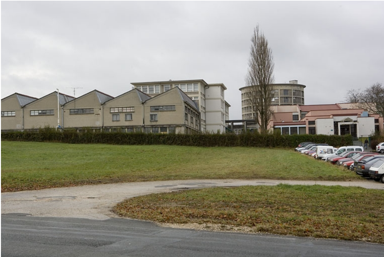
Vue d'ensemble. Façade postérieure du bâtiment B.

25, Montbéliard, 1 B rue Pierre Donzelot