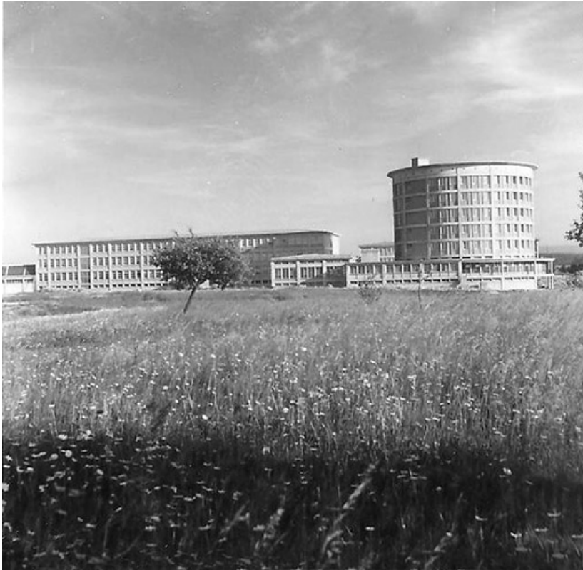
Le lycée peu après la construction (?)

25, Montbéliard, 1 B rue Pierre Donzelot