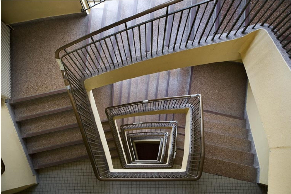
Bâtiment D : internat. Vue plongeante de l'escalier.

25, Montbéliard, 1 B rue Pierre Donzelot