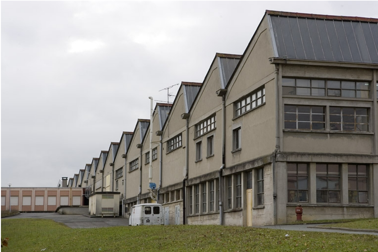
Vue de trois quarts droit bâtiment B.

25, Montbéliard, 1 B rue Pierre Donzelot