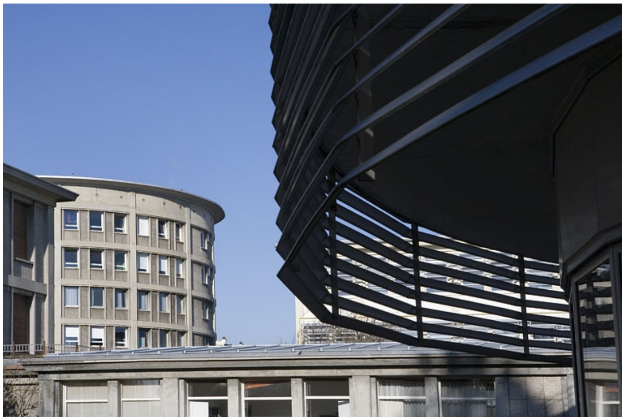
Détail architecture aile gauche bâtiment L.

25, Montbéliard, 1 B rue Pierre Donzelot