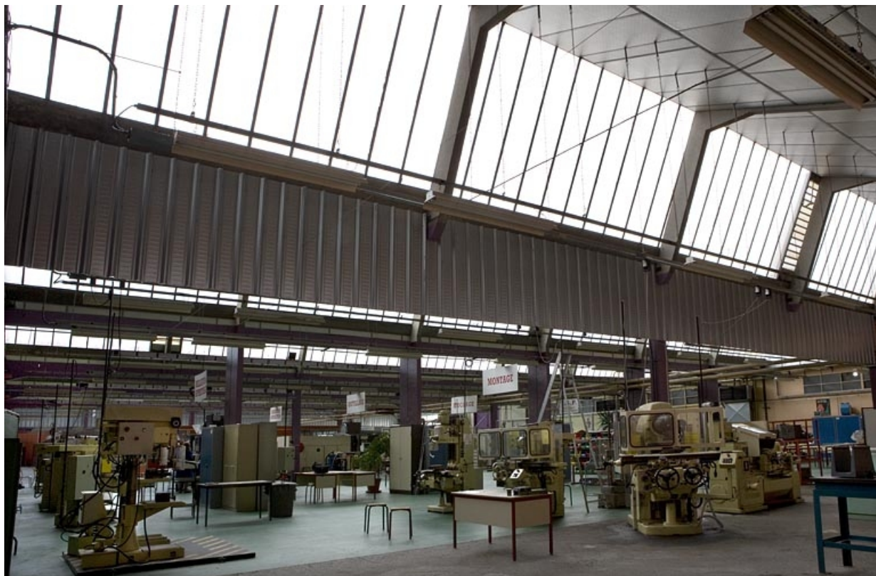
Bâtiment B. Atelier section technologique.

25, Montbéliard, 1 B rue Pierre Donzelot