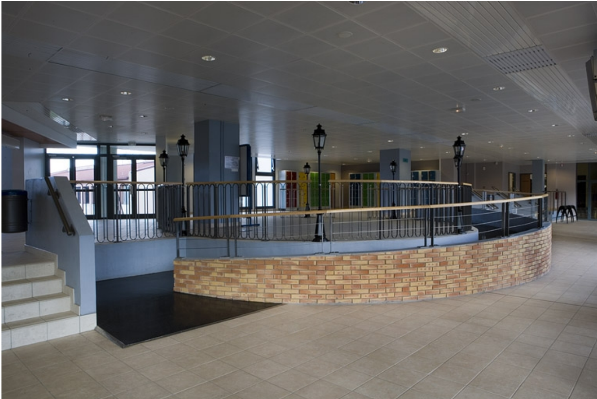
Bâtiment A. Vue du hall d'accueil. Détail.

25, Montbéliard, 1 B rue Pierre Donzelot