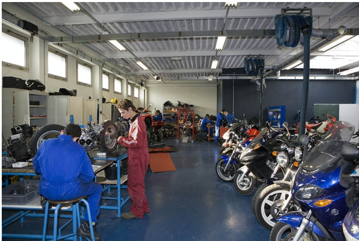
Bâtiment F. Atelier maintenance motocycles.

25, Montbéliard, 1 B rue Pierre Donzelot