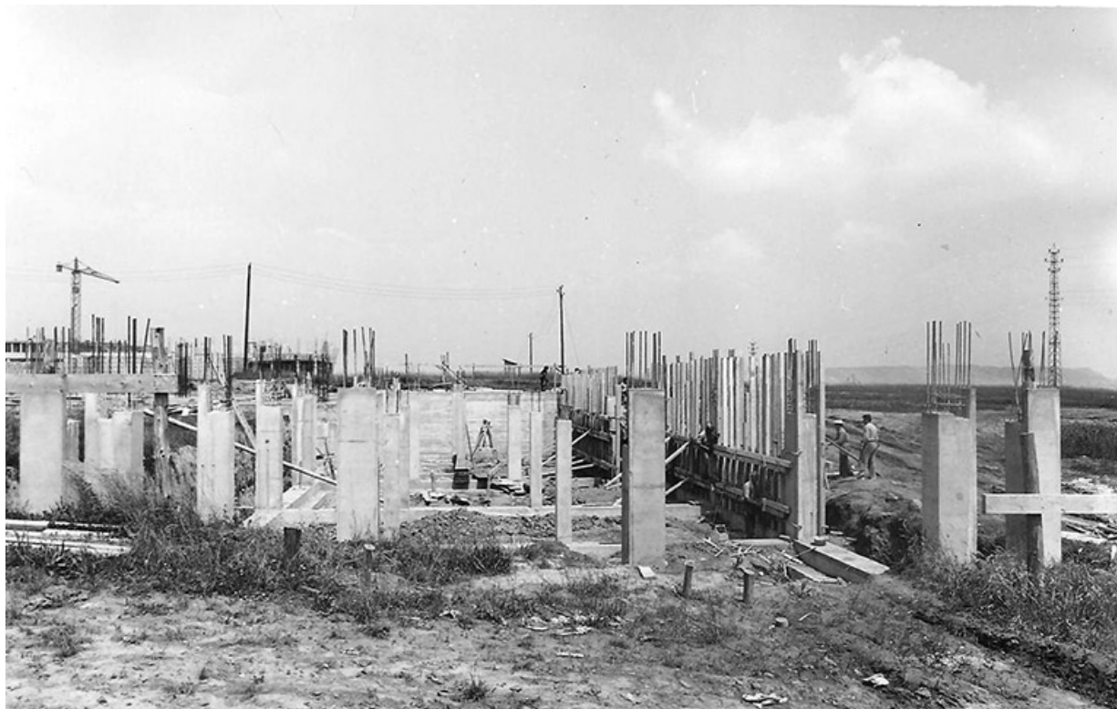
Vue du chantier de construction.

25, Montbéliard, 1 B rue Pierre Donzelot