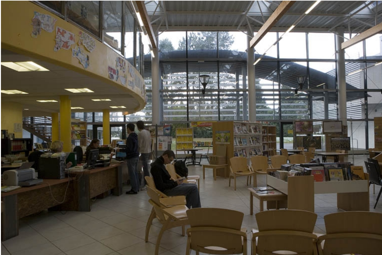
Bâtiment L. Vue intérieure du CDI.

25, Montbéliard, 1 B rue Pierre Donzelot