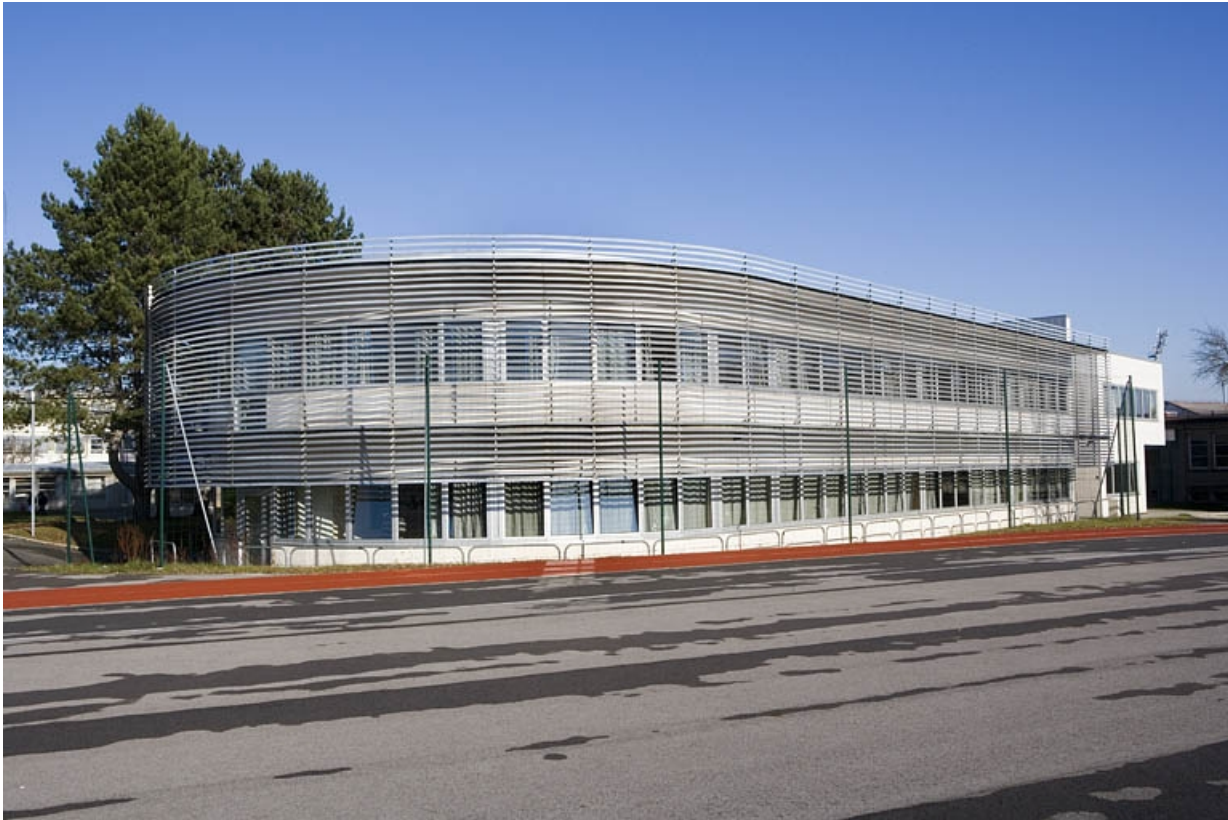
Vue de l'aile droite bâtiment L.

25, Montbéliard, 1 B rue Pierre Donzelot