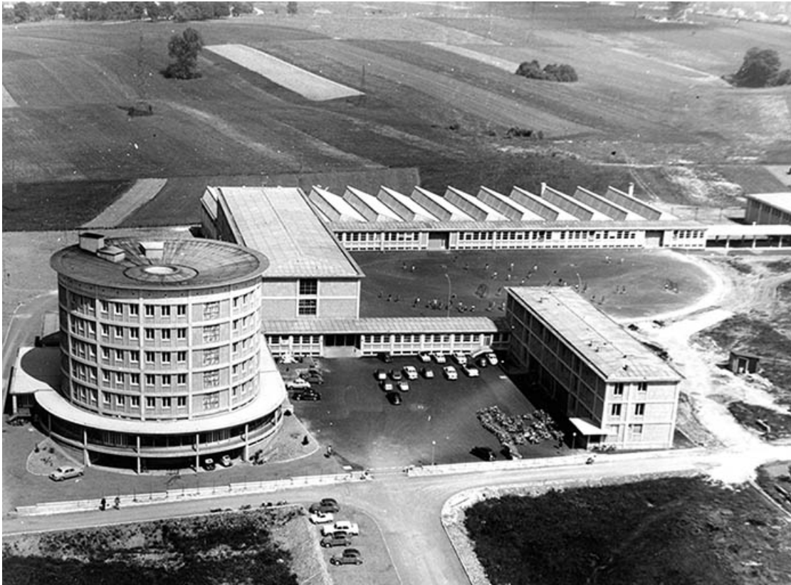
Le lycée peu après la construction (?)

25, Montbéliard, 1 B rue Pierre Donzelot