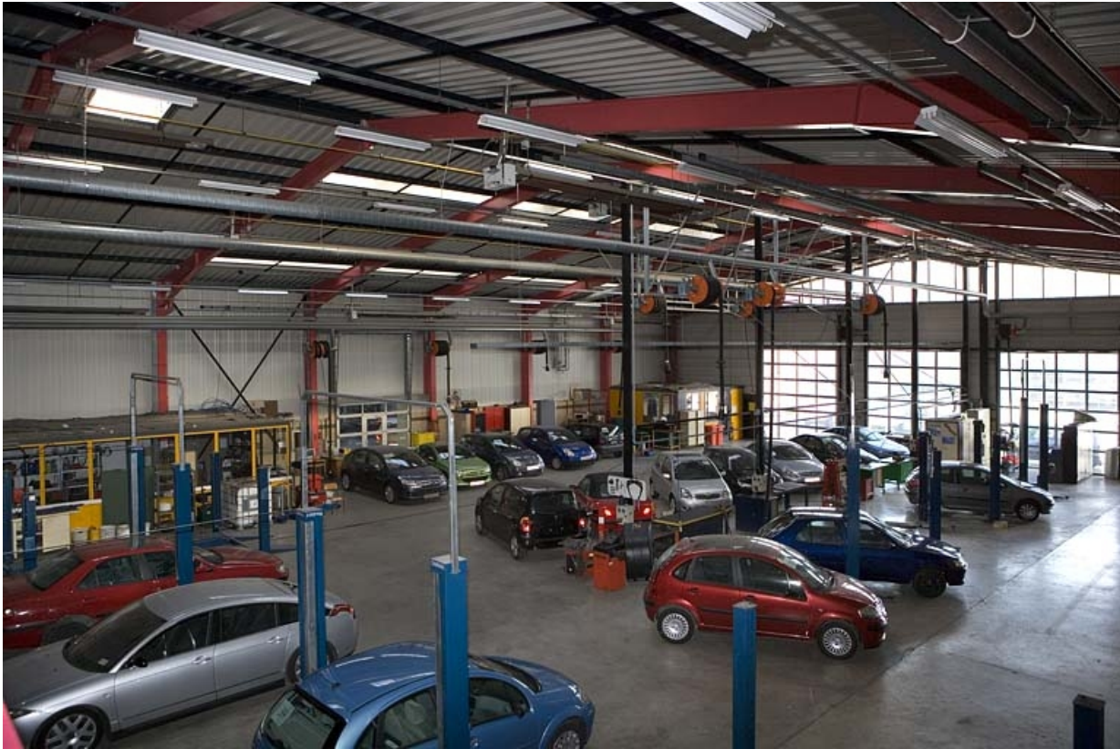
Bâtiment B. Atelier automobile.

25, Montbéliard, 1 B rue Pierre Donzelot