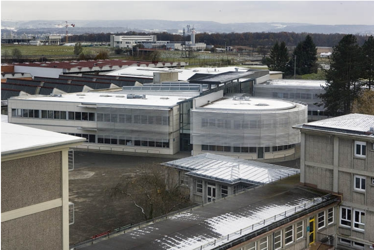
Vue d'ensemble depuis tour internat.

25, Montbéliard, 1 B rue Pierre Donzelot