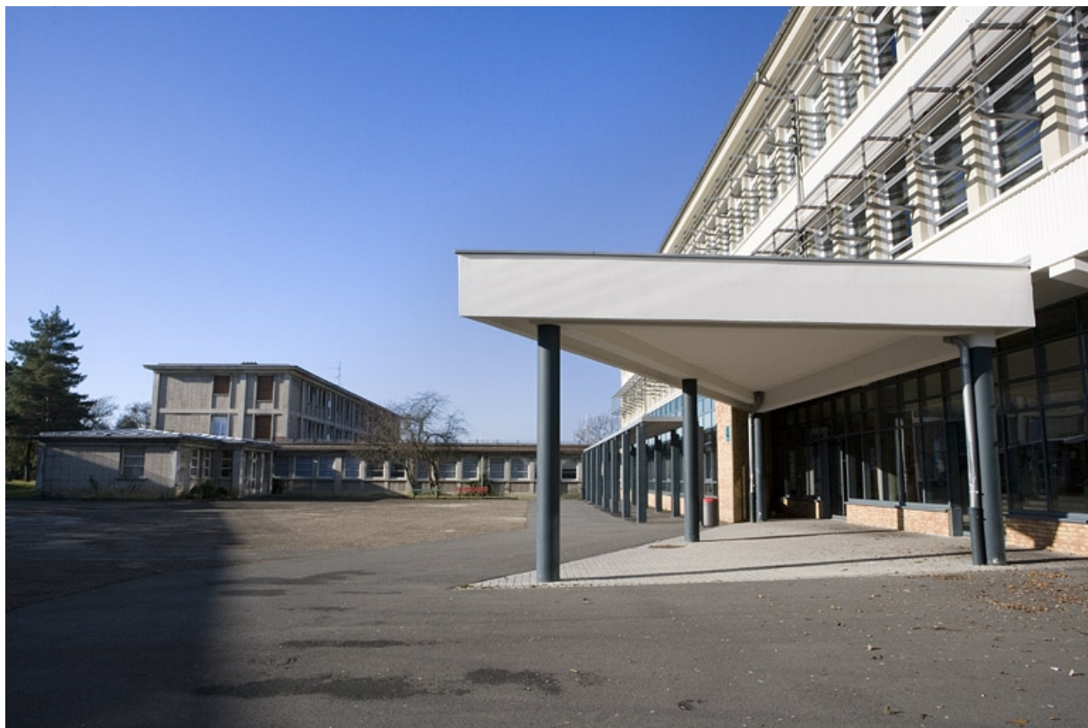
Vue façade antérieure bâtiment A et façade postérieure bâtiment C. 25, Montbéliard, 1 B rue Pierre Donzelot