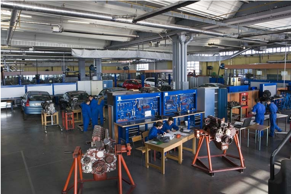
Bâtiment F. Atelier automobile. Mécanique poids lourds et carrosserie. 25, Montbéliard, 1 B rue Pierre Donzelot