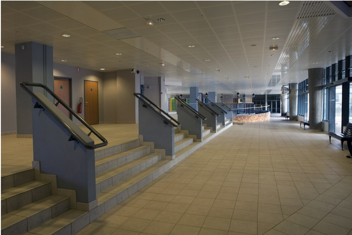
Bâtiment A. Vue du hall d'accueil.

25, Montbéliard, 1 B rue Pierre Donzelot