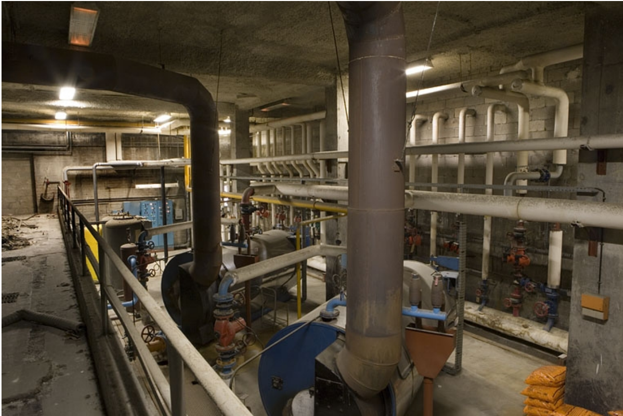
Bâtiment D. Sous-sol. Vue de la chaufferie.

25, Montbéliard, 1 B rue Pierre Donzelot