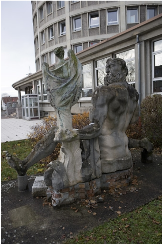
Cour de l'internat. Statue de Vulcain par Janniot.

25, Montbéliard, 1 B rue Pierre Donzelot