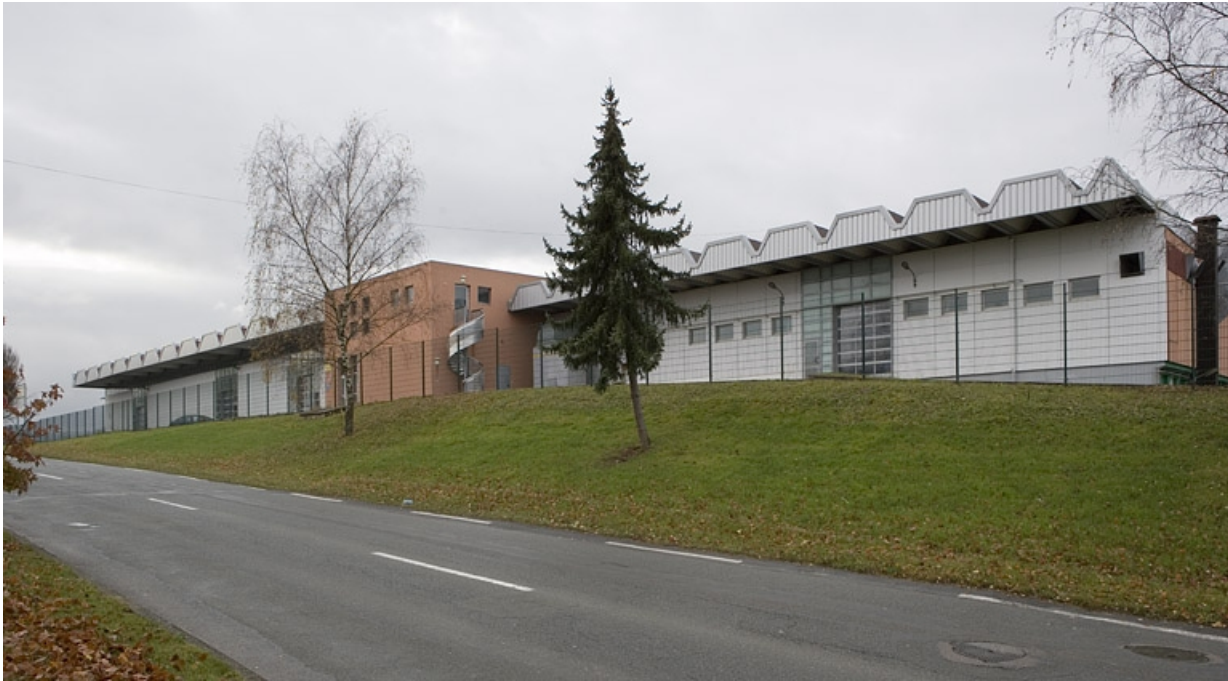
Vue façade postérieure bâtiment F.

25, Montbéliard, 1 B rue Pierre Donzelot