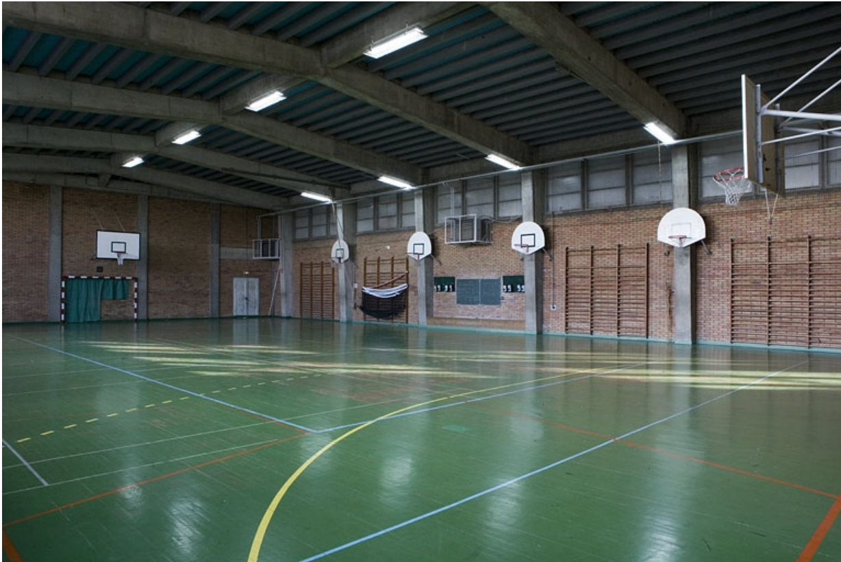
Bâtiment G. Vue intérieure du grand gymnase.

25, Montbéliard, 1 B rue Pierre Donzelot