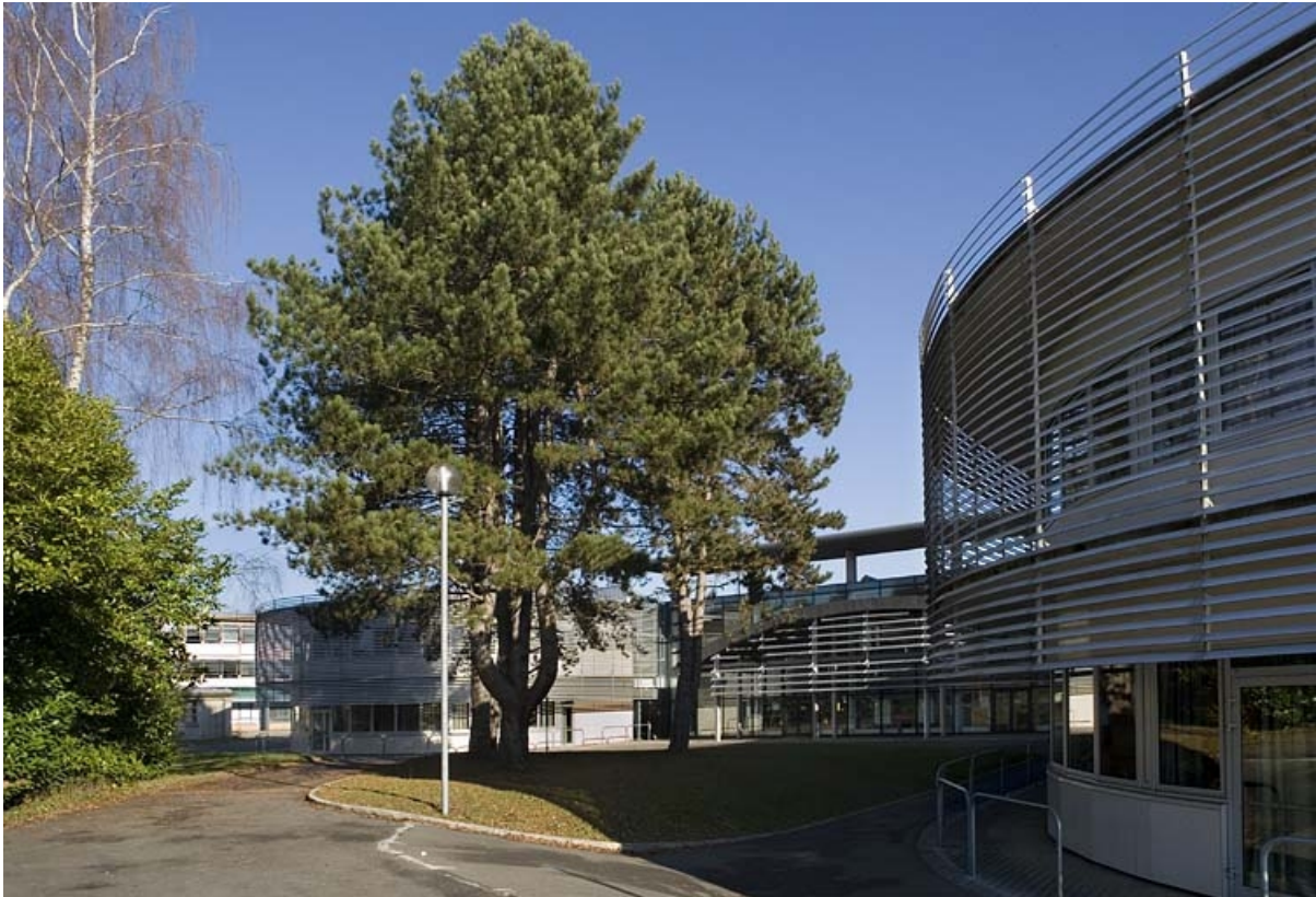
Vue de trois quarts droit bâtiment L.

25, Montbéliard, 1 B rue Pierre Donzelot