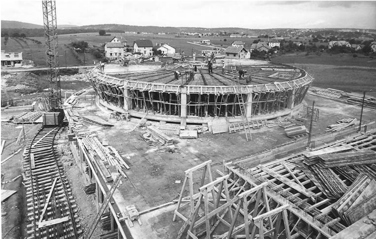
Vue du chantier de construction.

25, Montbéliard, 1 B rue Pierre Donzelot