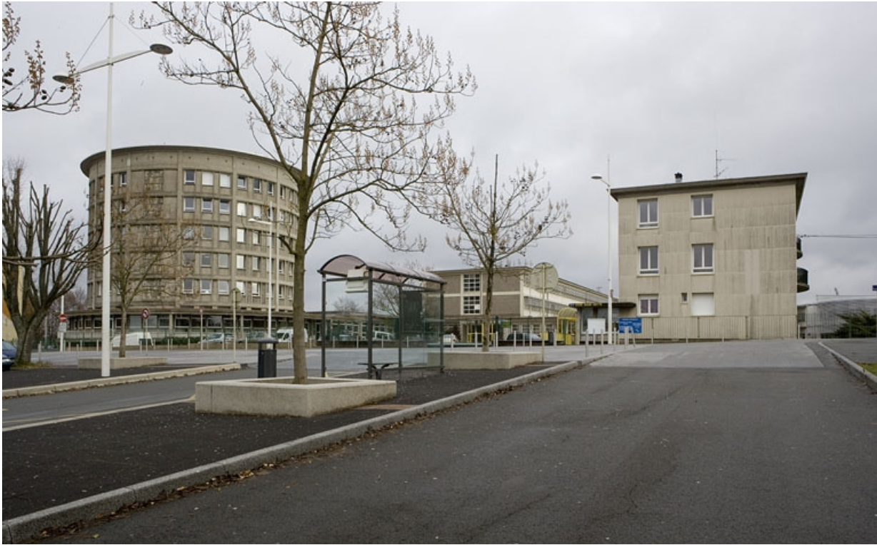
Vue d'ensemble côté entrée.

25, Montbéliard, 1 B rue Pierre Donzelot