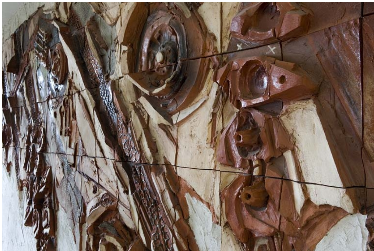
Bâtiment D. Détail haut-relief de Martine Planchat.

25, Montbéliard, 1 B rue Pierre Donzelot