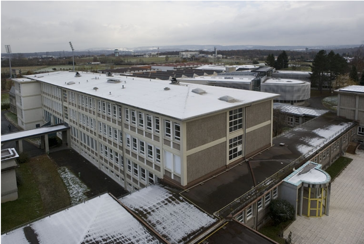
Vue d'ensemble depuis la tour d'internat.

25, Montbéliard, 1 B rue Pierre Donzelot