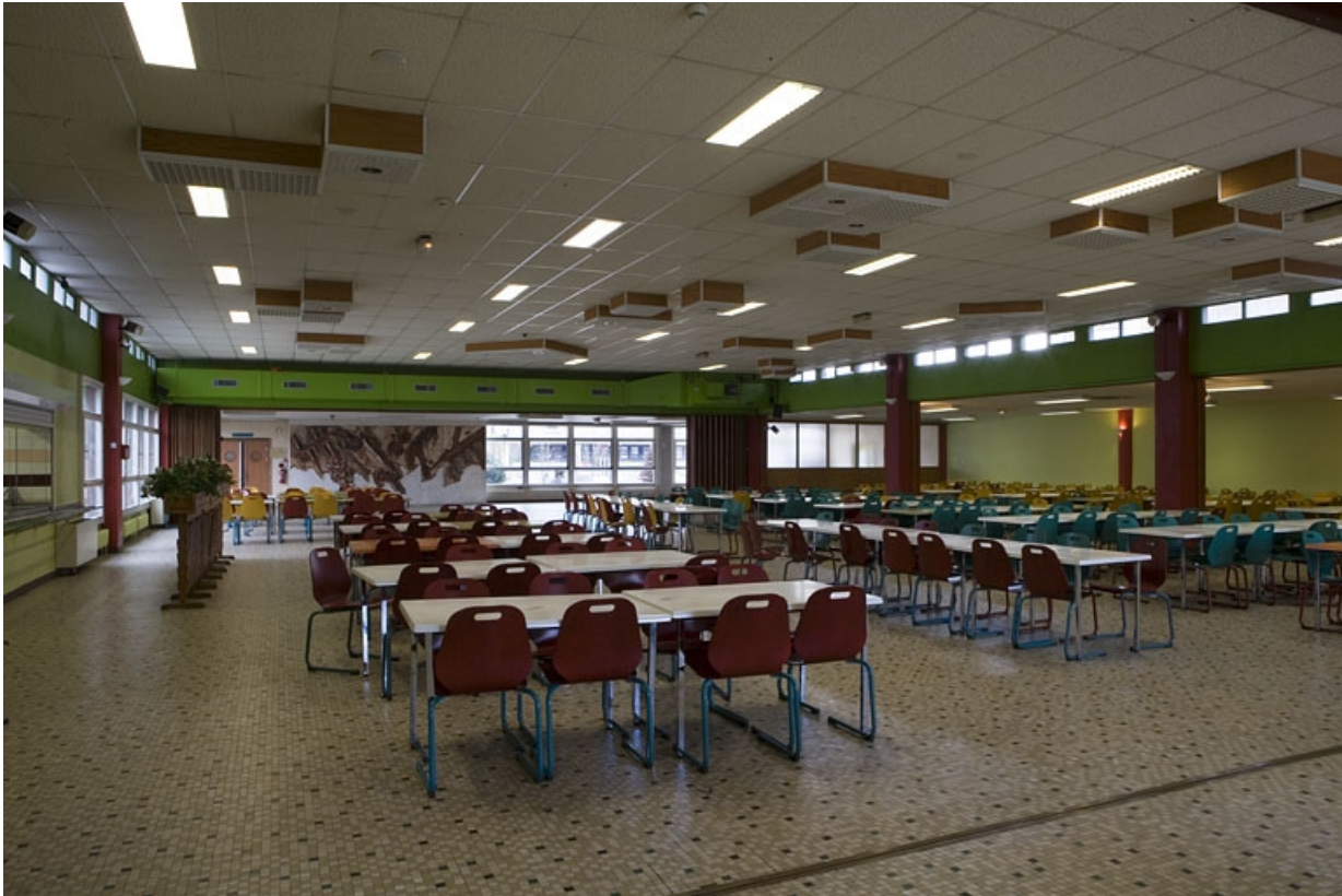
Bâtiment D. Vue salle de restauration.

25, Montbéliard, 1 B rue Pierre Donzelot