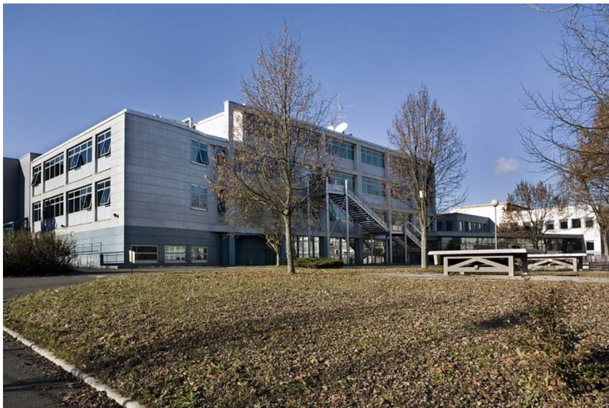
Bâtiment B. Vue de trois quarts gauche de la façade postérieure.