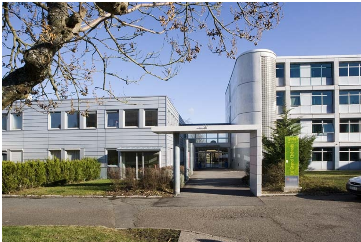
Vue de l'entrée principale.