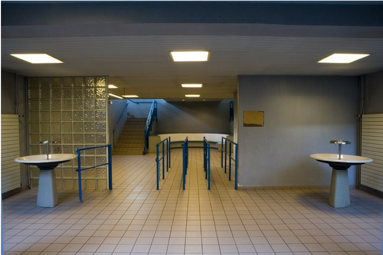
Bâtiment R. Vue de l'entrée à la salle de restauration.