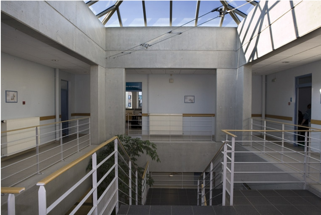
Bâtiment A. Vue de l'escalier de distribution.