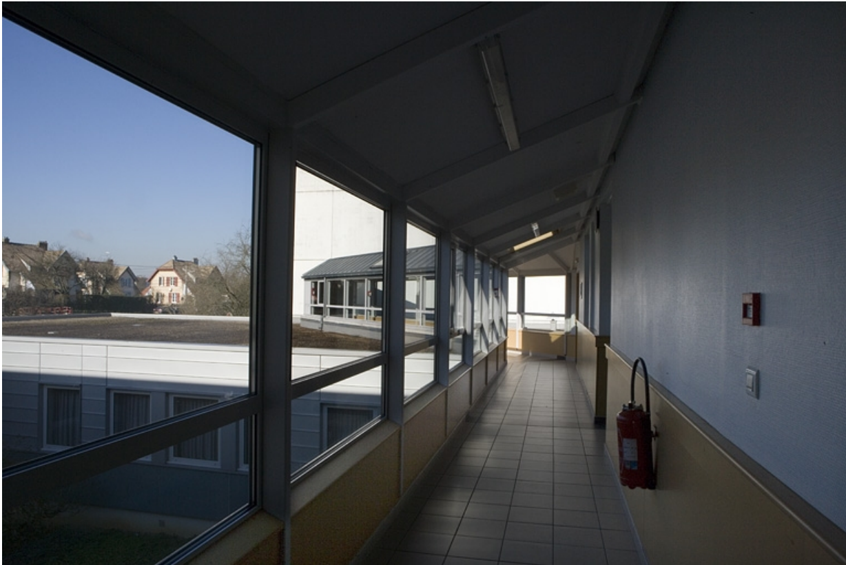
Bâtiment A. Vue de la passerelle.