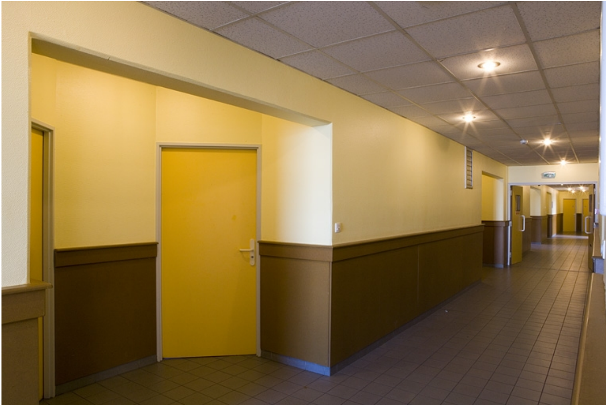
Bâtiment B. Vue du couloir.