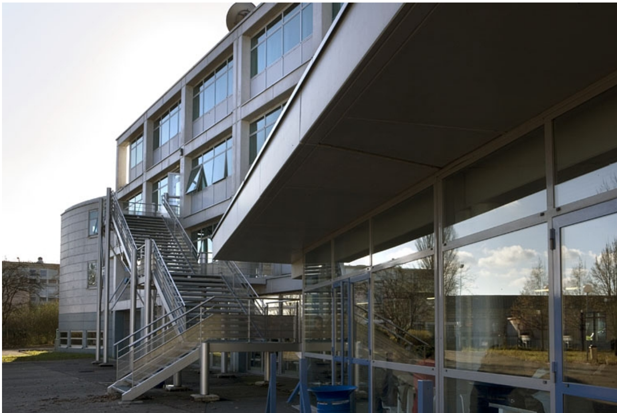
Bâtiment B. Vue latérale de la façade postérieure.