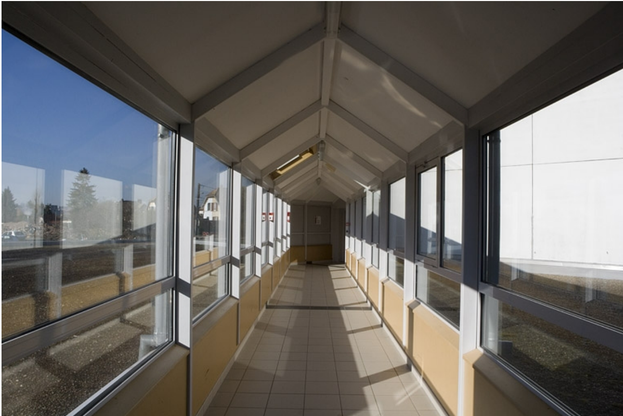
Vue de la passerelle entre les bâtiments A et D.