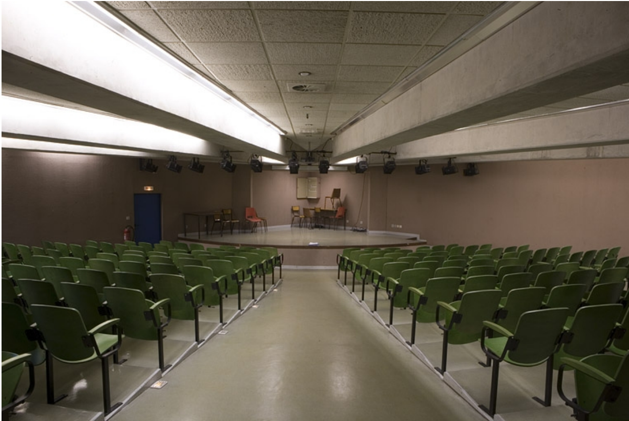
Bâtiment B. Vue de l'amphithéâtre.