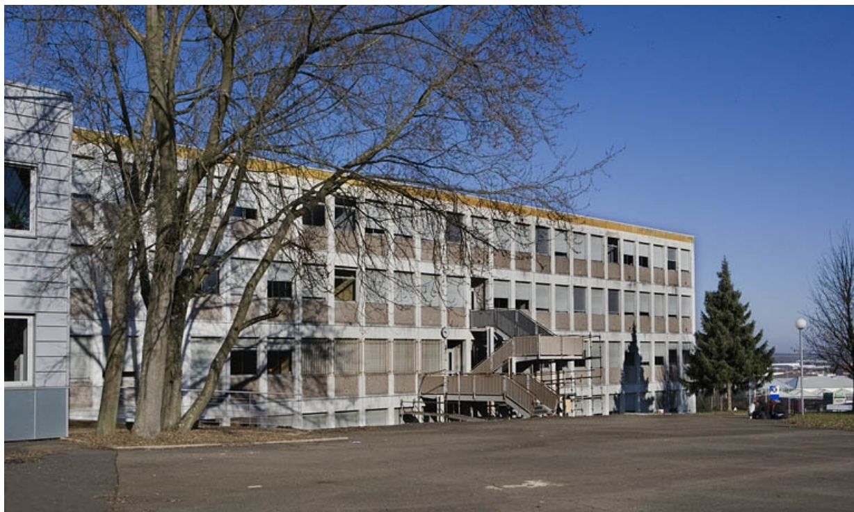
Bâtiment C. Vue de la façade antérieure.