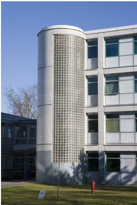
Bâtiment B. Détail de la travée d'escalier.