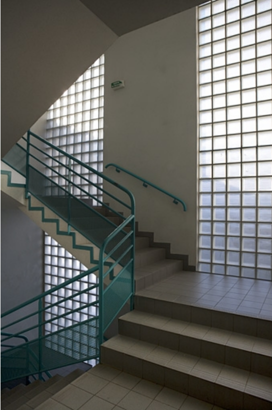
Bâtiment B. Vue intérieure de la travée d'escalier.