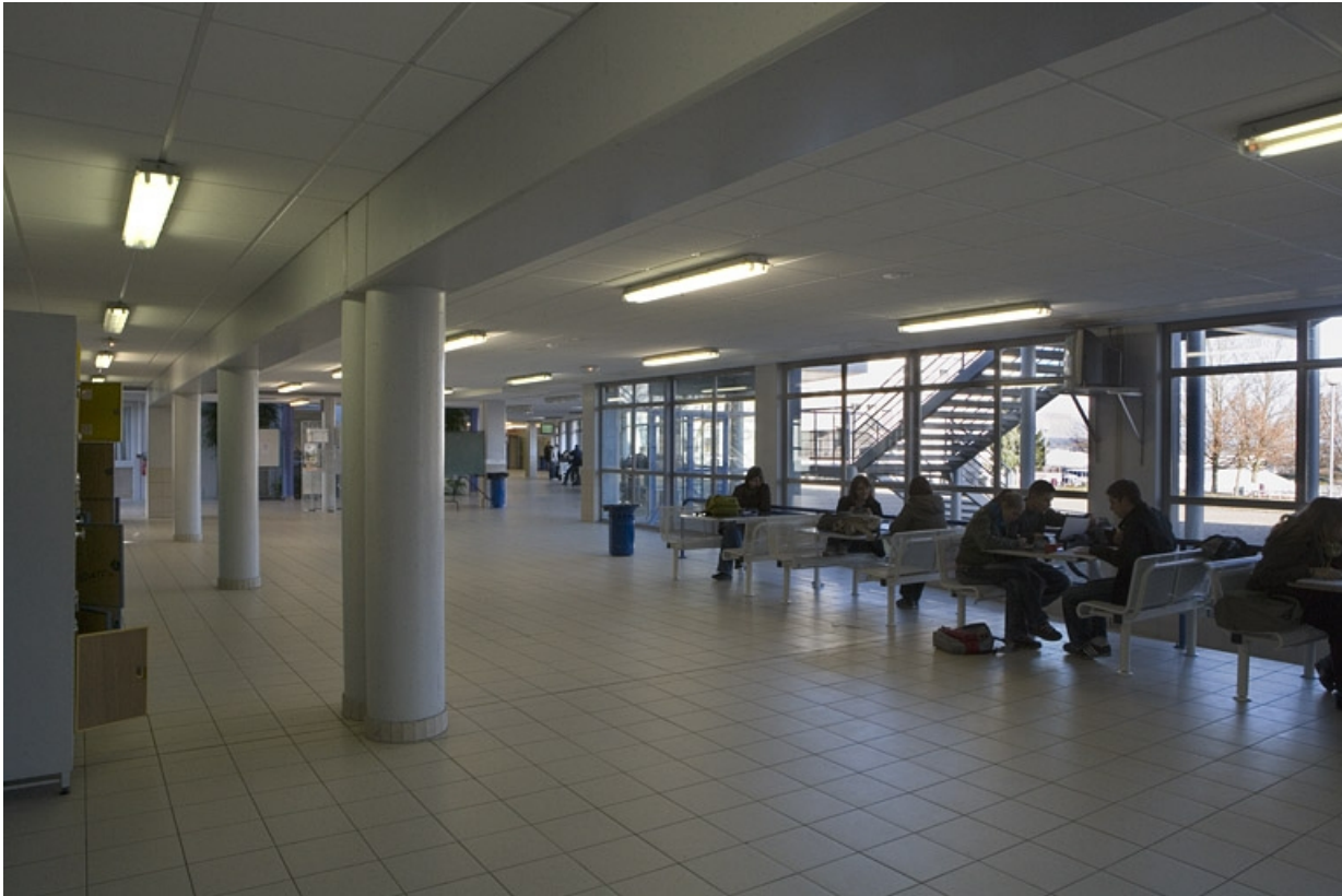
Bâtiment B. Vue du préau couvert.