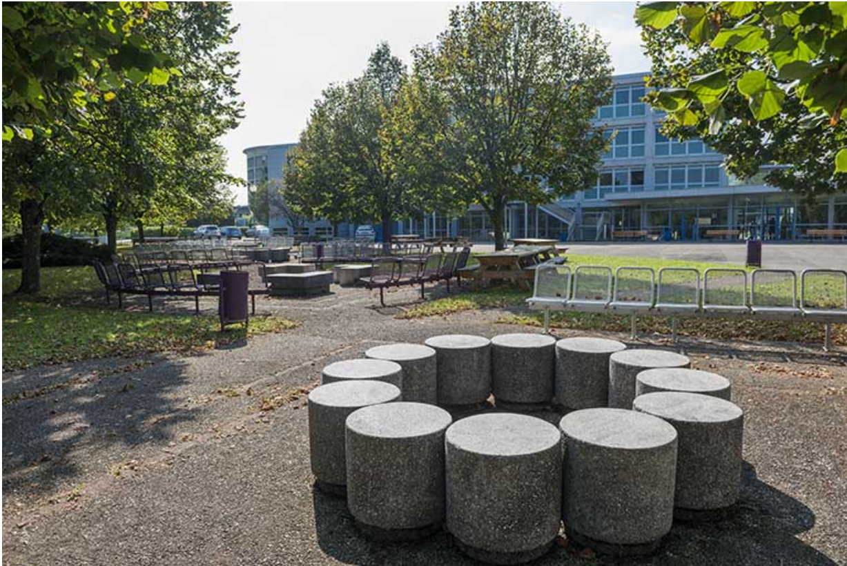
L'oeuvre dans son contexte, vue de l'est. 25, Montbéliard rue Pierre Donzelot