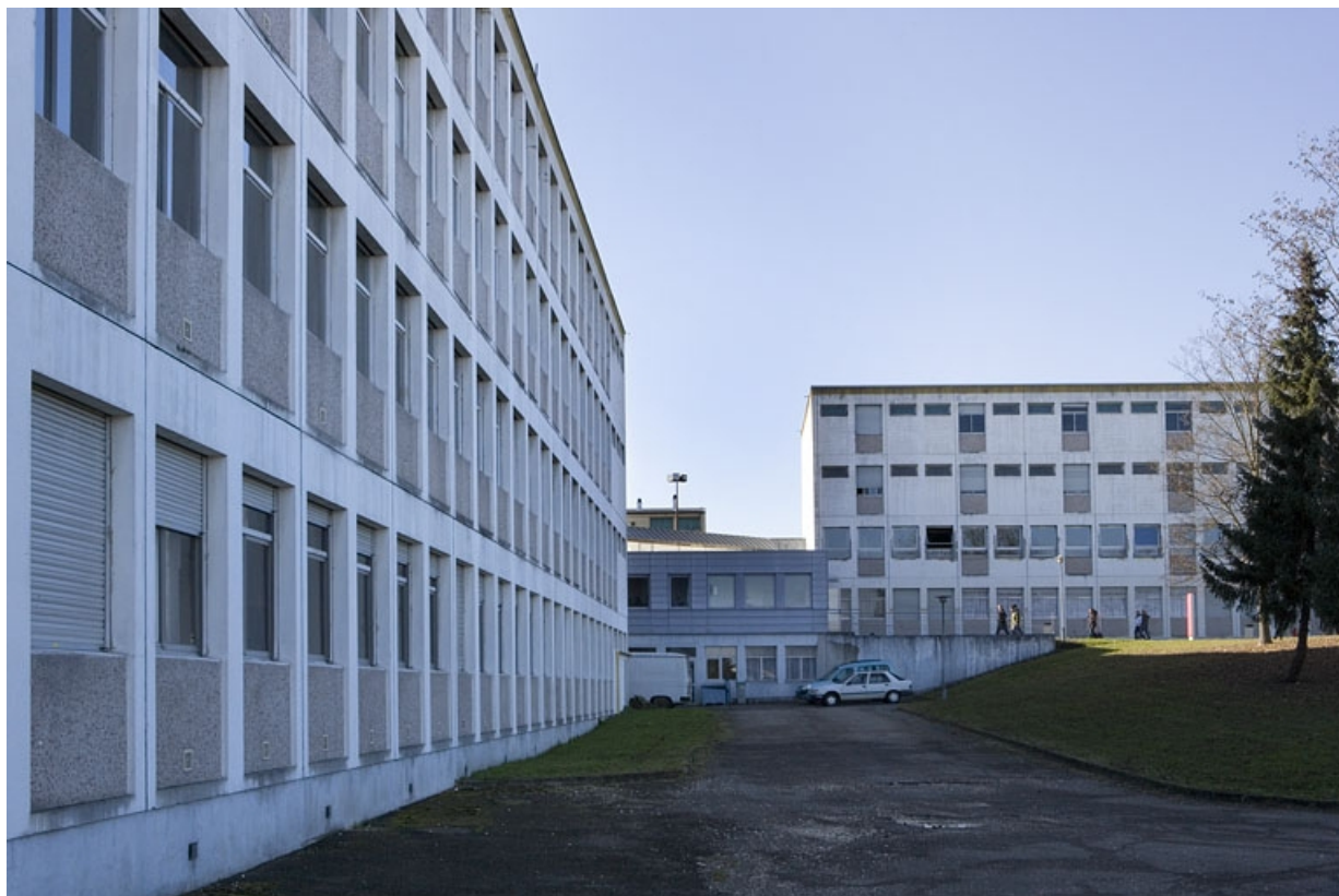
Bâtiment C et D. Vue des façades postérieures. 25, Montbéliard rue Pierre Donzelot