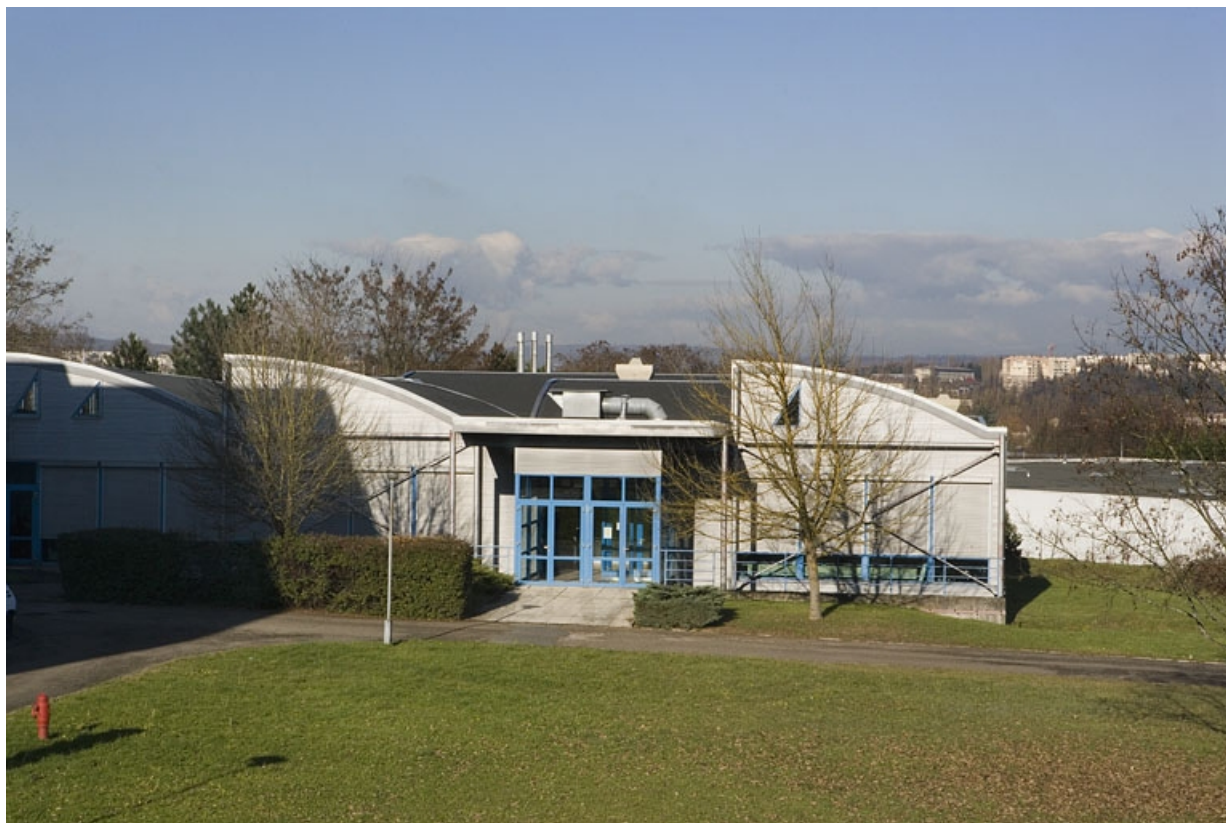
Vue du bâtiment R depuis la passerelle du bâtiment A.