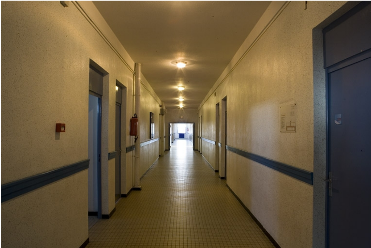
Bâtiment C. Vue du couloir.