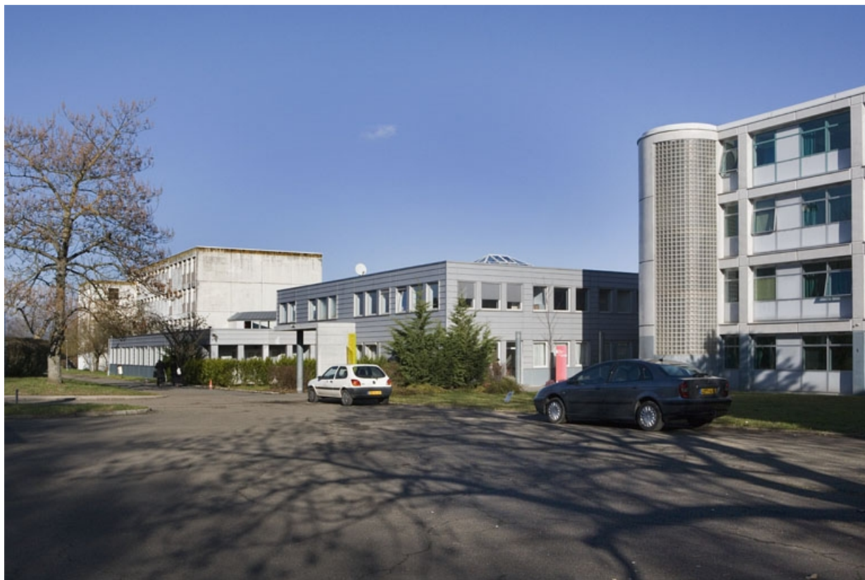
Vue d'ensemble depuis l'entrée principale.