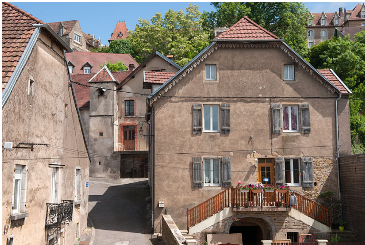
Façade côté Grande Rue.