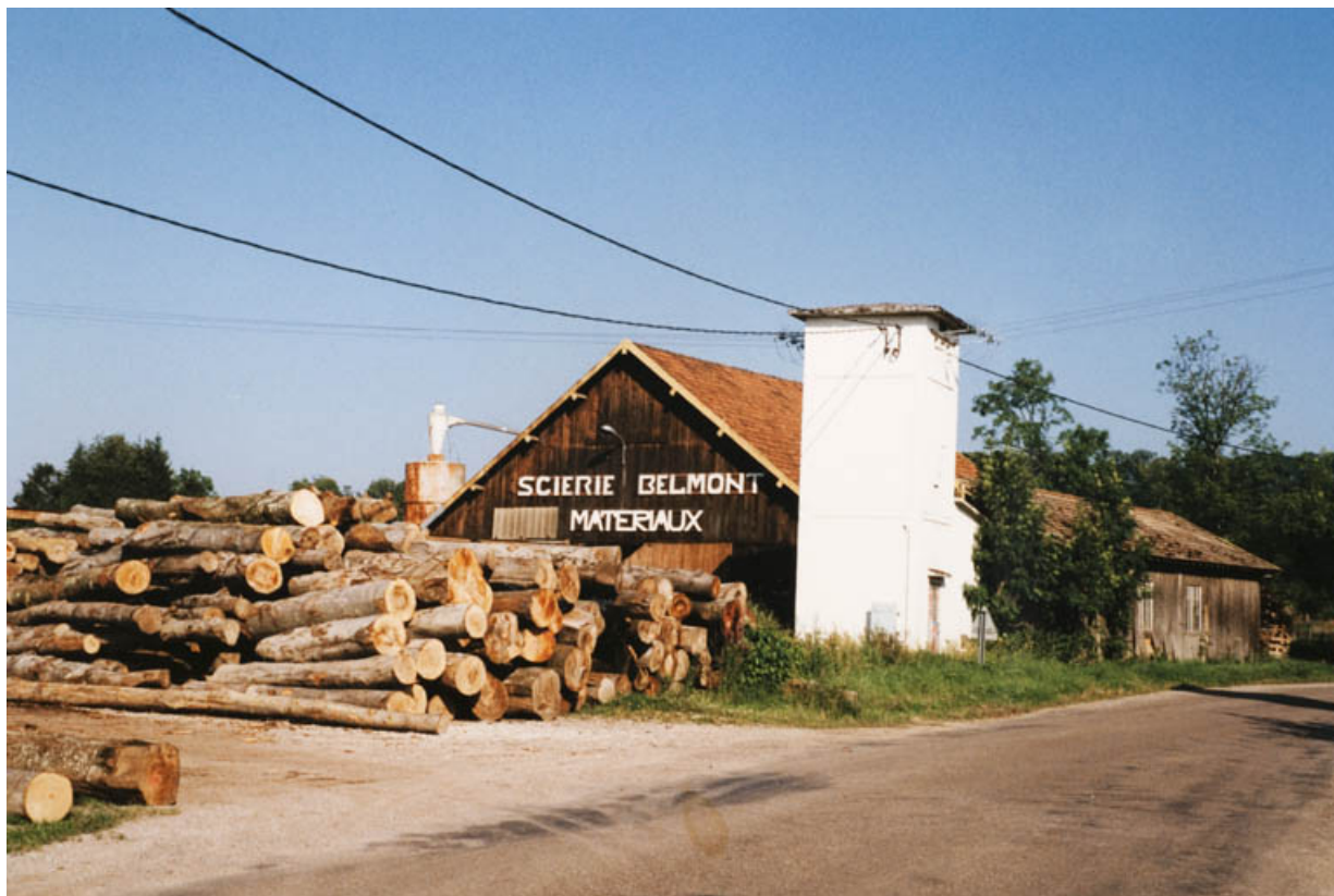
La scierie vers 1990.