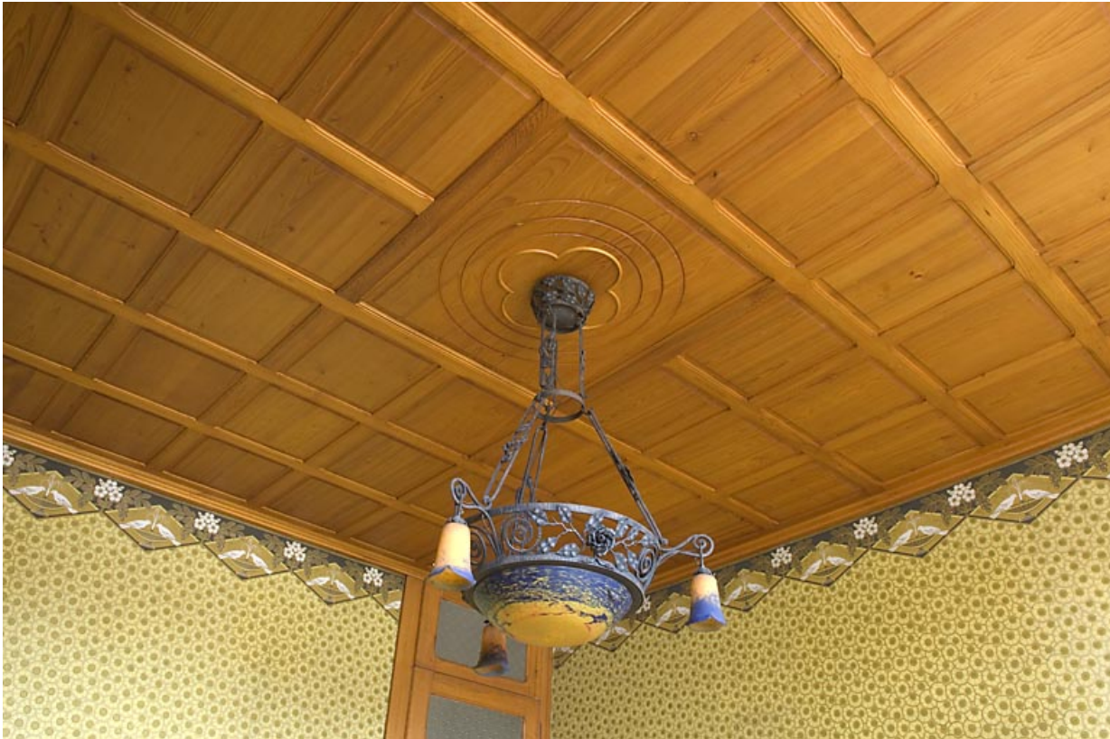
Ancienne salle à manger, détail : le plafond et le lustre.