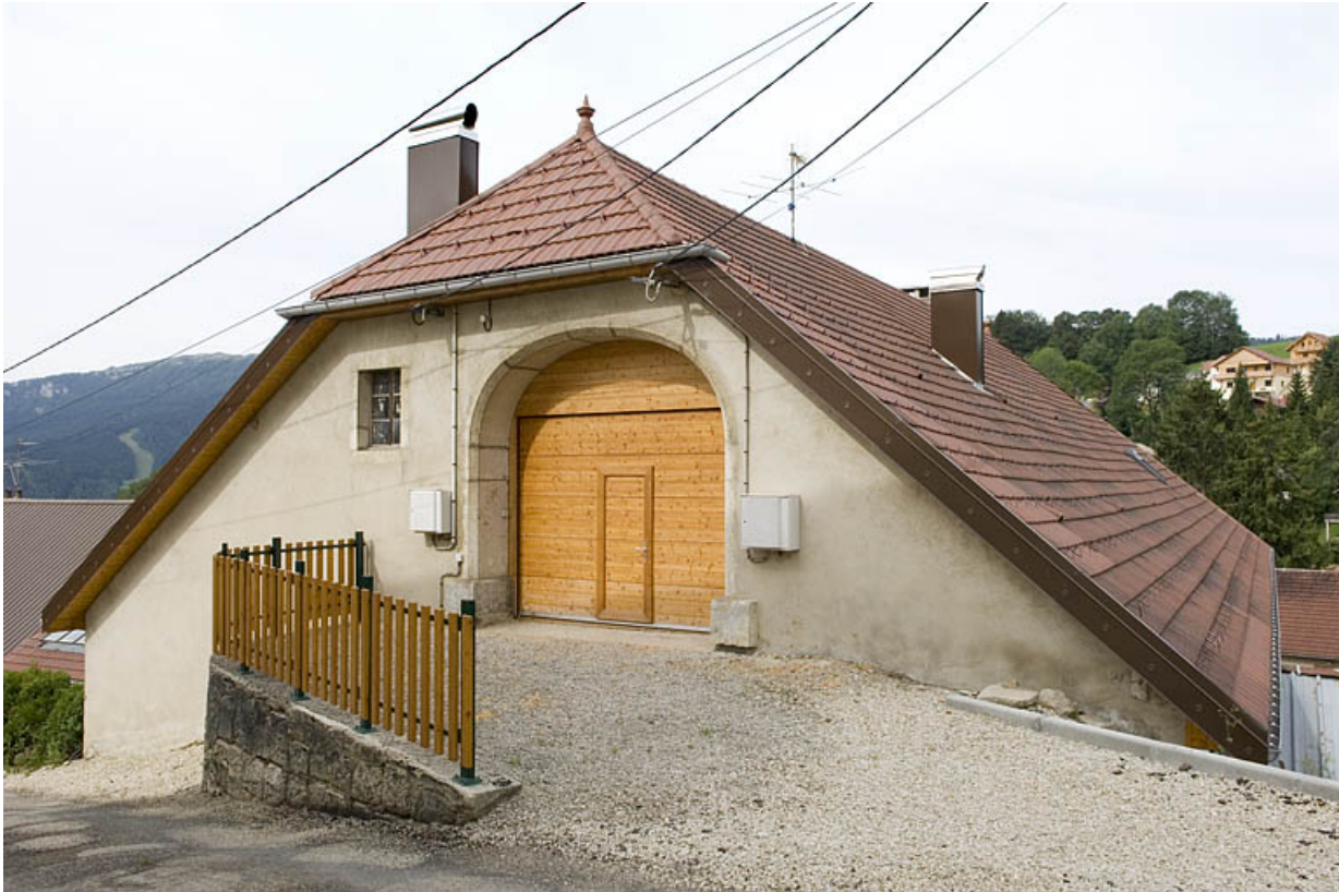
Façade latérale gauche et le pont de l'ancienne grange, rue du Châtelet. 25, Jougne, 16 rue de l' Eglise