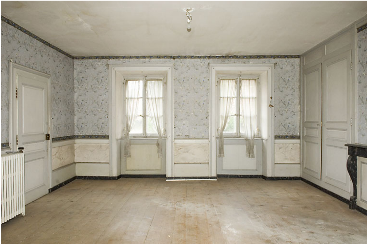
Chambre avec alcôve, vue en direction des fenêtres ouvrant sur la rue du Château. 25, Jougne, 16 rue de l' Eglise