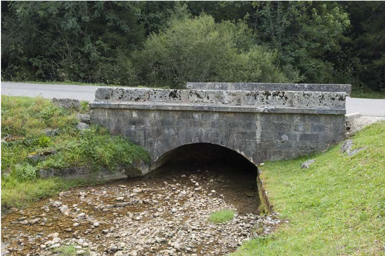
Pont sur la Jougnena (n°4), vue depuis l'amont. 25, Jougne