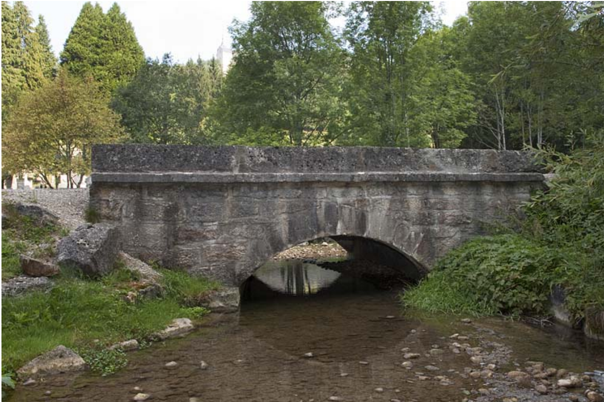
Pont sur la Jougnena (n°4), vue depuis l'aval. 25, Jougne