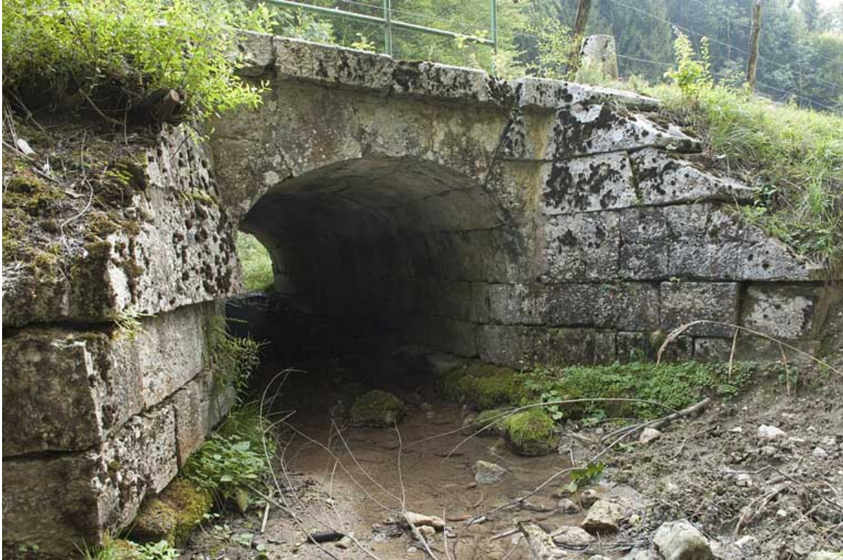
Pont du ruisseau de la Goulette (n° 18), vu depuis l'aval. 25, Jougne