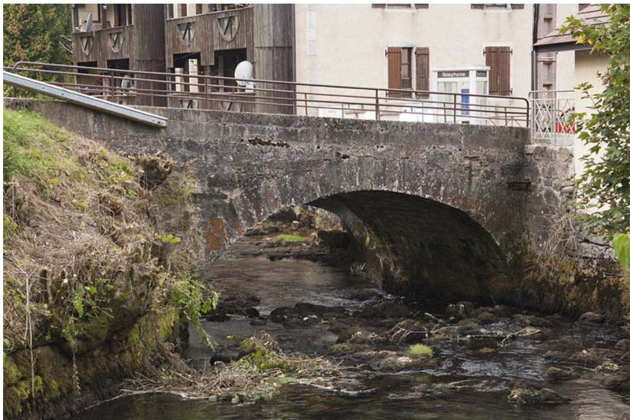
Pont sur la Jougnena (n°13), vue depuis l'amont. 25, Jougne