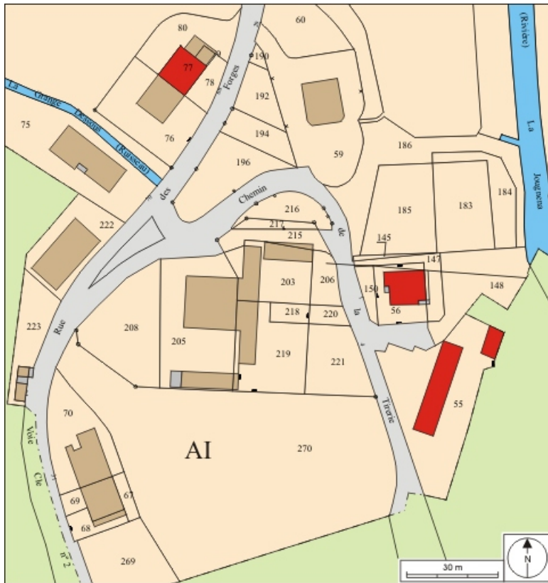
Plan masse et de situation. Extrait du plan cadastral, 2008, section AI, échelle 1/1 000. 25, Jougne, 1 rue de la Tirerie, lieudit : la Ferrière