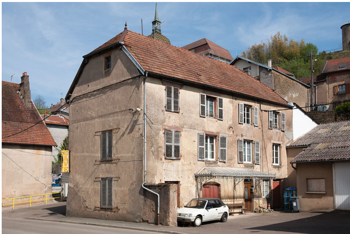
Vue générale du bâtiment (AL 543) situé à gauche de la cour. 25, Rougemont, 27, 29 Grande Rue