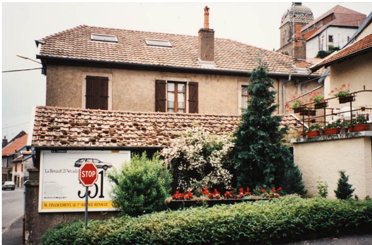
Remise vue depuis le Bas de la Côte, avant 1983. 25, Rougemont, 27, 29 Grande Rue