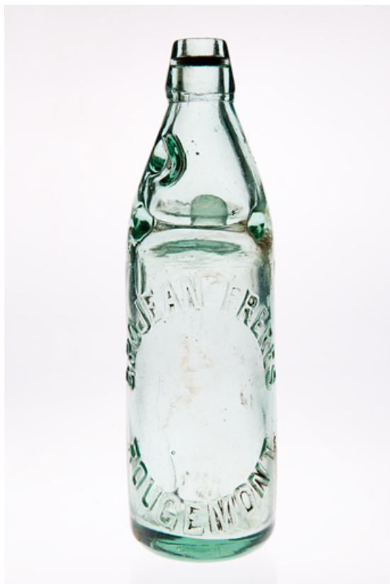
Bouteille à bille au nom de Grojean Frères Rougemont. 25, Rougemont, 27, 29 Grande Rue