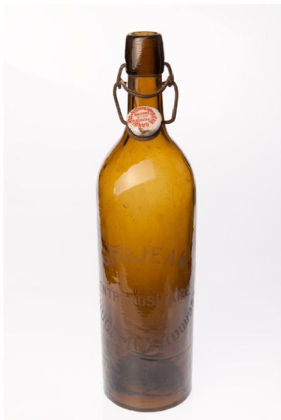
Bouteille au nom de "Grojean entrepositaire Rougemont (Doubs)". 25, Rougemont, 27, 29 Grande Rue