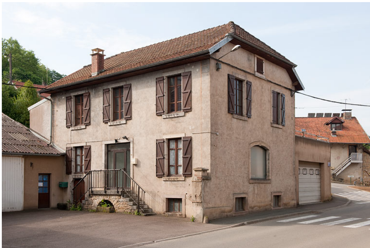
Vue générale du bâtiment (AL 549) situé à droite de la cour.