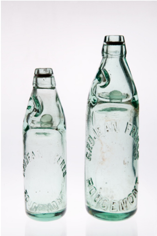
Deux bouteilles à bille au nom de Grojean Frères Rougemont. 25, Rougemont, 27, 29 Grande Rue