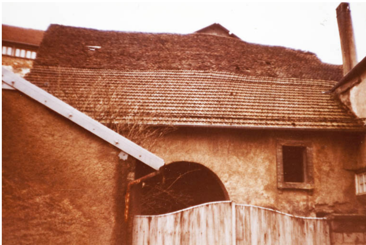
L'ancienne grange (ou "grangerie") sur la parcelle AL 547, avant 1983. 25, Rougemont, 27, 29 Grande Rue