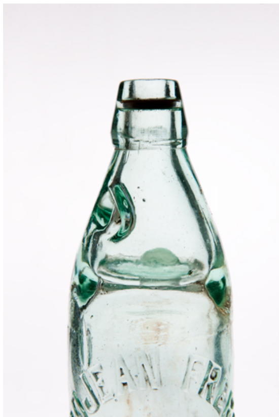
Détail d'une bouteille à bille au nom de Grojean Frères Rougemont. Collection particulière, Gérard Grojean, Rougemont 25, Rougemont, 27, 29 Grande Rue