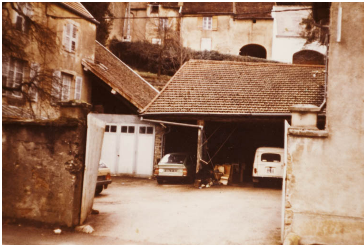
La cour et une remise avant 1983. 25, Rougemont, 27, 29 Grande Rue