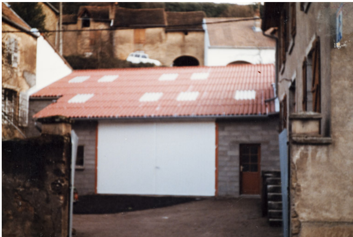
Le magasin de commerce à l'emplacement de la grange (ou "grangerie"), après 1984. 25, Rougemont, 27, 29 Grande Rue