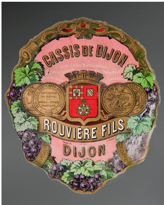
Cassis de Dijon/Rouvières fils/Dijon. 25, Rougemont, 27, 29 Grande Rue