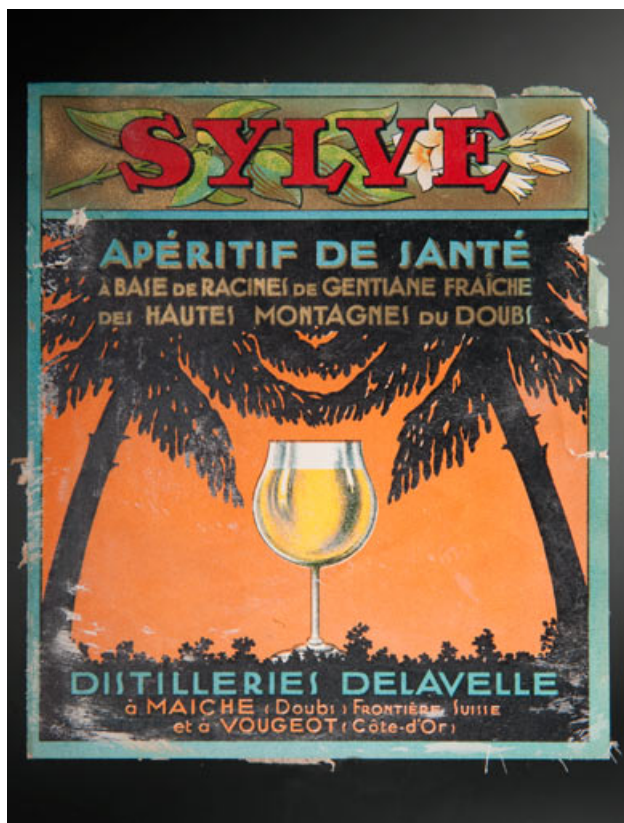
Sylve. Apéritif de santé [...]. 25, Rougemont, 27, 29 Grande Rue