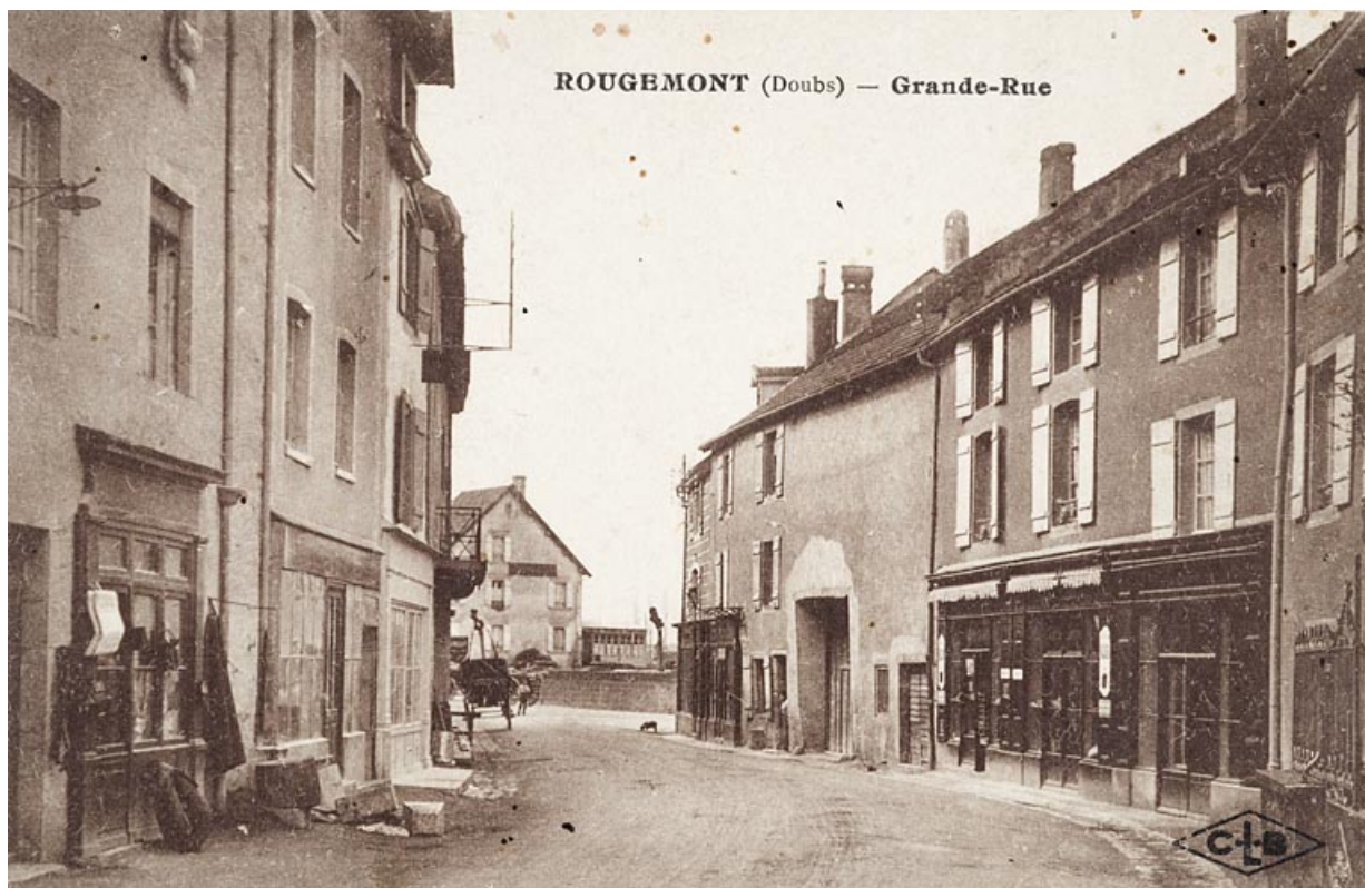
Rougemont, Doubs-Grande-Rue. [Le magasin de Denis-Joseph Laboube est le 1er à droite de la carte postale]. 25, Rougemont, 10 rue du Vieux Moulin