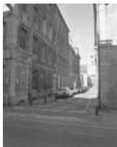
Immeuble : vue de la façade donnant rue Jean Petit : de trois quarts gauche.