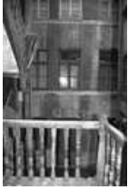
Immeuble : détail de la façade sur cour du logis secondaire.