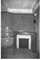
Immeuble : intérieur, détail d'une cheminée du premier étage, de face. 25, Besançon