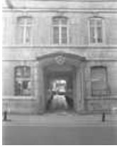
Hôtel et immeuble : façade antérieure du logis principal, détail du portail d'entrée. 25, Besançon