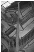
Immeuble : détail de l'escalier sur cour : de trois quarts droit.