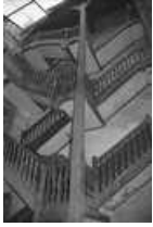
Immeuble : détail de l'escalier sur cour : de trois quarts droit. 25, Besançon