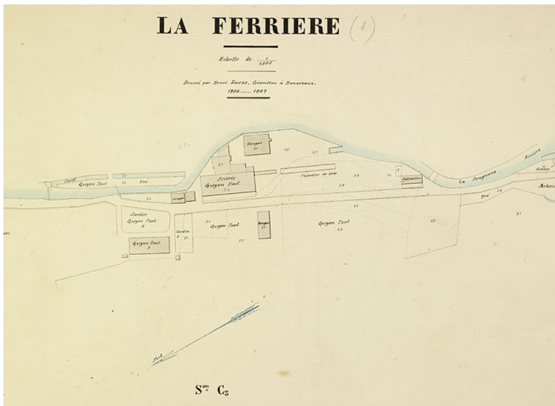
La Ferrière [1ère feuille. Détail : partie centrale, haut], 1906-1907.

25, Jougne rue des Forges, lieudit : la Ferrière