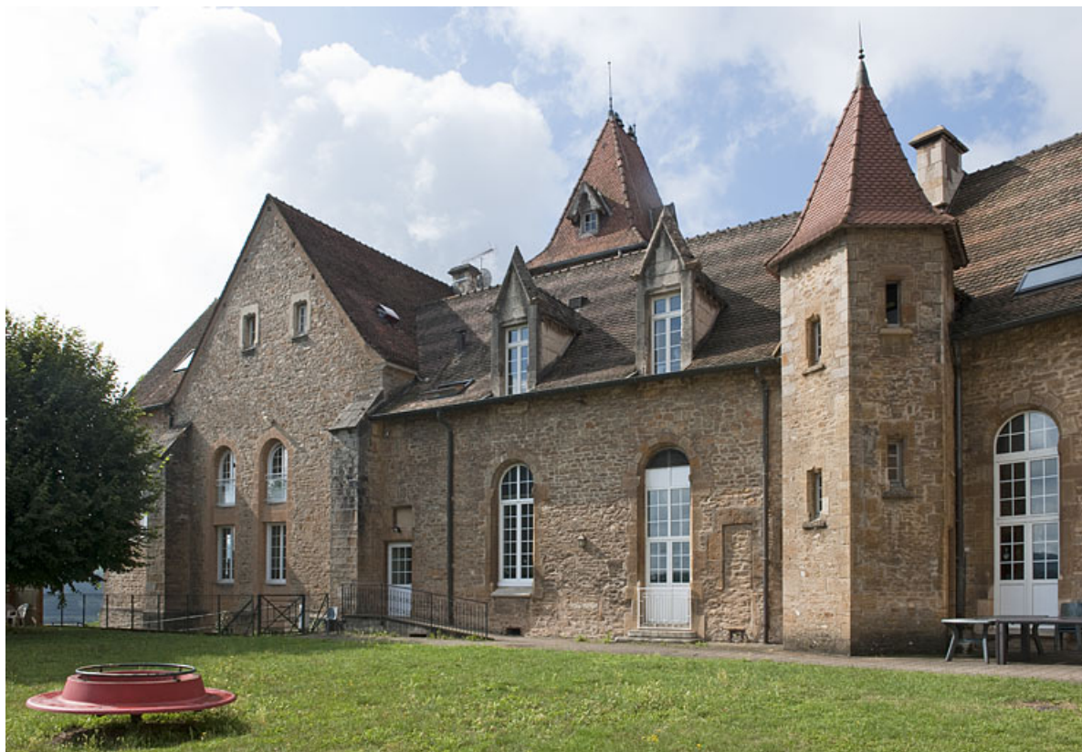
Bâtiment (C), côté jardin.