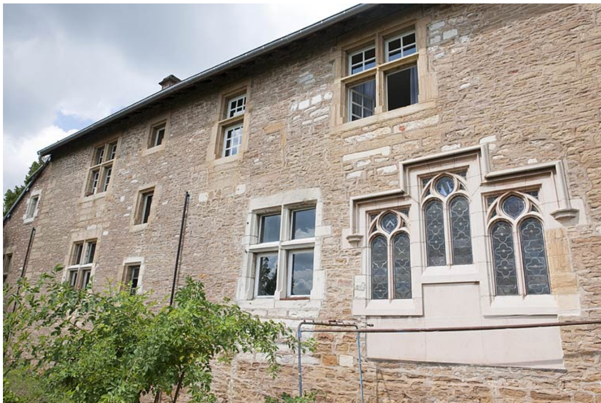
Demeure de Philibert de Molans (F), façade postérieure. 25, Rougemont quartier de la Citadelle