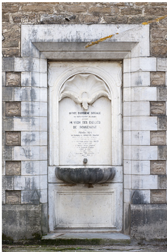
Bâtiment (E), plaque commémorative (plaque de fondation de la maison d'enfants). 25, Rougemont quartier de la Citadelle