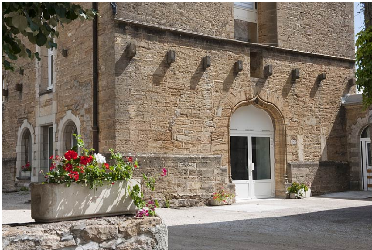
Chapelle (D), détail de la façade.