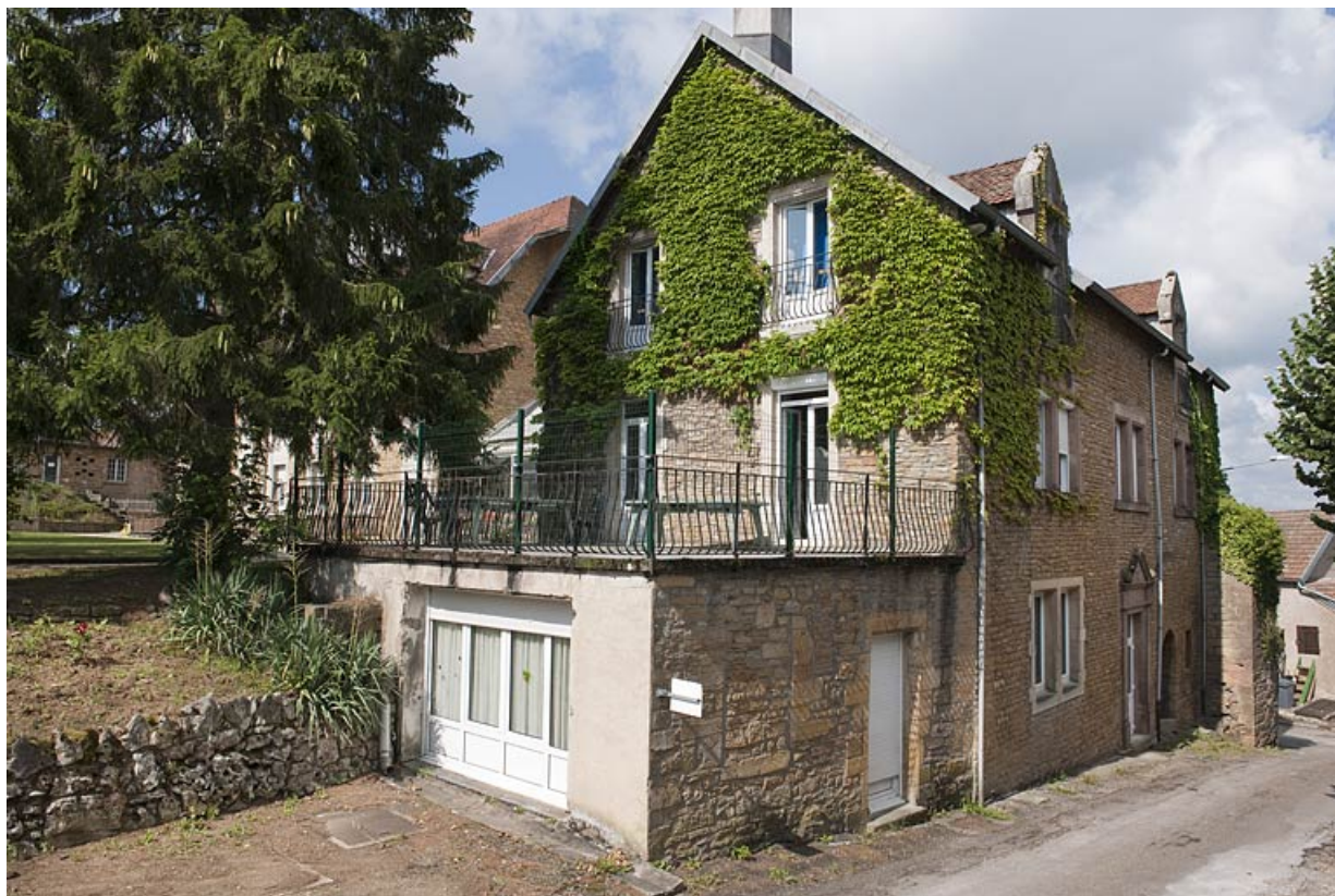
Bâtiment (A), vue de trois quart gauche. 25, Rougemont quartier de la Citadelle