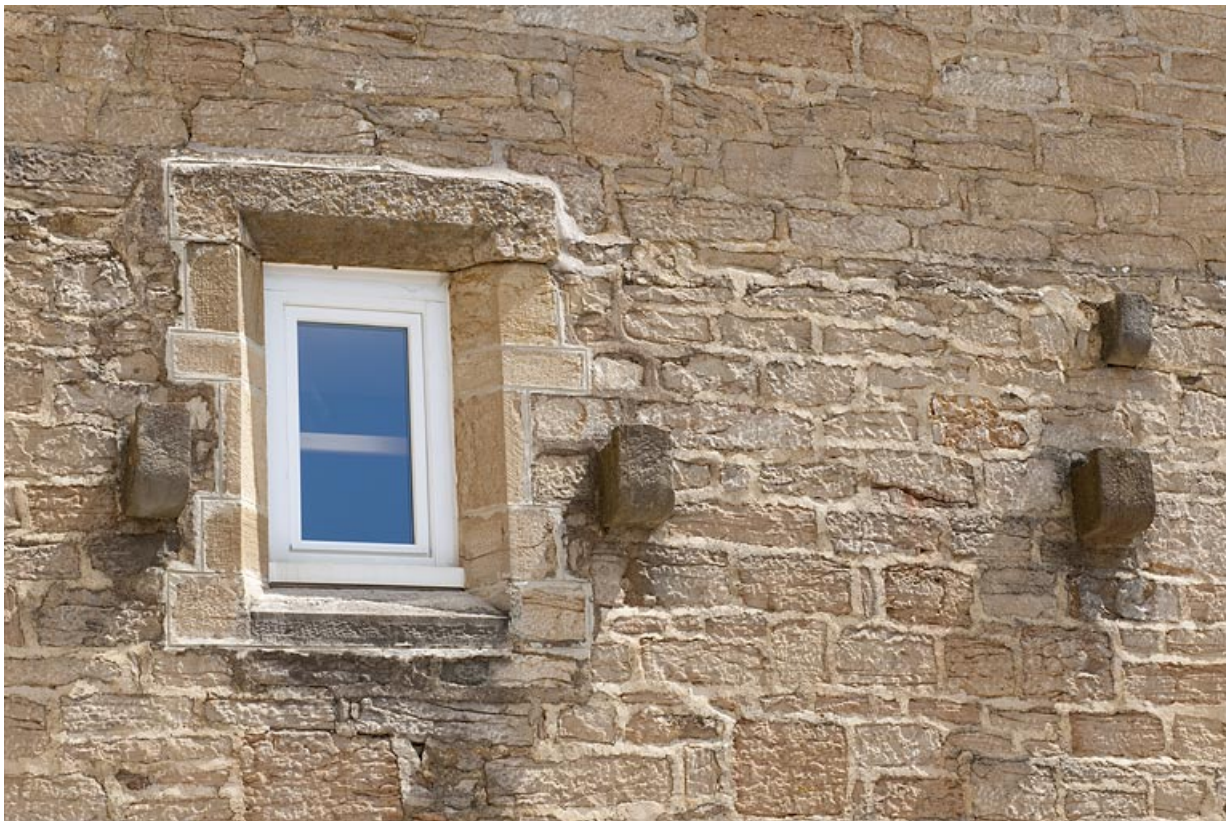
Chapelle (F), vue d'une baie.