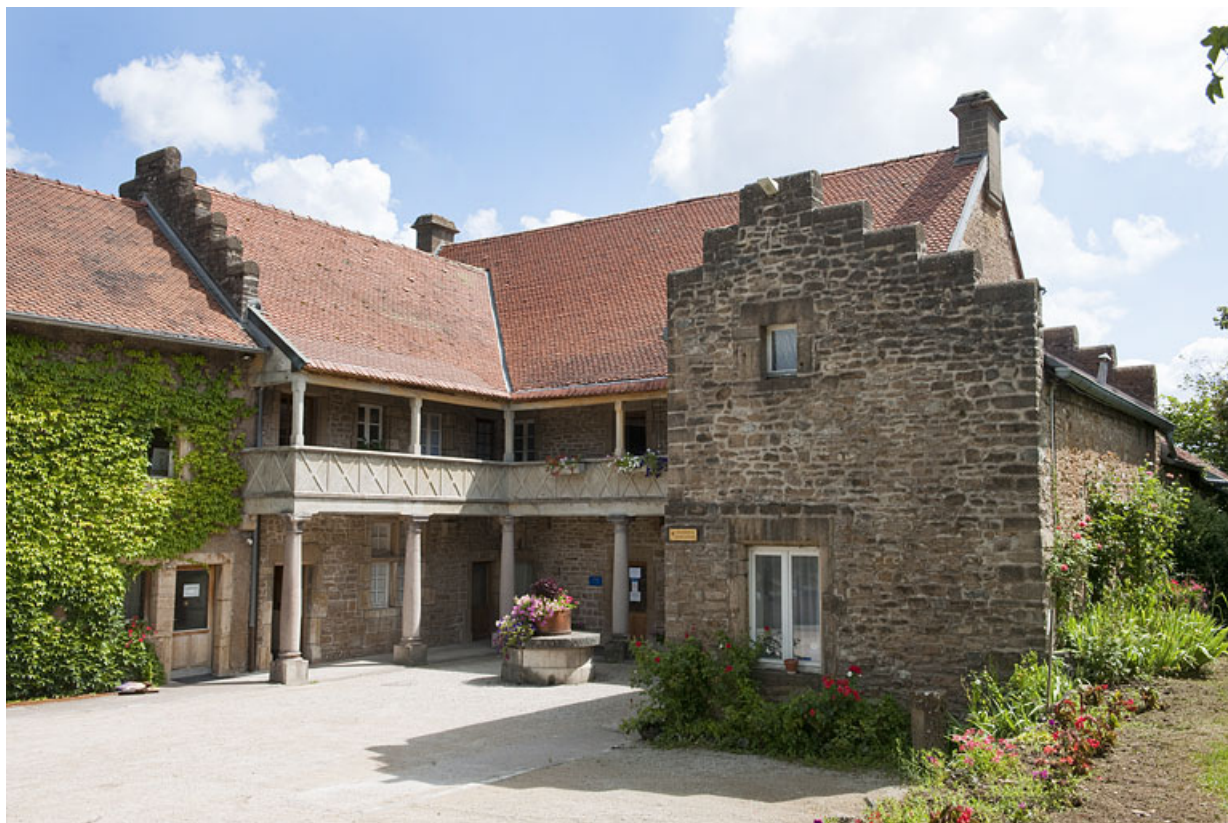
Demeure de Philibert de Molans (F), vue de trois quart droit. 25, Rougemont quartier de la Citadelle