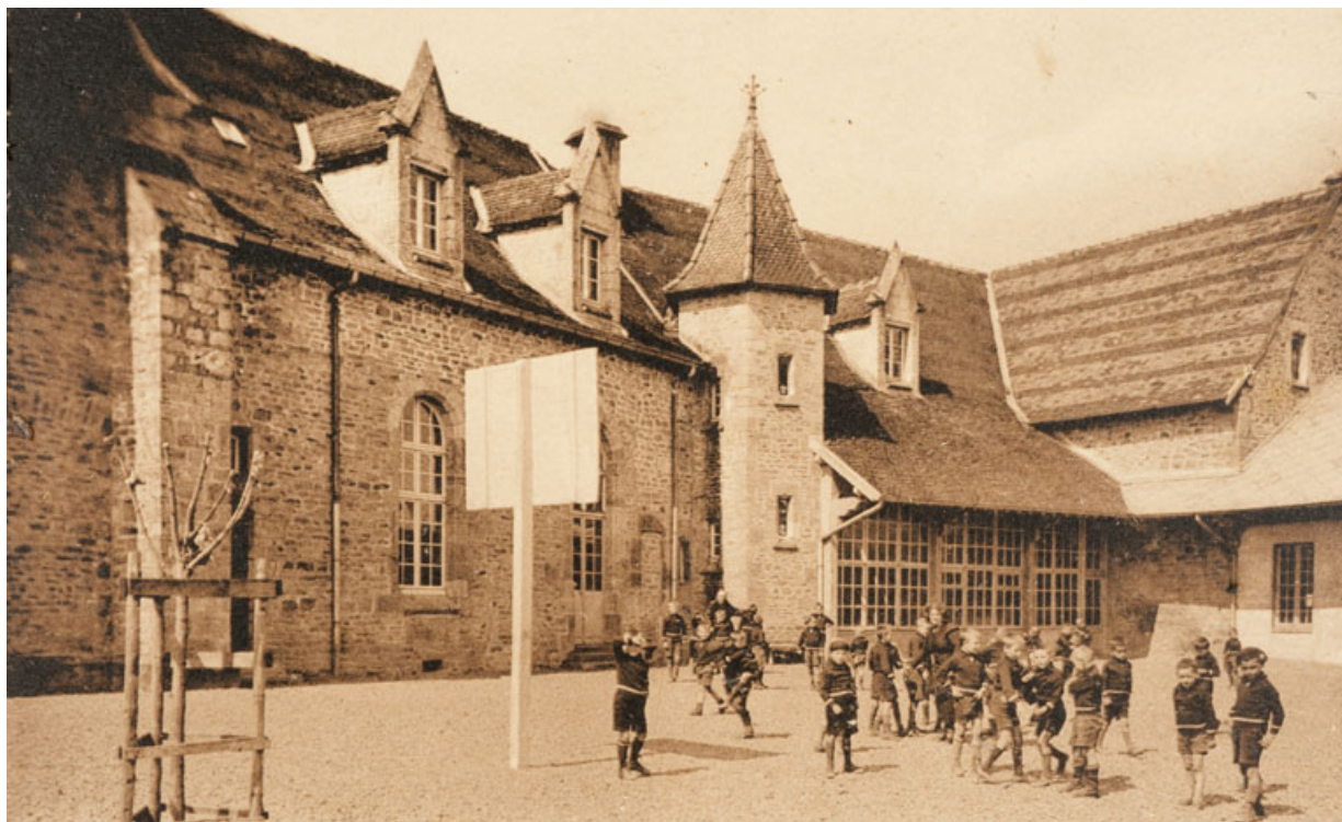
Maison d' Enfants de Rougemont (Doubs). - Une cour.