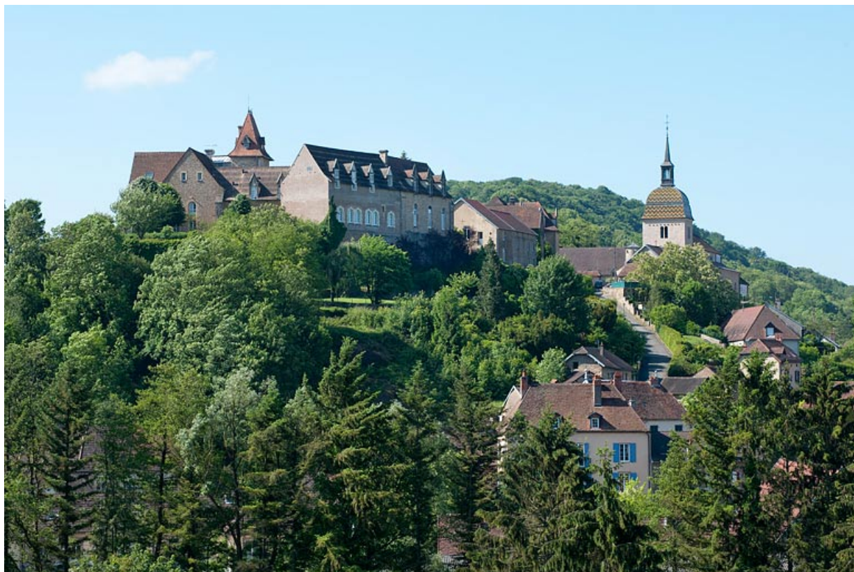
Vue générale depuis le nord-ouest.