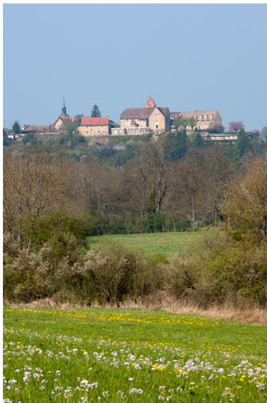
Vue générale depuis l'est.