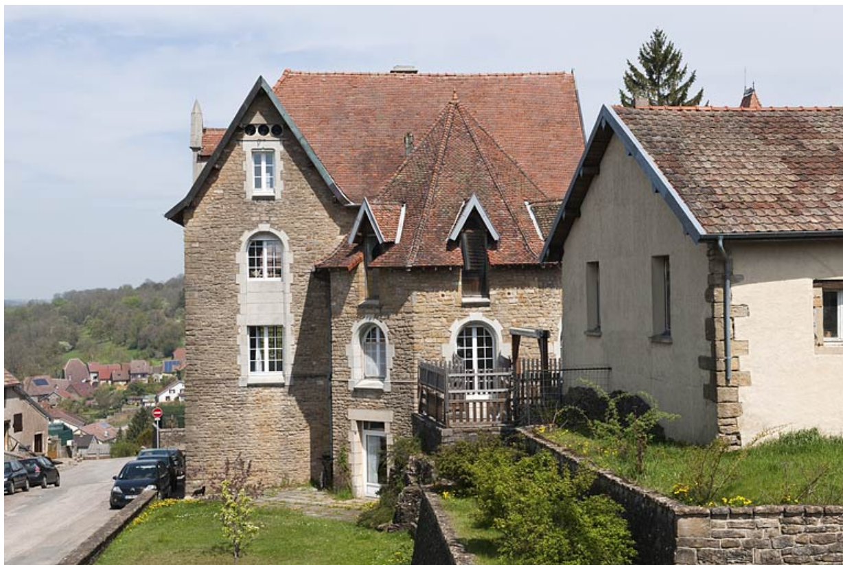
Bâtiment (G), côté rue.