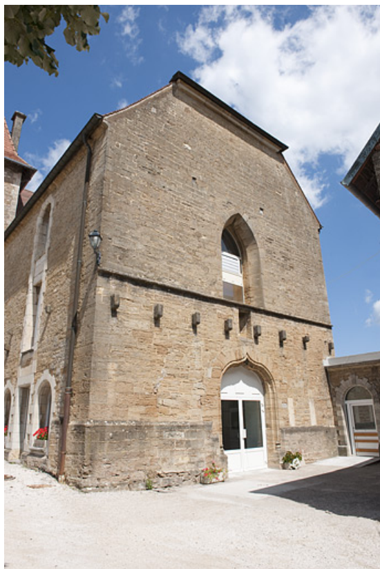
Chapelle (D), vue de trois quart gauche. 25, Rougemont quartier de la Citadelle