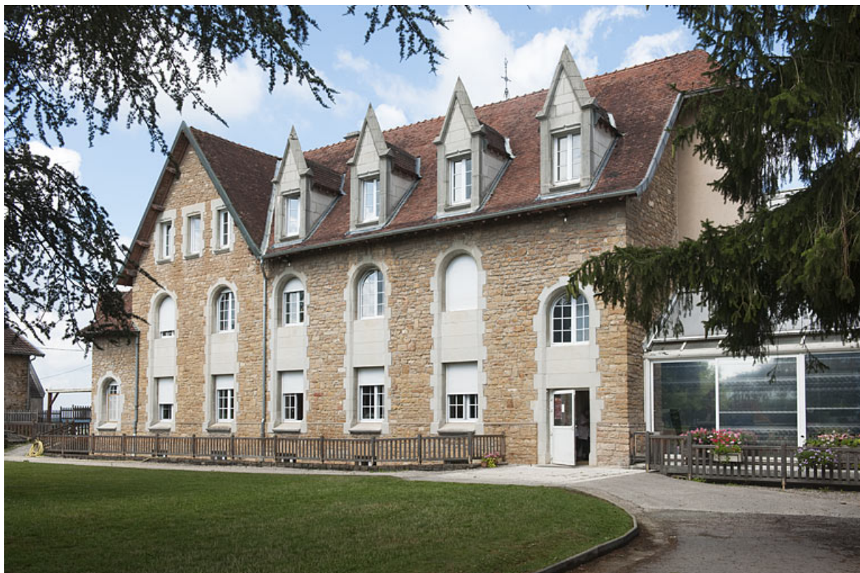
Bâtiment (G), façade postérieure, vue de trois quart droit. 25, Rougemont quartier de la Citadelle