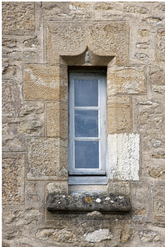
Bâtiment (C), façade côté jardin : détail d'une baie de la tour d'escalier. 25, Rougemont quartier de la Citadelle