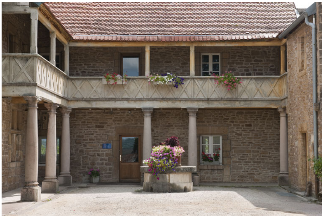
Demeure de Philibert de Molans (F), vue de face. 25, Rougemont quartier de la Citadelle