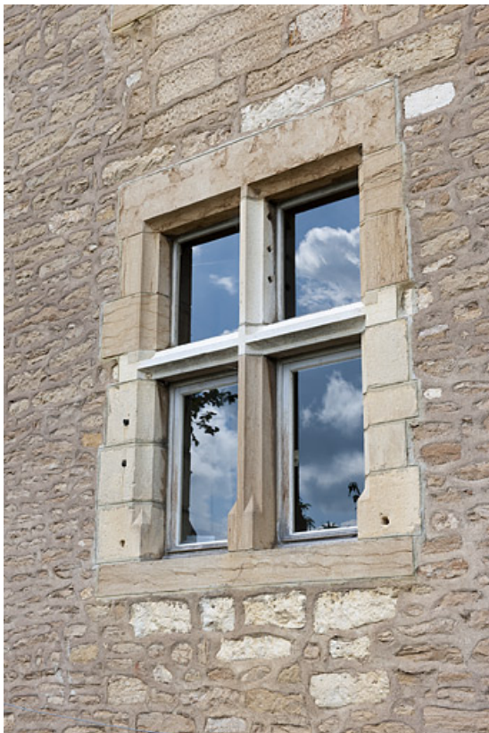
Demeure de Philibert de Molans (F), façade postérieure, détail d'une baie. 25, Rougemont quartier de la Citadelle