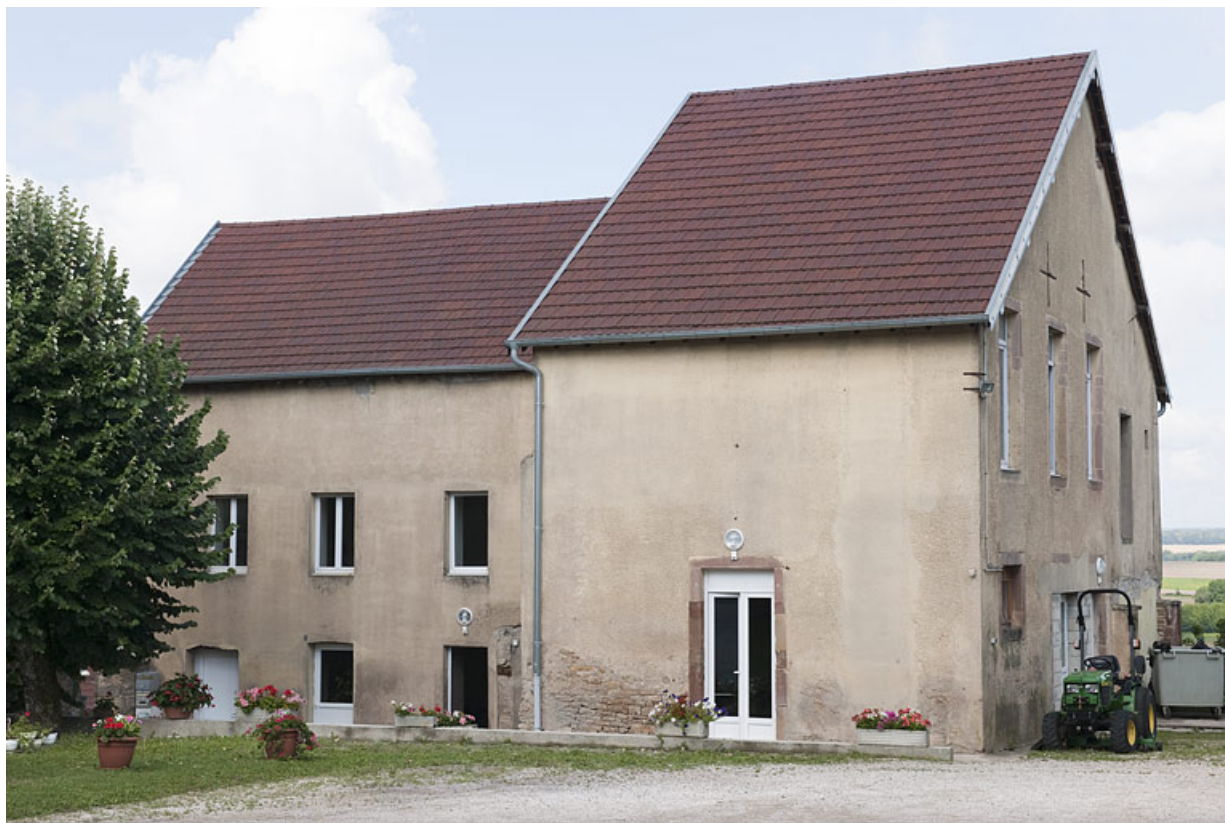
Bâtiment (B), vue d'ensemble depuis la cour. 25, Rougemont quartier de la Citadelle