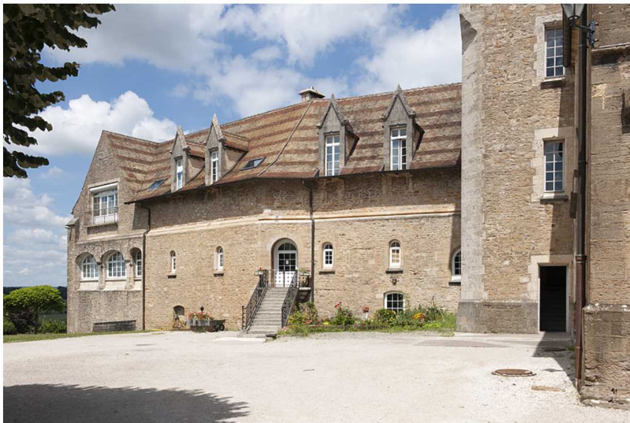
Bâtiment (C), vue depuis la cour.