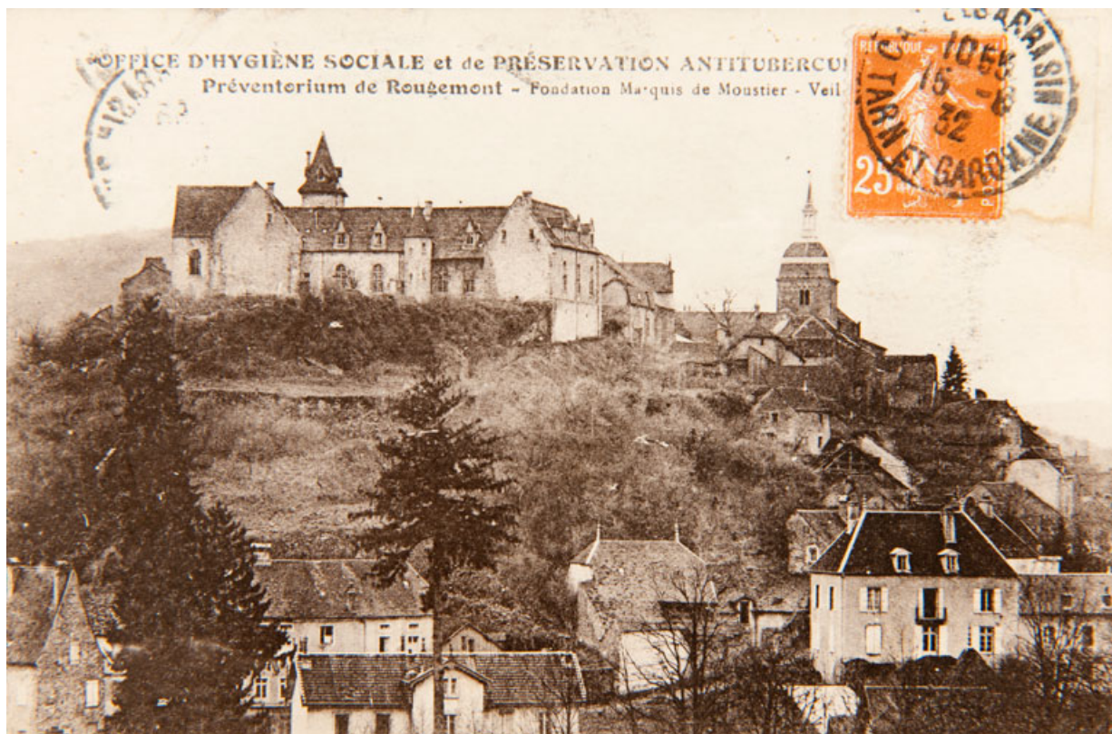
Office d'Hygiène sociale et de Préservation Antituberculeuse (Doubs). Préventorium de Rougemont - Fondation Marquis de Moustier - Veil-Picard. S.d. [1ère moitié 20e siècle, avant 1932].