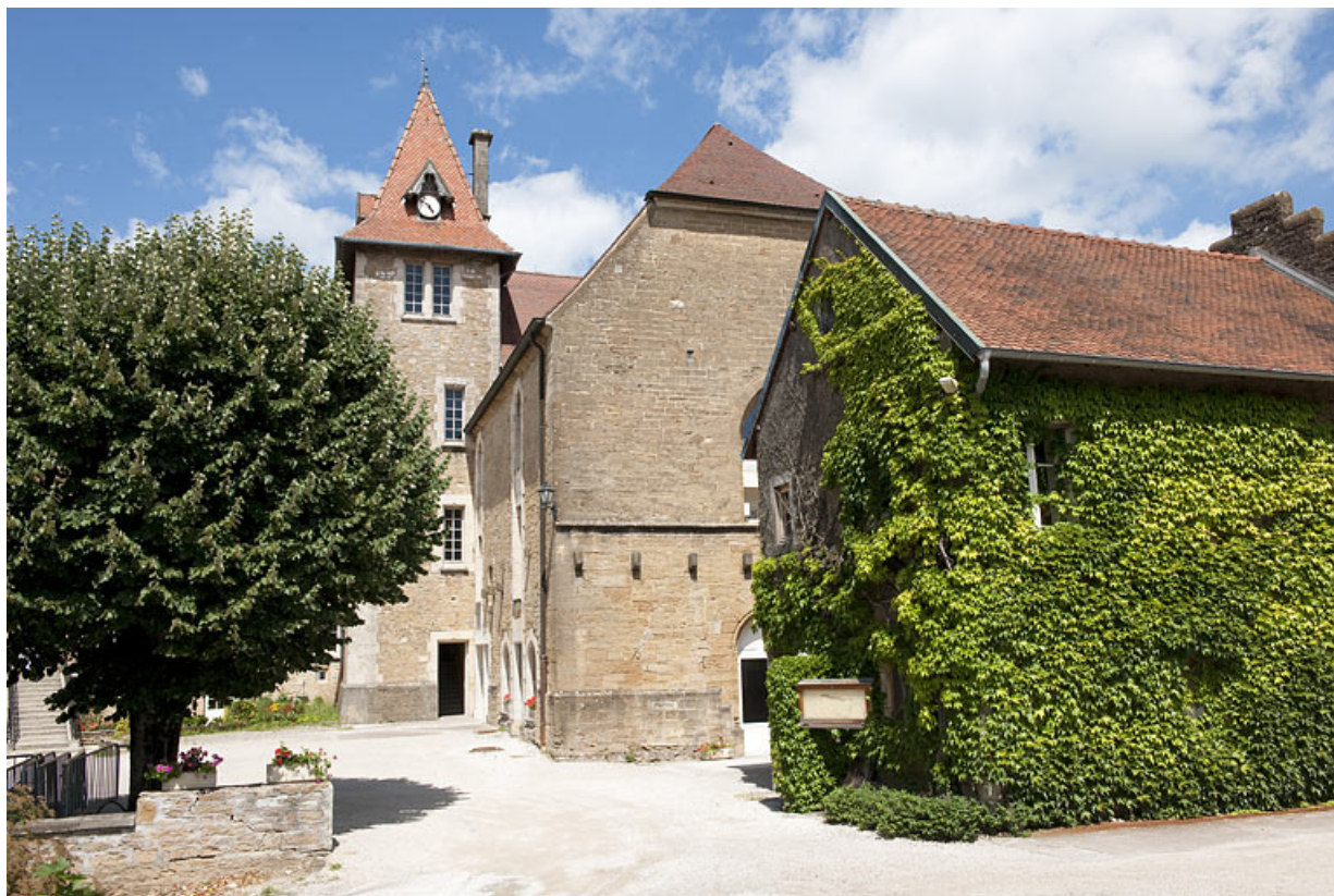
Bâtiment (C), tour d'escalier, chapelle (D), demeure de Philibert de Molans (F). 25, Rougemont quartier de la Citadelle