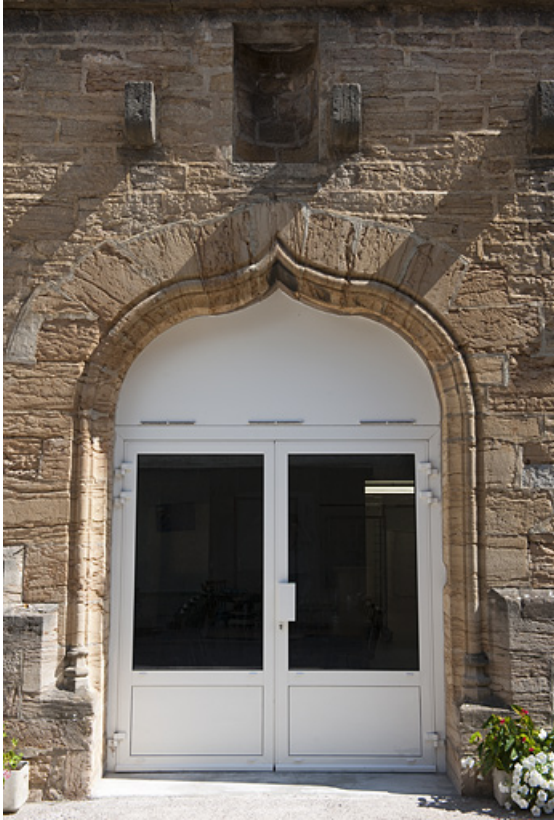
Chapelle (D), vue du portail.