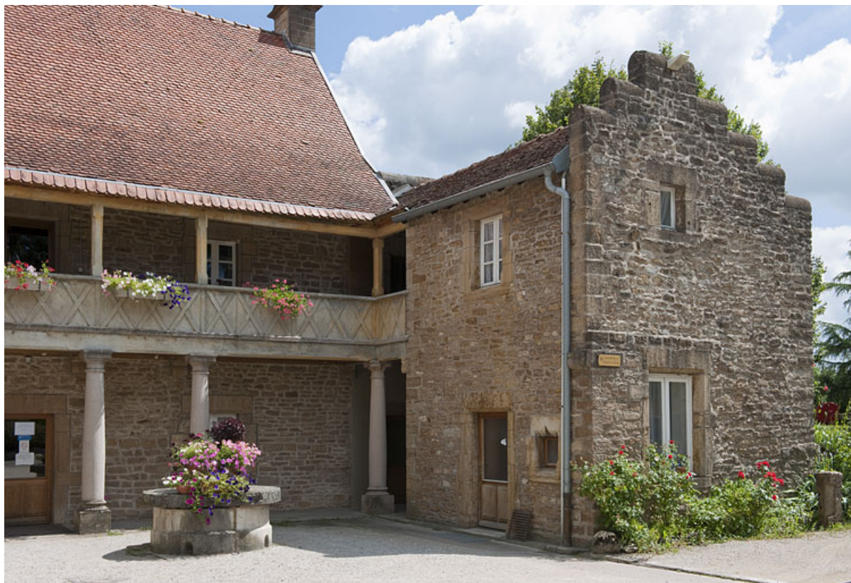
Demeure de Philibert de Molans (F), vue de l'aile droite. 25, Rougemont quartier de la Citadelle