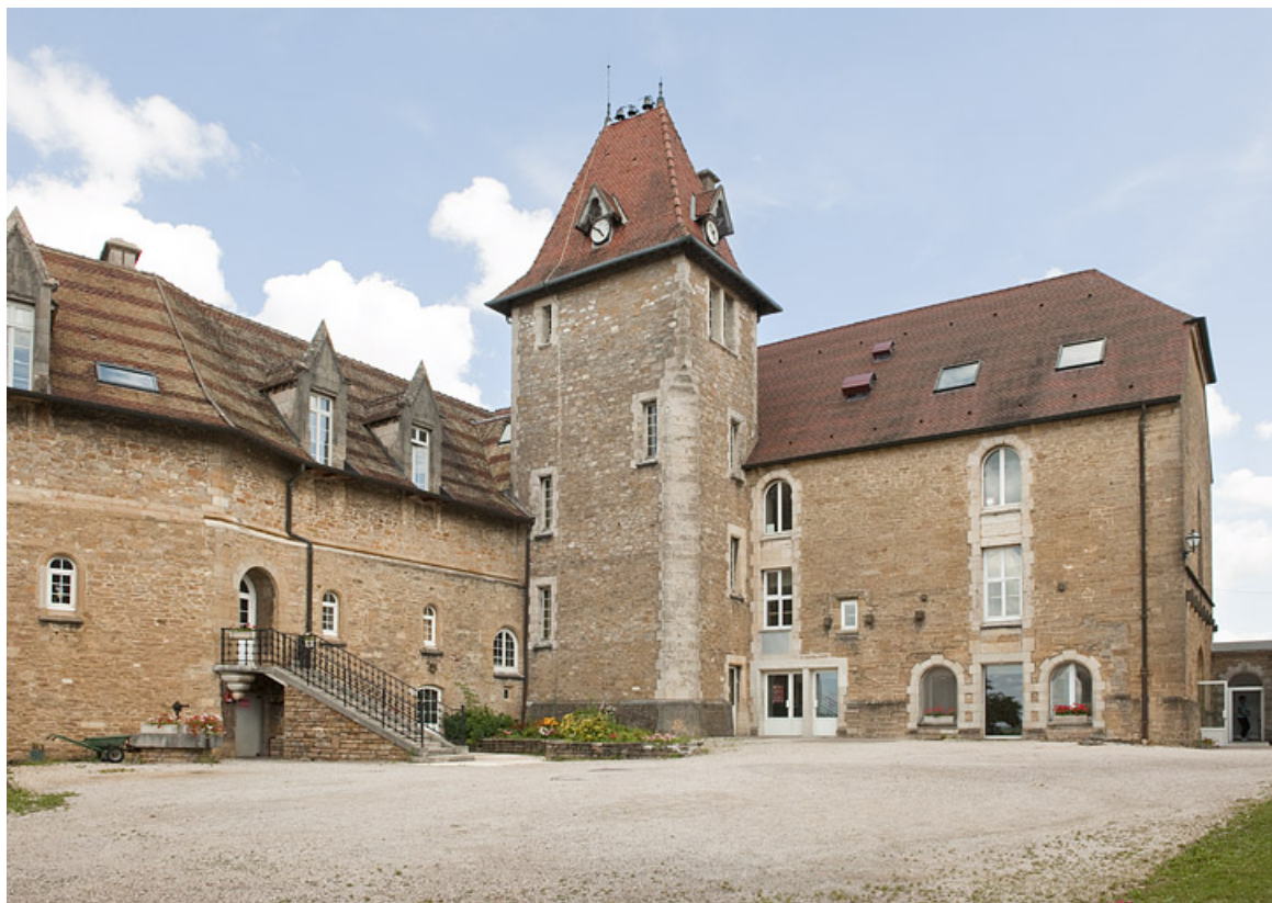
Bâtiment (C) et chapelle (D), vue depuis la cour.