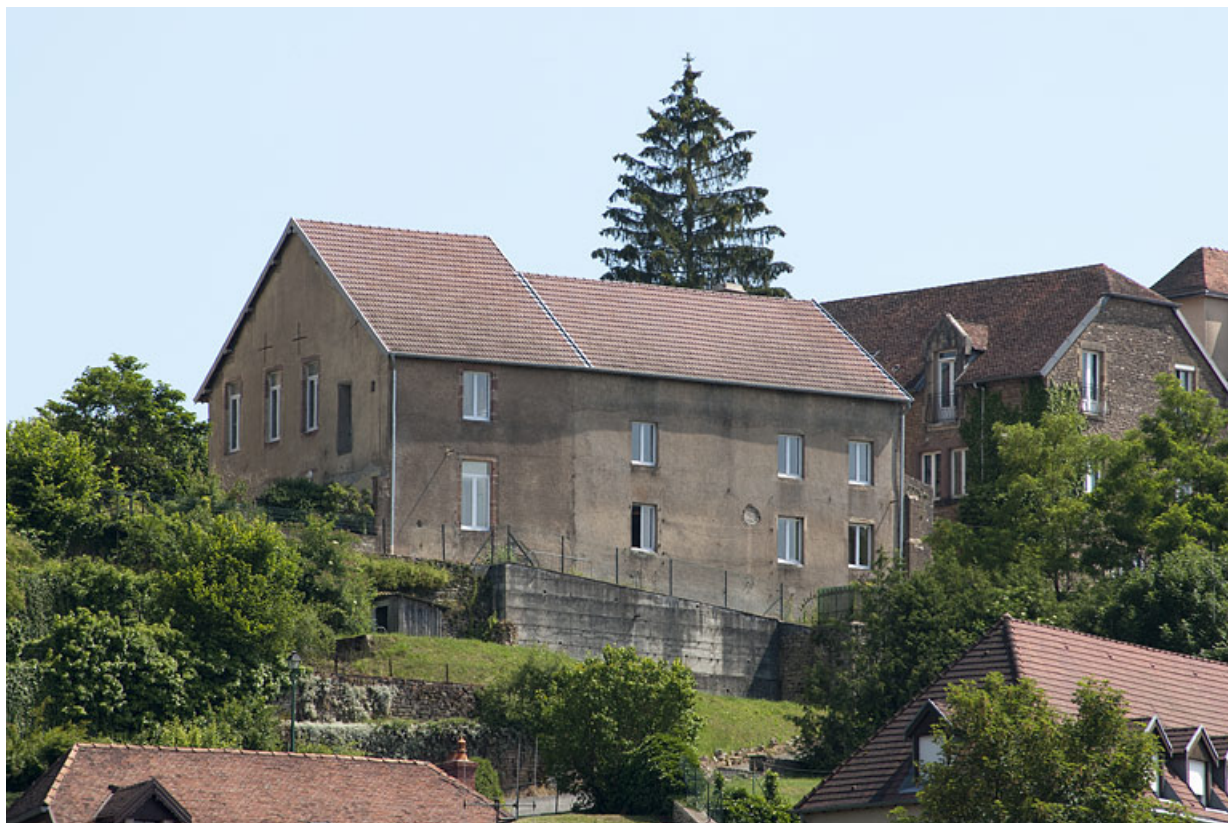
Bâtiment (B), vue générale côté village. 25, Rougemont quartier de la Citadelle