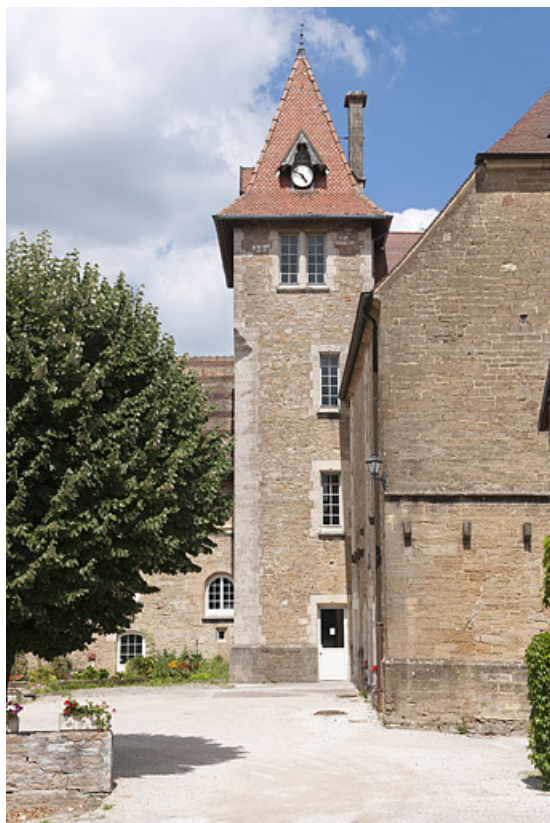
Bâtiment (C), vue de la tour d'escalier.