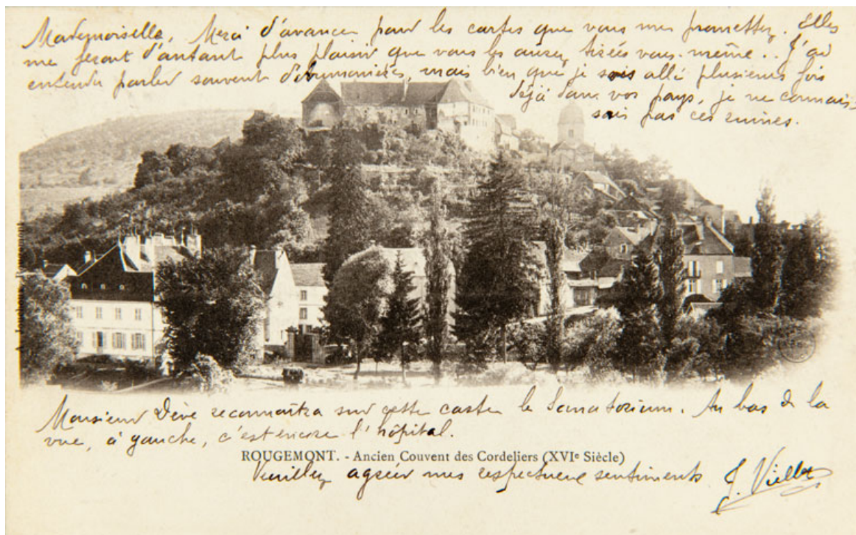
Rougemont. - Ancien Couvent des Cordeliers (XVI e siècle). S.d. [limite 19 e siècle 20 e siècle].