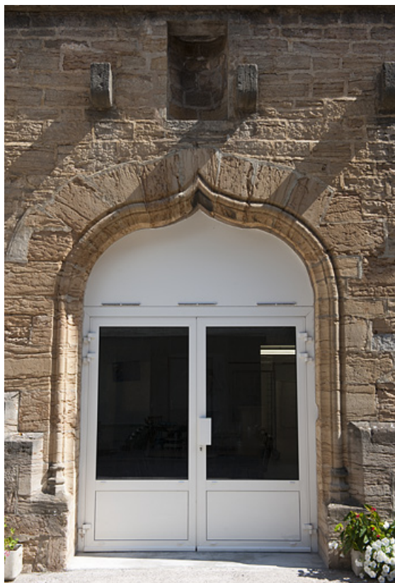
Chapelle (D), vue du portail.