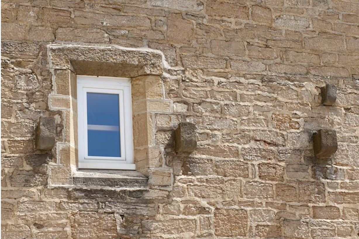
Chapelle (F), vue d'une baie.