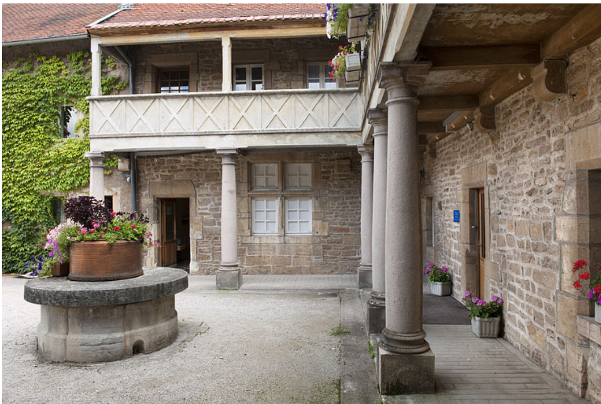
Demeure de Philibert de Molans (F), vue de la galerie couverte. 25, Rougemont quartier de la Citadelle