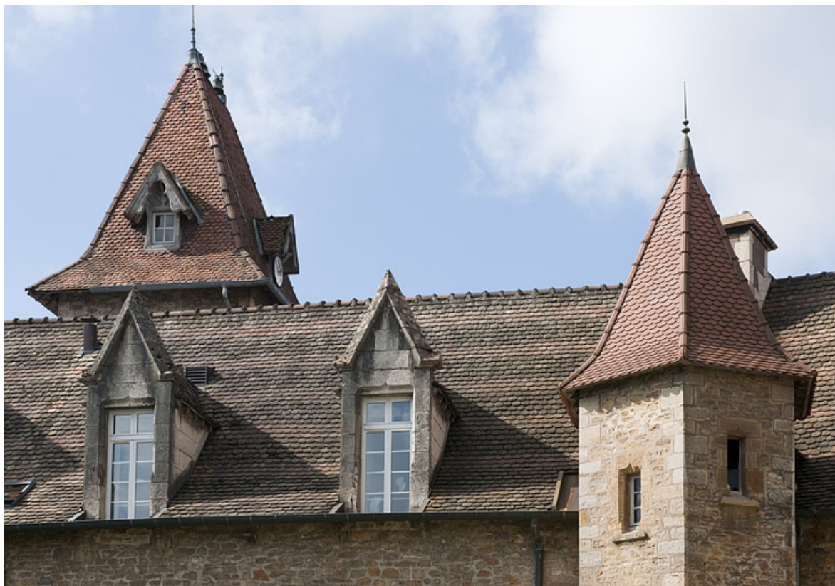
Bâtiment (C), façade côté jardin : détail des toits.