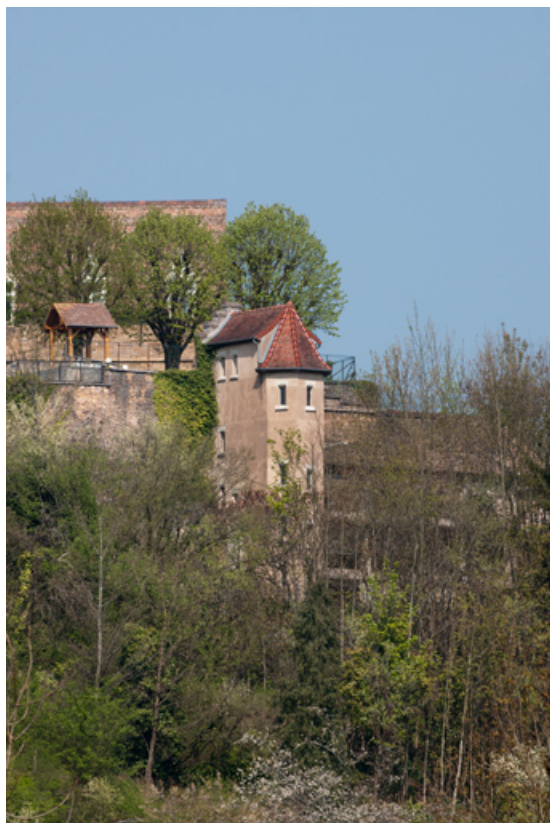
Bâtiment (H), tour d'escalier.