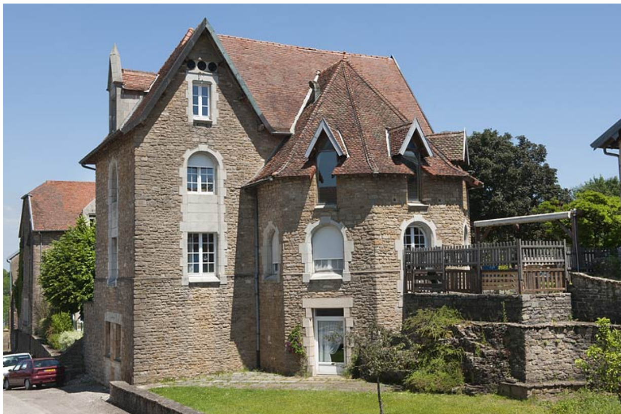
Bâtiment (G), vue rapprochée.