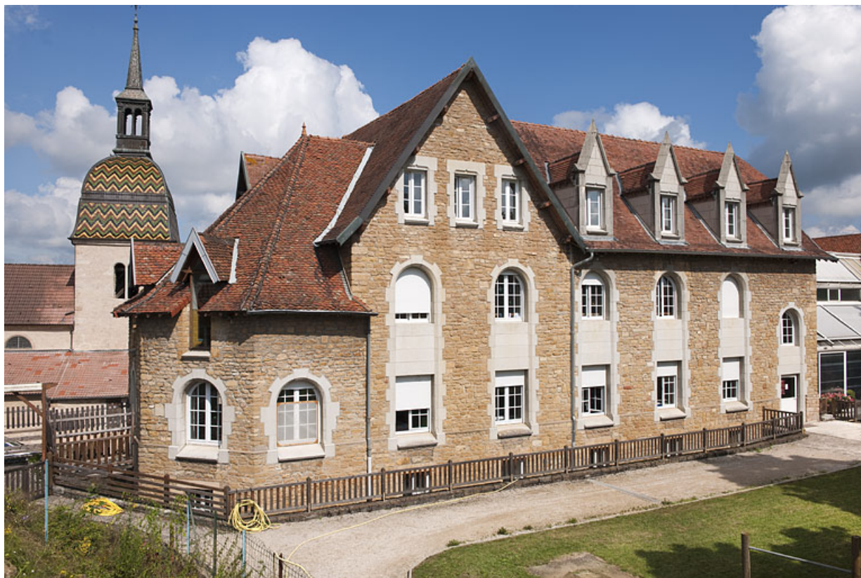
Bâtiment (G), façade postérieure, vue de trois quart gauche. 25, Rougemont quartier de la Citadelle