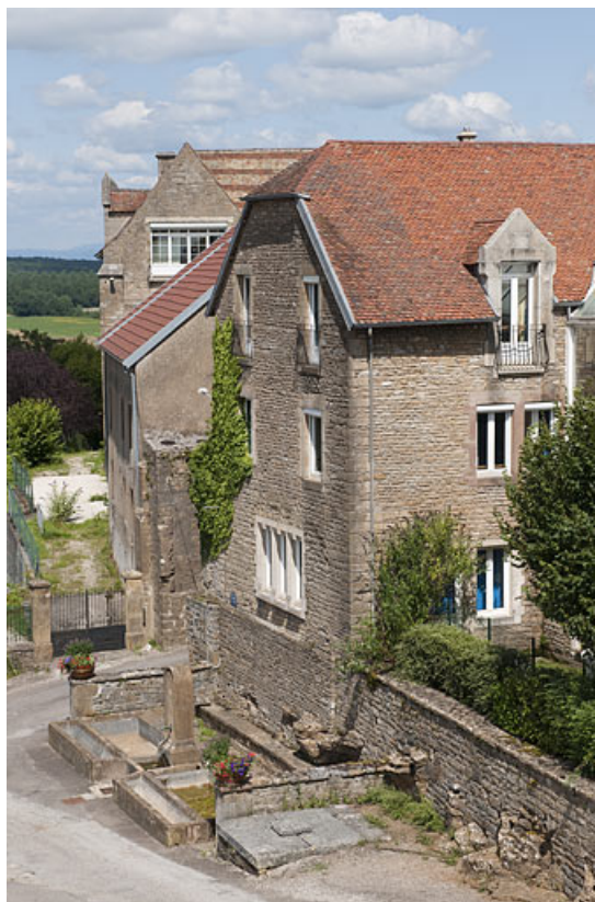
Bâtiment (A), vue rapprochée du côté rue. 25, Rougemont quartier de la Citadelle