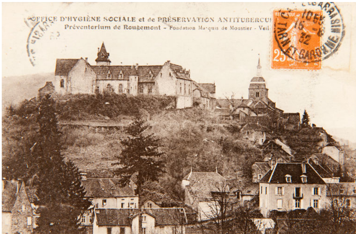
Office d'Hygiène sociale et de Préservation Antituberculeuse (Doubs). Préventorium de Rougemont - Fondation Marquis de Moustier - Veil-Picard. S.d. [1ère moitié 20e siècle, avant 1932].