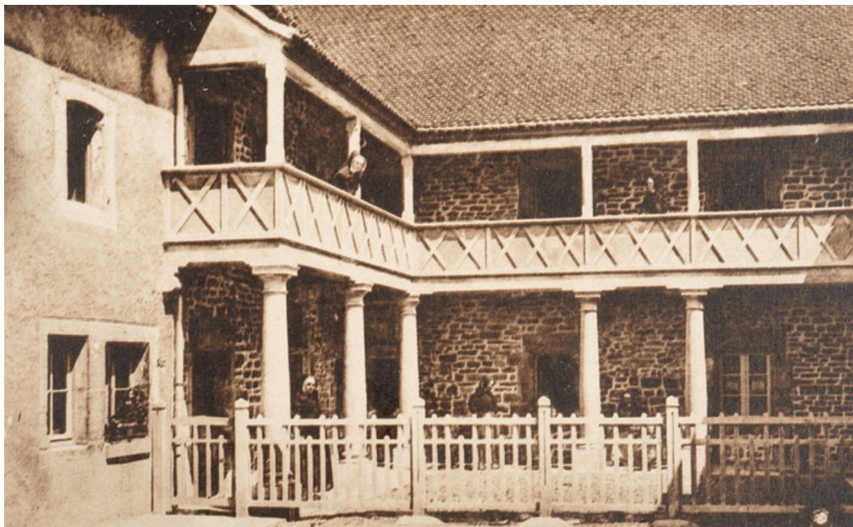
Maison d'Enfants de Rougemont (Doubs). Gentilhomnière du XVe siècle-Appartement des Religieuses. 25, Rougemont quartier de la Citadelle