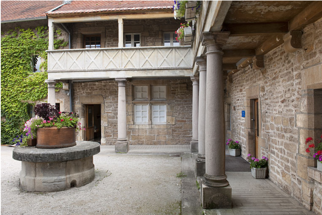
Demeure de Philibert de Molans (F), vue de la galerie couverte. 25, Rougemont quartier de la Citadelle