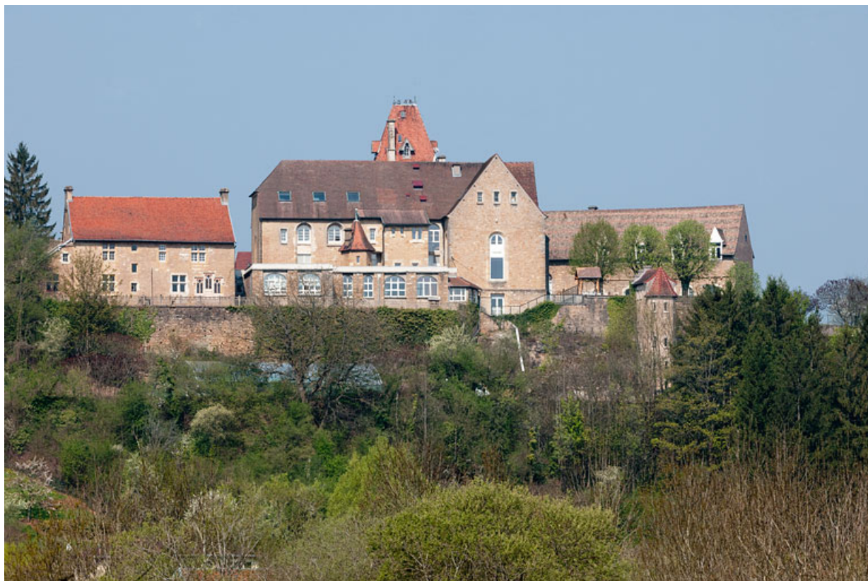
Vue d'ensemble depuis la route de Gouhelans.