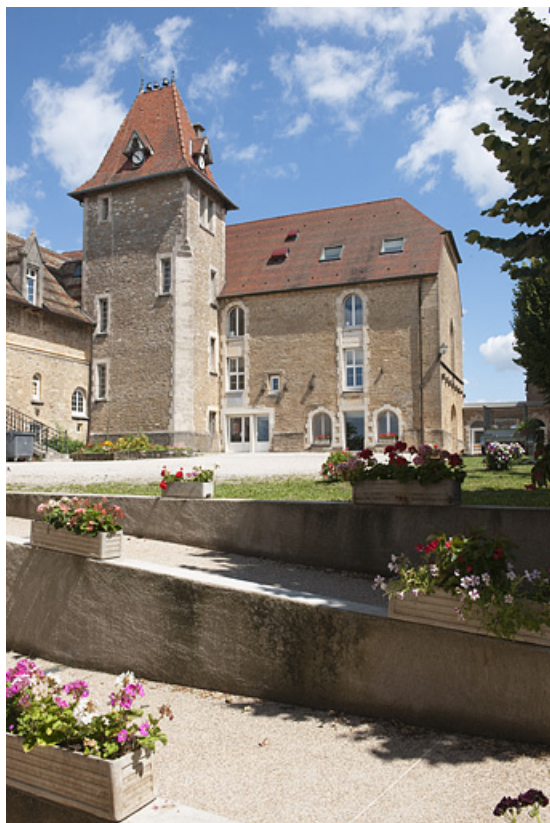
Tour d'escalier du bâtiment (C) et chapelle (D), vue depuis l'entrée. 25, Rougemont quartier de la Citadelle