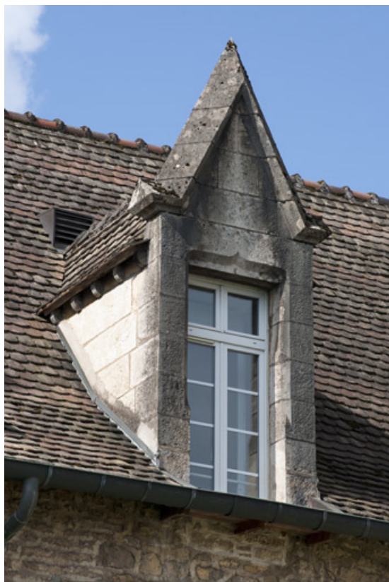
Bâtiment (C), côté jardin, détail d'une lucarne. 25, Rougemont quartier de la Citadelle