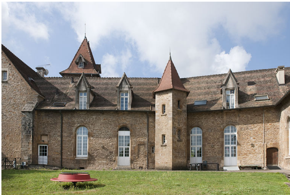
Bâtiment (C), vue d'ensemble côté jardin.