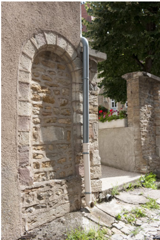
Bâtiment (B), ancienne porte.