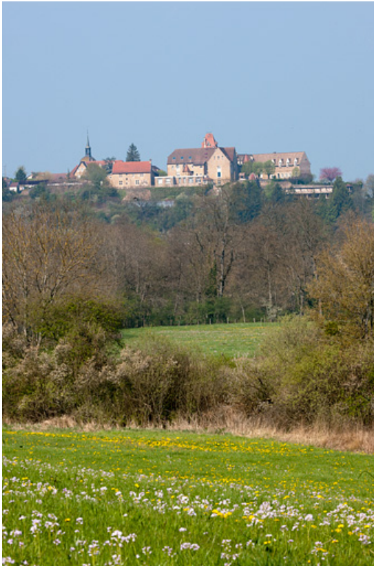
Vue générale depuis l'est.