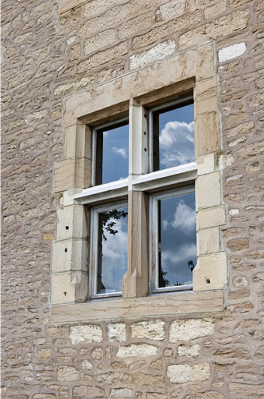
Demeure de Philibert de Molans (F), façade postérieure, détail d'une baie. 25, Rougemont quartier de la Citadelle