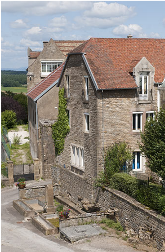
Bâtiment (A), vue rapprochée du côté rue. 25, Rougemont quartier de la Citadelle