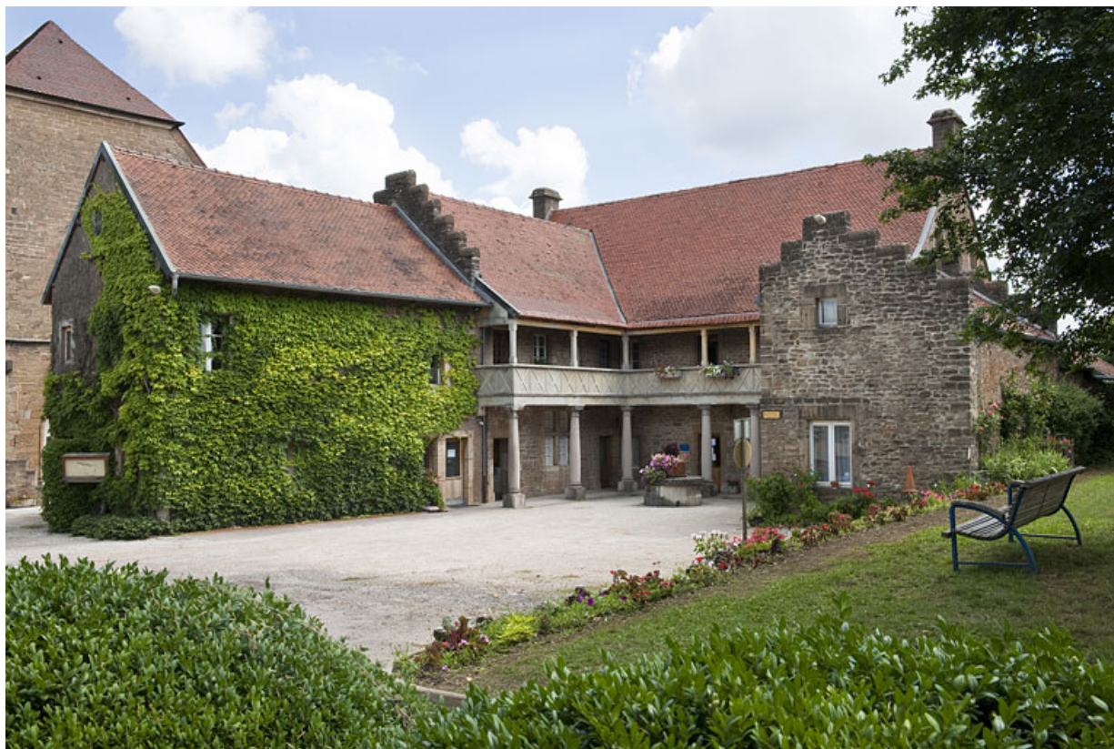
Demeure de Philibert de Molans (F), vue générale.