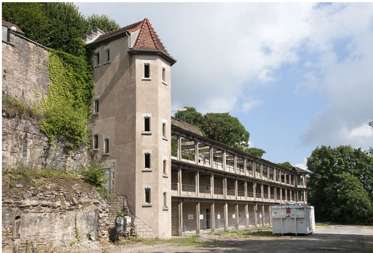
Bâtiment (H), vue rapprochée de la galerie. 25, Rougemont quartier de la Citadelle