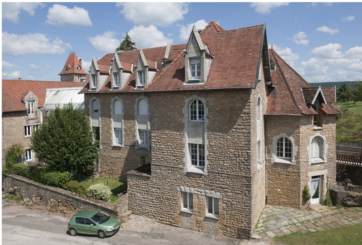
Bâtiment (G), vue d'ensemble côté rue. 25, Rougemont quartier de la Citadelle