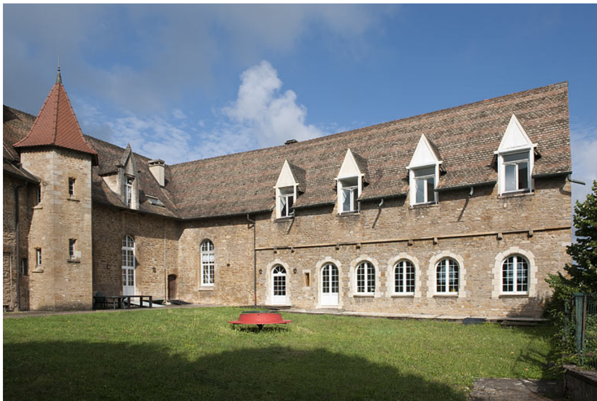
Bâtiment (C) et aile en retour côté jardin.