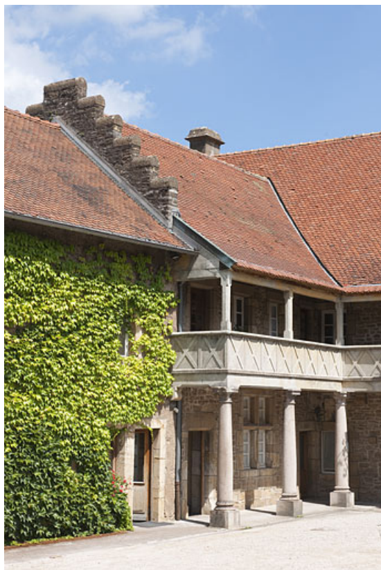
Demeure de Philibert de Molans (F), vue de l'aile gauche. 25, Rougemont quartier de la Citadelle