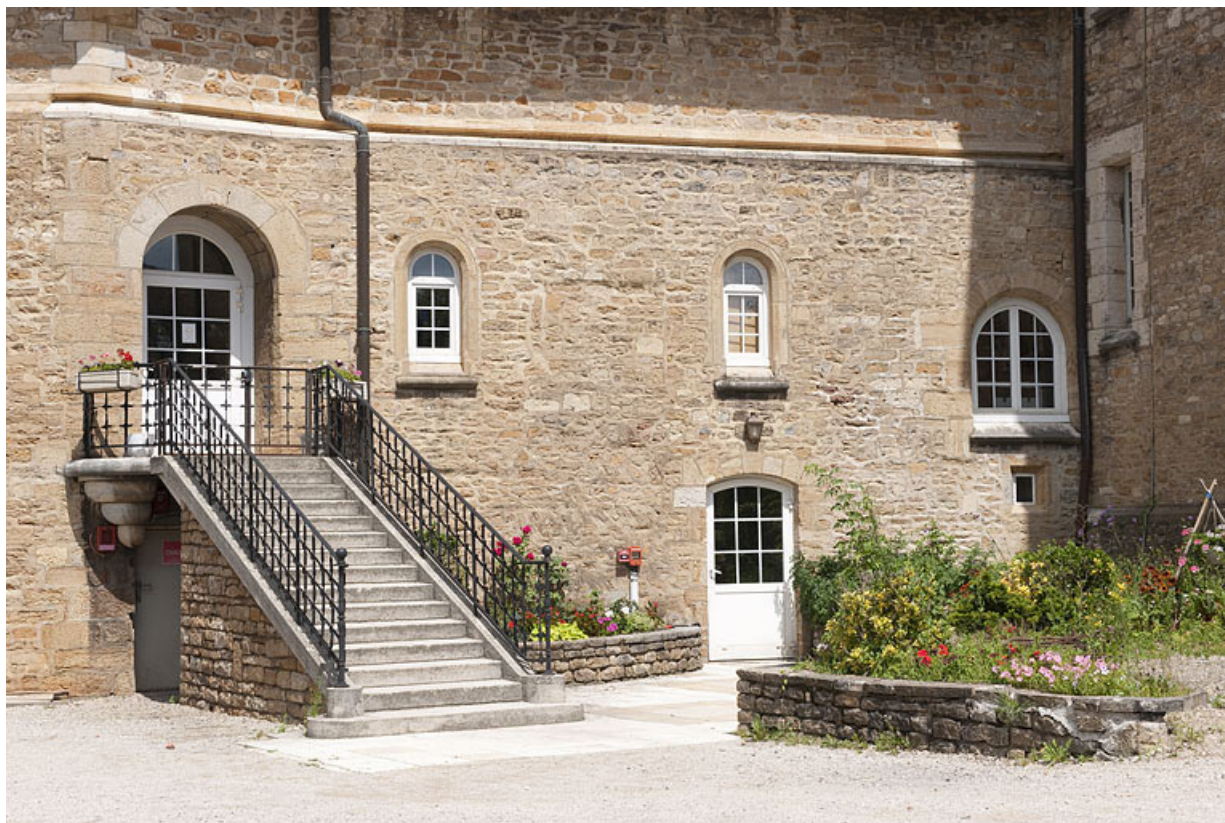
Bâtiment (C), escalier côté cour.