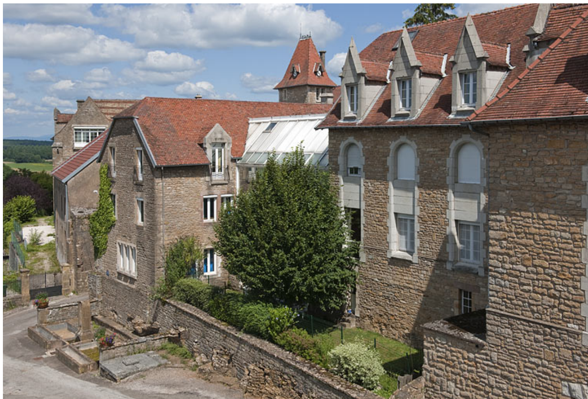
Bâtiment (A) et bâtiment (C), vue du côté rue. 25, Rougemont quartier de la Citadelle