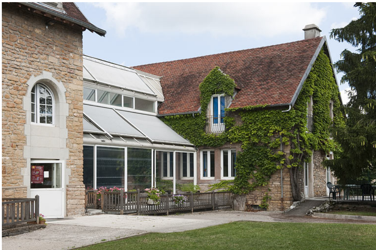
Bâtiment (G) relié au bâtiment (A) par une galerie vitrée.