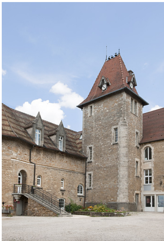
Bâtiment (C), tour d'escalier et chapelle (D). 25, Rougemont quartier de la Citadelle