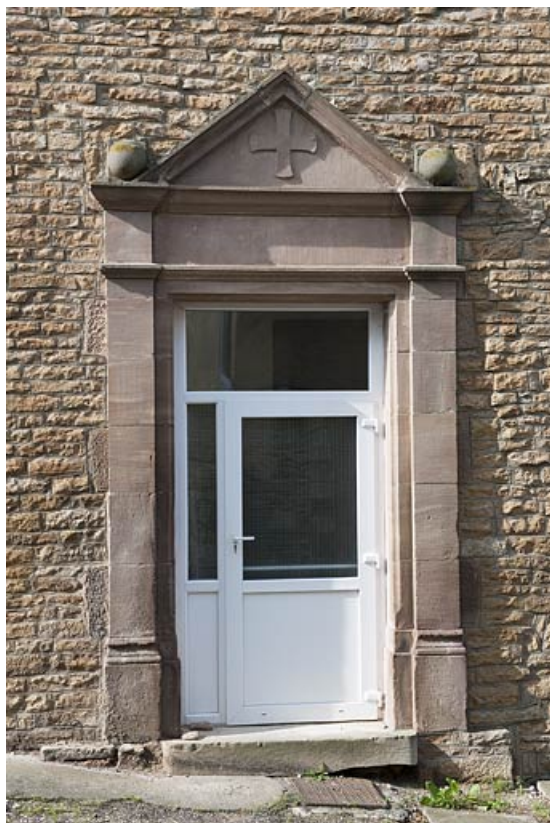
Bâtiment (A), détail : porte donnant accès au préau de l'ancienne école de filles. 25, Rougemont quartier de la Citadelle