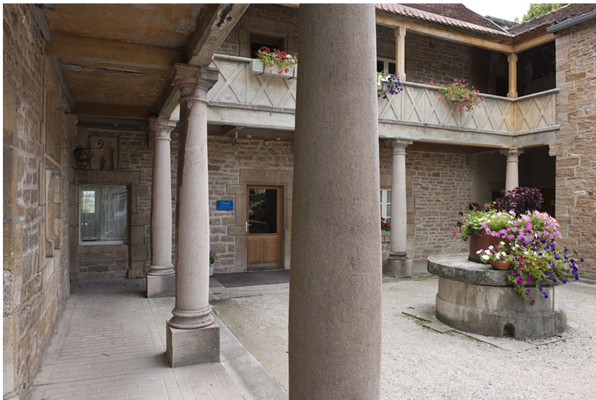
Demeure de Philibert de Molans (F), vue du portique à colonnes de trois quart gauche. 25, Rougemont quartier de la Citadelle