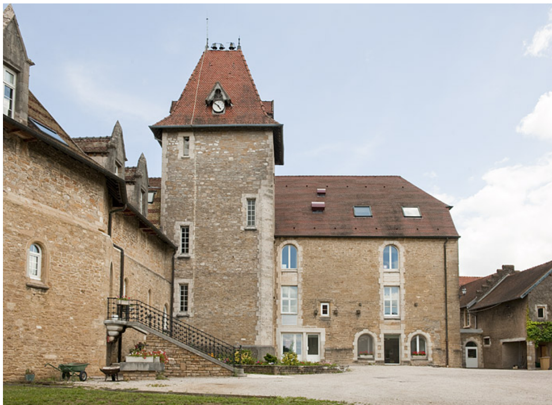
Bâtiment (C) et chapelle (D), vue depuis la cour. 25, Rougemont quartier de la Citadelle