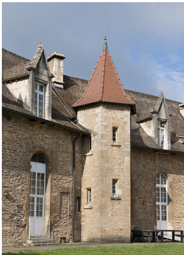
Bâtiment (C), côté jardin, détail de la tour d'escalier. 25, Rougemont quartier de la Citadelle