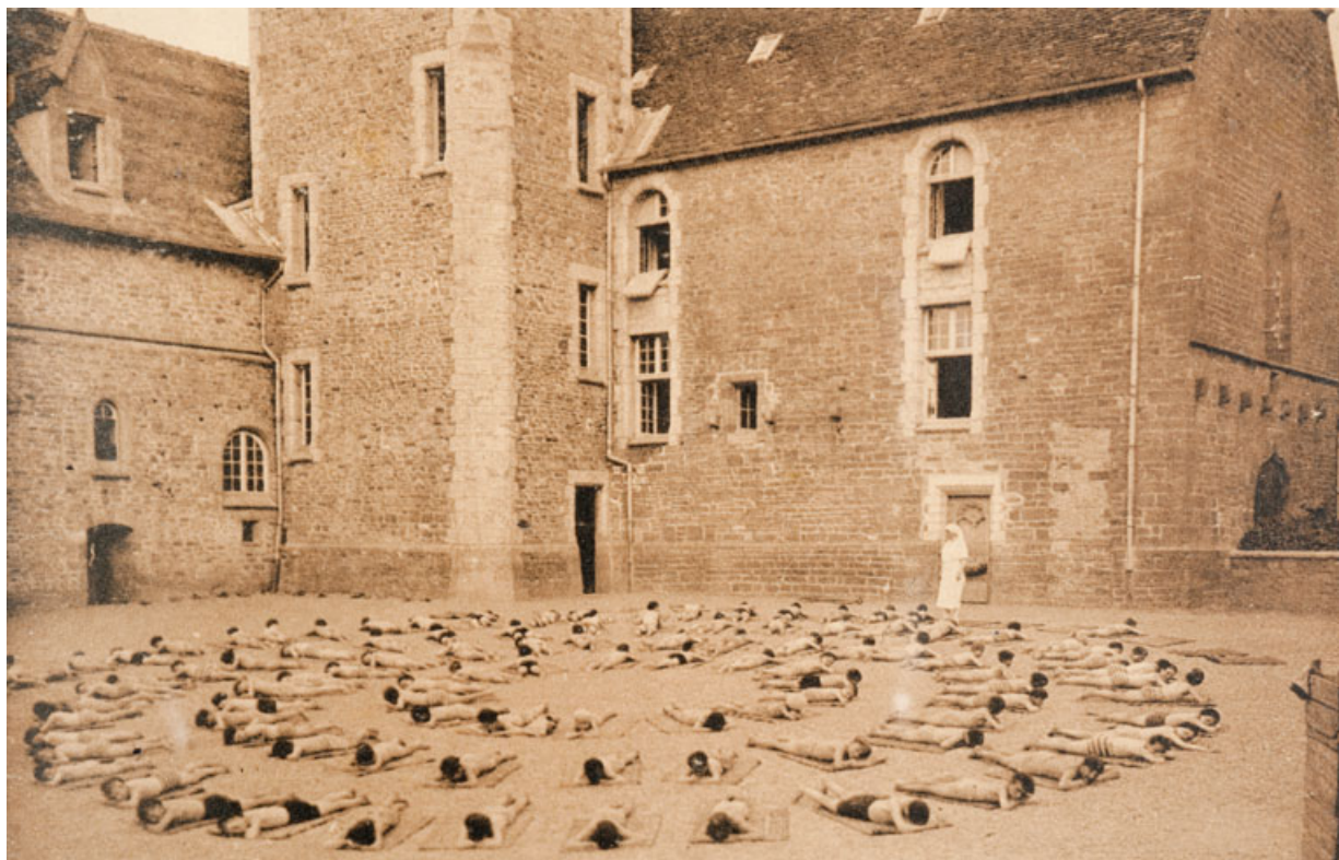
Maison d'Enfants de Rougemont (Doubs). - Cure solaire.