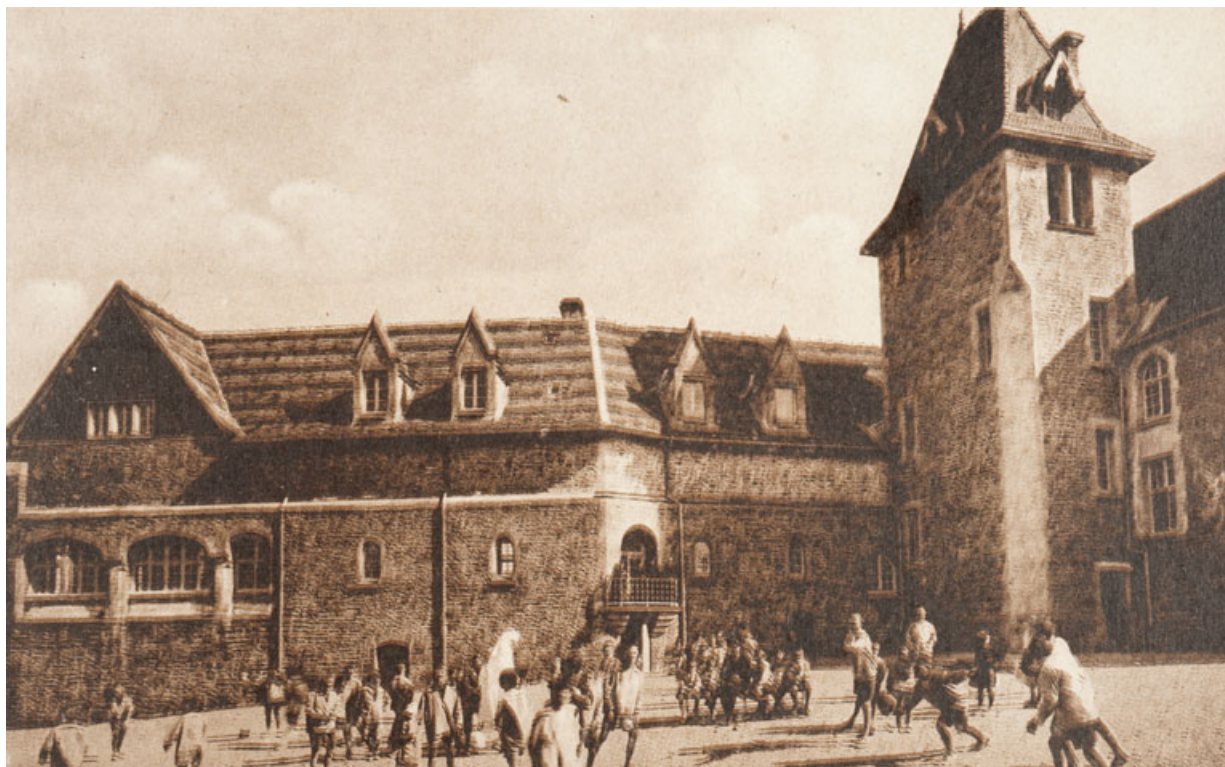
Rougemont (Doubs) - La Maison d' Enfants - Une cour. 25, Rougemont quartier de la Citadelle