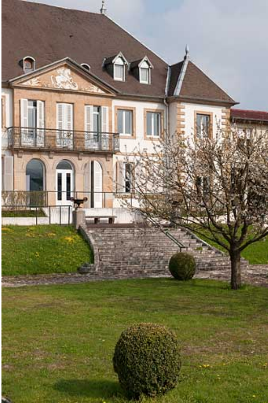
Vue rapprochée de la façade antérieure depuis le jardin.