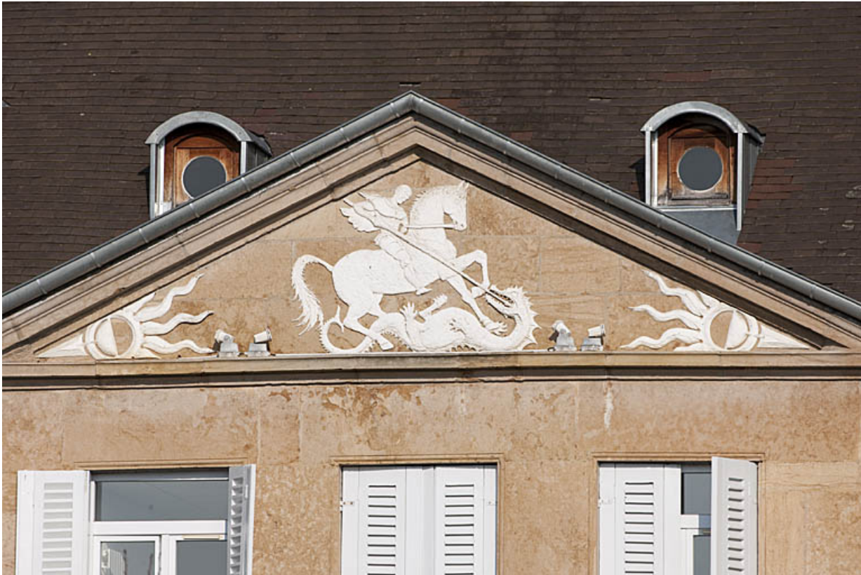
Façade antérieure, détail : le relief du fronton représentant saint Georges terrassant le dragon.