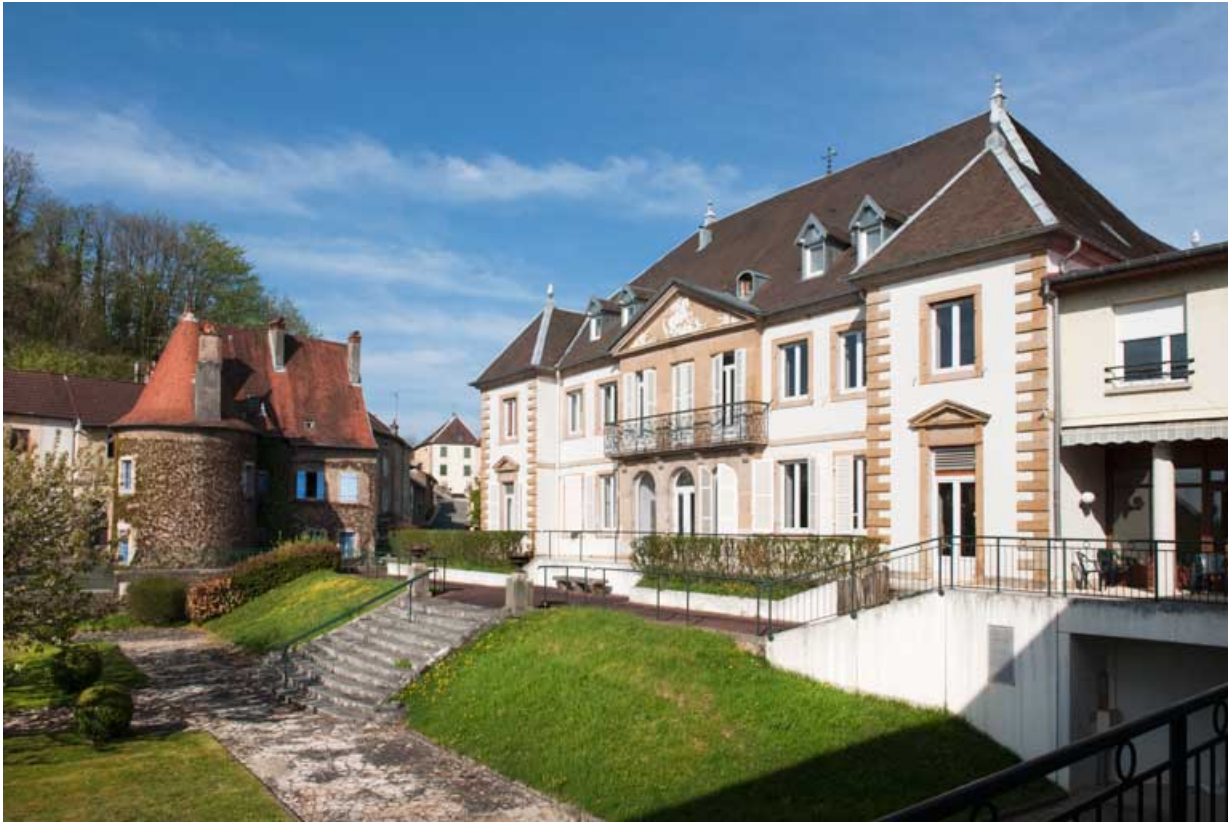
Vue d'ensemble de la maison du moulin et du château depuis le jardin.