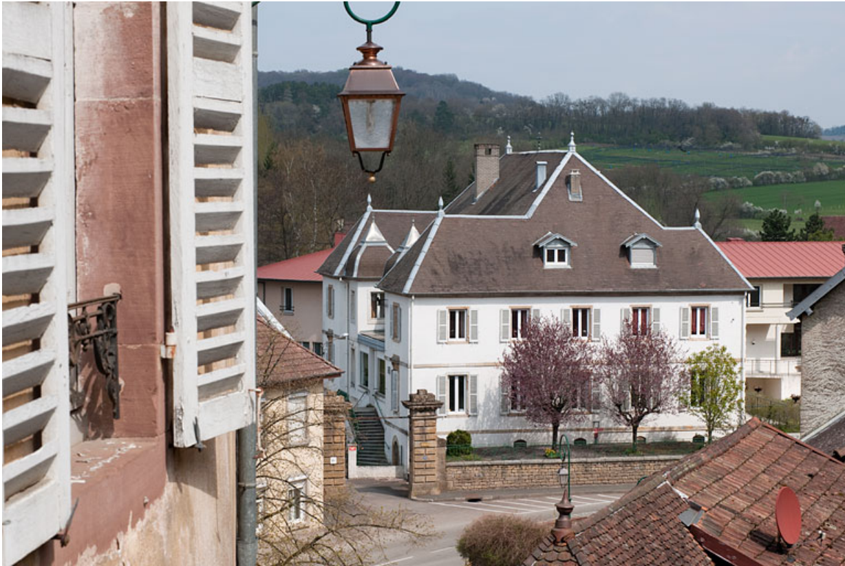
Vue rapprochée depuis la rue de la Petite Côte.