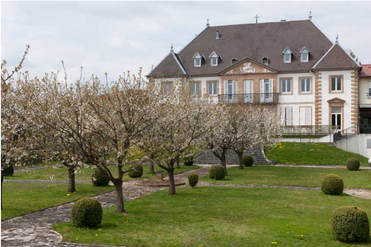
Vue d'ensemble de la façade antérieure et du jardin.