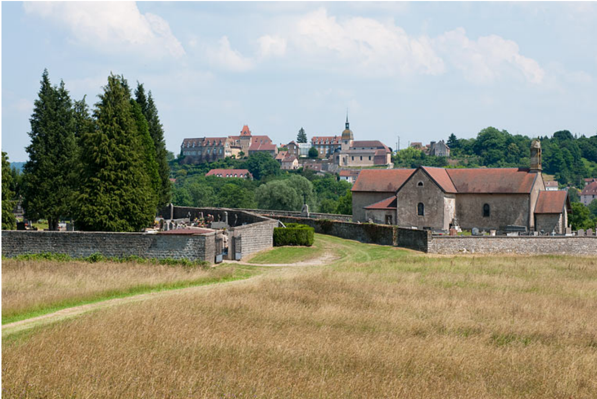
Vue générale, avec Rougemont en arrière-plan.