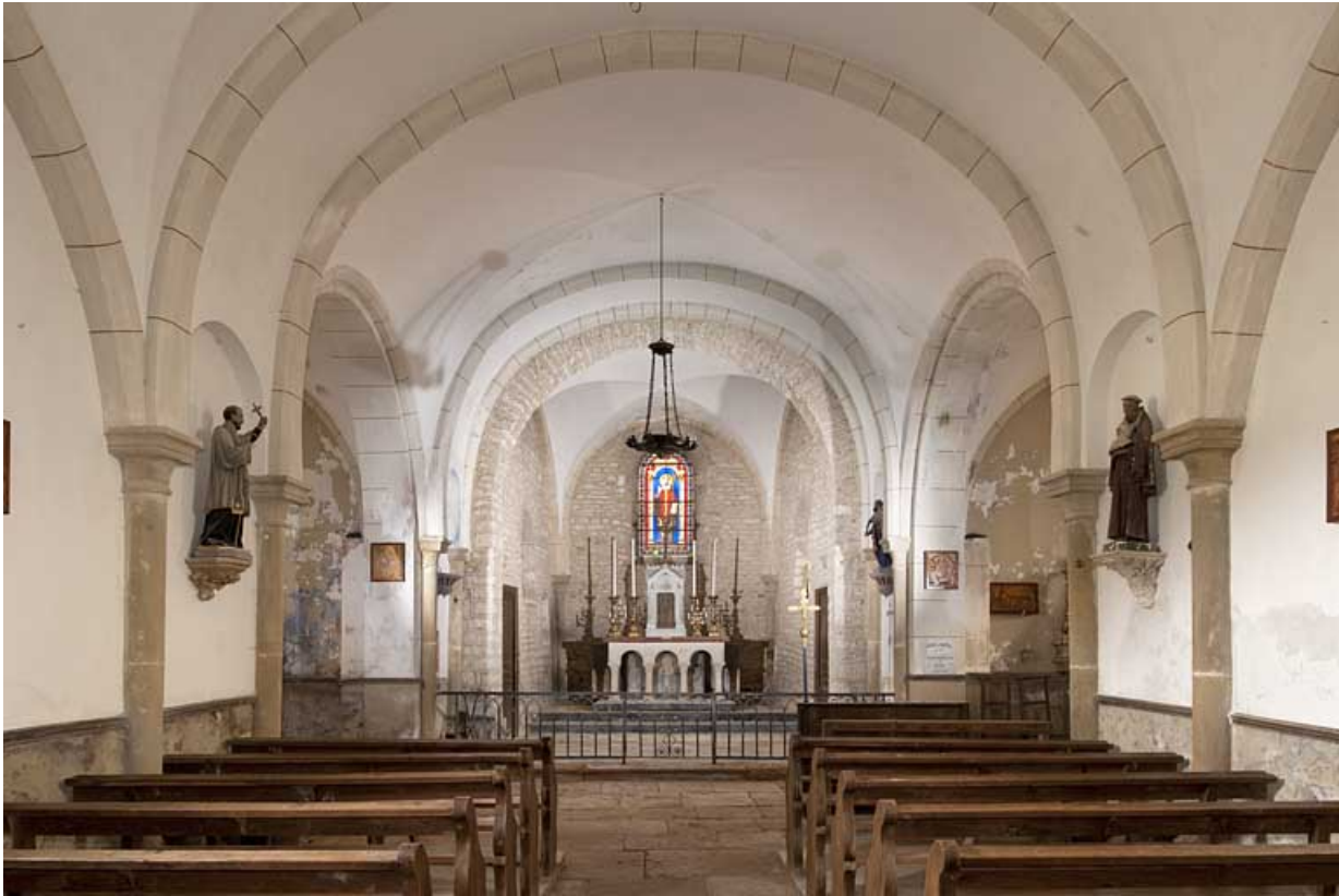
Intérieur : la nef et le chœur.