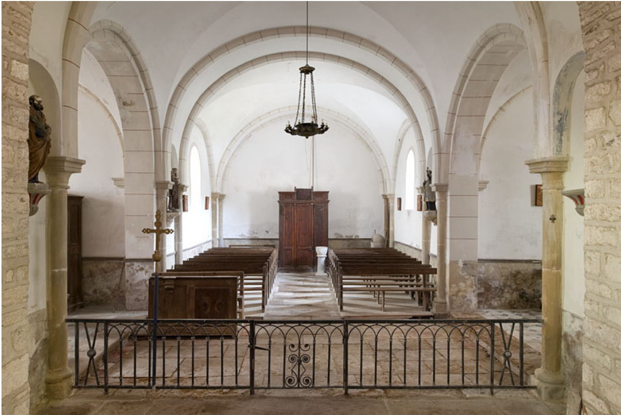
Intérieur : la nef vue du chœur.