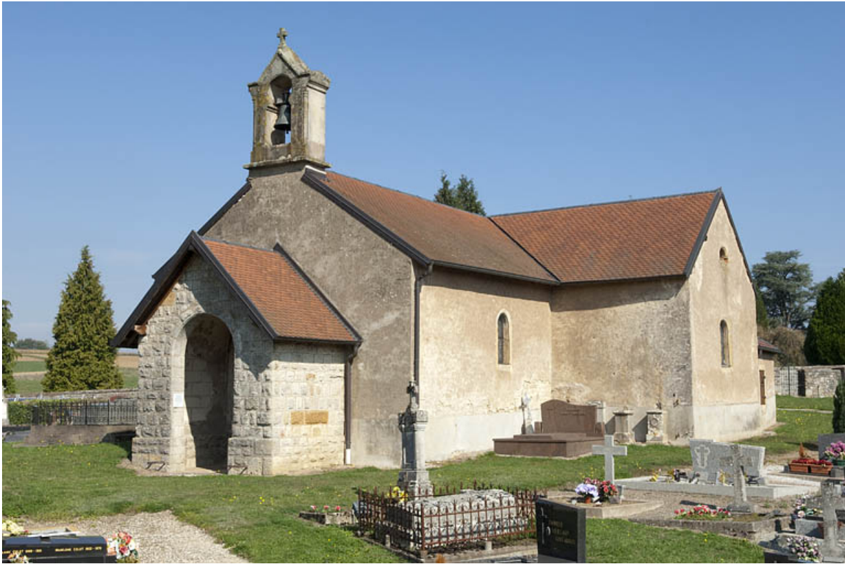
Vue de trois quarts droit.