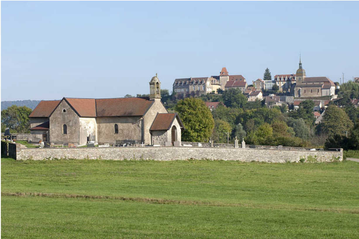
Vue générale rapprochée, avec Rougemont en arrière-plan.