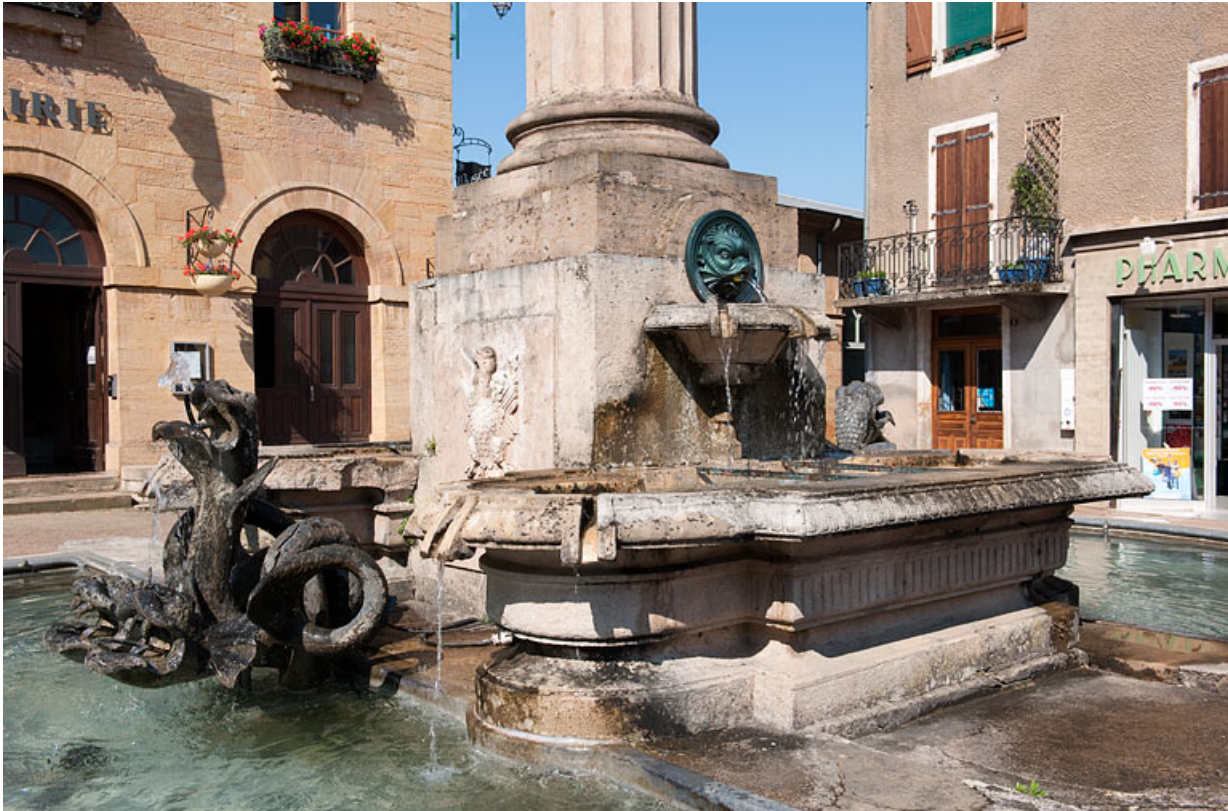
Vue rapprochée et de trois quart des bassins de la fontaine.