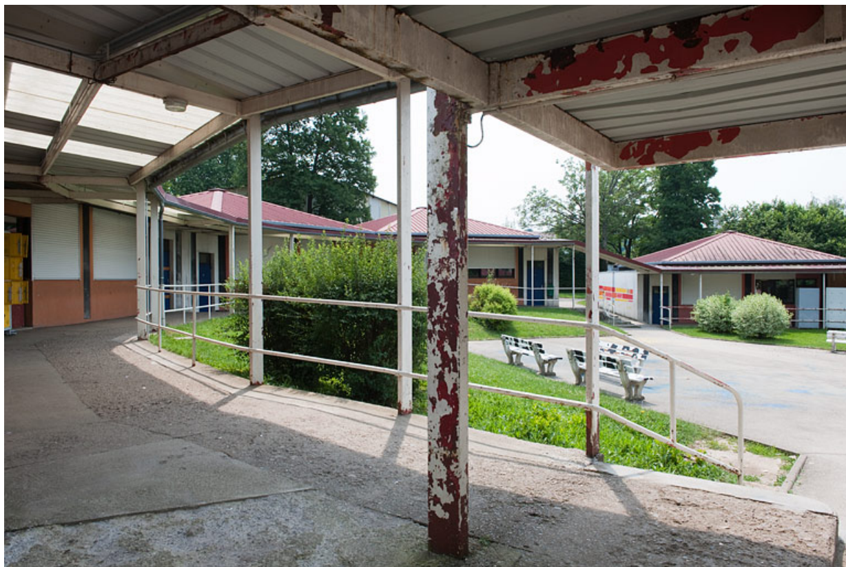
Vue générale de la galerie couverte.