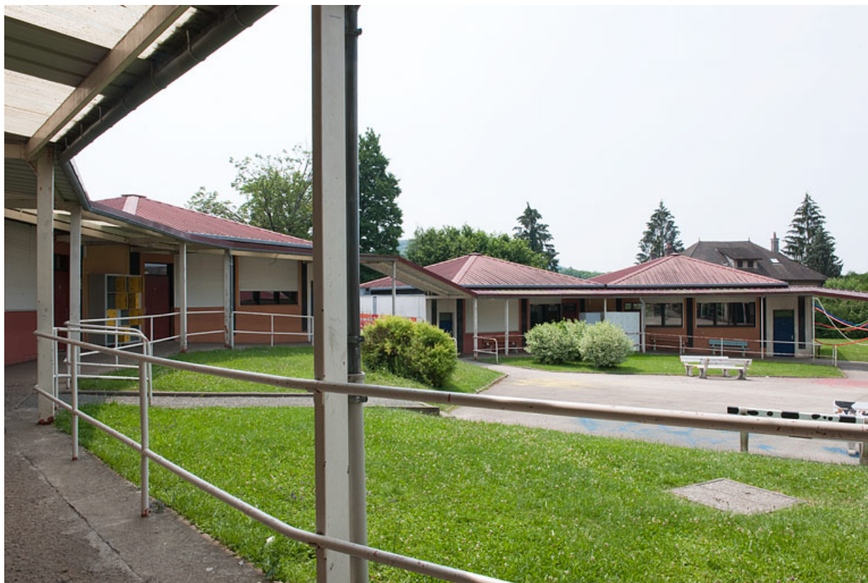
Vue de la cour de récréation depuis la galerie couverte.