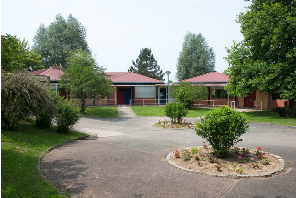
Vue rapprochée des pentagones depuis la cour d'entrée.