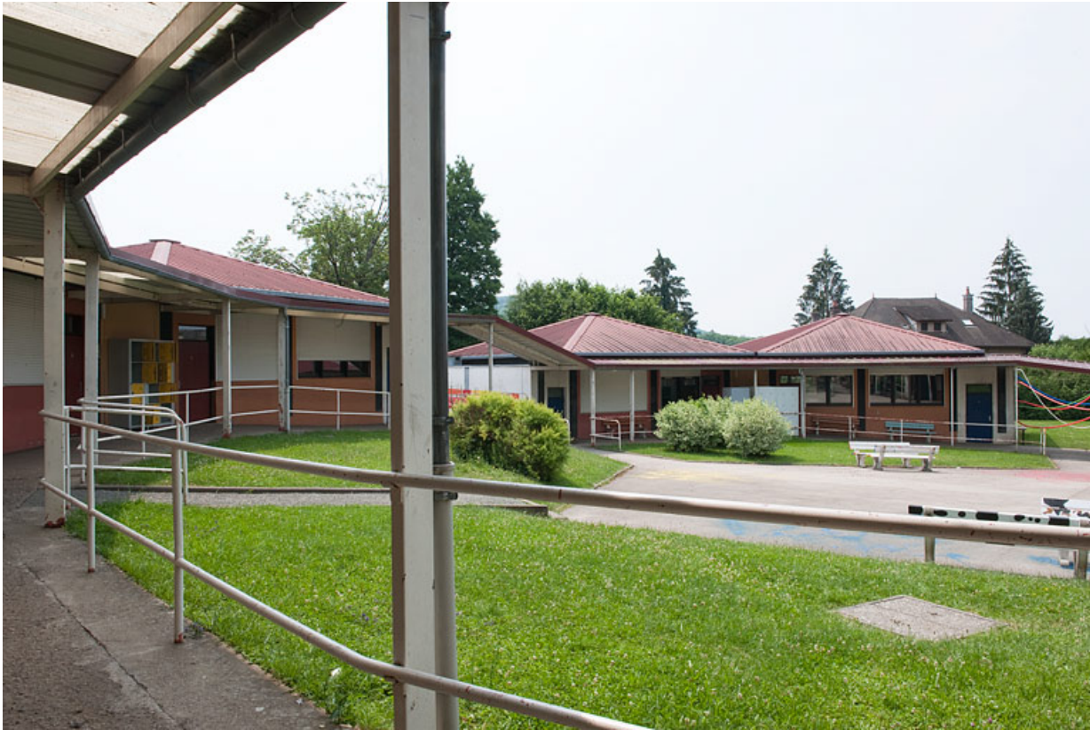
Vue de la cour de récréation depuis la galerie couverte.