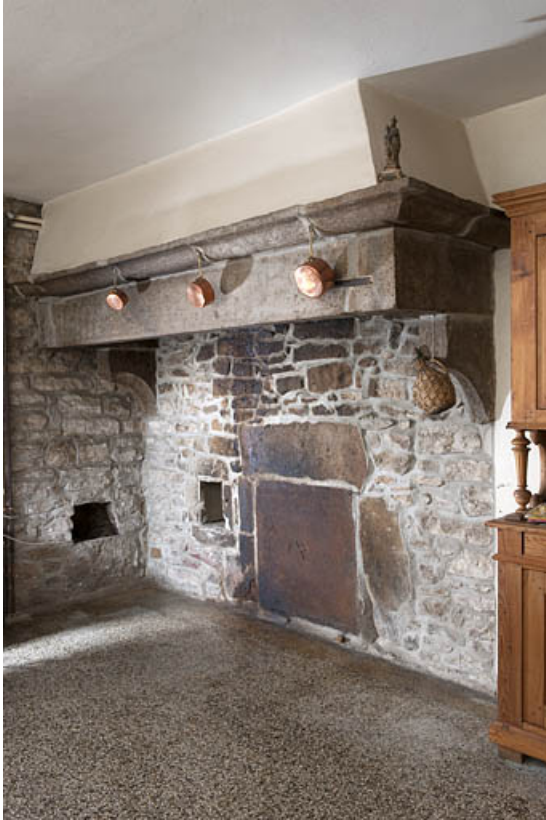
Vue générale de la cheminée de l'ancienne cuisine.

25, Rougemont, 2 quartier de la Citadelle