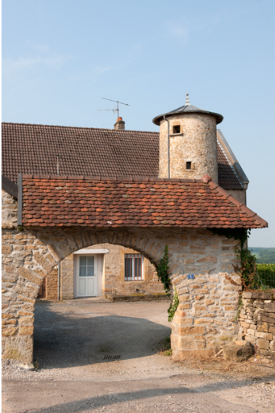
façade antérieure, détail : le porche.

25, Rougemont, 2 quartier de la Citadelle