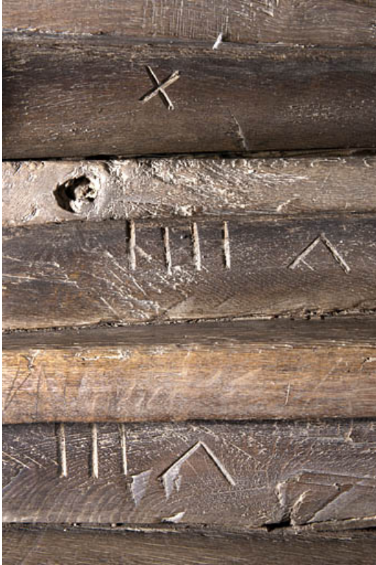
Intérieur : escalier en charpente meant à l'étage, détail des marches numérotées. 25, Rougemont, 2 quartier de la Citadelle