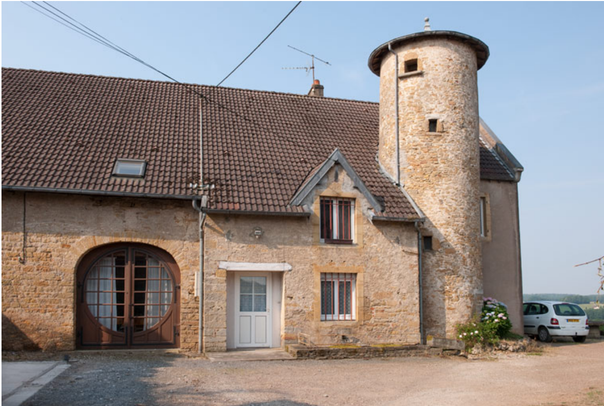
Façade antérieure vue de trois quart gauche.

25, Rougemont, 2 quartier de la Citadelle