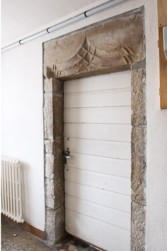
Intérieur : baie conduisant à l'ancienne grange.

25, Rougemont, 2 quartier de la Citadelle