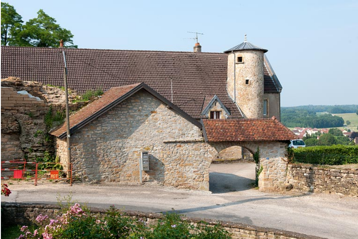
Vue d'ensemble depuis la rue du Quartier de la Citadelle.

25, Rougemont, 2 quartier de la Citadelle