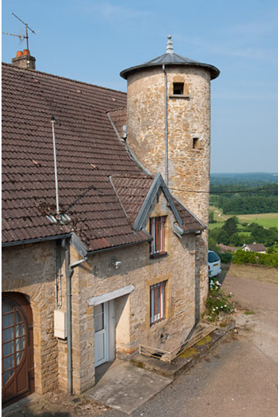
Vue de la tour hors oeuvre de la façade antérieure.

25, Rougemont, 2 quartier de la Citadelle