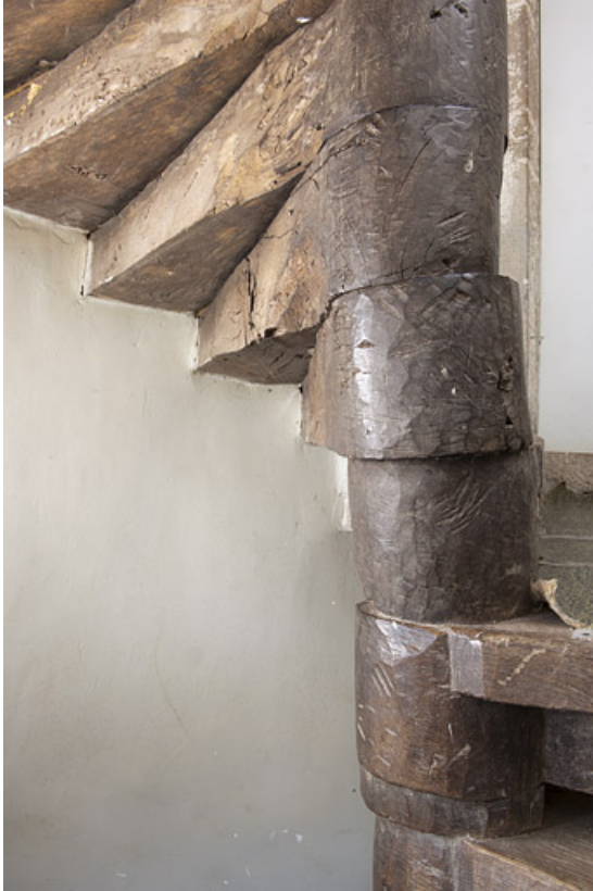
Intérieur : détail de l'escalier en vis menant à l'étage.

25, Rougemont, 2 quartier de la Citadelle