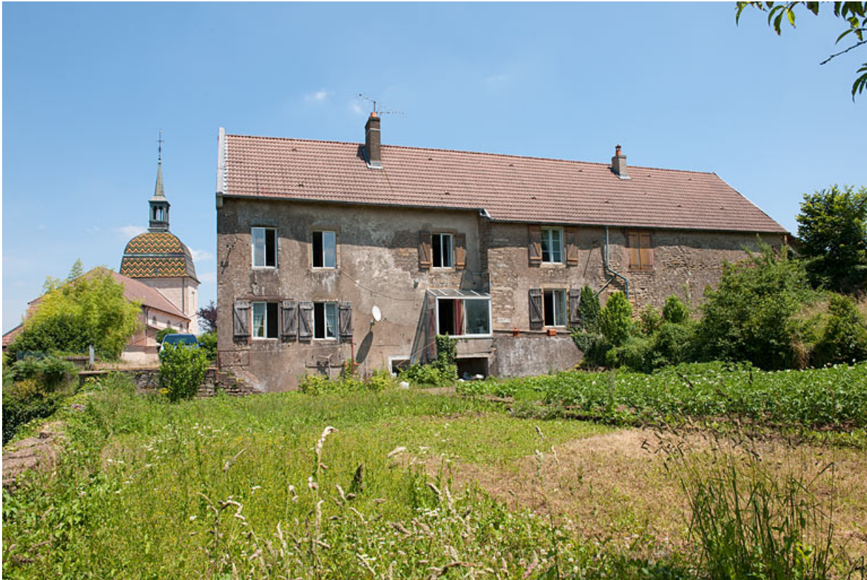
Vue générale de la façade postérieure.

25, Rougemont, 2 quartier de la Citadelle