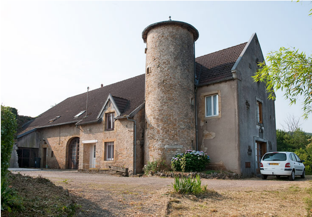
Façade antérieure, vue de trois quart droit.

25, Rougemont, 2 quartier de la Citadelle