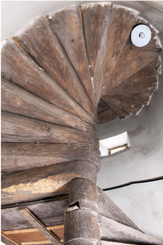
Intérieur : le dessous de l'escalier en vis menant à l'étage.

25, Rougemont, 2 quartier de la Citadelle