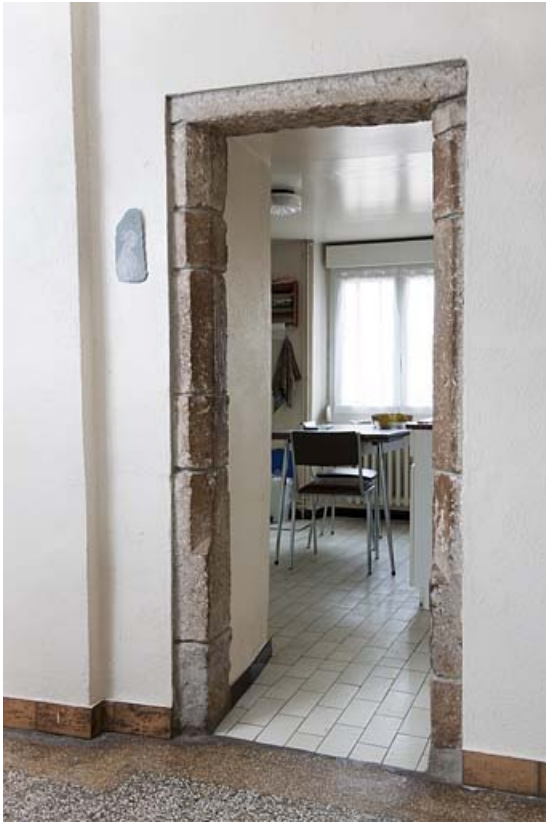
Porte aux montants moulurés ouvrant sur la nouvelle cuisine.

25, Rougemont, 2 quartier de la Citadelle