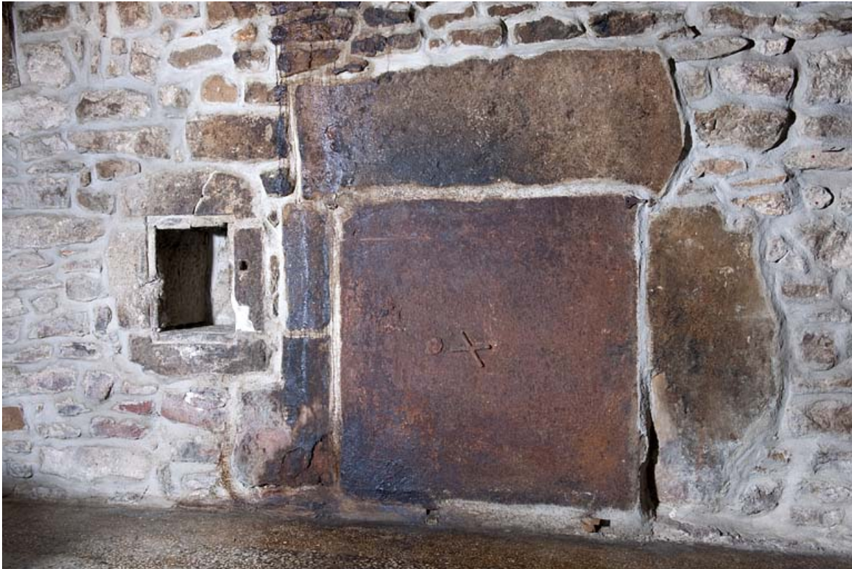
Détail de la cheminée

25, Rougemont, 2 quartier de la Citadelle