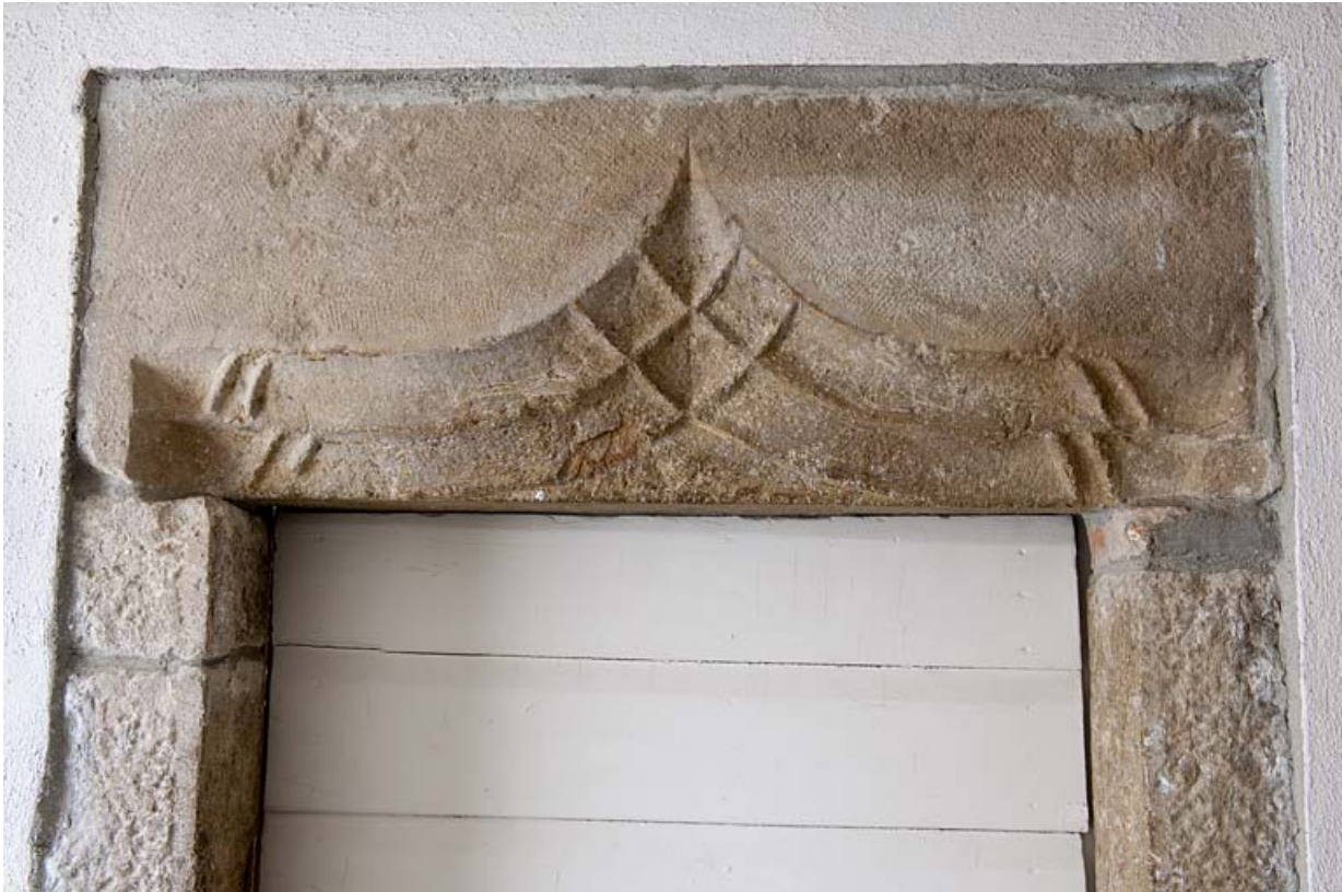
Intérieur : détail du linteau de la baie conduisant à l'ancienne grange.

25, Rougemont, 2 quartier de la Citadelle