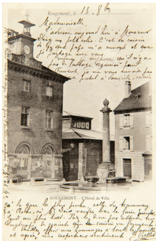
Rougemont-L'Hôtel de Ville. 25, Rougemont rue du Lavoir