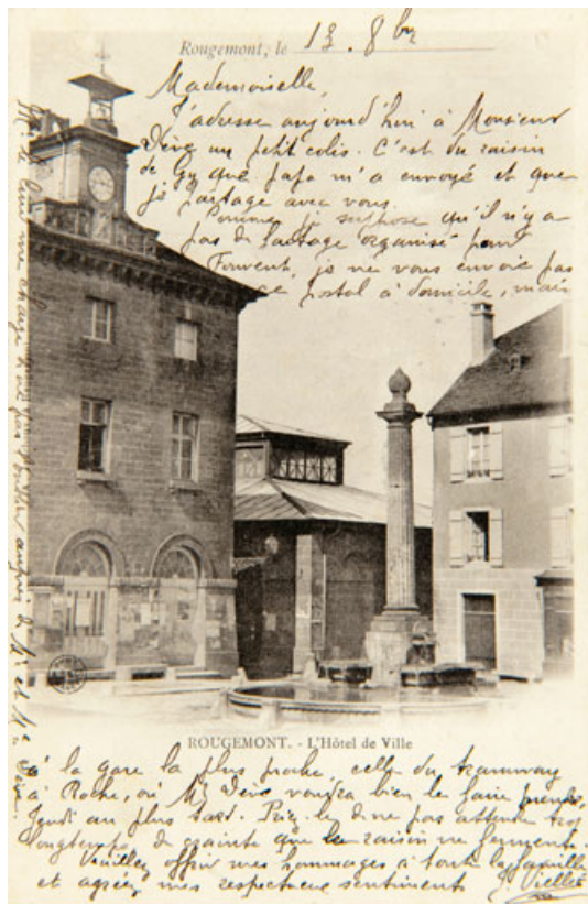
Rougemont-L'Hôtel de Ville. 25, Rougemont rue du Lavoir