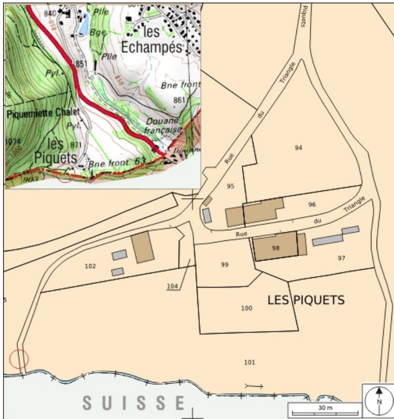
Plan masse et carte de localisation. Extrait du plan cadastral, 2008, section C, échelle 1/1 000 et extrait de la carte IGN, échelle 1/12 500 ; SCAN 25 (c) IGN - 2008, Licence n° 2008CISE29-68.