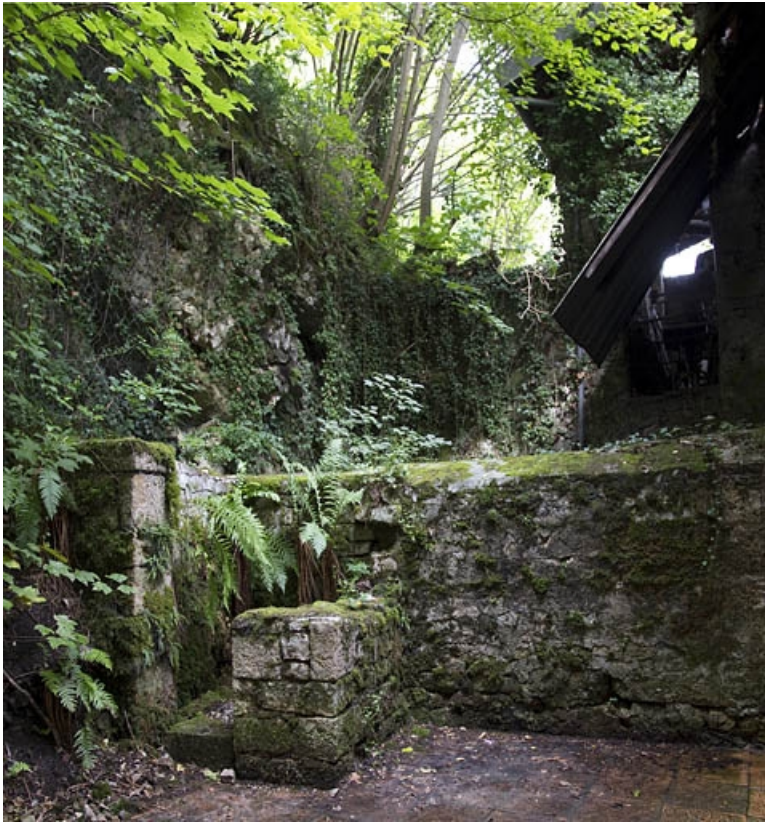
Vestiges des anciennes glacières de la ville (?) : 72 rue du Faubourg Rivotte.

25, Besançon, 62, 64, 66, 68, 70, 72 rue du Faubourg Rivotte, lieudit : îlot Porte taillée