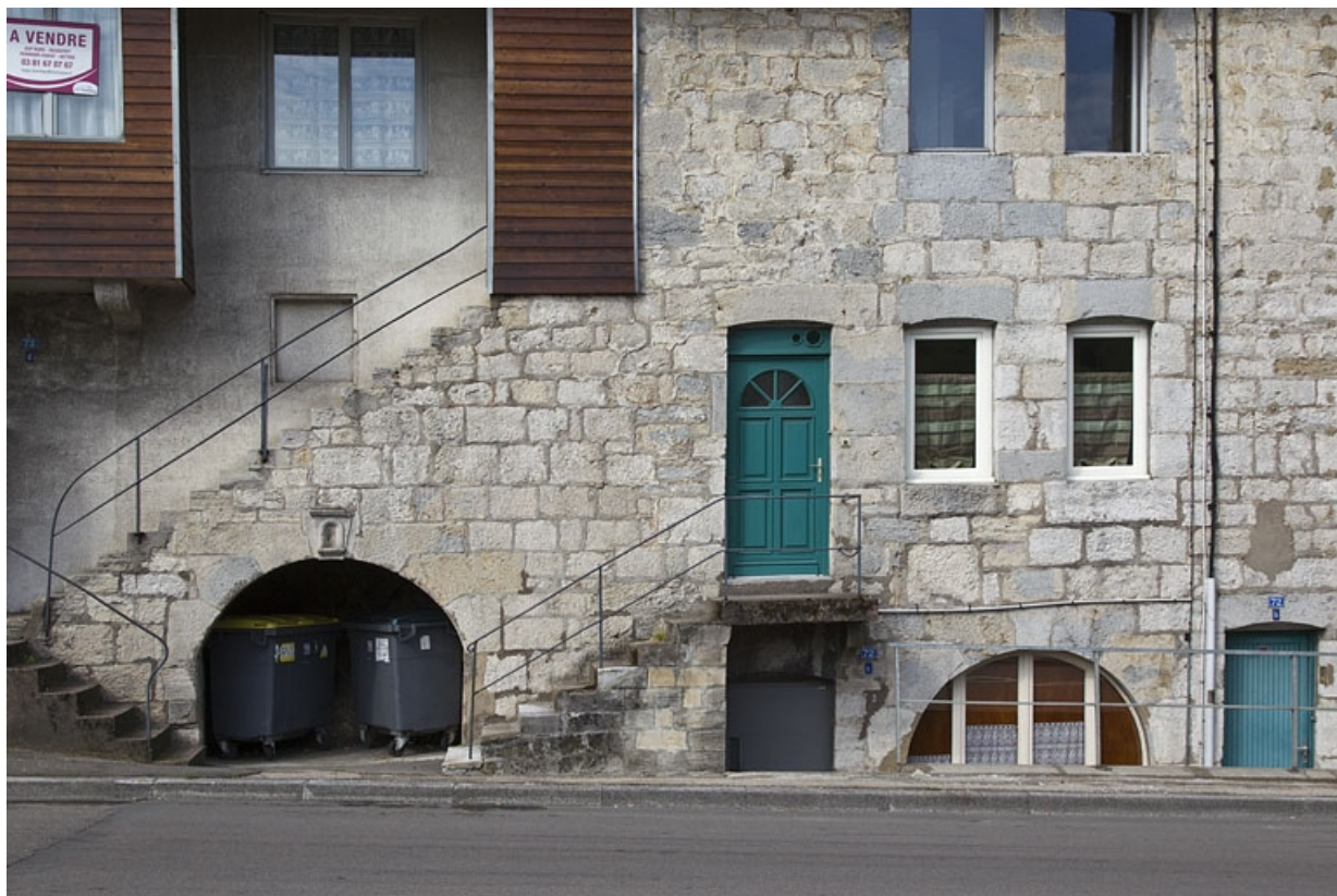
Maison, 72 rue du Faubourg Rivotte, de face.

25, Besançon, 62, 64, 66, 68, 70, 72 rue du Faubourg Rivotte, lieudit : îlot Porte taillée