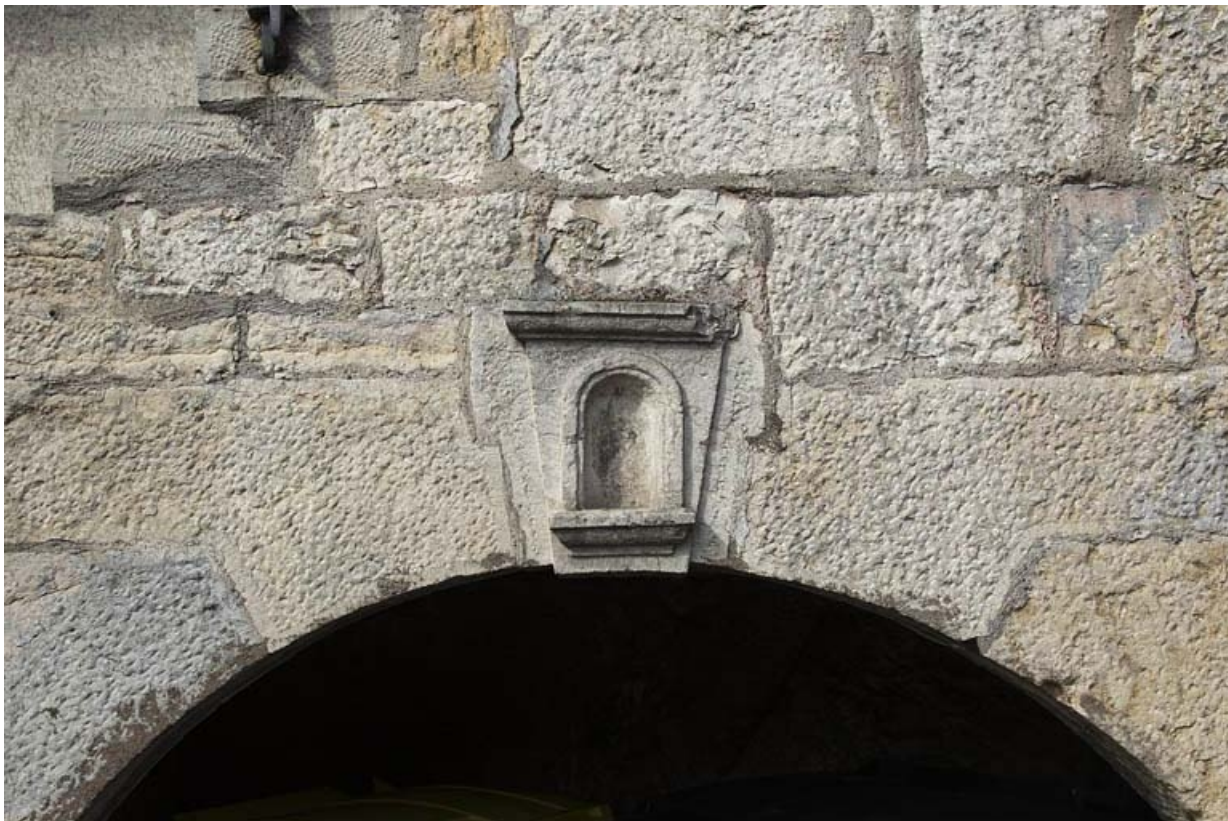
Détail d'une niche : 72 rue du Faubourg Rivotte.

25, Besançon, 62, 64, 66, 68, 70, 72 rue du Faubourg Rivotte, lieudit : îlot Porte taillée