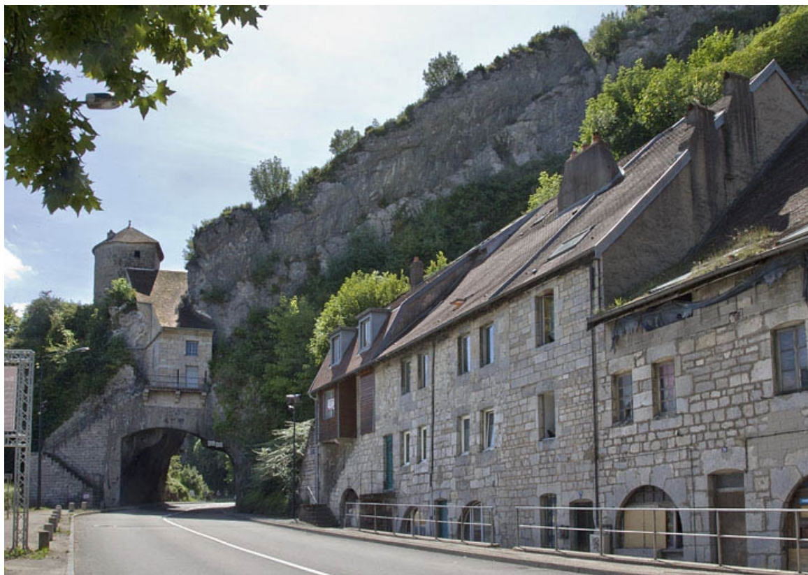
Vue d'ensemble rapprochée, de trois quarts droit.

25, Besançon, 62, 64, 66, 68, 70, 72 rue du Faubourg Rivotte, lieudit : îlot Porte taillée