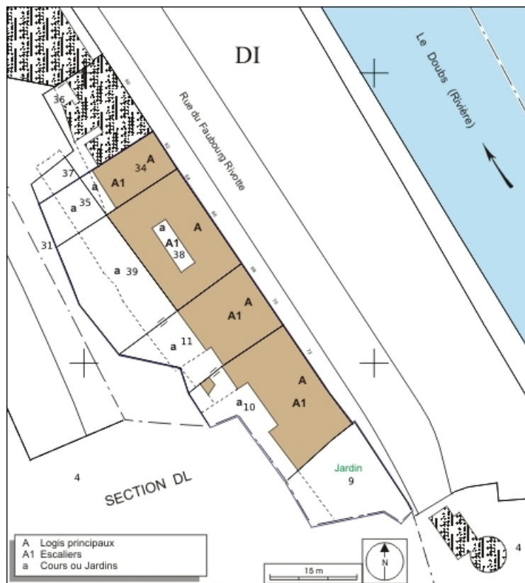
Plan masse et de situation. Extrait du plan cadastral, 1974, section DI.

25, Besançon, 62, 64, 66, 68, 70, 72 rue du Faubourg Rivotte, lieudit : îlot Porte taillée