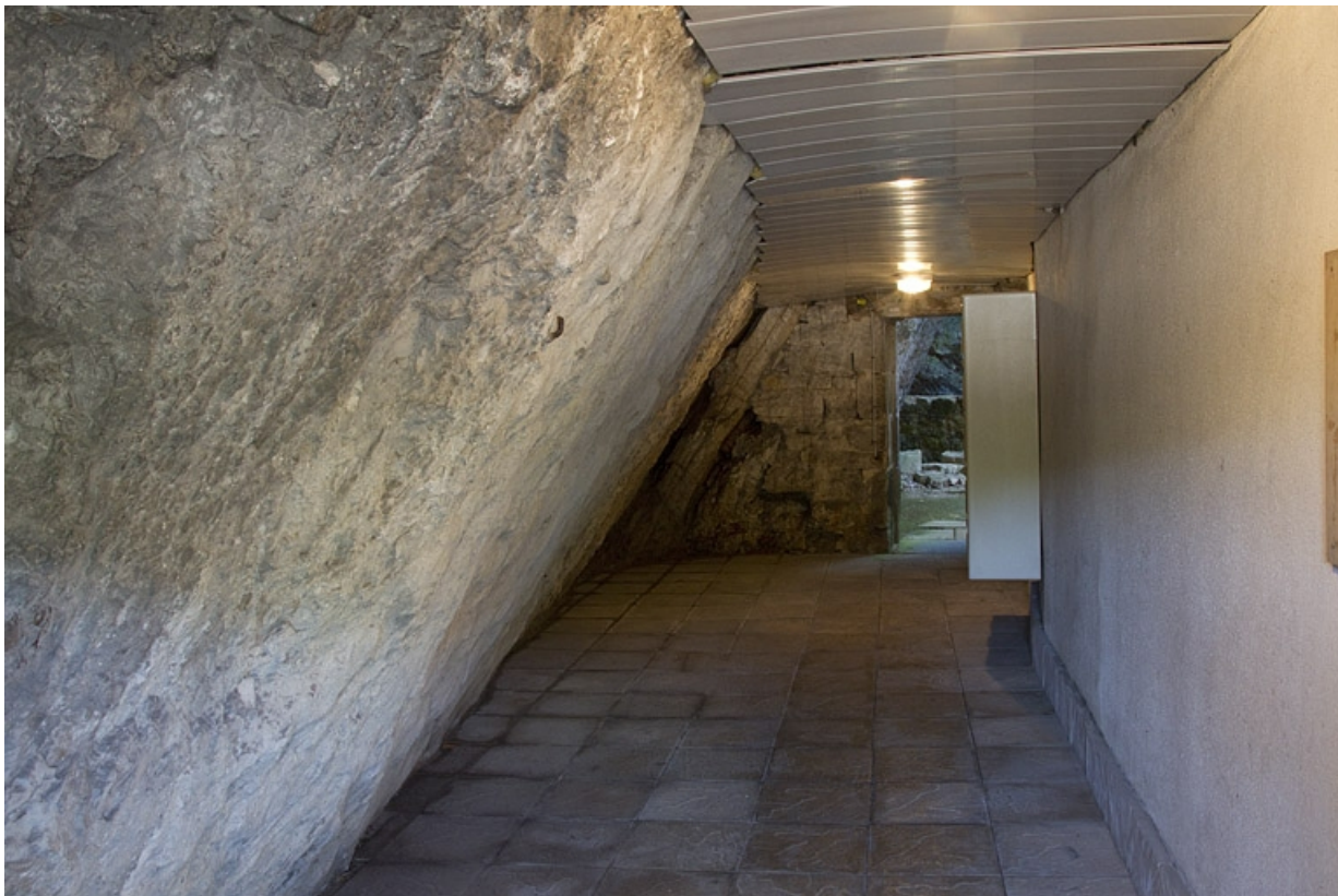
Maison, 72 Faubourg Rivotte, couloir d'accès à la cour.

25, Besançon, 62, 64, 66, 68, 70, 72 rue du Faubourg Rivotte, lieudit : îlot Porte taillée