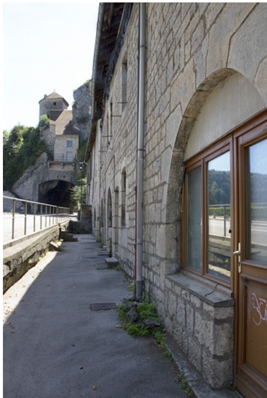
Vue d'ensemble la courette devant les maisons, de trois quarts droit.

25, Besançon, 62, 64, 66, 68, 70, 72 rue du Faubourg Rivotte, lieudit : îlot Porte taillée