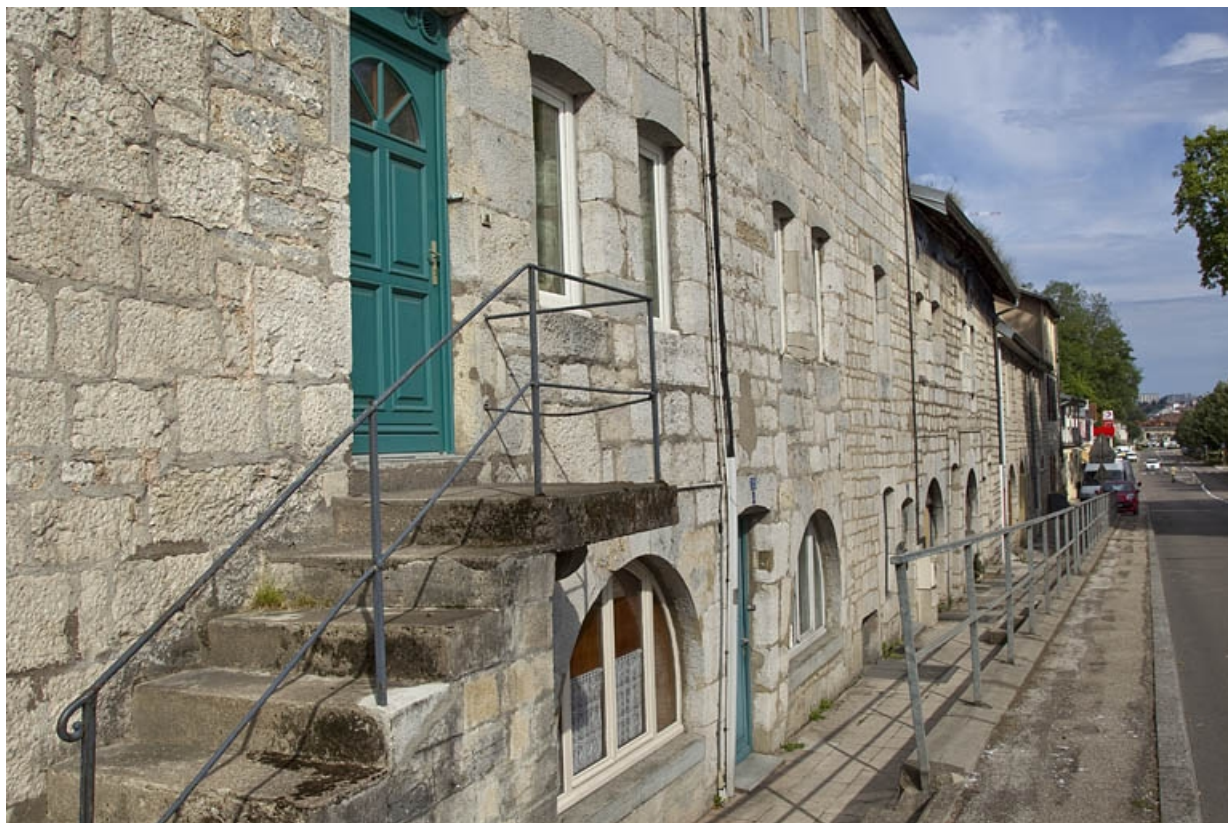
Maison, 72 rue du Faubourg Rivotte, de trois quarts gauche.

25, Besançon, 62, 64, 66, 68, 70, 72 rue du Faubourg Rivotte, lieudit : îlot Porte taillée