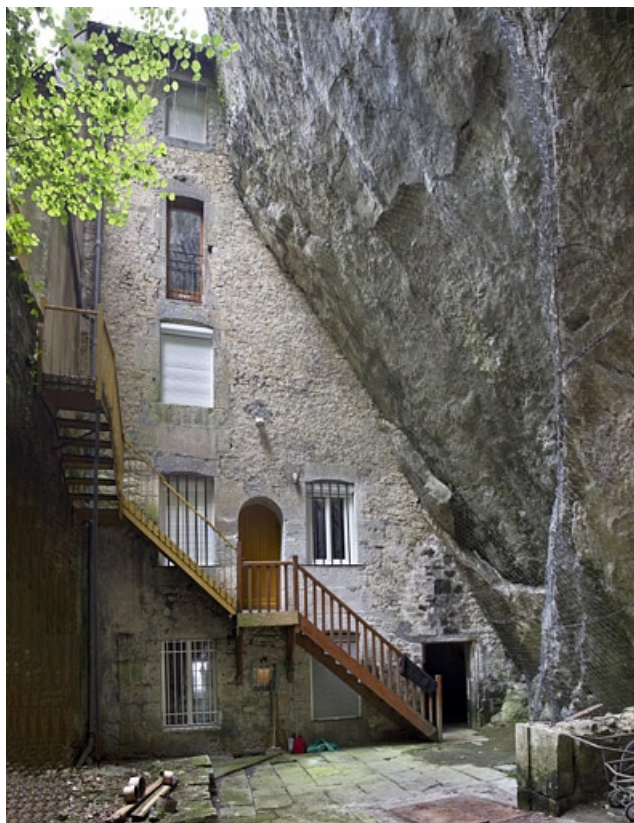
Façade postérieure : 72 rue du Faubourg Rivotte.

25, Besançon, 62, 64, 66, 68, 70, 72 rue du Faubourg Rivotte, lieudit : îlot Porte taillée