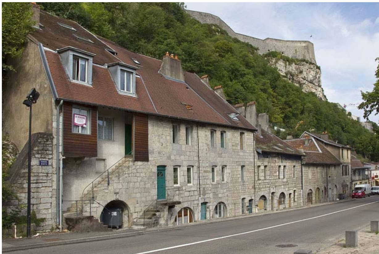
Vue d'ensemble rapprochée, de trois quart gauche.

25, Besançon, 62, 64, 66, 68, 70, 72 rue du Faubourg Rivotte, lieudit : îlot Porte taillée