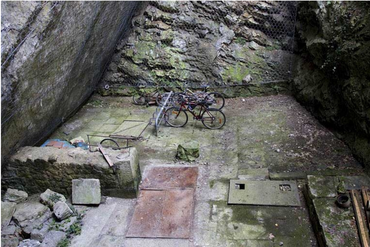
Vestiges des anciennes glaciers de la ville (?), 72 rue du Faubourg Rivotte.

25, Besançon, 62, 64, 66, 68, 70, 72 rue du Faubourg Rivotte, lieudit : îlot Porte taillée