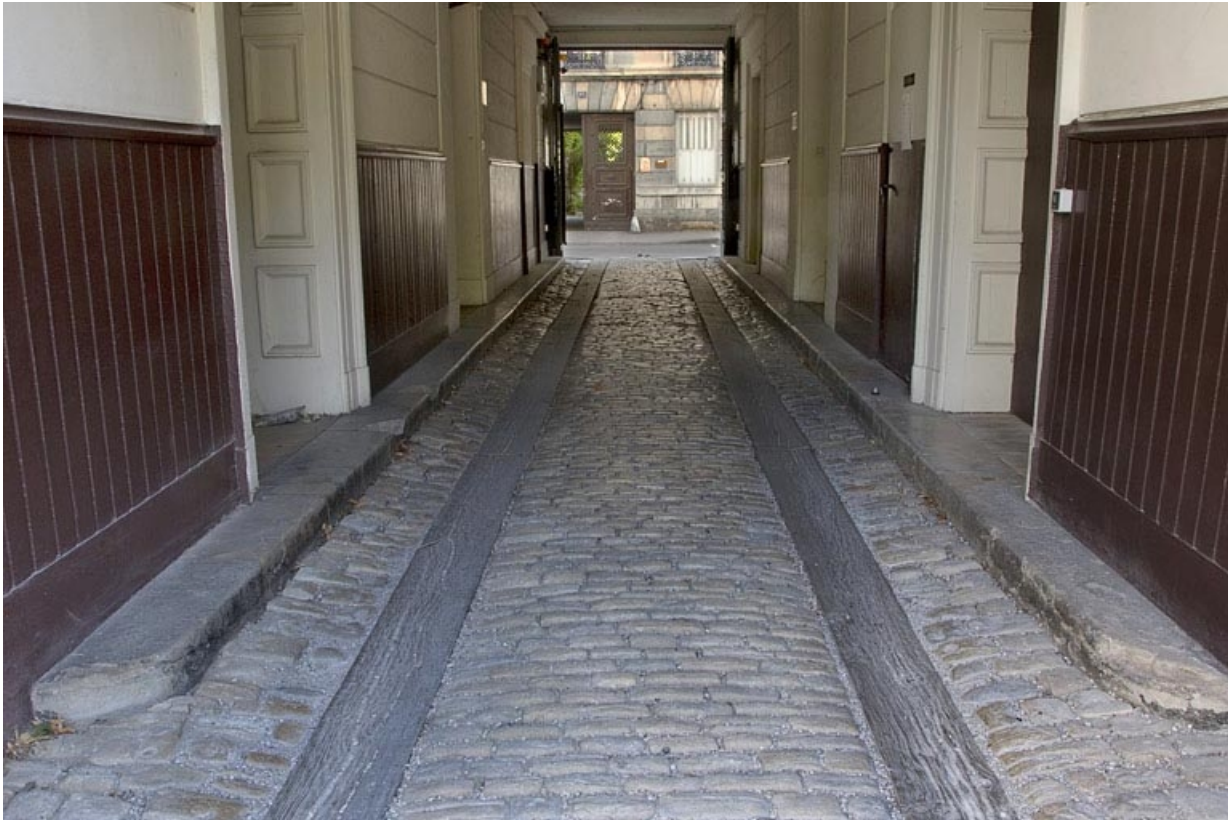
Vue d'ensemble du passage cocher depuis l'entrée.

25, Besançon, 32 rue Charles Nodier, lieudit : îlot Porteau