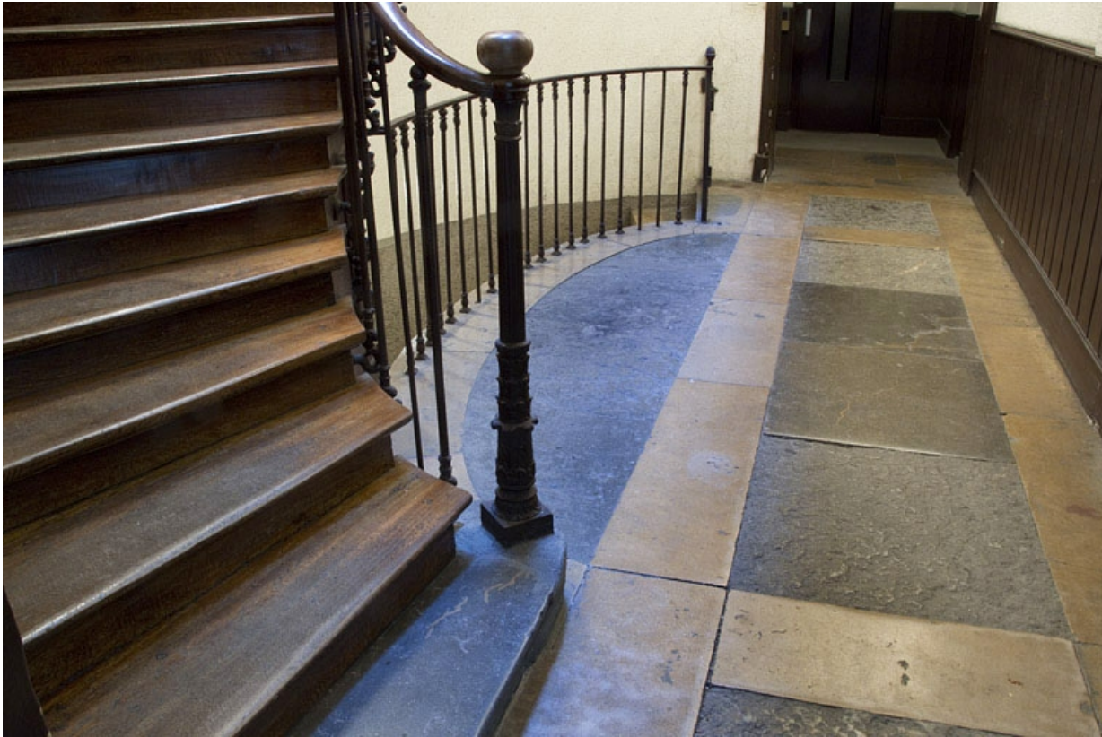
Intérieur, escalier : détail du sol en pierre.

25, Besançon, 32 rue Charles Nodier, lieudit : îlot Porteau