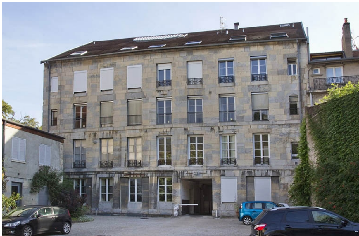
Vue d'ensemble de la façade postérieure depuis la cour.

25, Besançon, 32 rue Charles Nodier, lieudit : îlot Porteau