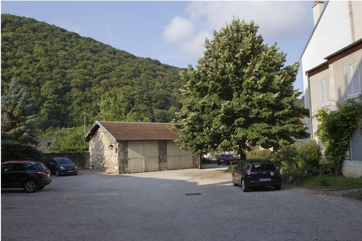
Cour : bâtiment des anciennes remises, de trois quarts gauche.

25, Besançon, 32 rue Charles Nodier, lieudit : îlot Porteau