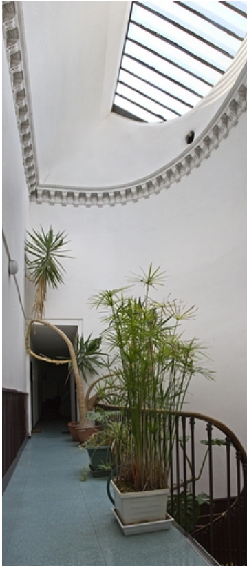
Intérieur : détail du plafond de la cage d'escalier.

25, Besançon, 32 rue Charles Nodier, lieudit : îlot Porteau