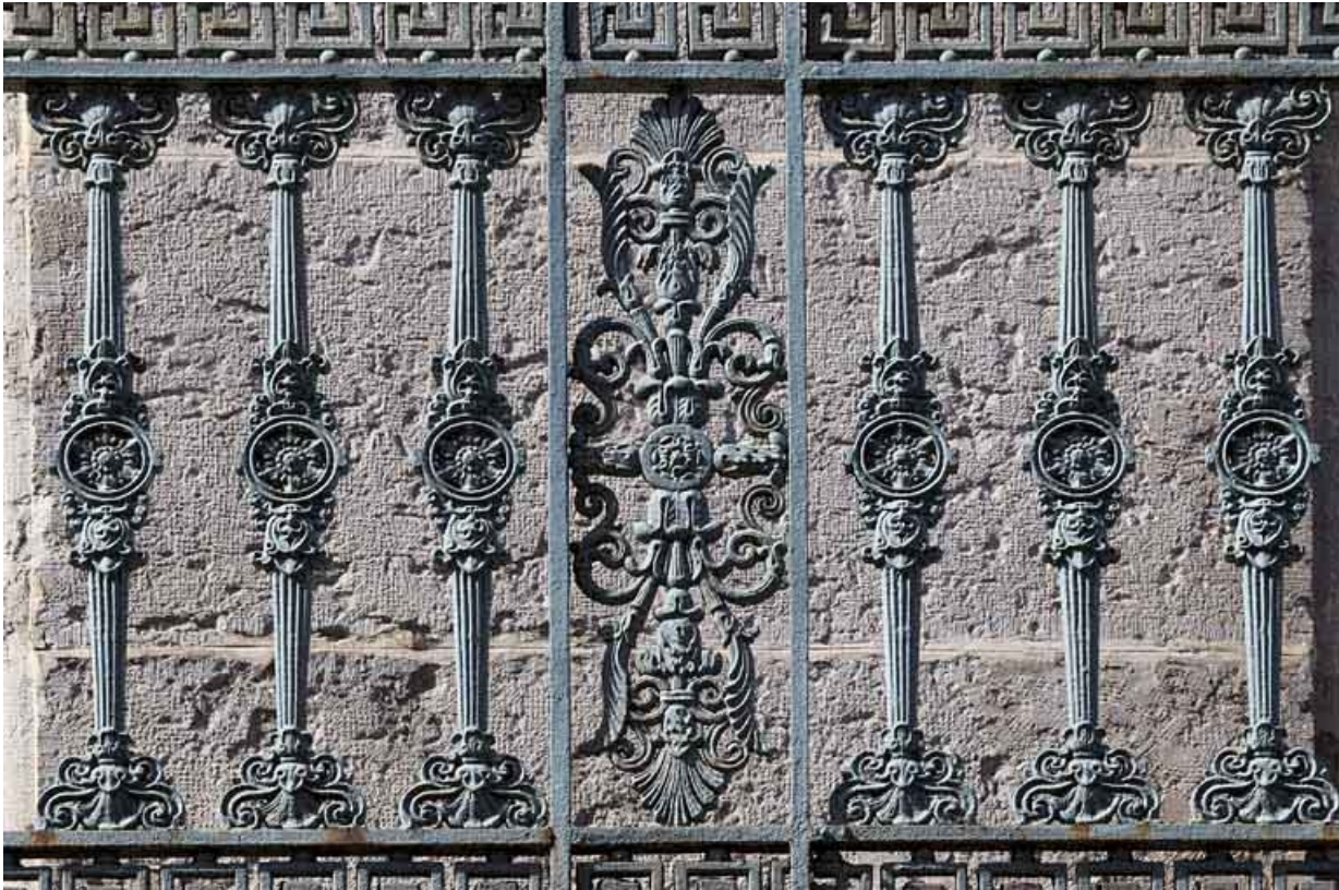
Façade antérieure, balcon filant : détail d'un décor du garde-corps en fonte.

25, Besançon, 32 rue Charles Nodier, lieudit : îlot Porteau