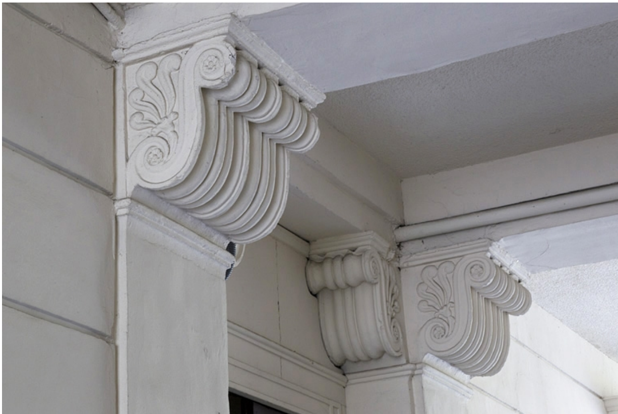
Passage cocher : détail d'une console.

25, Besançon, 32 rue Charles Nodier, lieudit : îlot Porteau