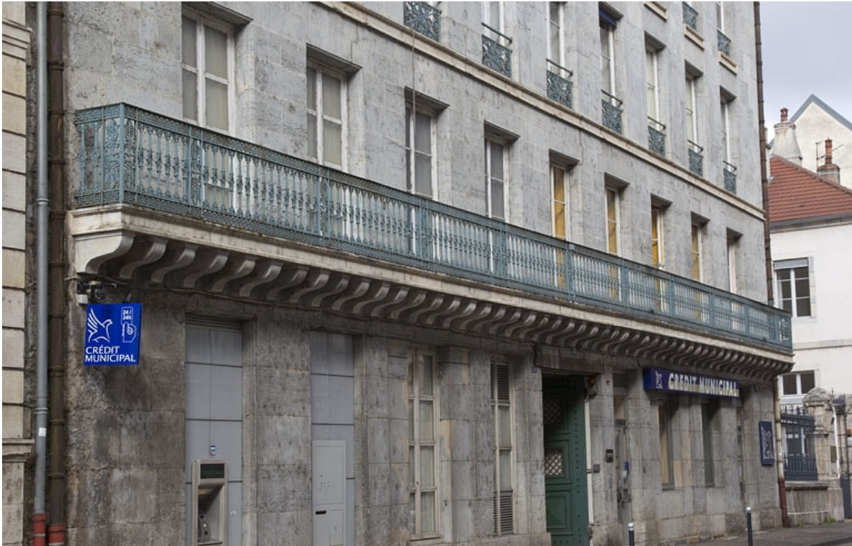
Façade antérieure, premier étage : vue d'ensemble du balcon filant.

25, Besançon, 32 rue Charles Nodier, lieudit : îlot Porteau