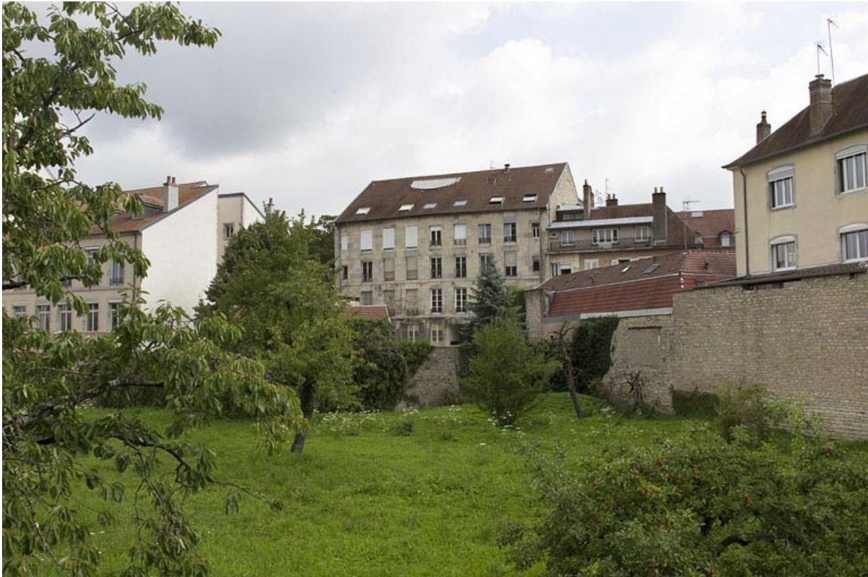
Vue d'ensemble éloignée de la façade postérieure : de trois quarts droit.

25, Besançon, 32 rue Charles Nodier, lieudit : îlot Porteau