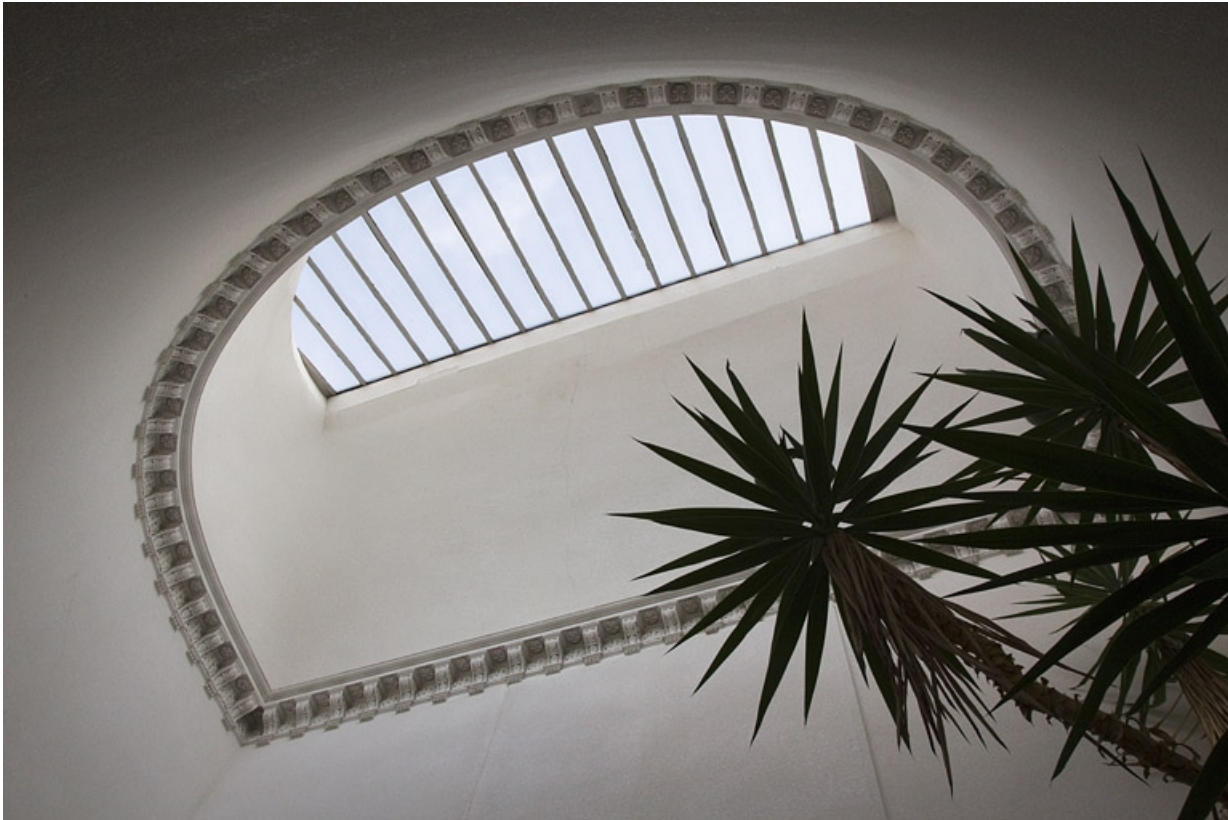
Intérieur : vue d'ensemble du plafond et de la verrière de la cage d'escalier.

25, Besançon, 32 rue Charles Nodier, lieudit : îlot Porteau