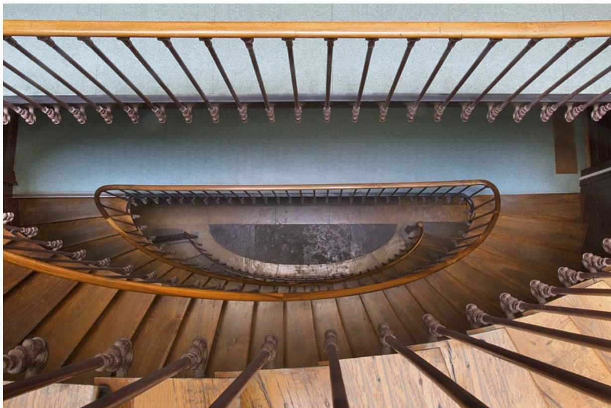
Intérieur, escalier : vue plongeante.

25, Besançon, 32 rue Charles Nodier, lieudit : îlot Porteau