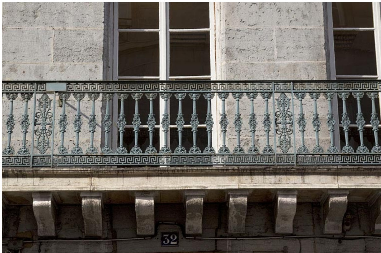
Façade antérieure, premier étage, balcon filant : détail du garde-corps.

25, Besançon, 32 rue Charles Nodier, lieudit : îlot Porteau