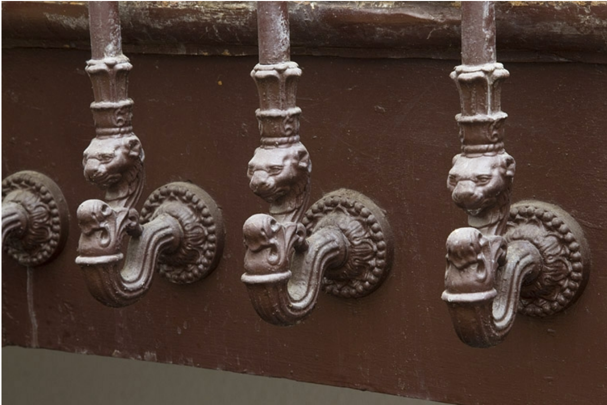
Intérieur, escalier : détail du décor à la base des barreaux de la rampe.

25, Besançon, 32 rue Charles Nodier, lieudit : îlot Porteau