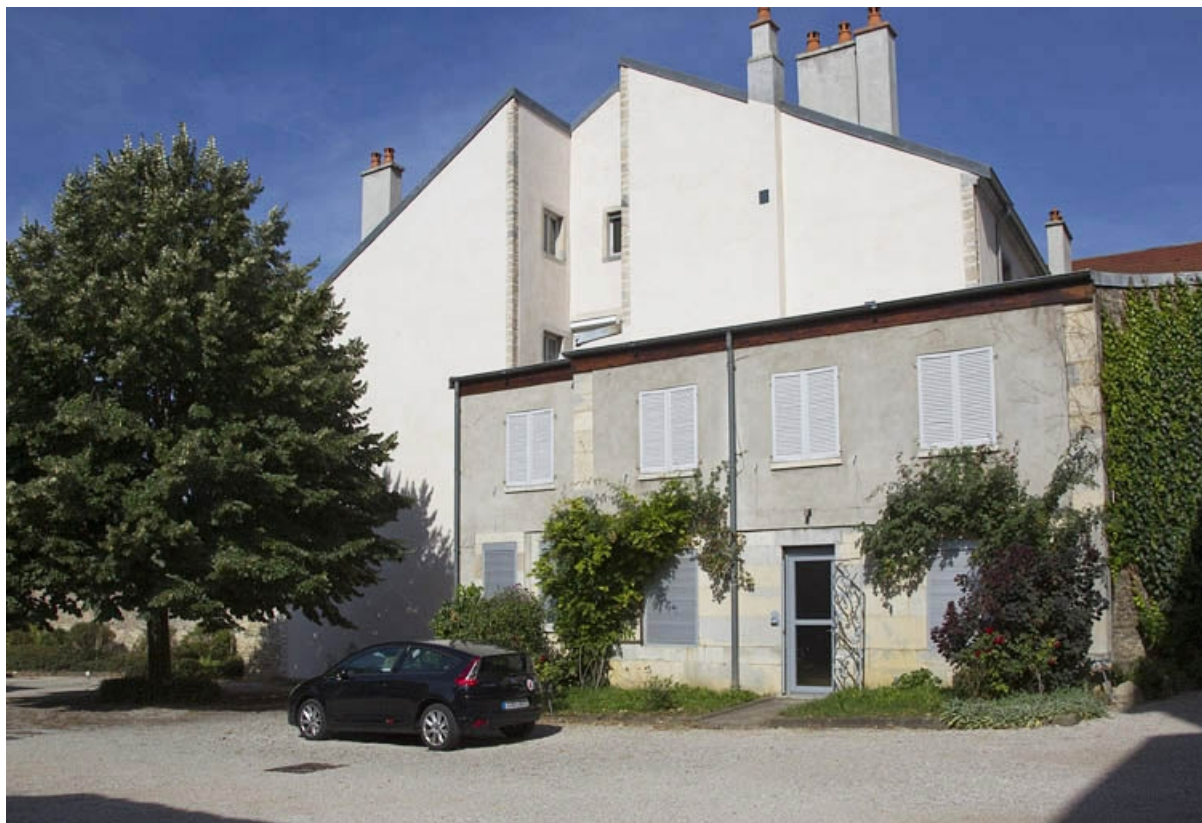
Bâtiment des anciennes écuries : vue d'ensemble, de trois quarts droit.

25, Besançon, 32 rue Charles Nodier, lieudit : îlot Porteau