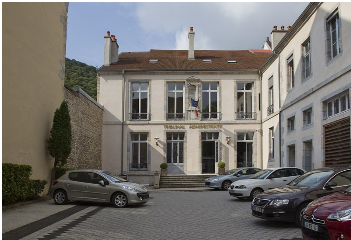
Vue d'ensemble du logis principal depuis l'entrée de la cour.

25, Besançon, 30 rue Charles Nodier, lieudit : îlot Porteau