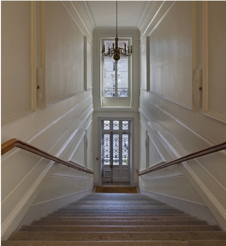
Intérieur : vue de l'escalier en direction de l'entrée.

25, Besançon, 30 rue Charles Nodier, lieudit : îlot Porteau