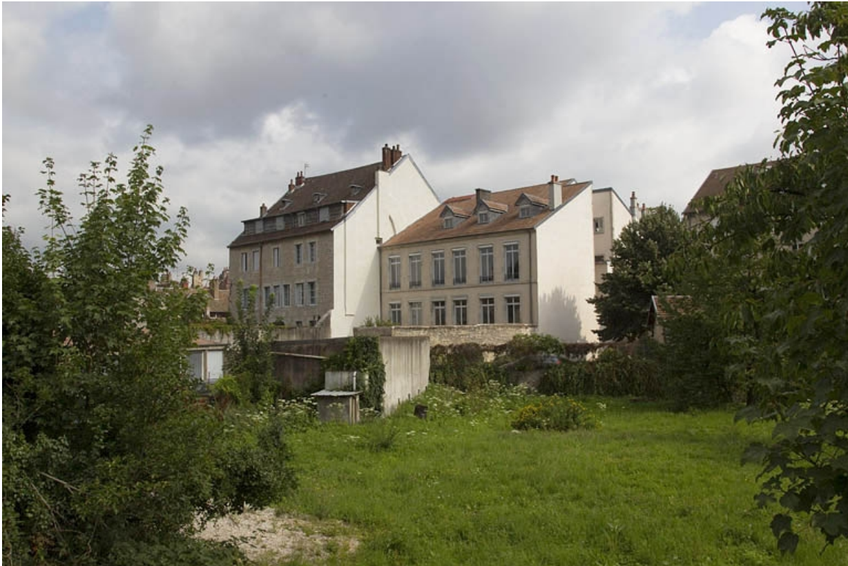
Façade postérieure depuis la parcelle voisine : de trois quarts droit, vue éloignée.

25, Besançon, 30 rue Charles Nodier, lieudit : îlot Porteau