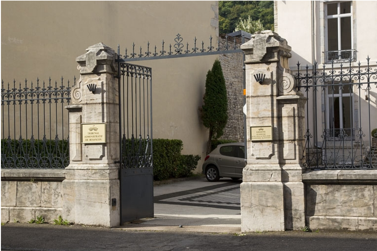
Vue d'ensemble du portail d'entrée de la cour.

25, Besançon, 30 rue Charles Nodier, lieudit : îlot Porteau