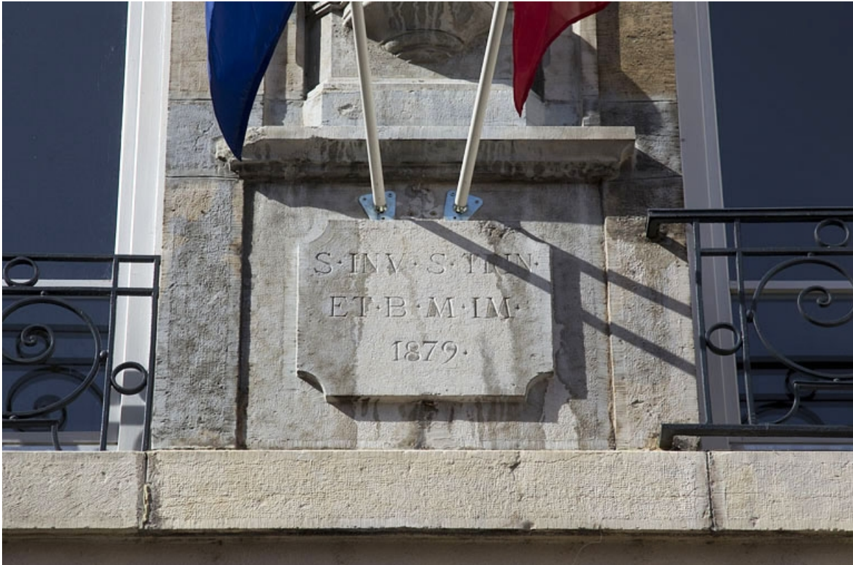
Façade antérieure, niche : détail de l'inscription et de la date.

25, Besançon, 30 rue Charles Nodier, lieudit : îlot Porteau