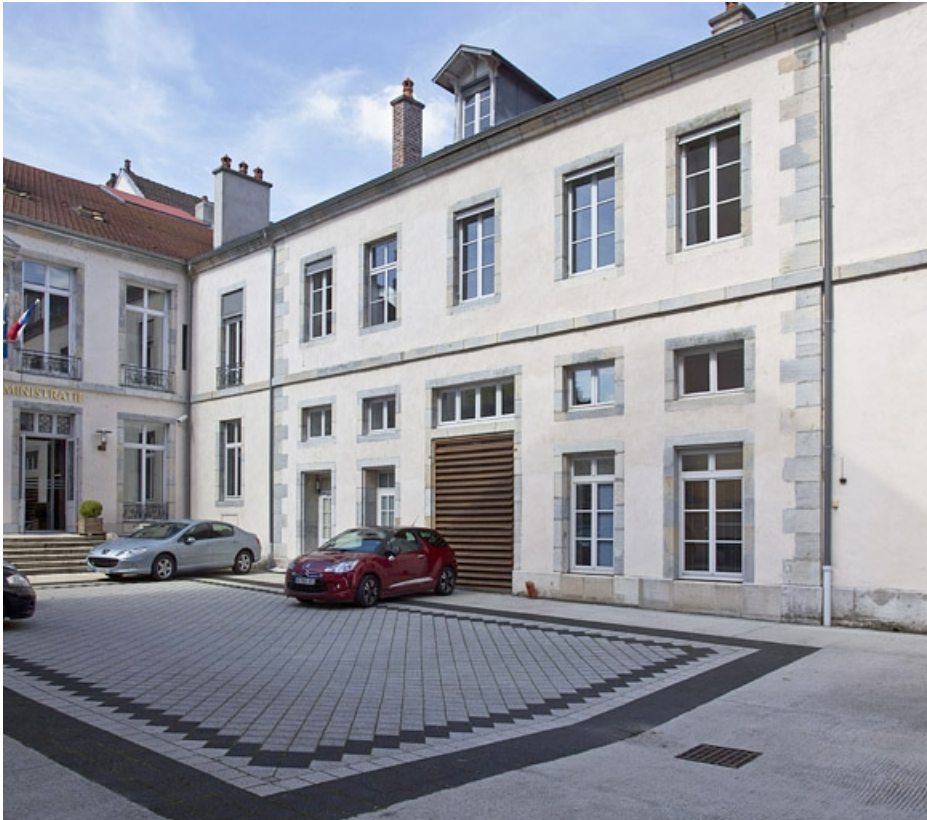
Aile droite sur cour : de trois quarts droit.

25, Besançon, 30 rue Charles Nodier, lieudit : îlot Porteau