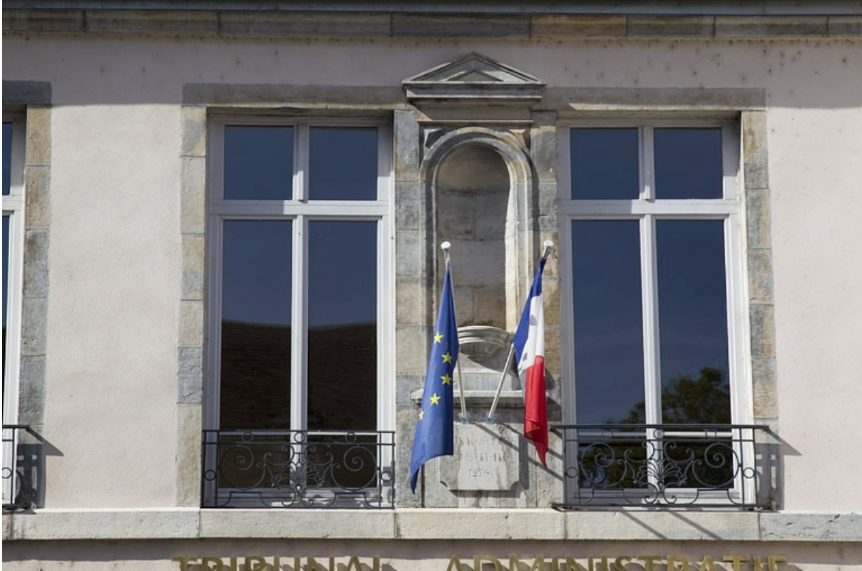
Façade antérieure : détail de la niche, vue rapprochée. 25, Besançon, 30 rue Charles Nodier, lieudit : îlot Porteau