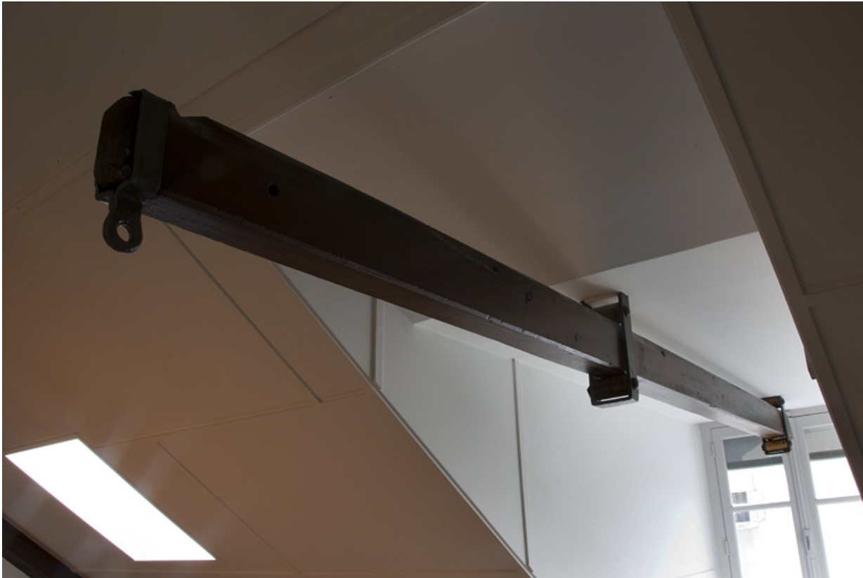
Aile droite, intérieur : détail d'un monte-charge.

25, Besançon, 30 rue Charles Nodier, lieudit : îlot Porteau