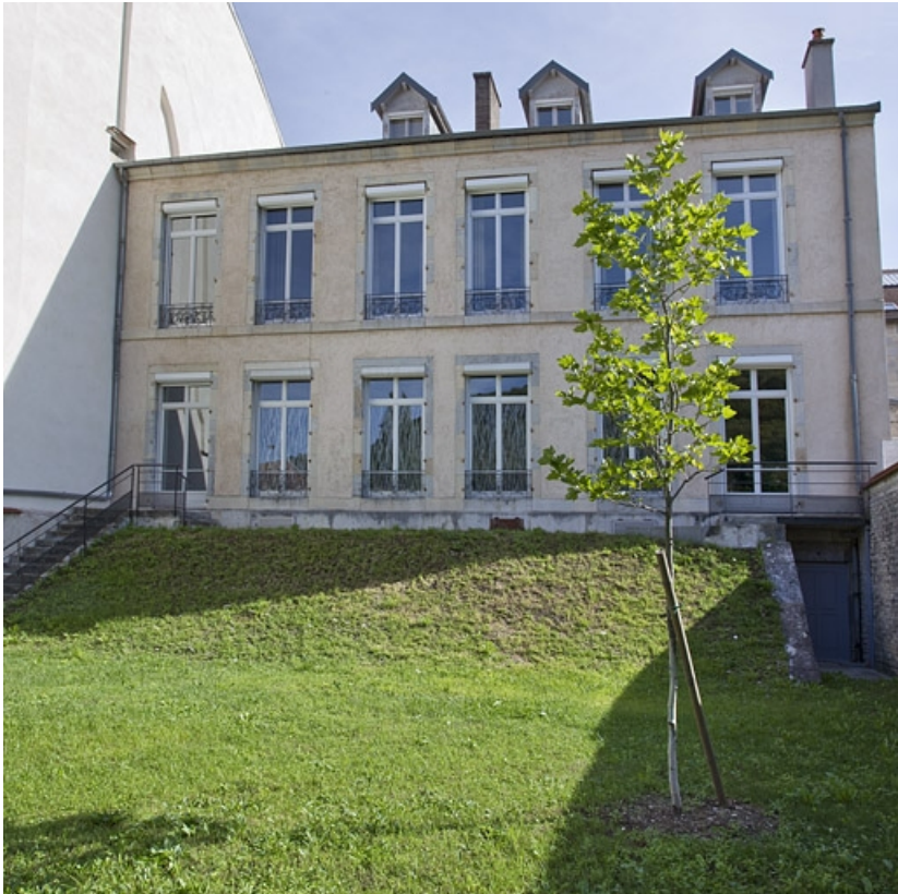
Façade postérieure : de face.

25, Besançon, 30 rue Charles Nodier, lieudit : îlot Porteau