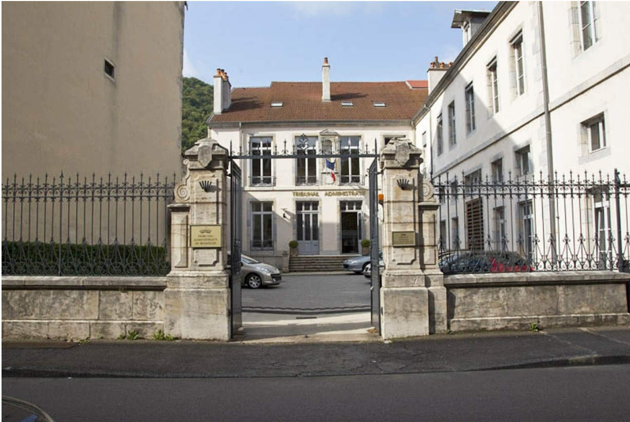
Vue d'ensemble, de face, depuis la rue.

25, Besançon, 30 rue Charles Nodier, lieudit : îlot Porteau