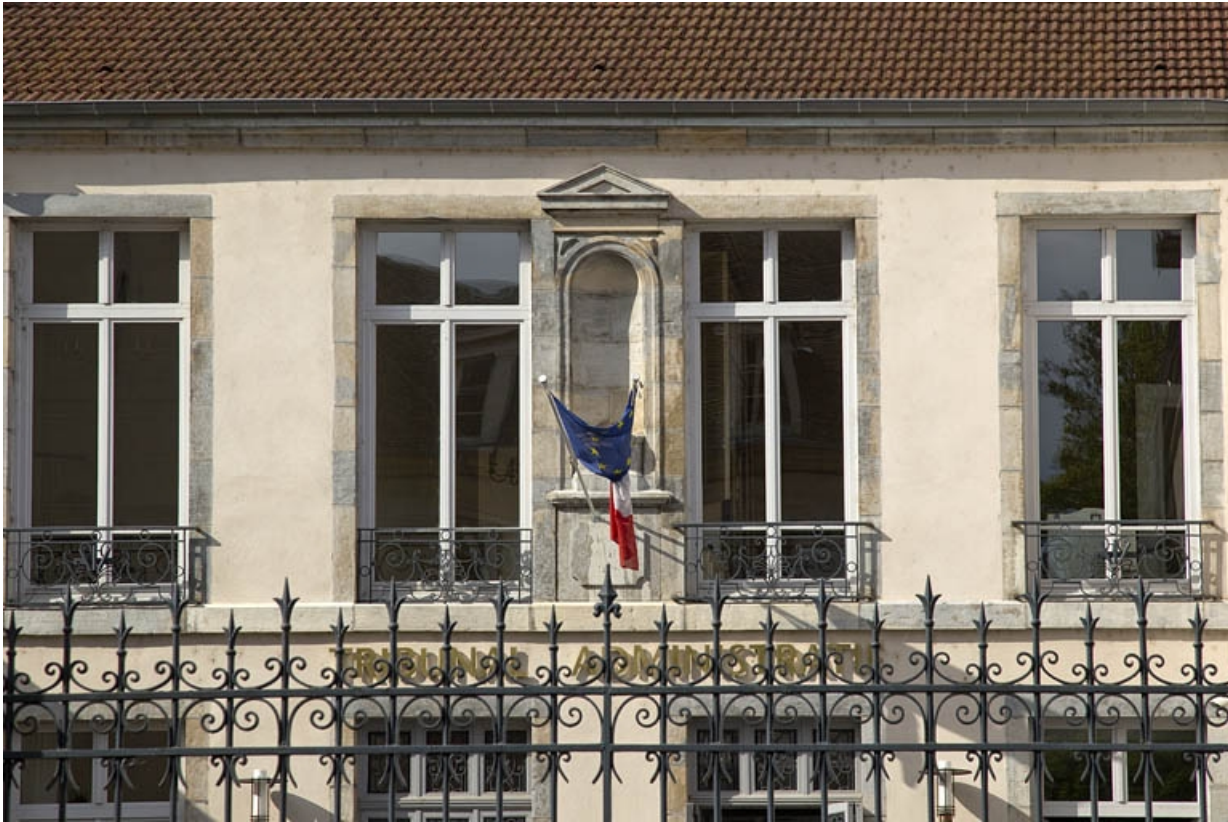
Façade antérieure : détail de la niche.

25, Besançon, 30 rue Charles Nodier, lieudit : îlot Porteau